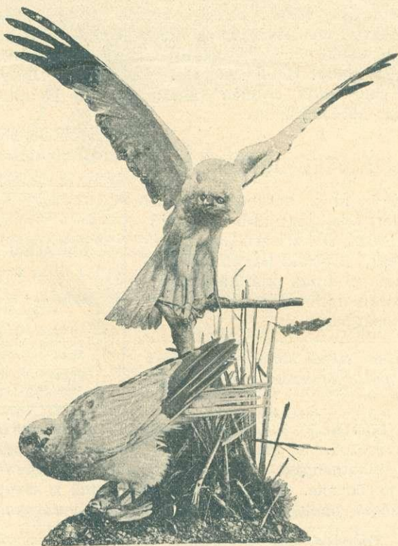
Öreg hím Circus cyaneus -ok.