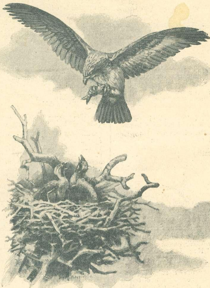
Halvágó-sas ( Pandion haliaetus .)

Bíbiczile ( Chaetusia gregaria , Pall.) a magyar orniszban.