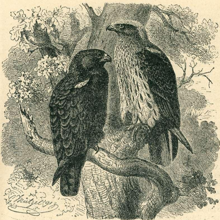
Törpe-sasok ( Nisaetus pennatus .)