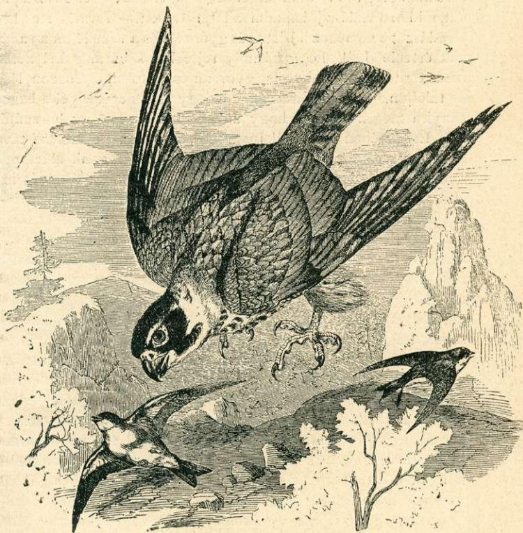
Fecskefogó sólyom ( Falco subbuteo .)