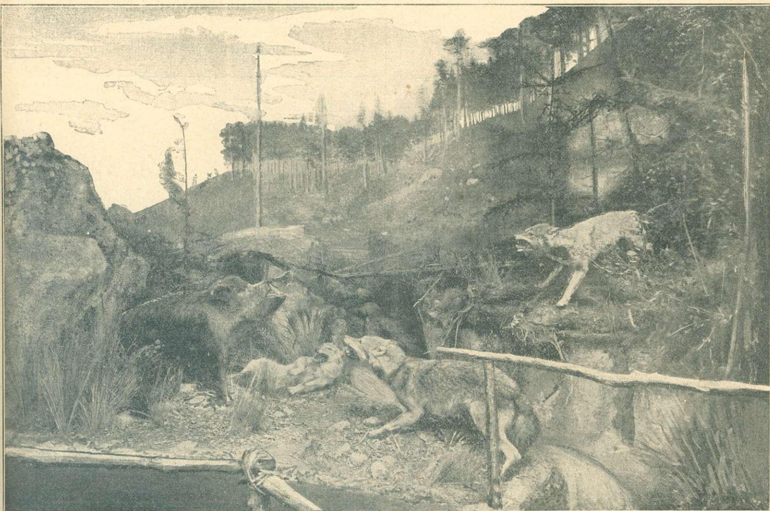
Részlet a párisi vadászati kiállításból: Farkasok támadják a vadkant.

Itt ugyan valamivel nagyobb alapterület áll