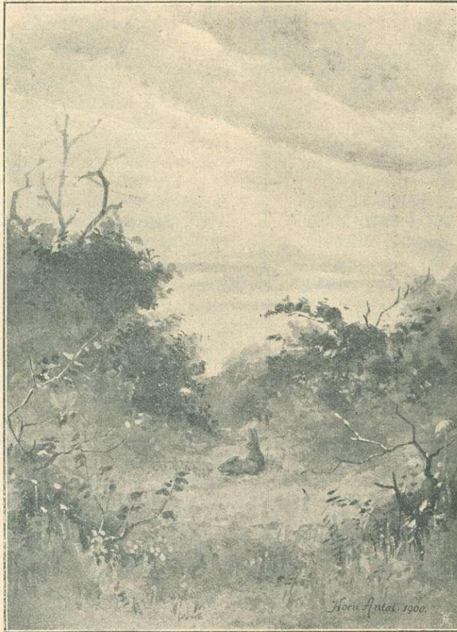
ALKONYATKOR. — Horn Antal rajza.

És ha el van feledve minden fájdalmatok, szíveteket egy fenséges ér-