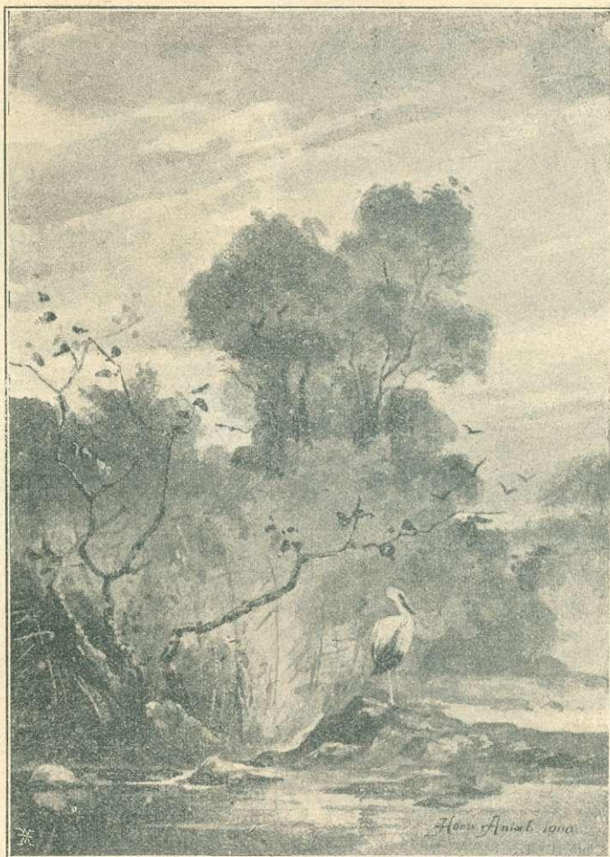
ÉBREDŐ NAP. — Horn Antal rajza.

csapott. De a következő pillanatban annál nagyobb lármában törtek ki, átkozva a gaz gyilkost. Még most sem lehetnek tőle biztonságban, pedig éppen most oly szorgalmasan építik a kicsiny kis fészket. Lövésem éppen akkor érte a gaz rablót, mikor a szegény kis madárkával akart tova surranni. Megbűnhődött érte. »Igen, megbűnhődött érte!« Sújja a kis hóvirág. »Megbűnhődött. Aminthogy bűnhődni kell még e földön az elkövetett rossz tettekért. És még hálát adhat az, aki itt bűnhődik, mert arra a túlvilágon közvetlen boldogság vár.« Mindenütt az élet, az öröm fogad. Itt egy kis katiczabogár futkos a levélen. Amott tarka pillangó szívja a virágok édes nedvét s mintha megrészegetne tőle, kábultan bukik le a földre, hogy a következő pillanatban tovaszállva, felkeressen egy másik virágot és ott újra szívja