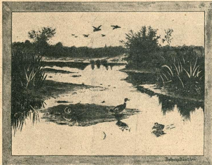
I. Tavaszi hangulat.