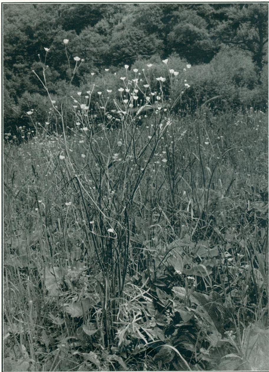
Rétiboglárka ( Ranunculus acer ) Volócon. Vajda László felvétele.

Manapság a nálunk erdön-mezőn élő boglárkákat alig ismerik, legfeljebb a természetjárók szedik szép sárga boglárvirágaikat. Hajdanában azonban az ember életében többféle jelentőségük volt, a régi füves orvosok több boglárkát gyógyszernek használtak. Az orvosi jelentőségű boglárkák között leghíresebb volt a rétiboglárka ( Ranunculus acer ). Magyar neve csak annyit árul el, hogy a réteken terem, latin neve ennél sokkal többet mond, egykori orvosi használatra utal. Acer magyarul erőset, csípőset jelent. A régiek azokat a növényeket és gyógyszereket nevezték