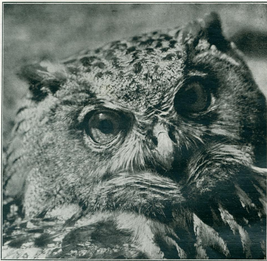
Az uhu arca. Az állatkerti VII. fényképpályázaton III. díjat nyert kép.

Az uhu — vagy »buhu« — nevének eredetéről Miskolczy Gáspár 1691-ben »Egy jeles vadkert« című természetrajzi munkájában ezt írja: »A fülesbagoly, melyet az ő szüntelen való bubu bűgásáért a Deákok Bubo-nak szoktak nevezni. — Szava rüt, éktelen és irtóztató, melyet midőn sokan hallanak, úgy ítélnék felőle (noha minden ok nélkül), hogy valami kedvetlen dolgot jelentsen.« Hangja változatos és néha annyira