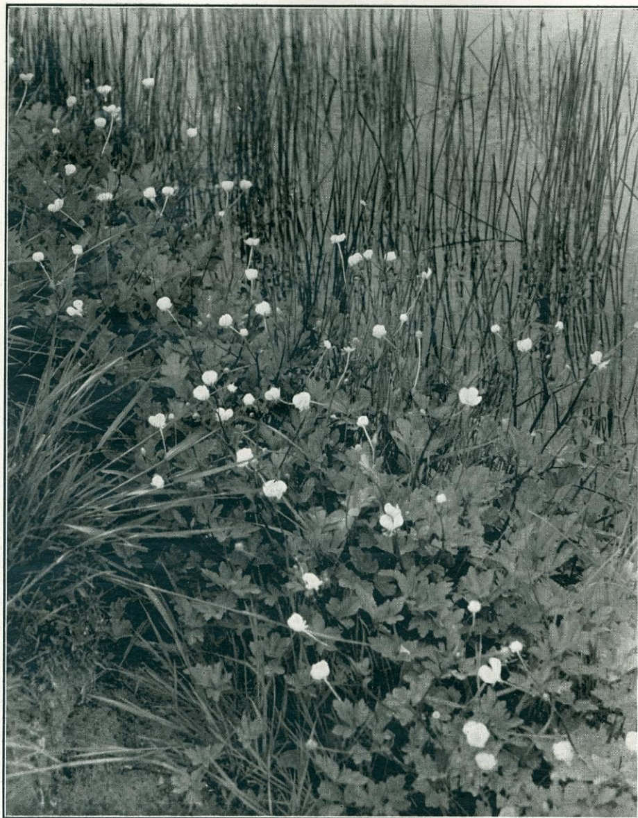
Kuszó-boglárka ( Ranunculus repens ) Fóton, ároksparton.

így, amelyek a bőrt izgatták, piros foltot okoztak, vagy hólyagot húztak rajta.