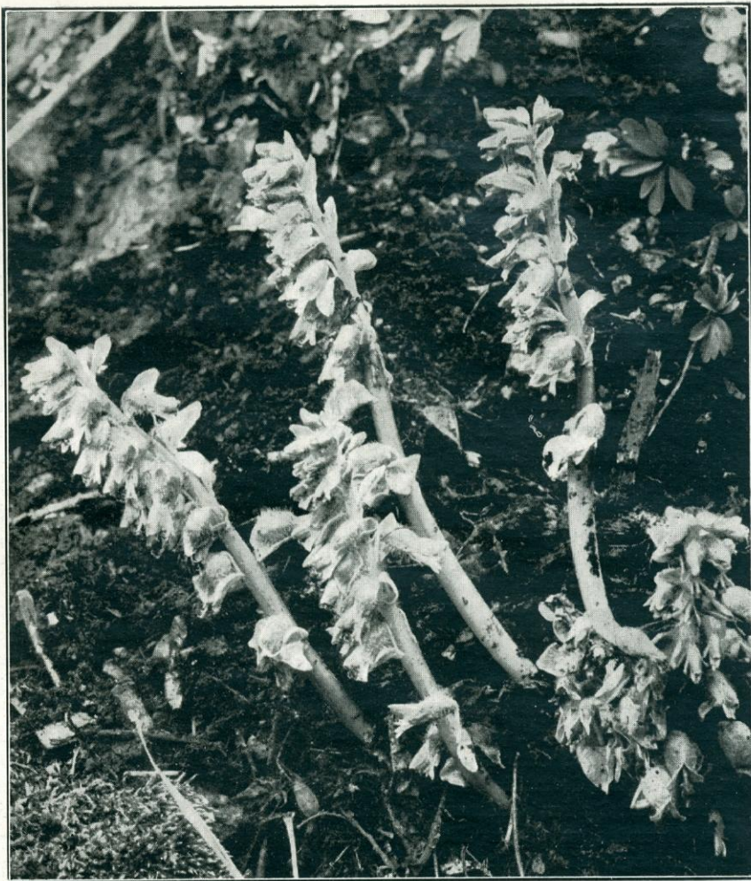
Erdeivicsor ( Lathraea squamaria ) a Vérteshegységben, a Fáni-völgyben. Vajda László felvétele.

Kíméld a virágot! Az embernek nem minden önkénytelen cselekedete dicsérendő. Egyes dolgokban mindenkinek felül kellene emelkednie önmagán, azokon a megdöglő cselekedetein, amelyek sem a maga, sem a köz szempontjából nem hasznosak. Ilyen egyebek között a virágok céltalan — sőt bátran mondhatjuk esztelen — tépése, szaggatása, tiprása. A természetkedvelő ember nem azért jár erdőn-mezőn, hogy rongálja, károsítsa, hanem úgy igyekezik a természetben gyönyörködni, úgy üdül fel a szabad ég alatt, hogy szépségét kíméli. Tudom, a virág szépsége, színe, alakja, tarkasága, illata nagy csábítás; ennek kevés ember tud ellenállni. Ahol védtelen virág nyílik, önkénytelenül nyúl érte és bizony leszakítja. Miért ne tegye? Milyen szép a mezei virágokból összeszedett bokréta! A baj csak az, hogy a legtöbb virág vajmi mulandó, s a bokréta elhervad, mielőtt vízbe állíthatnák. Nincsen ellenszenvesebb, botránkoztatóbb látvány, mint nyári ünnepén délután és estefelé a villamosok végállomásainak környéke és a hozzávezető utak. Mindenütt ezrével az eldobott, elhervadt, pusztuló virág! Miért kellett mind leszedni, letépni, elpusztítani? Csak azért, mert a legtöbb kiránduló nem gondol előre néhány órára, tépi a virágot, holott egy kis megfontolással megfékezne pusztítást okozó vágyát, csak arra kellene gondolnia, hogy a kirándulásnak egyszer vége, s az elhervadt virág