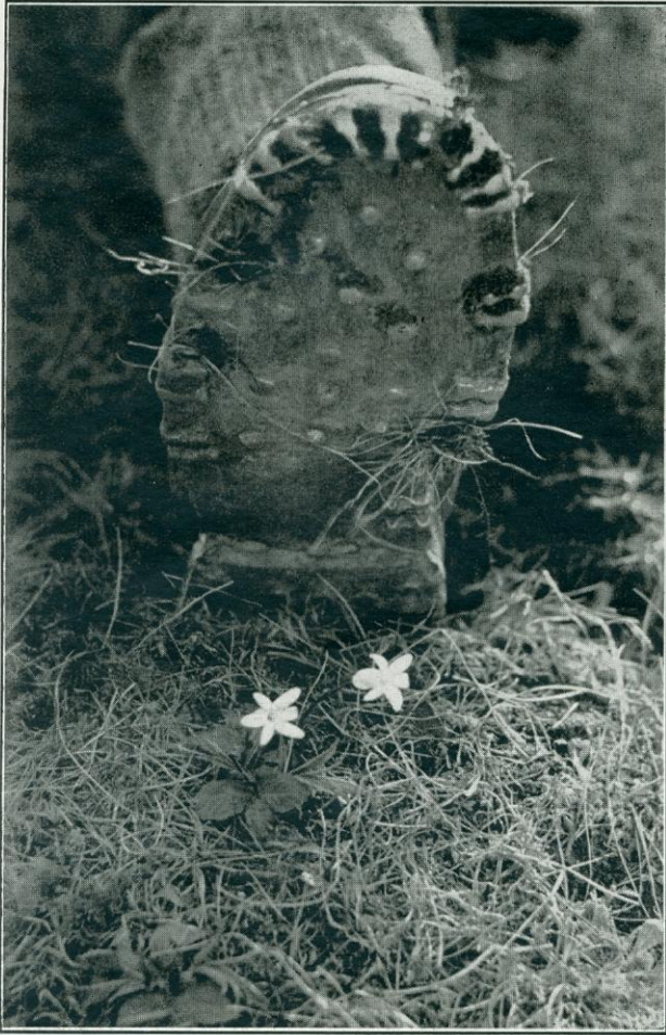
Ne tapossuk el a védtelen kis virág életét!

terhére válik; eldobja, mielőtt igazán gyönyörködhetett volna benne. Mennyivel szebb lenne a városok környéke, ha mindenki gondolna erre, mindenki kímélné a virágot és minden mezei virág sértetlenül fejezhetné be amúgysem hosszú életét. Ha más nem, ez az önző szempont is arra int, hogy kíméljük a virágot. Kíméljük akkor is, amikor lépünk — szeges hegymászó cipőnkkel ne tapossuk el a szegény kis virág védtelen életét, — akkor is, amikor vágyunk önkénytelen tépő mozdulatra lendíti kezünket. Aki a virágot igazán szereti, kint, a szabad természetben, a helyszínen gyönyörködik benne, ott élvezzi színét, alakját, illatát. Aki letépi, megöli; a gyilkosság pedig nem szeretet! Rapaics R.