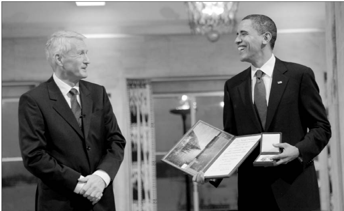
Barack Obama olyan ország vezetőjeként kapta a Nobel-békedíjat, amely hadban áll más államokkal.

Kaidát rábírn, hogy letegye a fegyvert. Nem cinizmus, hanem a történelem megértése annak elismerése, hogy néha szükség van erőre” – mondta az elnök, fájlalva, hogy a háború emberi tragédiákkal jár. Obama kiemelte: tartós béke nem lehet az egyének