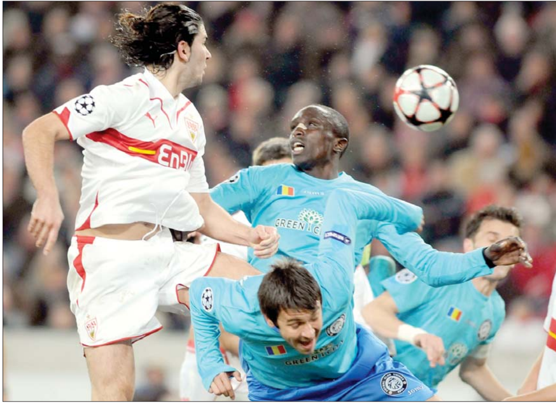
Az Urziceni védelme gyengének bizonyult Stuttgartban, a németek gyorsan megszórták a románok kapuját.

A Bajnokok Ligája nyolcadöntőiben tehát három spanyol (Barcelona, Real Madrid, Sevilla), három olasz (Internazionale, AC Milan, Fiorentina), három angol (Chelsea, Manchester