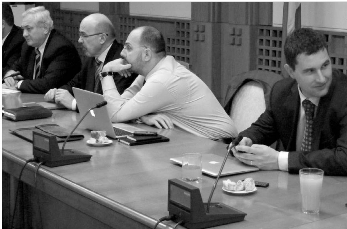
A Területi Elnökök Konzultatív Tanácsa továbbra is a liberálisok mellett tartaná az RMDSZ-t