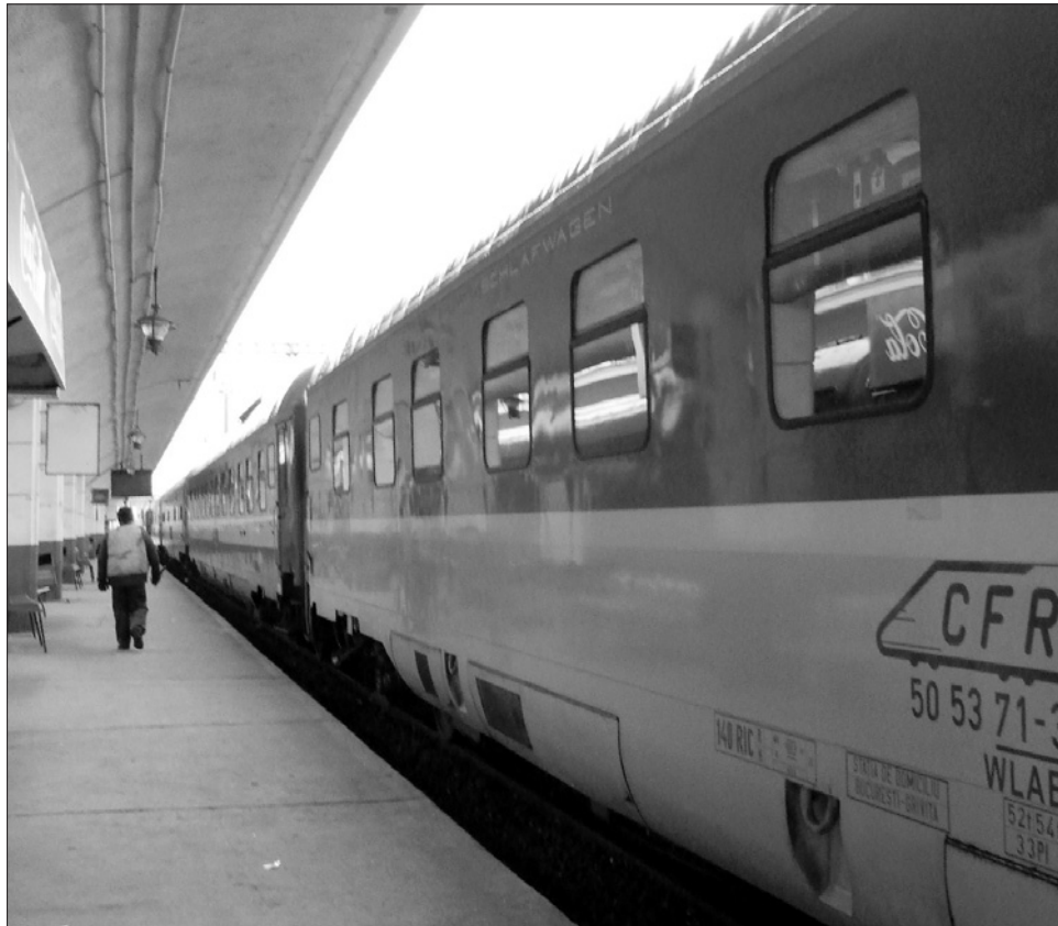
Meglepetés érheti azokat az utasokat, akik nem követik a menetrend módosításait

A román vasúti nemzetközi forgalom révén elérhető Budapest, Szófia, Tessaloniki, Kisinyov, Moszkva, Isztambul, München, Bécs és Belgrád, de ezeken az útszakaszokon több módosítás is történt. Kolozsvárt kedvően érinti a változtatás, egy nemzetközi – Budapestig közlekedő – járatral bővül az eddigi kínálat. Az új járat 15 óra 40 perckor indul Kolozsvárról és este 21 óra 10 perckor ér Budapestre. Így az eddigi megszokott három