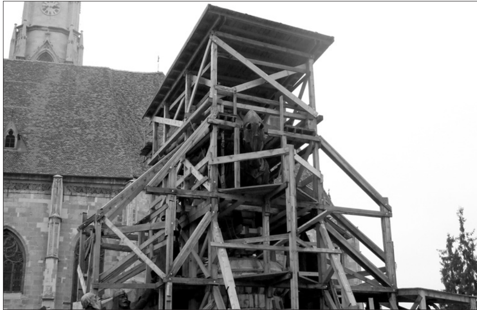
Jelenleg a szobor elemeit egymáshoz rögzítő csavarokat cserélik ki rozsdamentes acélsavarokra