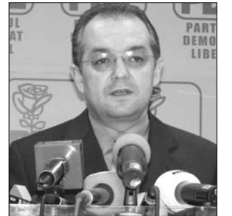
Emil Boc miniszterelnök

Lejárt tegnap a Nemzetközi Valutaalap (IMF) által haladékként adott végső határidő Románia 2010-es költségvetésének elfogadására, az ügyvezető Boc-kormány azonban nem volt hajlandó benyújtani a büdzsé tervezetét a parlamenthez. Emil Boc októberben bizalmatlansági indítvánnyal megbuktatott kormányfő szerdai indoklása szerint ez azért nem történt meg, mivel – bár tartalmilag már 95 százalékban készen állt volna a dokumentum – egy ilyen fontos döntés meghozatalának felelősségét egy új, teljes