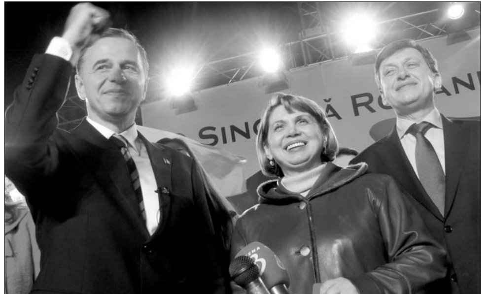
A mámor pillanatai. Mircea Geoană csak tizenegy órán át volt az ország államfője

Igencsak nagy hibának bizonyult Mircea Geoană és kampánycsapata részéről