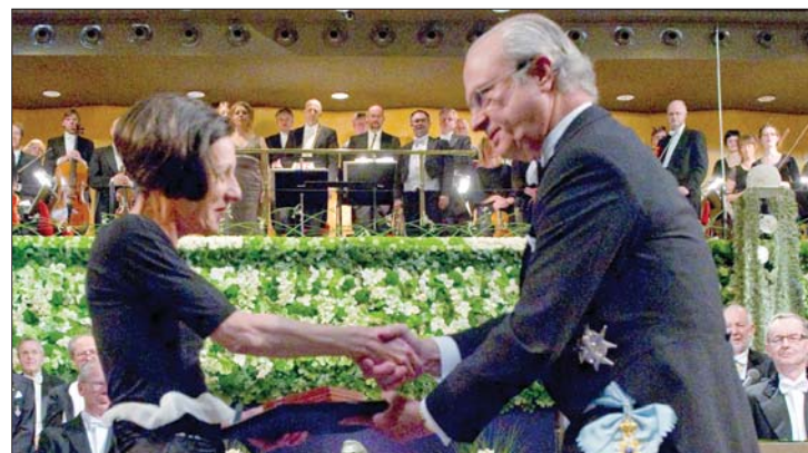
Herta Müllernek XVI. Károly Gusztáv svéd király gratulál

▶ Átvették tegnap elismeréseiket a stockholmi Nobel-bizottság idei díjazottjai, köztük a romániai születésű Herta Müller írónő. Barack Obama amerikai elnök az első olyan vezetőként vehette át a békedíjat Oslóban, akinek országa háborúban áll. 2. oldal ▶