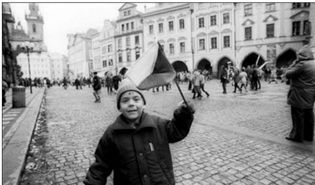
Prága a „bársonyos forradalom” napjaiban

ünnepén demonstrált Prágában az ellenzék. A Milos Jakes főtitkár vezette Csehszlovák Kommunista Párt mindazonáltal ragaszkodott a szocializmus dogmáihoz, az engedményeket elutasító politikához, s idegenkedve szemlélte a szovjet peresztrojkat. A rendszer túróképeségét feszegető 1988-as próbálkozások után 1989 hozta meg az áttörést, a két évtizede óhajtott rendszerváltozást. Az év folyamán több hatalmas megmozdulás rengette meg a kommunista berendezkedést, amely a csapások súlya alatt végül összeomlott. 1989. január 15-én a prágai Vencel téren tüntetők emlékeztek Jan Palachra, aki „prágai tavasz” leverése után tiltakozásul választotta az önkéntes tűzhalált. A többnapig tartó megmozdulások során a rendőrség brutálisan lépett fel: gumibotokkal, könnygázzal, rendőrkutyákkal támadt a tömegre, mint-