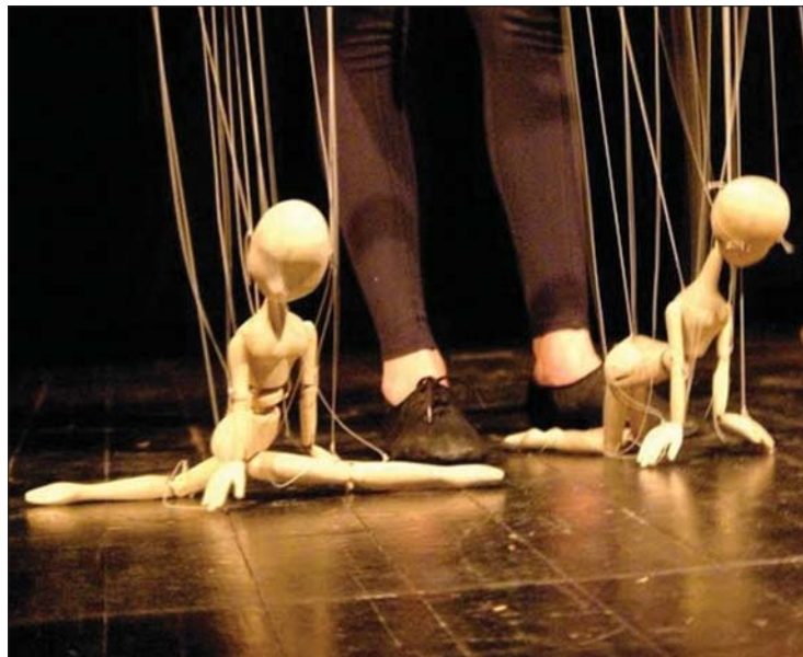
„Angyalka bábuk” az Adela Moldovan rendezte marionettjátékából

Adela Moldovan bábszínházi rendezővel a nemrégiben zajlott Bukaresti Nemzetközi Bábszínházi Fesztiválon beszélgettünk. Adela Moldovan Aradon játszott és rendezett, Románia egyik legjobb bábszínházában, a Marionett Színházban, aztán Magyarországon tanított marionettet a magyar bábosoknak. 2. oldal