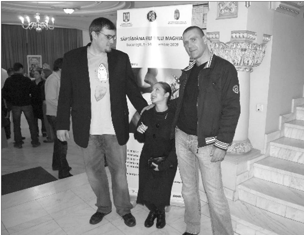
A magyar filmhét keretében bemutatott Nem vagyok a barátod című film három szereplője

G. Cs.: Nagyon kellett koncentrálni, nagyon kellett járjon az ember agya ahhoz, hogy ne hibázzon, hogy érvényes legyen, amit előad. A rendezőnek nagyon fontos volt, hogy ne tűnjön játéknak, hanem legyen nagyon hiteles, már-már életközeli.