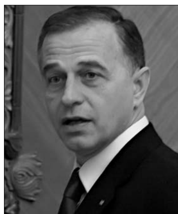
Mircea Geoană.

A Geoană tisztségben tartását ellenzők egyik szószólója Ioan Rus, a párt volt alelnöke, a szociáldemokraták úgynevezett erdélyi csoportosulásának a hangadója, akiaszerint a PSD jelenlegi vezetői egy részének, köztük a pártelnöknek, távoznia kéne. „Évek óta ugyanis csak a politikai intrikákkal törődtek, se ez nem vált a javunkra. Geoanának meg kellene válnia mandátumától, s esetleg újra megpályáznia a tisztséget, de