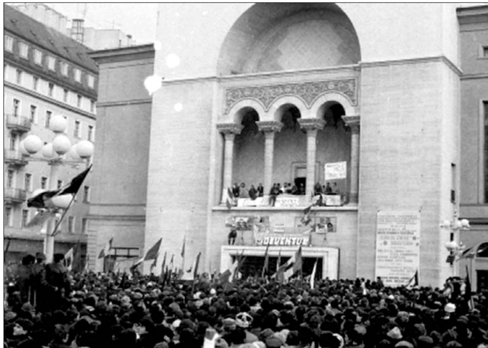
Az 1989. decemberi temesvári forradalmi események egyik fontos színtere: az Opera-tér

December 20-án a város üzemeiből a munkások tömött oszlopokban megindultak a városközpont felé, ahol mintegy 100 ezer ember gyűlt össze. A hadsereg nem lépett fel velük szemben, sőt, több katona fraternizált a tüntetőkkel. A helyszínrre több tábornok kíséretében megérkezett Constantin Dăscălescu miniszterelnök és Emil Bobu KB-titkár, akik tárgyalni kezdtek a tüntetőkkel, beleegyezve a bebörtönzöttek szabadon engedésébe, a fő követelést, Ceaușescu lemondását azonban nem fogadták el. A hadsereg egységeit visszavonták, egyrészt, hogy a haditechnika ne juthasson a felkelők kezébe, másrészt, hogy rendezzék soraikat. Estére már a városközpontot a felkelők ellenőrizték, akik megalakították a Román Demokratikus Frontot, és Temesvárt az „első kommunizmustól szabad várossá” nyilvánították. ◀