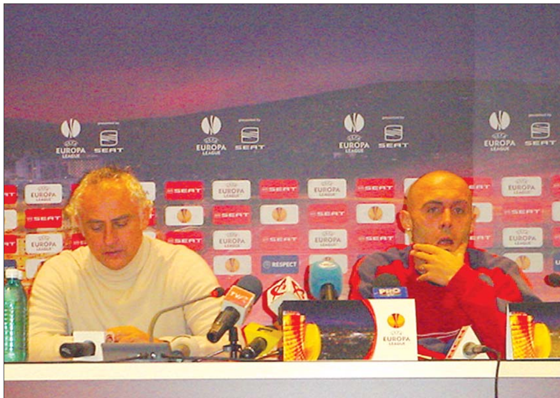
Mandrolini, a CFR edzője (balra) és Tony szeretnének győzelemmel búcsúzni a 2009-es esztendőről

A Steaua és a Temesvári FC holnap lép pályára. ◀