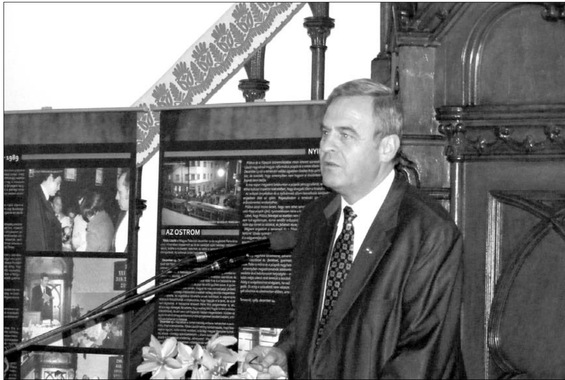
Tőkés László annak a templomnak a szószerkéről hirdette az ígéretét, ahol a forradalom idején szolgált

A rendezvény Tőkés László lelkipásztor áldásával és zárógondolataival ért véget. ◀