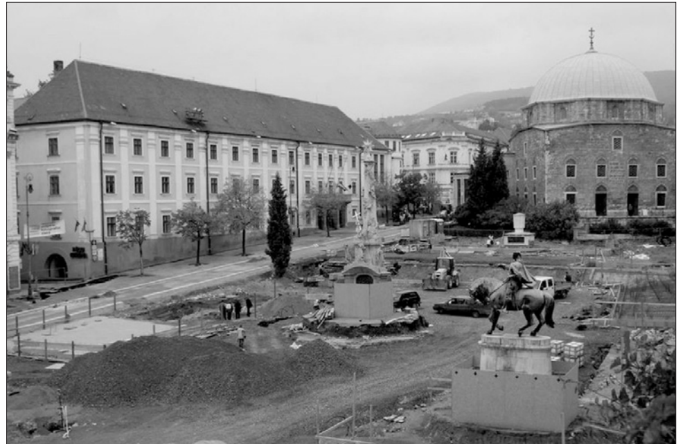
Építkezések Pécs Széchenyi terén, ahol január 10-én a megnyitó rendezvények lesznek

zat írója, a Pécs2010 program stratégiai főtanácsadója mondott le tisztségéről, majd még 2007 júniusában Freivogel Gábor építészeti igazgatót menesztették, ezután novemberben Méhes Márton művészeti igazgató mondott le, míg 2008 októberében Mészáros András főigazgatót mentették fel azonnali hatállyal tisztsége alól. Mindezek után 2009 januárjában Pécs polgármestere, Tasnádi Péter hunyt el, így az új polgármester megválasztásáig az alpolgármester kezébe került az irányítás. Ekkor fel erősödtek a félelmek, csúsztató határidőkről és felfüggesztett munkáról lehetett hallani, s csak akkor nyugodott meg mindenki egy kicsit, amikor ez év november 12-én az Európai Bizottság Melina Mercouri-díjjal tüntette ki Pécsét az EKF-programjainak sikeres előkészítéséért.