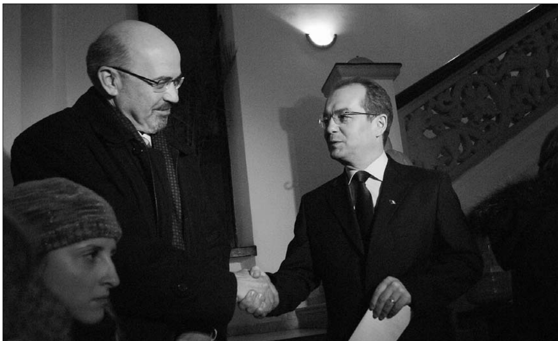
Markó Béla és Emil Boc megegyeztek. A liberálisokat is a kormányba várják, de a PNL kitar a PSD mellett.

„Nem látom realitását annak, hogy a Nemzeti Liberális Párt (PNL) és a Szociáldemokrata Párt (PSD) oldalán a korábbi többségben részt véve alkotmányos kormánykoalíciót az RMDSZ” – nyilatkozta tegnap este lapunknak Markó Béla. Az RMDSZ elnöke a mai cotroceni-i konzultációt megelőzően tegnap délután találkozott Emil Boc demokrata-liberális pártelnökkel. Mint az ÚMSZ-nek elmondta, az RMDSZ képviselői és szenátorai már elkezdtek dolgozni egy kormányprogram-javaslaton, amelyet a majdani demokrata-liberális kormányfőjelölt programjához csatolnak. „Az alakulataink közötti együttműködési szerződés nagyvonalakban már elkészült, amit természetesen módosítanunk kell majd abban az esetben, ha a Nemzeti Liberális Párt (PNL) is csatlakozik hozzánk. Személy szerint továbbra is fenntartom,