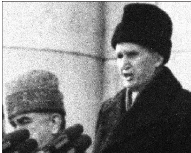
Nicolae Ceaușescu 1989. december 22-én, az RKP KB erkélyén

1989. december 21-én Bukarestben a lakosság másképpen döntött. A nagygyűlés résztvevői belefojtották a szót Ceaușescuba, s a Szekuritáté