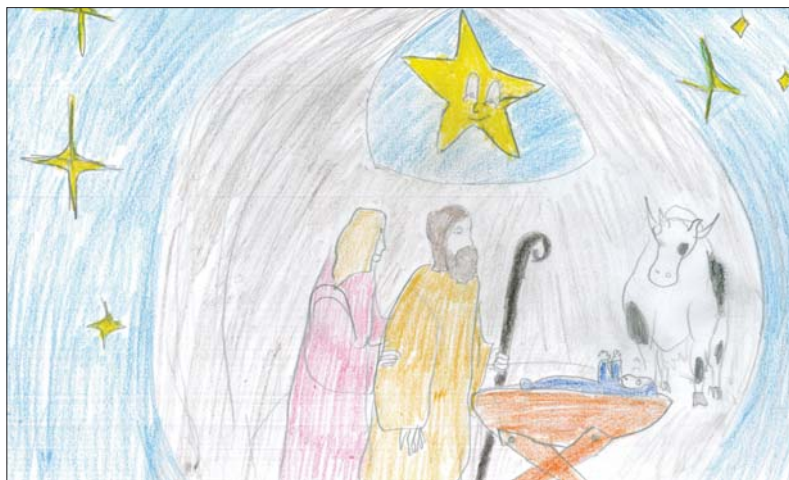
Hubbes Péter rajza

A kis csillag hallgatott. Még kisebbnek érezte magát, mint korábban.