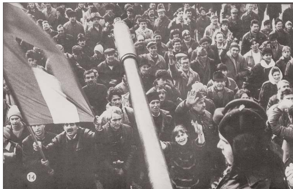
Egy tank tetején állók és nézem a kétezernyi ünneplő embert. Mikor meghallottuk, hogy kivégezték Ceausescuékát, rohantunk a térre...

rangjukat, az egyik szekus-, a másik rendőregyenruhát viselt. S az ajtóban ott állt egy idősebb harmadik, az vezette az autójukat. A rangosabbak elmentek megkeresni két saját halottjukat a hidegházban, s azalatt a kórház körülbelül 60 alkalmazottja körülvette a hallban maradt szekust, s vádolták azért a bestiális lövöldözésért, amit véghezvittek. Ő azzal igazolta az eljárást, hogy parancsot kaptak a tüntetés feloszlatására. Erre mi: A pizzaszám ember és a két éves gyermek nem le-