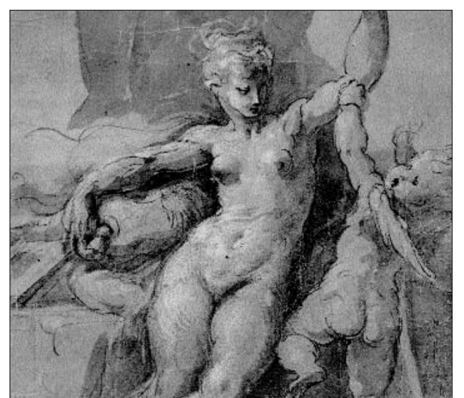
Francesco Parmigianino Venus lefegyverzi Amort című grafikája

Parmigianino (1503–1540), azaz „a kis parmai” nevét a magyarországi közönség alig ismeri, pedig a művész két évtizedes pályafutása mély nyomot hagyott az itáliai művészet emlékezetében, s azon túl is. A 19. században azonban a manierizmus kedvezőtlen megítélésével együtt Parmigianino neve is feledésbe merült, így a 20. század elején szinte újra fel kellett fedezni az eredetileg Girolamo Francesco Maria Mazzola néven született művészt. A felfedezésért a budapesti Szépművészeti Múzeumnak azonban csak a saját féltve őrzött grafikai gyűjteményének ajtajáig kellett mennie. „Szerencse a szerencsétlenségben, hogy a Szépművészeti gyűjteményében Parmigianino nem kevesebb, mint húsz saját kezű rajza található, tizenhét rézkarcából pedig az intézmény tizenhatot őriz, köztük néhány kivételes, egyedülálló levonatot is. Ha mindez nem is elegendő a festő pályájának valamennyi időszakán átívelő monografikus ki-