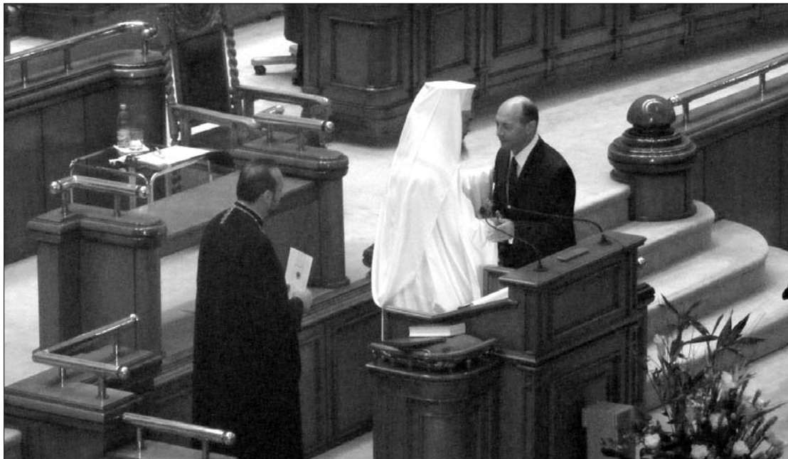
Dániel pátriárka az eskütétel után megáldotta az államfő újabb ötéves mandátumát

Az 1989-es forradalom utáni harmadik államelnök hangsúlyozta, úgy gondolja, eljött a 'prokoalíciók' ideje, s szerinte a