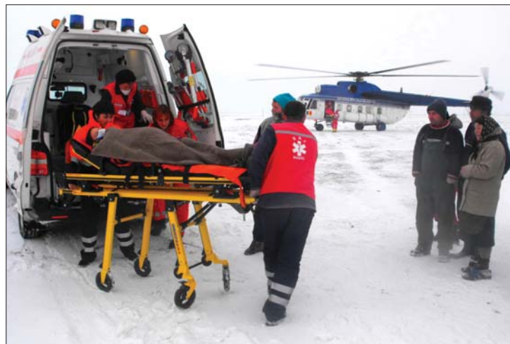
A SMURD helikoptereinek sokszor kellett felszállniuk

▶ Tizenegyen haltak meg az utóbbi napok rendkívüli időjárása miatt fagyhalálban, és országszerte sokan fordultak fagyásból származó sérülésekkel orvoshoz. Szakemberek szerint a magányosan élő idős emberek közül sokan nem tudnak megfelelően fűteni, rendkívüli hidegben pedig gyorsan bekövetkezhet a tragédia, ezért arra figyelmeztetnek: mindenki fokozottan figyeljen oda környezetére, nyújtson segítséget a rászorulóknak. Az Egészségügyi Minisztérium közleményben figyelmeztetett arra, hogy a megfelelő táplálkozás hiánya, a mértéktelen alkoholfogyasztás vagy a nem