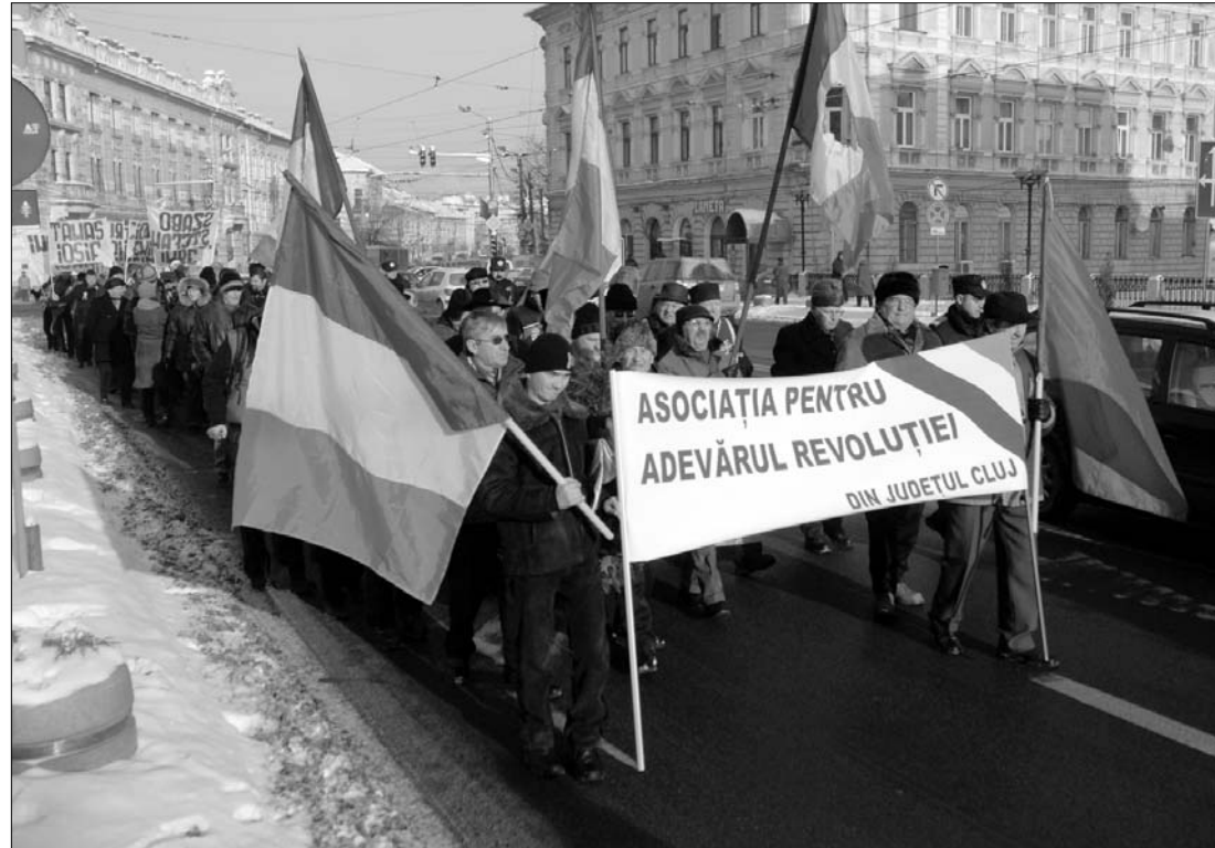
A kolozsvári emlékezők a Horea úton végigvonuló nehézgépgyári munkások útvonalát követték

házának együttes ülésén a képviselők és a szenátorok egy perc néma csenddel adóztak a hősök emléke előtt. Bukarestben több kiállítást is szerveztek az 1989-es romániai rendszerváltásról, amely Kelet-Európában példátlanul, vérontással zajlott le. Az igazságszolgáltatás mai napig sem tisztázta, kik lőttek a tüntetőkbe, a vizsgálatok elakadtak a katonai ügyészségen. Csak a temesvári felkelés ügyében született jogerős ítélet, amelynek ételmében Victor Athanasie Stănculescu és Mihai Chițac táborno- kokat jogerősen, külön-külön 15 év szabadságvesztésre ítélték. ◀