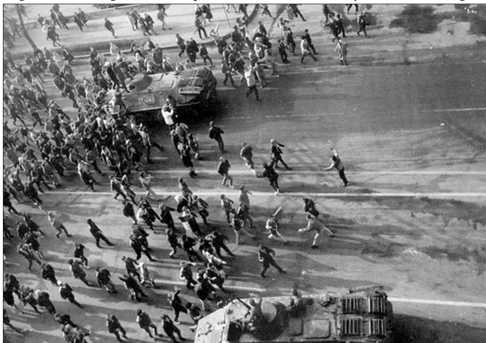
Bukarest, 1989. december 22.: a győzelem első pillanatai

Ceaușescu, a felesége, az RKP Politikai Végrehajtó Bizottságának tagjai a pártszékházban maradtak, és elkezdtek a megtorlás megszervezését. Ahogy teltek az órák, egyre több ember ment ki az utcára. Hamarosan a tüntetők – szervezetlenül és fegyvertelenül – szembekerültek a katonákkal, a terrorelhárító egység pajzsos tagjaival, a Szekuritáté egyenruhás és polgári ruhás embereivel, a mögöttük felsorakozó tankokkal és csapatszallító járművekkel. A tömegre több épületből, mellékutcából és tankok segítségével támadtak. A tüntetők vízágyúkkal lötték a tömeget, közben a rendőrség ütlegelte és letartóztatta a tüntetőket. Sok til-