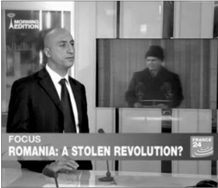
A franciák szerint manipulálták a médiában közölt '89-es eseményeket

A világot médiaszennyezésként bejártó kép- és hanganyag hatalmas visszhangot keltett minden nyugat-európai média fórumon, főleg amiatt, hogy illeszkedett a pekingi Tiananmen téri lázadás és a Berlińi fal leomlása által teremtett közönségvárásokba. A France 24 tévé megszólaltatta Christian Delporte médiatörténészt, aki úgy értelmezte, hogy a temesvári eseményekkel induló romániai forradalom azért tudott