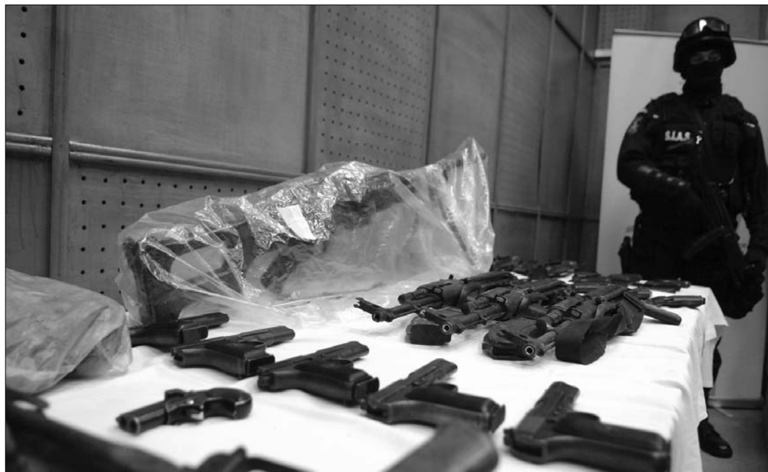
A Szervezett Bűnözés és Terrorizmus Elleni Főosztály bemutatta a sajtónak a visszaszerzett fegyvereket

kezükhöz” hollandiai végcélal. Mint ismeretes, a hatvankét katonai kézfegyver és egyéb felszerelés eltűnését 2009. január 28-án fedezték fel a ciorogárlai fegyverraktárban, a vizsgálatok kiderítették, hogy a 34 500 lej értékű lopás korábban történt, és hogy lőszer nem tűnt el a raktárból. A hatóságok nagy erővel kezdték keresni a fegyvereket, a katonai ügyészség nagyszabású vizsgálatot indított a fegyverlopás körülményeinek kiderítésére. Az ügyben több mint 140 személyt hallgattak ki, majd 2009 márciusában nyolc katonára ellen bűnvádi eljárást indítottak. Az azóta vizsgálati fogságban levő gyanúsítottak kérésére a bukaresti területi katonai törvényszék úgy döntött, hogy a nyolc személy szabadlábon védekezhet, a gyanúsítottak pedig távozhattak a rahovai börtönből. ◀