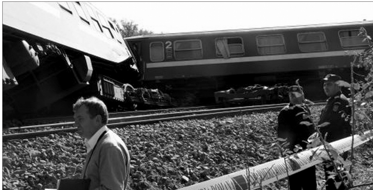
Mindegy napos látvány a román államvasútnál? A Bukarest-Craiova-Temesvár-vonalon közlekedő gyorsvonat szeptember 21-én siklott ki

A közlekedési tárca friss adatai szerint az idei évben eddig 89 olyan gépkocsi szenvedett balesetet, amelyek vezetője figyelmen kívül hagyta a vasúti átkelőket jelző figyelmeztetéseket. A szerencsétlenségek 33 halottat és 30 sebesültet követeltek. ◀