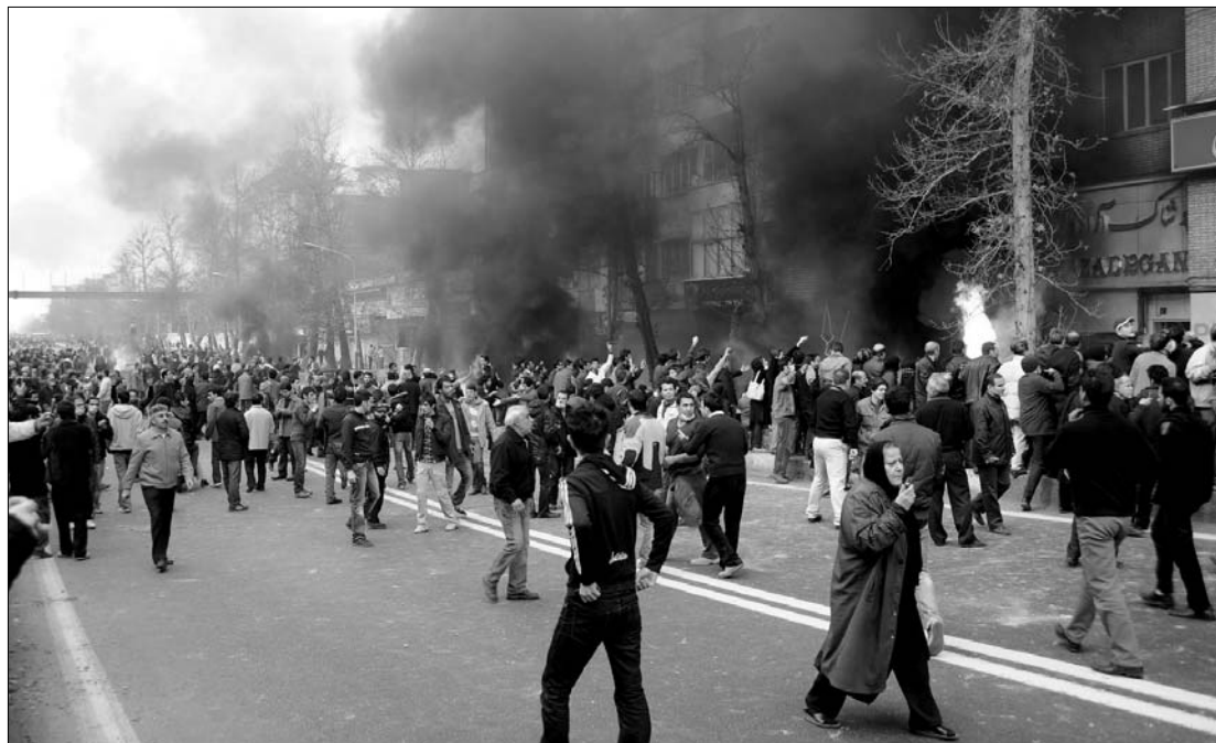
Az iráni fővárosra vonatkozóan legalább öt halálos áldozatról számolt be vasárnap este a nemzetközi sajtó.

Mehdi Karubi ellenzéki vezető bírálta tegnap az ország hatóságait amiatt, hogy a biztonsági erők megöltek ártatlan embereket – jelentette a Desarasz című reformer honlap. „Oda jutott ez a vallási