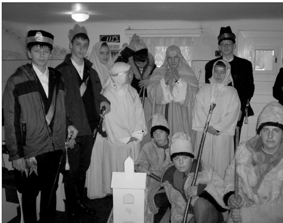
Pásztorok, szent család és hírnökök: hagyományt örökítenek meg az alsíkai fiatalok