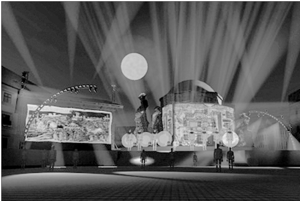
Látványterv a Nagy Lajos magyar király által 1367-ben alapított pécsi egyetemről

Ismét fontos mérföldkőhöz érkezett a Pécs2010 Európa Kulturális Fővárosa program. A köztér és parkok újjáélesztése névre keresztelt kulcsprojekt keretein belül ugyanis újabb teret, sétányt, sőt egy egész városrészt, a megszüpített keleti részt, „adták vissza” a lakosságnak. Az ünnepélyes megnyitónak helyet adó Széchenyi tér felújítása