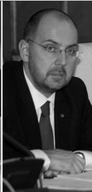
Emil Boc kuporgat, Markó Béla fizetésből él, Kelemen Hunor a legszegényebb kormánytag

gyat. Van ugyanakkor bankszámláin 158 ezer lejt, ami alig haladja meg az összes tavalyi jövedelmét, amelyet képviselőként és az RMDSZ ügyvezetőjeként kapott (72 + 67 ezer lejt). Nyilatkozatában megemlíti, hogy a Medianet Kft., azaz a Transindex részvényese, a Communitas Alapítvány, a Romániai Magyar Újságírószövetség tagja. Hozzá hasonló helyzetben van Gabriel Sandu távközlési miniszter is, aki szintén nem rendelkezik ingatlanokkal, bankszámlákkal és autókkal, de részesedése van egy cégben.