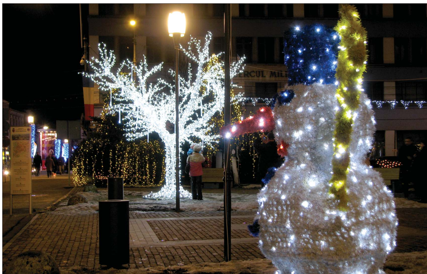
Ünnepi fényárban Kolozsvár központja. A városgazdák szerint a díszkivilágítás nem terheli a költségvetést, hanem szponzorok állják