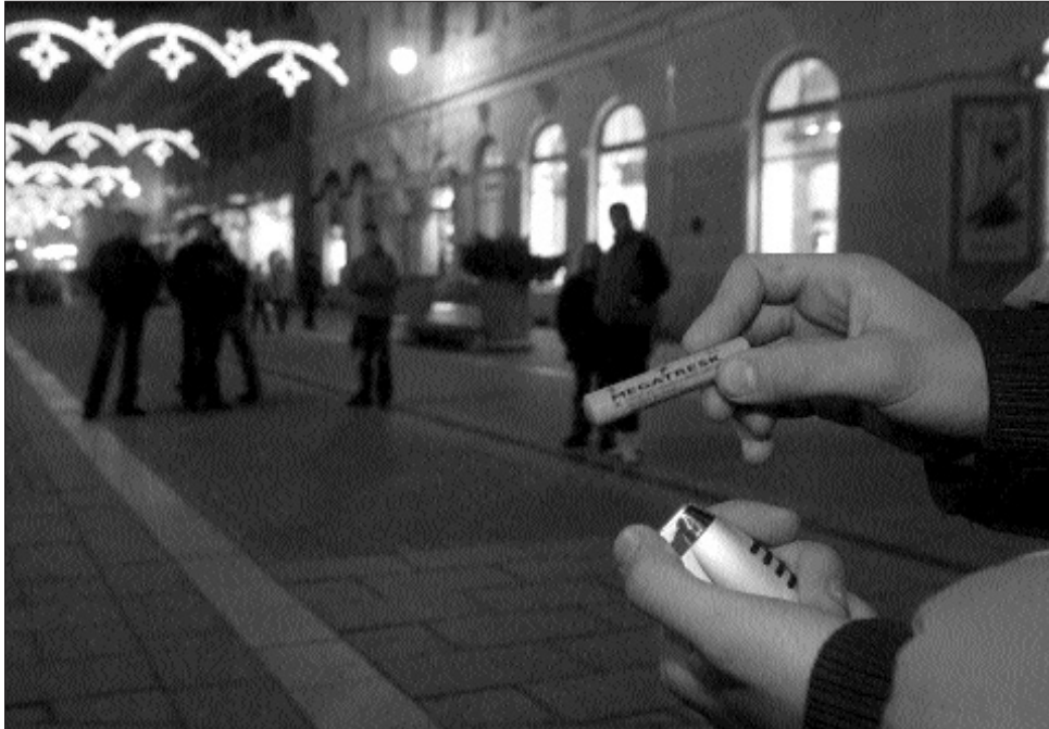
Sokak szerint ízléstelen és költséges, mások szerint nélkülözhetetlen az ünnepi fényár

Sepsiszentgyörgyöt a gazdasági válság miatt többnyire az elmúlt években megvásárolt és most újra felhasznált világító és díszítő elemek teszik ünnepélyessé. A lámpaoszlopokra és az úttest fölé elegáns, fehér díszeket helyeztek el Sepsiszentgyörgy főutcáin és a városközpontban. Emellett fénykigyók kerültek a központi