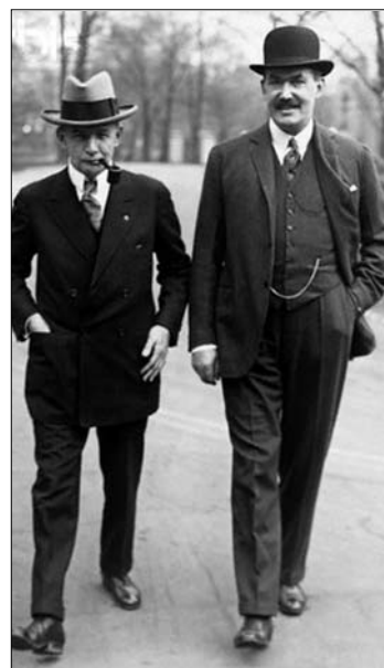
Charles Gates Dawes (1865–1951) balról, Sir Robert Kindersley, a Bank of England igazgatója társaságában

A két amerikai szakember fölül elismerte, hogy a súlyos terheket csak egy jól működő gazdaság képes elviselni, ezért a Dawes-hitel 7 százalékos kamatra 800 millió arany márkát, a Young-kölcsön pedig 5,5 százalékra 300 milliót bocsátott Németországot rendelkezésére. Az 1933-ban győztes Hitler és pártja, az NSDAP azonban választási kérdéssé tette a jóvátételt: hatalomra kerülését követően a tör-