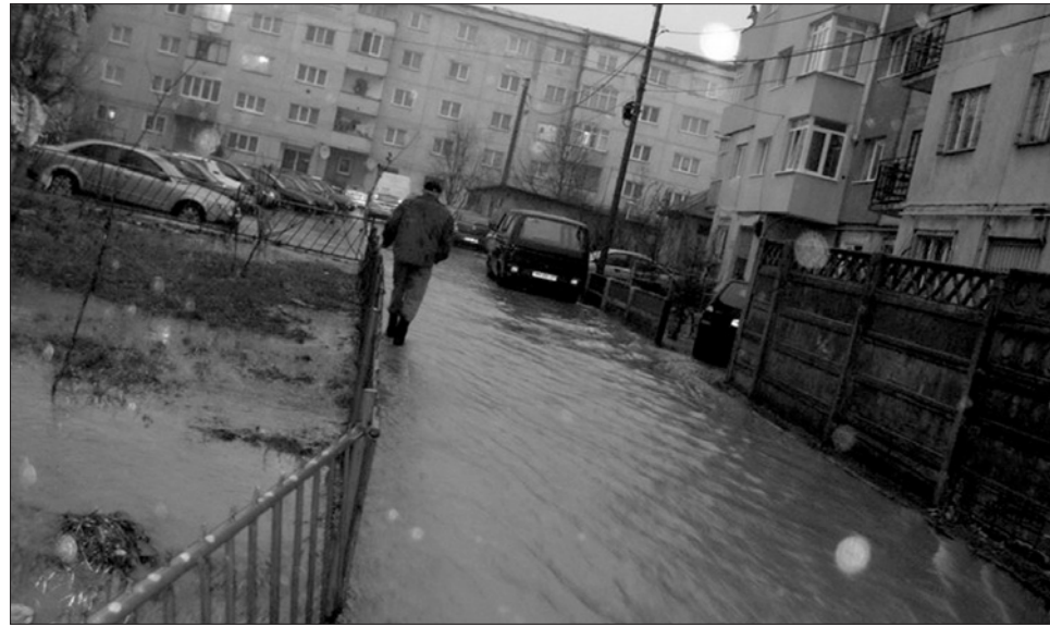
Hirtelen lezúduló, nagy mennyiségű csapadék nehezítette a közlekedést az erdélyi városokban is