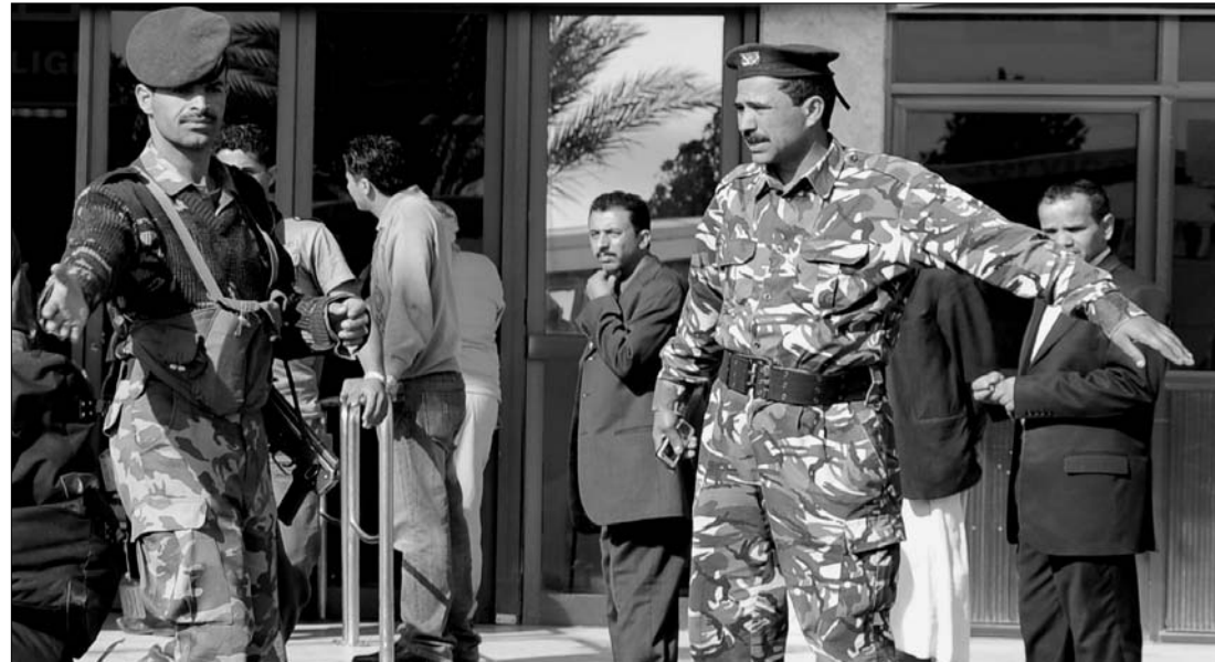
Merényletektől tartanak: tegnapról fegyveresek őrzik Jemen fővárosában, Szanaában a közintézményeket

John Brennan, Barack Obama elnök terrorizmusellenes főtanácsadója tegnap közölte: az al-Kaida bizonyos jelek szerint terrorista merényletre készül a jemeni fővárosban, esetleg az ottani amerikai nagykövetség ellen. Brennan az „aktív al-Kaida fenyegetéssel” indokolta az amerikai diplomáciai képviselőt aznap bezárását Szanaában. Az Egyesült Államok eltökélt, hogy megsemmisítse az al-Kaidát, legyen az akár Pakisztánban, Afganisztánban vagy Jemenben – szövegte le. ◀