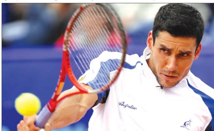
Victor Hănescu egyéniben kikapott, de párosba sikerrel kezdett