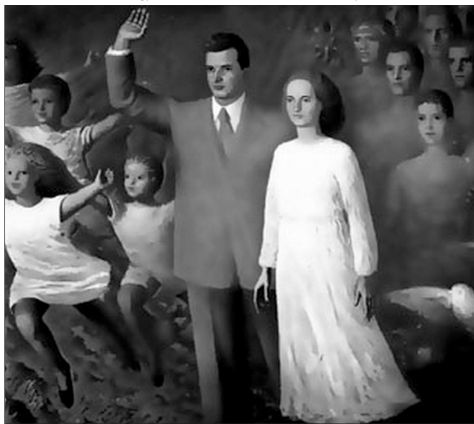
Ceaușescuék: a festménynek anyai köze van a valósághoz, mint a 2010-ig szóló irányelveknek

1989. decemberének szele elsöpörte az irányelveket, de érintetlenül hagyta a politikusi fantáziát, amelynek nyomán az eltelt húsz esztendőben, ha nem is öt éves tervként, de a négyévenként sorra kerülő választások alkalmával ugyanilyen képzelőerőről, a valóságérzet ugyanilyen hiányáról bizonyosságot tevő és hasonlóképpen soha meg nem valósuló ígéretek kapunk vezetőink részéről. ◀