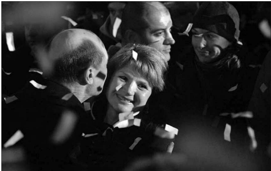
Traian Băsescu államfő a feleségével kezdte, de aztán minden sinaiai szilveszterező „megcsókolt”

A kormányfő amúgy egy gyalui menedékházban töltötte a szilveszter éjszakát. A hajnalig tartó mulatságon a Demokrata-Liberális Párt Kolozs megyei és kolozsvári vezetői vettek részt. Helyi források szerint a menedékház felé vezető utakat a kormányfőrség éjszakára lezárta. ◀