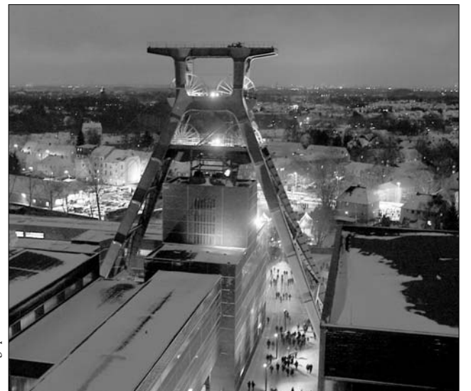
A szombati esseni avatóra huszonöt ezer látogató érkezett

Európa idej kulturális fővárosai közül Isztambul nemcsak abból a szempontból más, mint a többi, hogy olyan ország területén fekszik, amelynek jelentős része átnyúlik Ázsiába. Azért is elűt a németországi Essentől és a Ruhr-vidéktől, illetve Pécsről, mert Törökország az európai uniós tag-