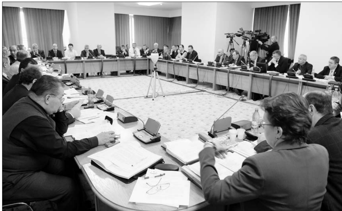
A költségvetési és pénzügyi szakbizottságok összesen tizenhét órában keresztül vitatták meg a tervezetet