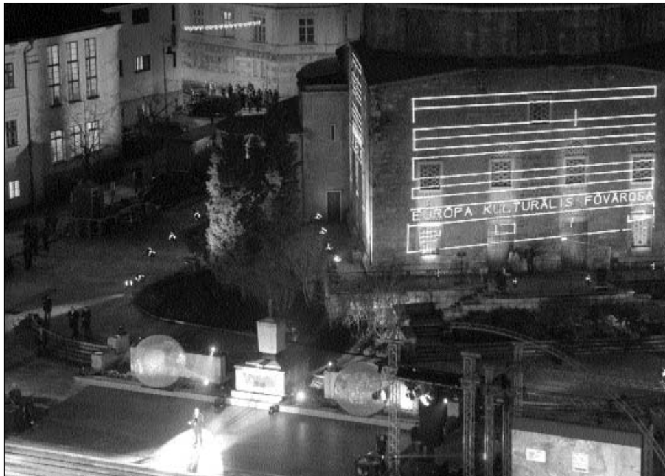
Az Európa Kulturális Fővárosa programsorozat nyitóünnepsége a pécsi Széchenyi téren

Akik azonban Isztambul nem élő múzeumként, hanem a feltörekvő városaként szeretnék láttatni, családtagoknak adnak hangot. Az előkészítő bizottságot több oldalról is támadás érte az elmúlt hónapokban. A giccs fővárosa – írta az egyik elemző, a rossz irányítást és a népieskedést bírálva. A legfőbb vád az, hogy „kifosztották” a közösség kasszáját. A Habertürk című lap egyenesen „a korrupció fővárosaként” aposztrofálta Isztambult, miután napvilágot látott a hivatalos jelentés: Nuri M. Çolakoglu, a kulturális év első tervezője egy személyben tett javaslatot a programokra, majd ő értékelte és fogadta is el őket. A történetek miatt Çolakoglu-nak le kellett mondania. ◀