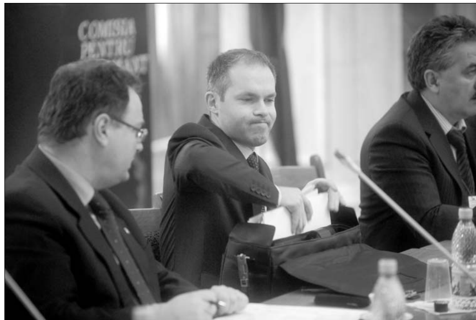
A szakbizottság jóváhagyta Daniel Funeriu tanügyi, ifjúsági és sportminiszter (középen) módosításait

Az illetékes bizottság ugyan elfogadta a költségvetés-kiegészítési módosítást, de azt még a parlamentnek is jóvá kell hagynia. A végleges határozat holnap várható. ◀