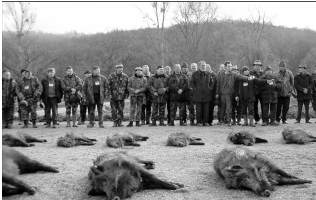
A „gyilkosok” és áldozataik. Bályokon rendszerint száznál több vadat teritenek le Tiriac meghívottjai