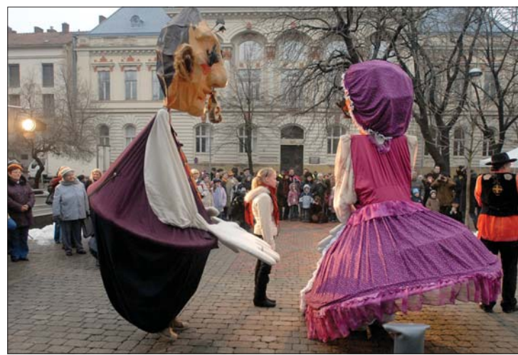
Rajtol a Pécs 2010. Tegnapi kép Európa egyik kulturális fővárosából.

nepség, Essenben január 9–10. között, Isztambulban pedig 16-ra dátumozták a kezdést. 8. oldal ▶