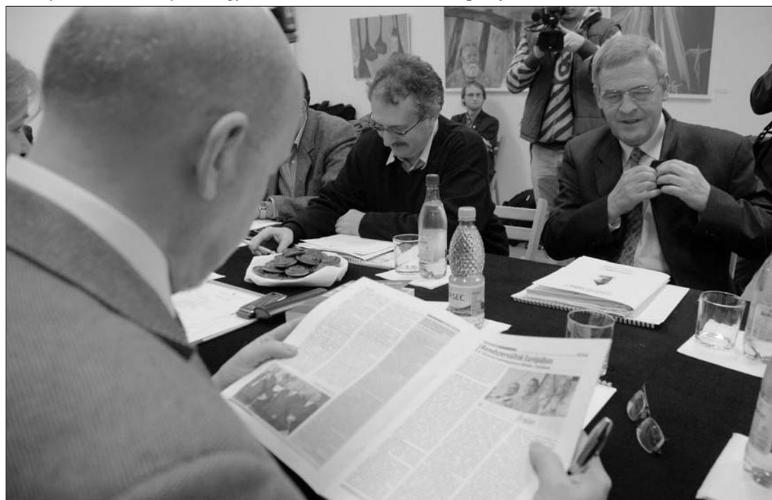
Szemtől szemben. Az RMDSZ, illetve az EMNT elnöke, Markó Béla és Tőkés László a marosvásárhelyi találkozón

szerint, amikor egy kisebbségi szervezet a román belpolitikában cselekvő részvétel mellett dönt, természetesen számol a kormányzás lehetőségével és eszközeivel is. Meggyőződésünk, hogy az RMDSZ kormányzati szerepvállalása nemcsak az általános országos célok, hanem a sajátos közösségi célkitűzések megvalósításához is hozzájárul, hiszen a közösen kidolgozott kormányprogramban számos, az etnikumközi kapcsolatok javítására vonatkozó célkitűzés szerepel. E tekintetben nem értünk egyet az EMNT-vel, ők ellenzékben szeretnének látni minket, míg meggyőződésünk, hogy az erdélyi magyarok túlnyomó többsége támogatja az RMDSZ kormányzati részvételét” – szögezte le az RMDSZ elnöke. ◀