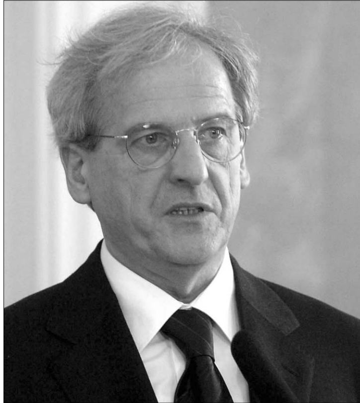
Sólyom László köztársasági elnök kiírta a választások időpontját

Sólyom László bejelentése nem okozott meglepetést, miután az államfő egy december közepén adott interjújában kifejtette, hogy a lehető legkorábbi időpontra írja ki a választást, ezzel is lerövidítve a kampányidőszakot, amit minden párt üdvözölt. „Ez jó hír. Jó hír Magyarországnak, mert azt jelenti, hogy kevesebb idő jut arra, hogy családtagokat összevesztítsenek, kevesebb idő jut gyűlöletoffenzívára, az ország megosztására, hogy gyilkosként mutassák be a kormányfőt, arra, hogy bilincsből ábrázoljanak meg nem vádolt szocialista politikusokat” – fogalmazott Lendvai Ildikó, az MSZP elnöke, majd a Fidesz plakátszlogenjét átvéve hozzátette: itt az idő, hogy