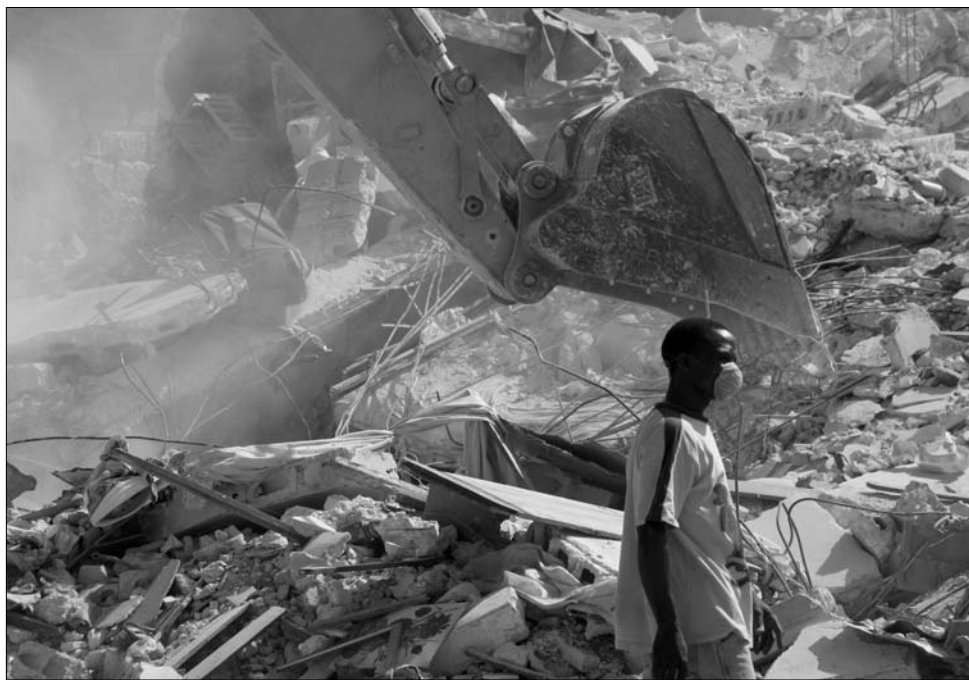
A földrengés sújtotta Haiti – az apokaliptikus képe

Az 1825 óta független országban azóta is egymást érik a felkelések, ezért csaknem húsz évig (1915 és 1934 között) amerikai megszállás alatt állt. Az 1950-ben kirottant katonai puccsot követően Francois Duvalier választás útján lett az ország államfője, aki 1964-ben örökös elnöknek