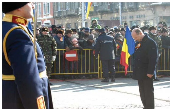
Elnöki üzenet a román egyesülés ünnepén: nem lesz autonómia!

üzent tegnap Iași-ból, a Moldova és Havasalföld egyesülése 151. évfordulóján tartott ünnepről az államfő. 2. oldal ▶