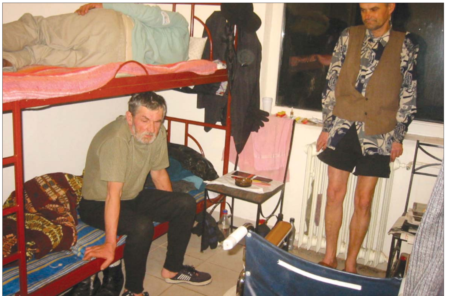
A marosvásárhelyi Rozmaring utcai átmeneti szállóban minden hely megtelt. Csecsemővel azonban amúgy sem érdemes ott próbálkozni