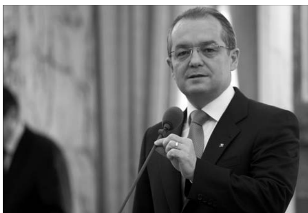
Emil Boc kormányfő nem beszélt az IMF új feltételeiről

► Nem hiszem, hogy problémák lesznek a következő hitelrészletekhez való hozzájutásban, ugyanis a Nemzetközi Valutaalap (IMF) felé vállalt kötelezettségeket teljesítette az ország – nyilatkozta Emil Boc miniszterelnök tegnap azt követően, hogy szombaton találkozott a pénzügyminiszterrel. Az IMF, az Európai Bizottság (EB) és a Világbank küldöttségével a kormányfő az európai projektekre vonatkozó ál-