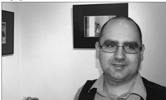
A pillanatok „vadása”. Baló Levente fotóművész

Baló Levente fiatalkori hobbiként emlékszik vissza a fotózás kezdeteire. „Itt összesen tizenhét fotó van kiállítva. Ezek legalább ennyi év alatt készültek el. Mindig is érdekelt a fotózás misztériuma: a pillanat megörökítése” – mondta el lapunknak a fotóművész. ◀