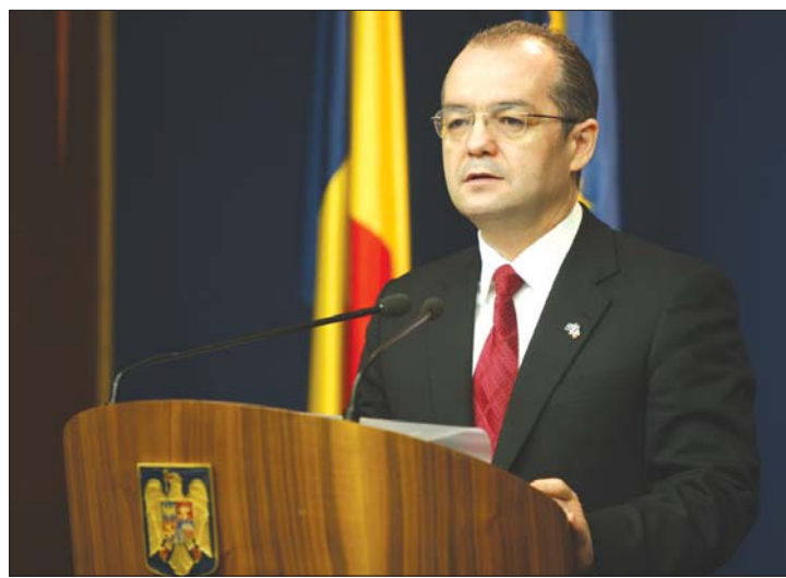
Emil Boc: csupán a „kiváltságosok” nyugdíját nyíráljuk meg

kormány elfogadta az új nyugdíjtörvényt. Boc szerint a kárvalottak száma mindössze 27 ezer lesz. 3. oldal ▶