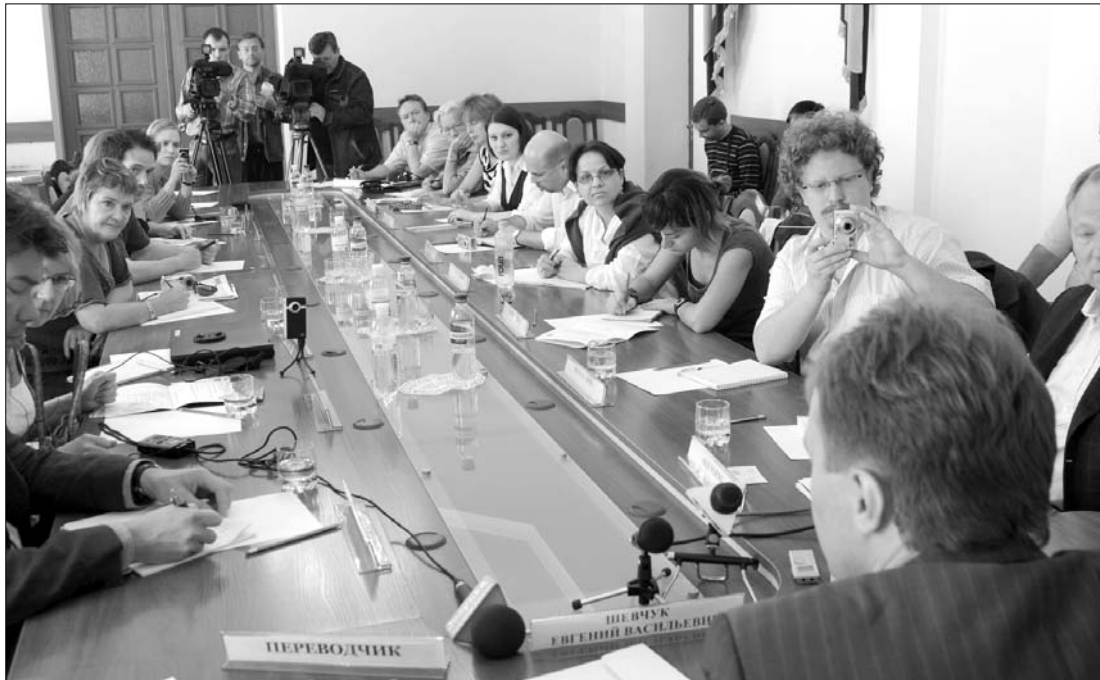
Sajtótájékoztató Chişinău-ban. A kommunisták távozása után sem lett szabadabb a moldovai sajtó?

A helyzet Transznisztriában sem rózsásabb. Jelena Kalinycsenko újságíró szerint a 2009-es transznisztriai sajtóévet megrázó események tarkították, és a vá-