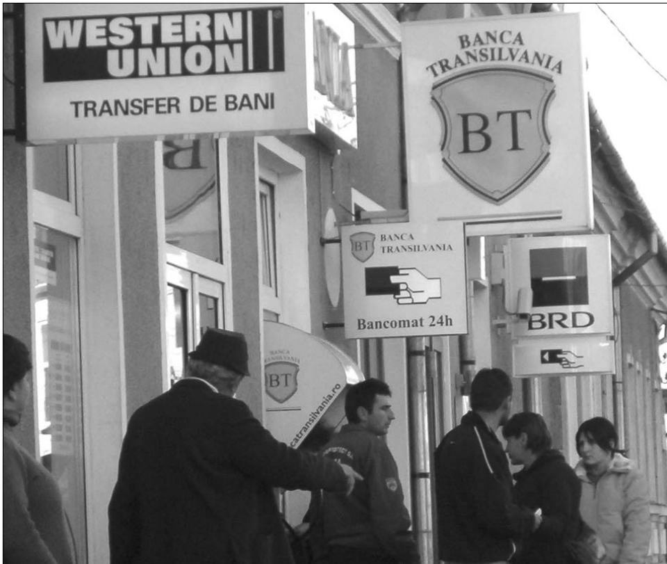
Az előző évhez képest 2009-ben kevesebb pénzt vehettek le kártyájukról a romániai dolgozók

„A döntéshozók sok esetben nincsenek tisztában azzal, hogy milyen hosszútávú következmé-