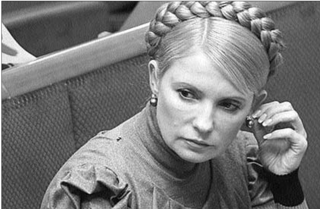
Timosenko miniszterelnök három napja nem jelent meg a nyilvánosság előtt, és a heti kormányülést is lemondta

A győztesként kihirdetett Janukovics pártja (a Régiók Pártja) a maga részéről azt kifogásolta, hogy Ukrajna nyugati részében csaltak Timosenko javára. Az Európai Biztonsági és Együttműködési Szervezet (EBESZ), nyugati megfigyelők a választást tisztességesnek minősítették. ◀