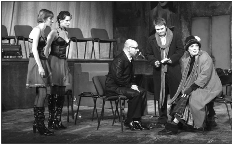
Alexander Galin Válogatás című művéből készült előadást holnap tekinthetik meg a színház szerelmesei