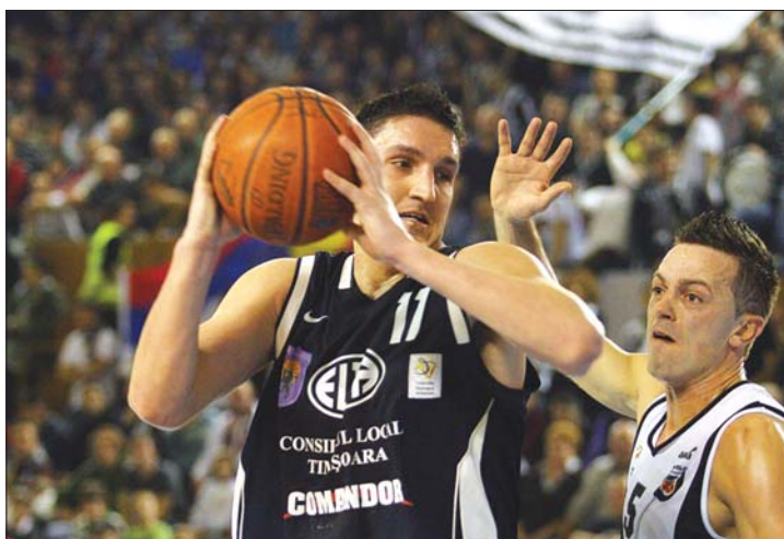
A kolozsváriak győztek a rangadón, Temesvár a bronzért játszott

Tegnap lapzártánkig csak a bronzmeccs fejeződött be, a temesvári csapat 87-70-re győzte le a paksi gárdát. ◀