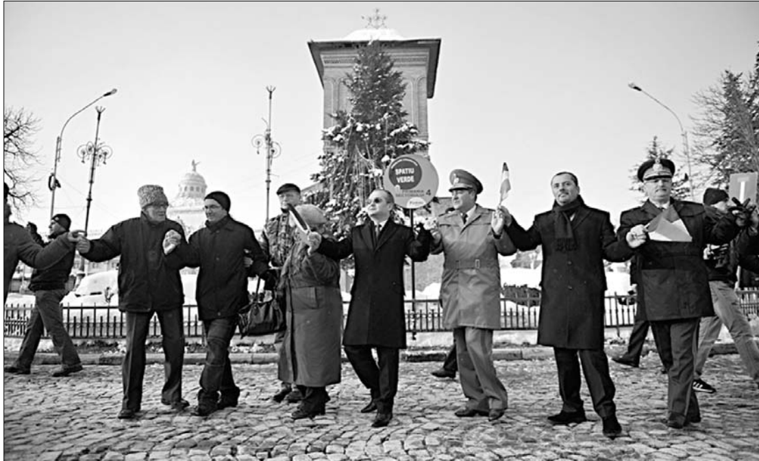
Emil Boc (középen) itt még katonákkal és rendőrökkel hórázik. Az igazi tánc azonban most kezdődik

A „kárvallottak” közé tartoznak azok is, akiknek nyugdíját