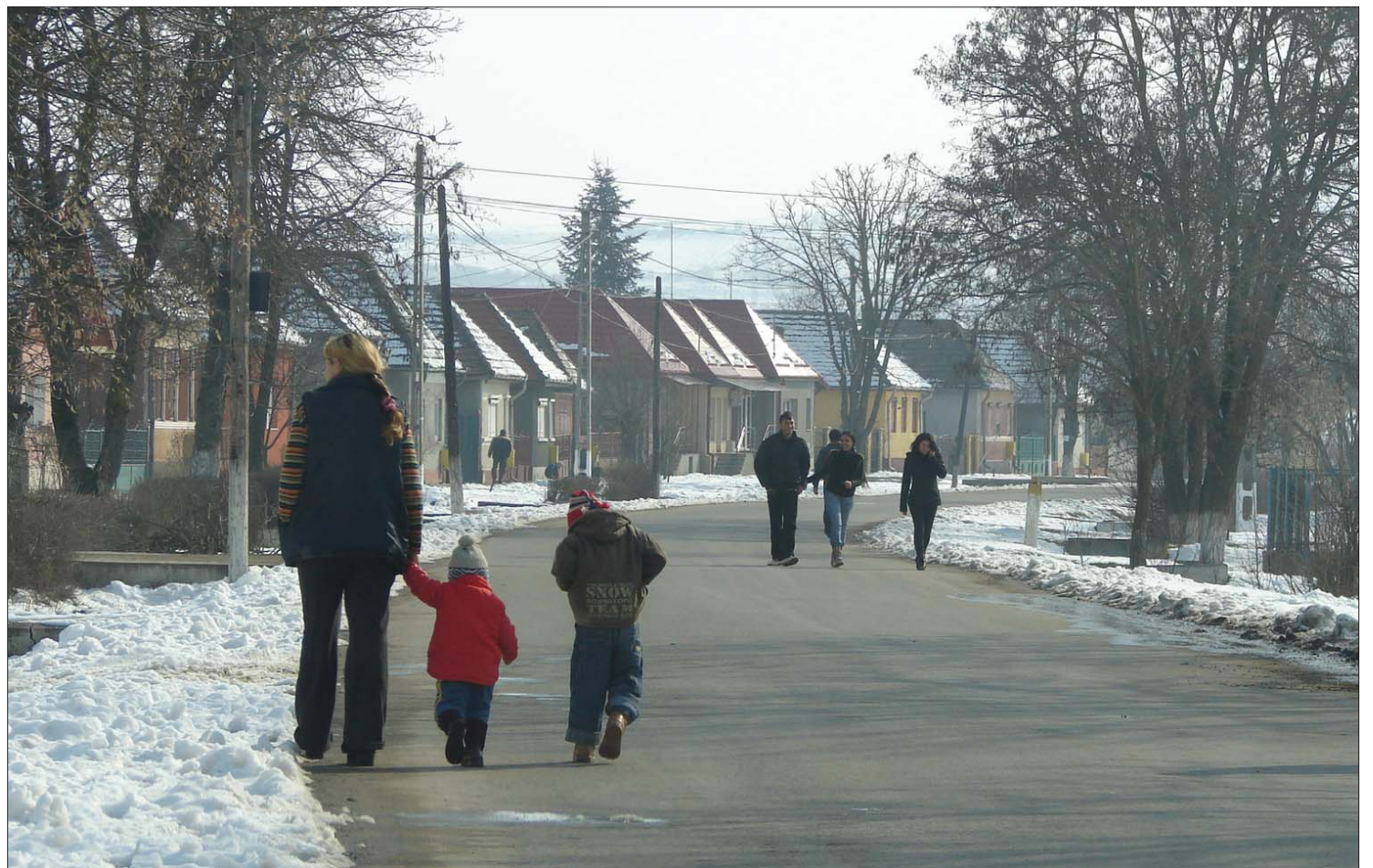
A kerelőszentpáliak szerint ők tiszteletben tartják a cigányok jogait, még a helységnevtábla is háromnyelvű: román, magyar és roma

Tanár-, illetve rendőrvérséki botrány tört ki a Maros megyei Kerelőszentpálon