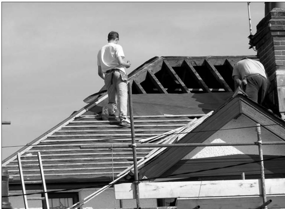
A társuló építkezők 75 ezer eurós állami garanciára lennének jogosultak az Első ház keretében.

Bár a kormány ezen a héten vitatja meg, hogy milyen formában és milyen feltételekkel folytatódjon a projekt, eddig már körvonalazódott az Első ház tervezett új kritériumrendszere. Ennek értelmében három kategóriában lehet majd állami hitelgaranciáért folyamodni 2010-ben, a hatszázmillió eurós pénzeszköz erejéig – amint azt korábban Sebastian Vlădescu pénzügyminiszter is megerősítette. Míg a tervek szerint változatlanul (maximum)