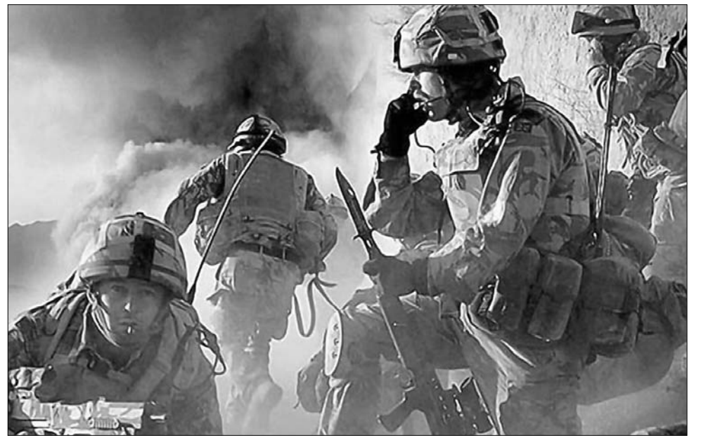
Valahol Afganisztánban... Lesznek még forró pillanatok!

táni kalandjuk kudarcára: a Moszkva-barát Babrak Karmal rezsimjének hatalomban tartására 60 ezer katonával kezdtek, utóbb a létszám 120 ezerre emelkedett, 1989-ben mégis dicstelenül vissza kellett vonulniuk. Most a nemzetközi erők 44 országból érkeztek mintegy 85 ezer harcosa küzdött a nem csekély jövedelmeiket máktermelésből, nyers ópium előállításából előteremtő tálibok ellen, akiket mellesleg épp az amerikaiak képeztek ki hajdanán, felkészítve őket a szovjetekkel vívott küzdelemre. (A hírhedt Oszama bin Laden, az al-Kaida láthatatlan vezére is ekkor csatlakozott egy CIA-pénzelte muzulmán szervezethez.) Másfelől a legutóbbi offenzívában ráadásul az amerikaiak és a britek mellett kanadai, dán, francia és észt katonák vettek részt, márpedig ez utóbbi különösen fáj Moszkvának, hiszen a balti ország nem is olyan régen még a Szovjetunió tagköztársasága volt. Harmadjára pedig a helyzetet szeretnék a lehetőségekhez képest önmaguk hasznára fordítani, a szovjet invázió idején ugyanis megannyi af-