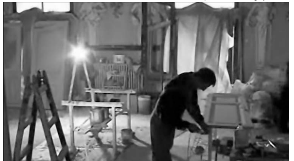
Az utolsó szakaszban többek között felújítják az asztalosmunkákat és a bútorokat

A felújítás finanszírozása a megyei tanácstól a városi önkormányzathoz került. Azt szeretnék, hogy októberben, a színház felépítésének századik évfordulóját ne ilyen áldatlan körülmények között ünnepeljék. ◀