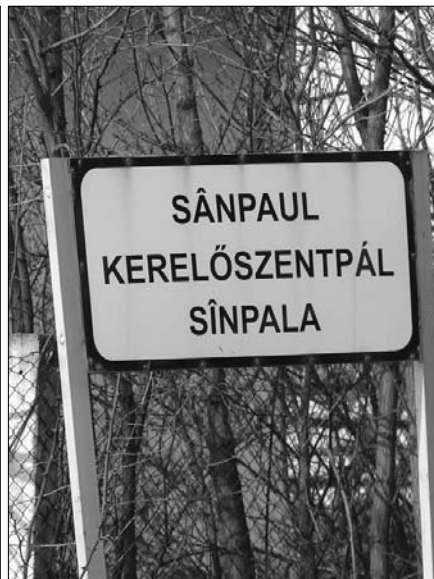
Elszabadultak az indulatok a szentpáli iskola folyosóján A település helynévtáblája, cigányul is