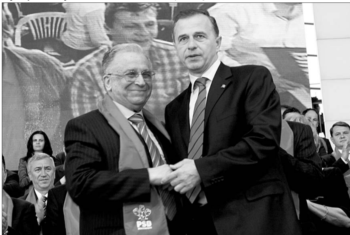
Ion Iliescu, a Szociáldemokrata Párt tiszteletbeli elnöke (balra) elereszti Mircea Geoană kezét

Kétségtelen: a korrupciómentes, magát mindvégig elkötelezett baloldalinak tartó Iliescu, más elnöktársaitól eltérően, megmaradt a román történelemben. Mindaddig azonban még bőven lesz alkalma megírni a blogjában, hogy pártjának populista utódai hogyan osztagatják szoban a pénzt a népeknek, és hogyan gyűjtik maguknak – a gyakorlatban.