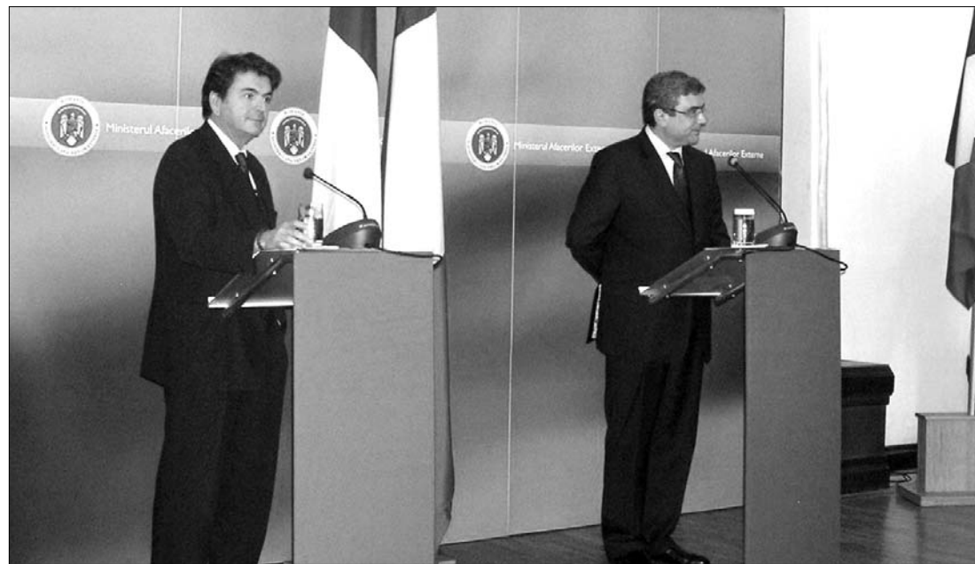
Pierre Lellouche francia külügyi államtitkár és Teodor Baconschi külügyminiszter az ominózus sajtótájékoztatóon.

zetek levelére. Eszerint Teodor Baconschi határozottan elutasítja a rasszizmus vádját. „A bűncselekményeknek semmi köze nincs a bűnelkövetők etnikumához” – szögezte le a szóvivője révén a román diplomácia vezetője, aki szerint a jogvédők félreértelmezték múlt heti kijelentését. „A miniszter a «természetes» kifejezés alatt azt értette, hogy bármely közösség esetében lehet természetes bűnözési rátáról beszélni. A tárcavezető nem állította azt, hogy a külföldön élő román közösségekben nagyobb a bűnözési ráta, mint más bevándorlók közösségében” – pontosított a tárcá. ◀