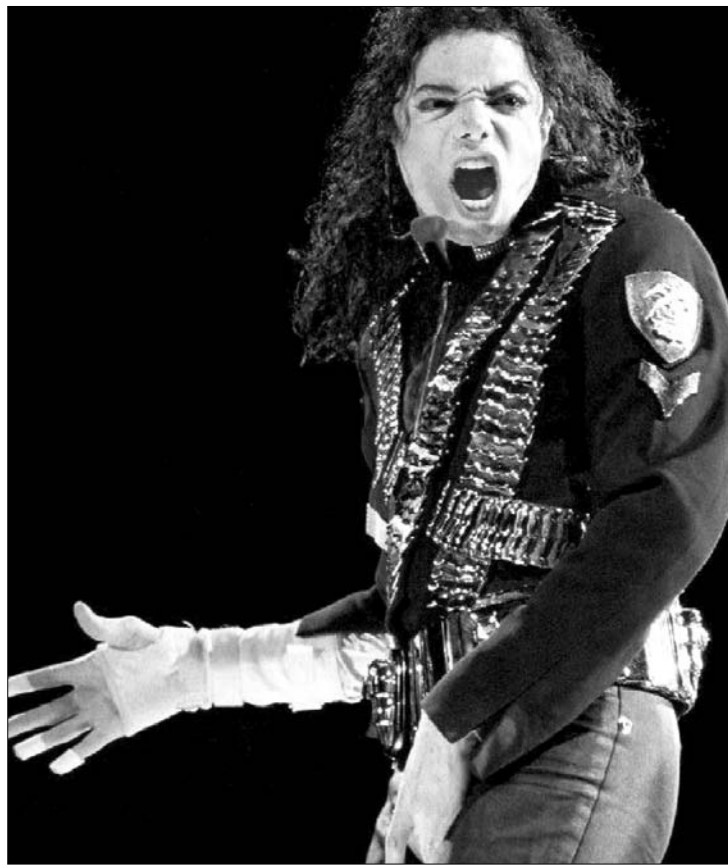
A '82-ben zombibőrbe bújt Michael Jackson is átmenőt kapott a Vatikántól

A könnyűzenei top tízes lista első helyén a Beatles 1966-os Revolver című albuma áll, melyet David Crosby első szólóalbuma, az If I could only remember my name (1971) és a Pink Floyd: The dark side of the moon (1973) korongja követnek.