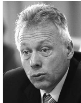
Borbély László miniszter.

A Természetvédelmi Világalap (WWF) a hajózási útvonalak környezetkímélő alakítását szorgal-