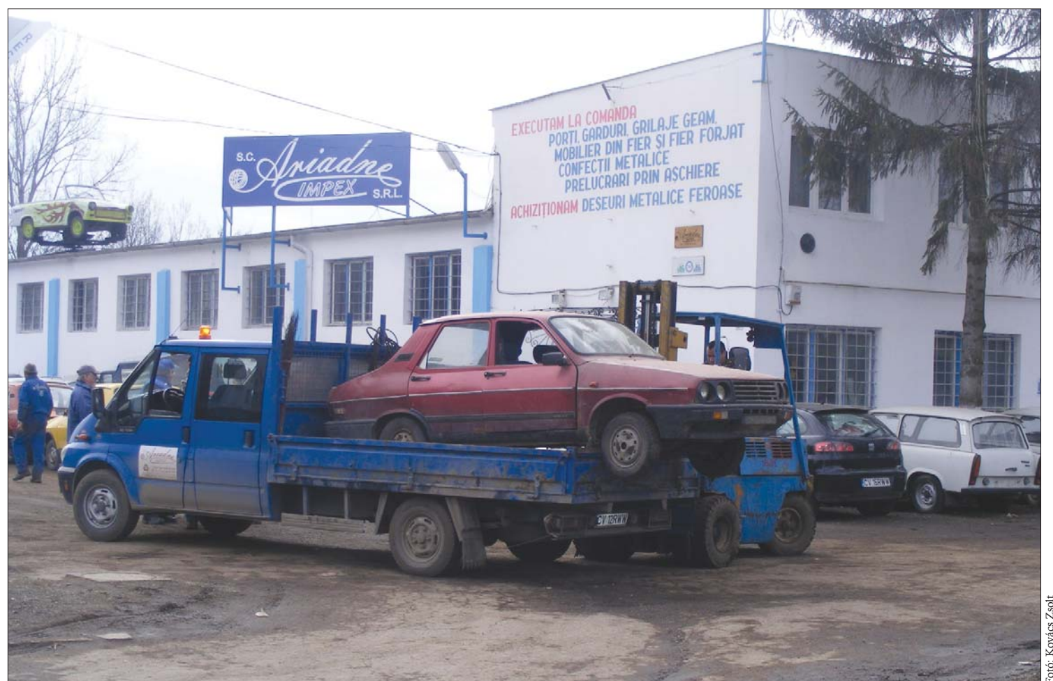
Idény eleji nagyüzem a szentgyörgyi roncstelepen. A működtető cég az országban elsőként váltotta ki a programban való részvételre feljogosító engedélyt

„Egy hét alatt annyi roncsautótól szabadultak meg a háromszékiek, mint tavaly egész évben. Ez is mutatja, hogy idén rendkívül sikeres a kormány roncsautóprogramja” – lelkesedik a sepsiszentgyörgyi roncstelepet működtető cég képviselője. Az idei roncsautóprogram az eddiginél kedvezőbb körülmények között zajlik, hiszen egy új autó vásárláshoz immár nem csak egy, hanem három értékjegyet lehet felhasználni. 6. oldal ▶