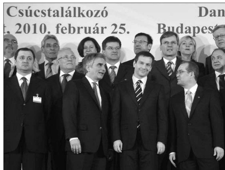
A meglévő uniós eszközök átcsoportosításával valósulhatnak meg a fejlesztések