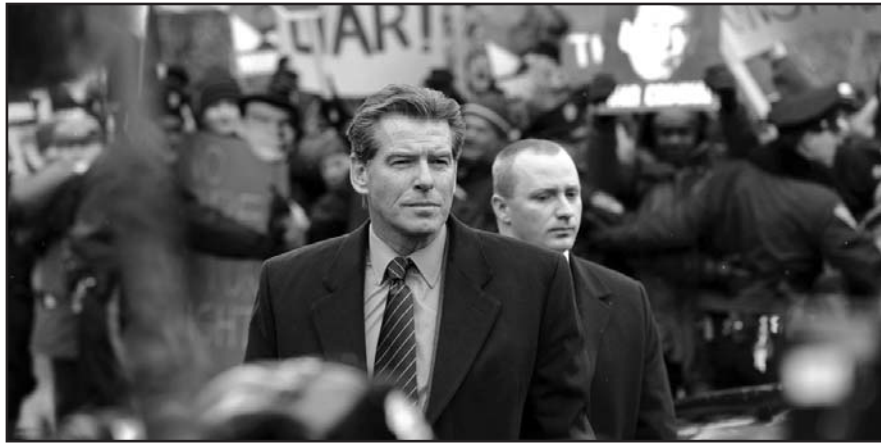
Pierce Brosnan alakítása is hozzájárult a legújabb Polanski-alkotás sikeréhez

Az idei Berlinálén tehát a kimagasló, referenciaértékű művek mellett többen a jól bevált toposzokra építettek (vérfertőzés, betegségek, törvénytelenység), mások pedig triviális feszültségkeltő megoldásokhoz nyúltak. Így az elismerést érdemlő alkotások mellett olyanok is „futtak”, amelyek a művésziesség és a hollywoodi stílusú történetmesélés groteszk összefonódásával próbáltak hatni.