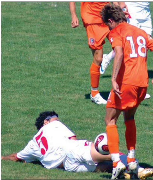
Lejátszása a pályáról ellenfeleit a vásárhelyi csapat

Sokáig amúgy vitatott volt, hogy a második ligába korábban magának helyet vásárolt