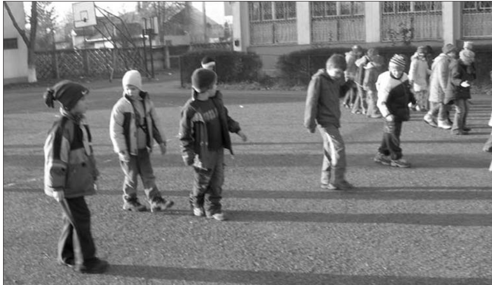
A tiltakozó szülők szerint jogtalanul gáncsolnak el a step by step-osztályokat Marosvásárhelyen