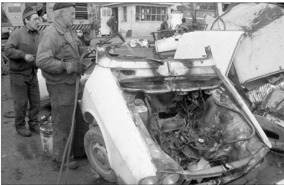
A szerző félfotója

A sepsiszentgyörgyi ócskavastelep tulajdonosa szerint a program hiányossága, hogy egyszerre csak 100 értékpapírt lehet igényelni, ezért az ócskavastelepek képviselői folyamatosan Bukarestben vannak, hogy leadják a dokumentumokat és új értékpapírokat kapjanak. Az idei roncsautóprogram az eddiginél kedvezőbb körülmények között zajlik, hiszen egy új autó vásárlásához már nem csak egy, hanem három értékpapírt lehet felhasználni. Egy roncsautóért járó 3800 lejes