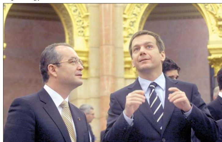
Egyelőre beérték egy „minicsúccsal”. Emil Boc és Bajnai Gordon

Emil Boc cserében arról biztosította Bajnai Gordont, hogy a román parlament júniusig megszavazza a kisebbségi törvényt. 2. oldal ▶