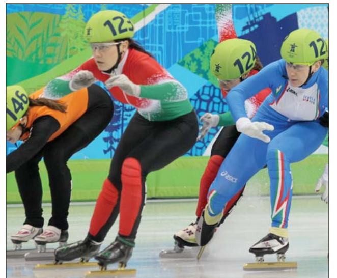
Váltóban is pontot szereztek a magyar hölgyek

Már csak három nap maradt hátra az idei ötkarikás játékokból, és még 16 számban avatnak olimpiai bajnokot. Közöttük a négyes bobban, ahol Románia férficsapata érdekelt. ◀