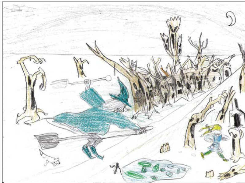
Hubbes Péter rajza

Illyés Gyula Hetvenhét magyar népmese c. könyvéből