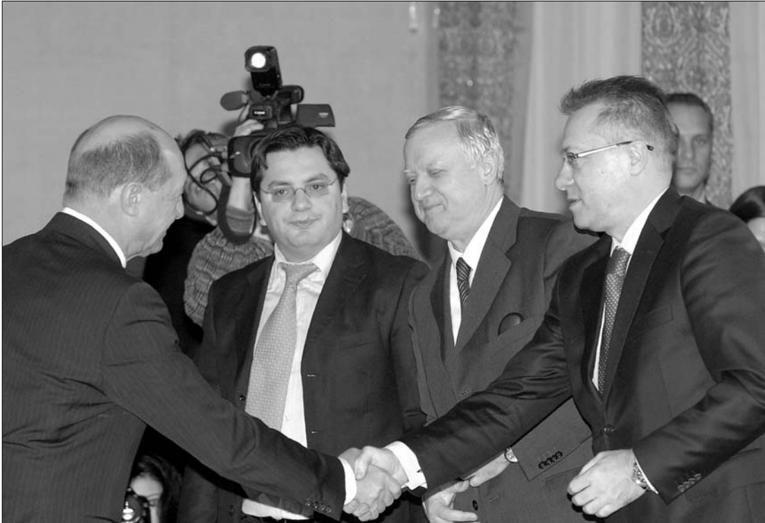
Băsescu (balra) „függetlenjei” Cristian Diaconescu (jobbra) után Marian Sârbu (mellette) is „megkaphatják”

Cristian Diaconescu, a szociáldemokratákat otthagyo szenátor az utóbbi két napban kevés magyarázattal szolgált a független frakcióhoz való csatlakozásával kapcsolatban. A volt külügyminiszter szerda este sorra látogatta a hírtévéziók beszélgető műsorait, tagadva, hogy döntése hátrében zsarolás áll. Ugyanakkor elismerte, valóban megfigyelték a PSD-kongresszust megelőző időszakban, és vannak elképzelései is arról, hogy ki áll az ügy mögött. Diaconescu nem hagyta szó nélkül azt sem, hogy a botrány kirobbanása után párttársai magára