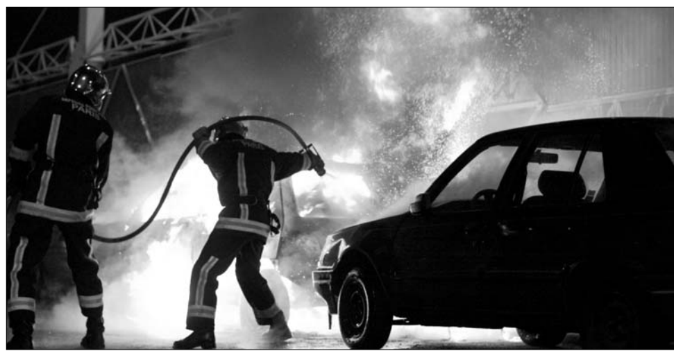
Párizsi forró nyár. A nagyarányú bevándorlás zavargásokhoz, összecsapásokhoz vezetett.

Párizs harcot hirdetett az illegális bevándorlókkal szemben: a jövőben erőtelje-