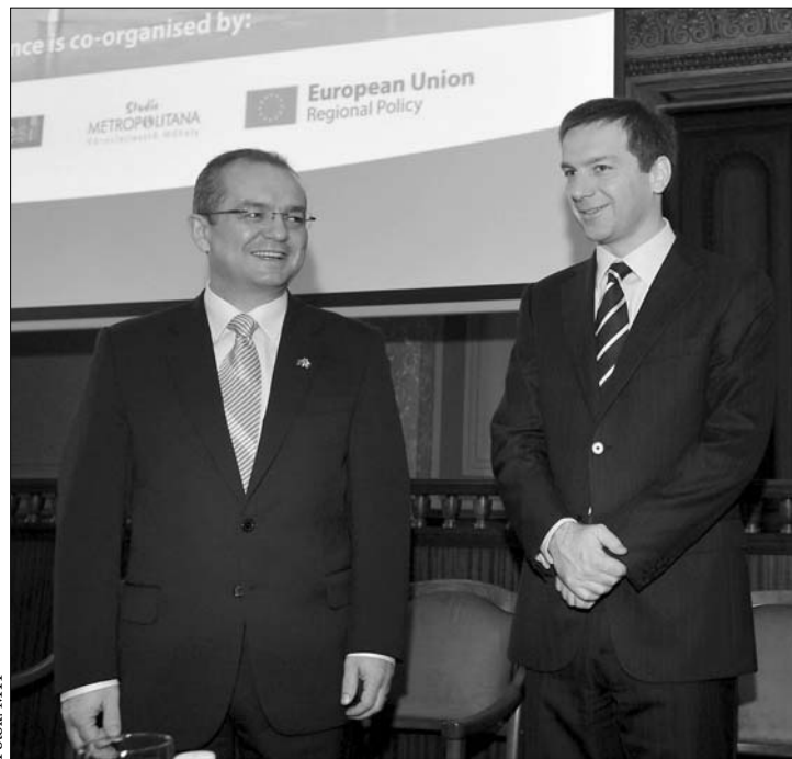
Boc kérte Bajnait: tegyen arról, hogy szűnjön meg az „etnobiznisz”

A felek gazdasági kérdésekben is egyeztettek. Szó esett arról is, hogy hamarosan befejeződnek az Arad–Szeged gázvezeték, valamint a Várad–Békéscsaba elektromos vezetéknel kezdett munkálatok. ◀