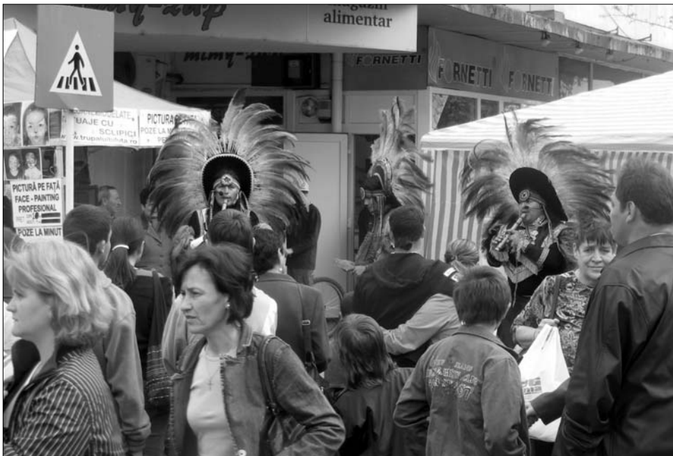
Az eddigi hibákból tanulva a kulturális rendezvényekre nyit a szervezőség

A városnapok a tavalyi recept szerint zajlanak majd, de tanulva az elmúlt esztendő hibáiból, idén ráerősítenek a „kulturális hét” programjaira. A Szent György Napok nyitóhangversenye már igazi sztárt ígér, hiszen Varnus Xavér ad orgonakoncertet a Krisztus Király katolikus templomban. A tervek szerint a közel 500 programot felvonultató városnapok keretében fellép a Kolozsvári Állami Magyar Színház Csehov Három nővér című UNITER-díjas darabjával, de Sepsiszentgyörgyre érkezik három magyarországi színház is, a helybéli Tamási Áron társulat pedig akkor mutatja be új előadását, illetve a Háromszék Táncegyüttes elkészíti Szent György legendája című nagyszínpadi előadását. Ugyancsak a Szent György Napok ideje alatt szervezik meg második alkalommal a