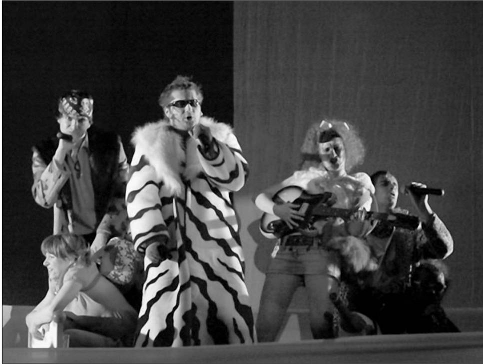
A kolozsváriak Túl a Maszat-hegyen című mesedarabja is vendégeskedik Budapesten