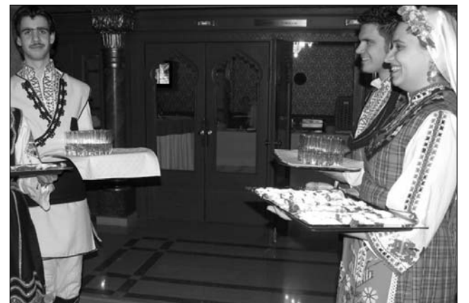
Filmek mellett nemzetiségi étek is helyet kapnak

Románia a díszvendég a ma zajló VI. Magyarországi Nemzetiségi Filmszemlén Budapesten, az Uránia Nemzeti Filmszínházban. A Magyar Televízió Kisebbségi szerkesztősége által szervezett eseményen, tizenkilenc film mérkőzik meg egymással a díjakért. „Egy televíziós vagy filmes fesztivál közvetett módon mindig öröm és ünneplés a szakmabeliek számára. A Nemzetiségi Filmszemle azonban ennél különlegesebb: egy olyan esemény, amelyen komolyan el kell gondolkodnunk a nemzetiségek számára készült műsorok szerepéről, egy olyan alkalom, amikor újra lehet értelmezni a műfajt, sőt a politika vetülete is hangsúlyossá válik” – fejtette ki Brîndușa Armanca, az egyik zsűritag, a Budapesti Román Kulturális Intézet (BRKI) igazgatója. A fesztivál idei vendége Románia, így a BRKI a szervezésben is partnerséget vállalt, hogy versenyen kívül, de ingyenesen a közönség elé kerülhesen olyan dokumentumfil-