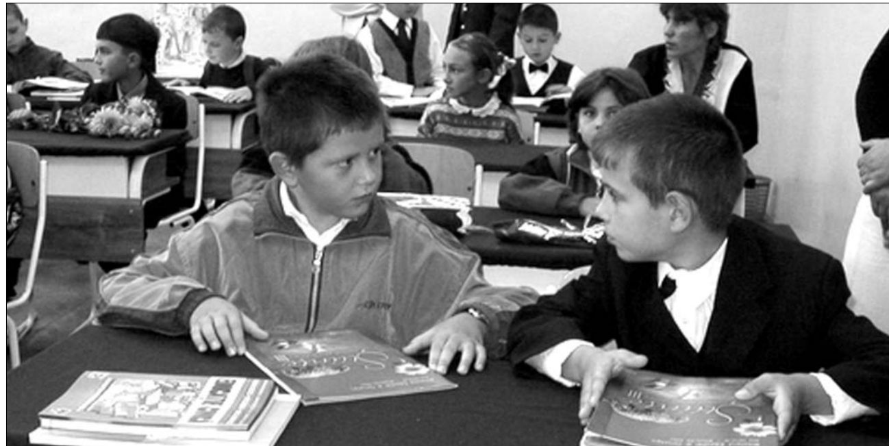
Szabálytalanul, átláthatatlanul folyik az elsősök beiskolázása. A felvételitilalom ellenére az óvodai tananyagból tesztelik a jelentkezőket

radt helyekre február 24-e és 26-a között jelentkezettek a más településekről érkezők is. Tapasztalataik szerint sok szülő már évekkorábban várólistára írta a gyereket. Az iskolák körzetesítését a lakosság felháborodása övezte. Keresztély Irma főtanfolygató ezzel kapcsolatban elmondta: az iskolai körzeteket szabályozó határozattal a lakónegyedi iskolák támogatását célozzák, így akadályoznák meg, hogy azok elnéptelenedjenek. ◀