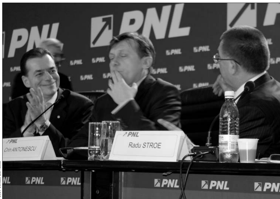
Ludovic Orban (balra) és Crin Antonescu (középen). (H)arcok a liberálisok rendkívüli kongresszusán

Párt. Az mindenestre sokatmondó tény, hogy a régi-új elnök a tömörülés egyik legfőbb céljaként nem az építést, hanem a rombolást: a Demokrata-Liberális Párt kormányzásból való kiszorítását jelölte meg. Igaz, fontos feladatként szerepel programjában a jogállam megvédése, a párt „valódi jobboldali politikai alakulattá” történő átalakítása, amely képesnek bizonyulhat az ország egész arculatának a megváltoztatására. Csakhogy ezek meglehetősen általános, körvonalatlan, így tehát konkrétan nehezen számon kérhető célok. Az már precízebb számadat, miszerint elnökletével a pártnak a 2012-es parlamenti választásokra harminc százalékot kell szereznie, amivel akár az ország vezetője, de mindenképpen legfontosabb jobboldali politikai alakulattá válhatna. Ami szép, de nem egykönnyen megvalósítható vállalkozás, hiszen a liberális tömörülésnek két év alatt kellene csaknem annyival erősödnie, mint 2000 óta mostanáig, tíz esztendő során. Hasonlóképpen nehéz lesz a párt megújítására tett fogadalom betartása is. Legalábbis erre utal az a tény, hogy a tizenöt új alelnök közül tíz a régi politikusokból került ki, akik döntő többségben vannak a Központi Politikai Irodában is. Megalapozottan tűnik tehát a politikai megfigyelők gyanúja, miszerint a „megújult” liberális párt a politikai irányvonal tekintetében meglehetősen hagyományörző, vagy ha úgy tetszik: konzervatív lesz. ◀