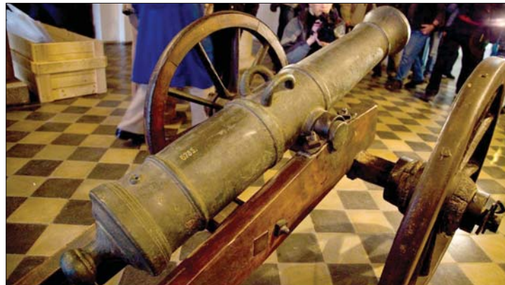
Gábor Áron ágyúja a Székely Nemzeti Múzeumba került

▶ Ha csak átmenetileg is, de hazahozták Bukarestből Gábor Áron egyetlen fennmaradt ágyúját. A 370 kilogrammos ágyút a sepsiszentgyörgyi Székely Nemzeti Múzeumban március 12-én az In Memoriam Gábor Áron című kiállításon mutatják be. 8. oldal ▶