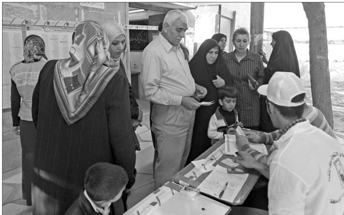
A terrorveszély ellenére az irakiak nagy számban adták le szavazataikat a választásokon

északra található Baakúbában egy időben lépett működésbe öt robbanószerkezet öt szavazóhelyiség közelében. Kászim al-Musztavi vezérőrnagy, Bagdad biztonsági szóvivője közölte, hogy a legtöbb rakétát és aknagránátot a főleg szunniták lakta negyedekből lötték ki. A szóvivő közölte, hogy a fővárosban négy órával a szavazóhelyiségek megnyitása előtt feloldották a személgépkocsik közlekedésére vonatkozó szavazónapi tilalmat. Az autóbuszokra és tehergépkocsikra vonatkozó tilalom érvényben maradt. A korlátozás enyhítésére nem adott magyarázatot. Megfigyelők a voksolás előtt abbéli reményüket fejezték ki, hogy a parlamenti választásokkal Irakban sikerül lezárni a közösségek közötti erőszak korszakát, alig néhány hónappal a harcoló amerikai alakulatok kivonása előtt. ◀