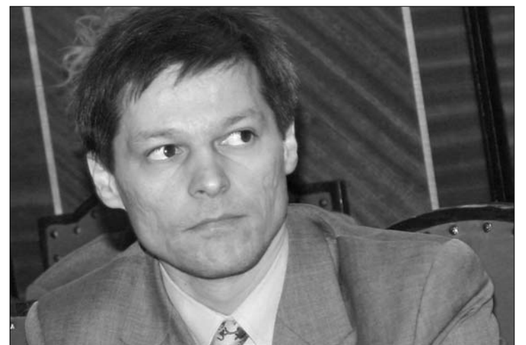
Ciolos: nem Franciország, hanem az Unió elkötelezettje vagyok

között azzal érvel, hogy Ciolos Franciaországban szerzett egyetemi oklevelet és francia nőt vett el feleségül. Az írás szerint a biztos francia elkötelezettségét bizonyítja az is, hogy Nicolas Sarkozy államfő helyett nyitotta meg a múlt héten a párizsi mezőgazdasági kiállítást. „A kiállítást nem az elnök helyett, hanem a francia mezőgazdasági miniszter meghívásának eleget téve nyitottam meg. Hálás lennék, ha a lapban megjelent elemzések a biztosi minőségemben végzett tevékenységemből indulnának ki” – replikázott Ciolos a L'Humanité -nek. ◀