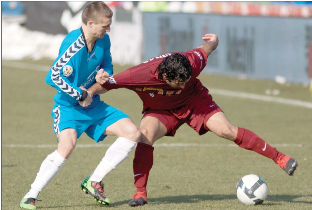
Leérantották Galacon a Kolozsvári CFR-t. A Szamos-partiak 1-0-ra kaptak a Liga I-ben

Elégedetlenek voltak az eredménnyel a bukaresti Ștefan cel