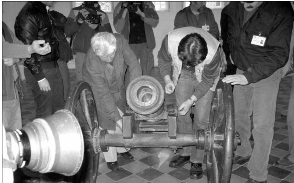
Fotósok célkeresztjében a Gábor Áron készítette ágyú, amely Kézdivásárhelyre érkezett