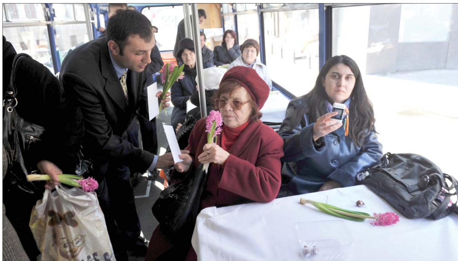
Virágok a villamoson. Ünnepi különjáratral kedveskedett március 8-ra Bukarestben a hölgyeknek a román fővárosi közszállítási vállalata

Idén ünneplik meg századszor az 1910-ben alapított március 8-i nemzetközi nőnapot