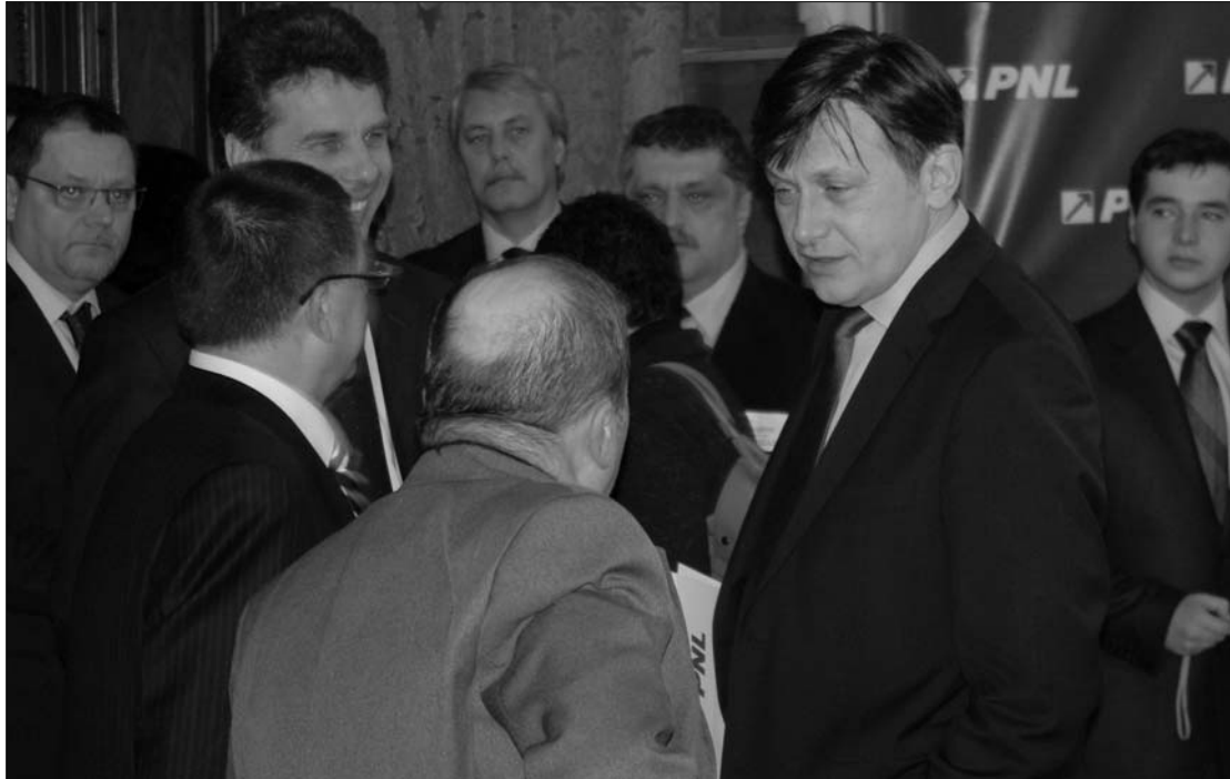
Crin Antonescu (jobbra) saját embereivel vette körül magát a PNL elnökségében

Victor Ponta szociáldemokrata pártelnök gratulációjába kritika is keveredett, ugyanis azt kívánta a liberálisoknak, hogy nyerjék vissza belső demokráciájukat. Takács Csaba, az RMDSZ ügyvezető elnöke „korrekt és civilizált küzdelemként” értékelte a