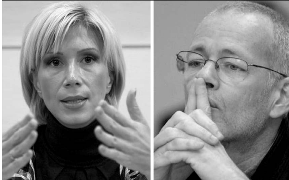
„Sassunak távoznia kell”. Raluca Turcan PD-L-s képviselő szerint Alexandru Sassu a PSD tévéjévé tette a TVR-t

Márton Árpád az ÚMSZ azon kérdésére, hogy mennyire megalapozottak Turcan kijelentései elmondta, tény, hogy a tévé 2009-es költségvetése 25 százalékkal kevesebb volt, mint a 2008-as. „A PSD által javasolt Sassu vezette intézmény a Țăriceanu vezette liberális-RMDSZ-es kormánytól többet kapott, mint a PSD-PD-L kormánytól. Ezek a tények. A többi spekuláció” – összegzett lapunknak a képviselő, majd hozzátette „nagyjából úgy nézett ki, hogy az intézményt előkészítették a csődre, hogy menesztessék a vezérigazgatóját”