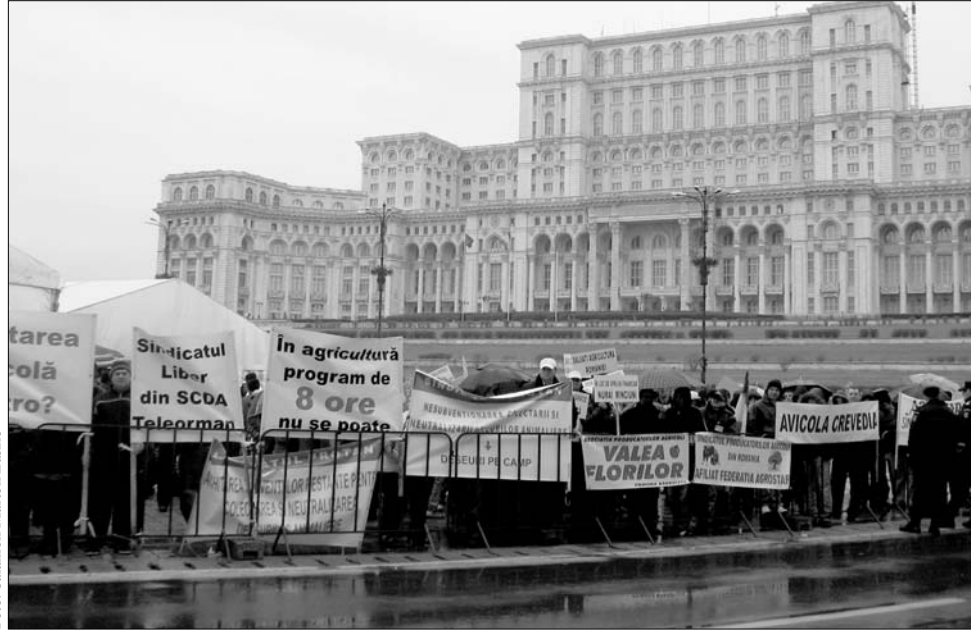
A tegnapi tiltakozók állatokkal és traktorokkal felszerelve térhetnek vissza érdekeiket kiharcolni

„Eddig 990 millió lej elmaradás halmozódott fel tavalyról – a pénzügyi válság tíz-húsz százalékos termeléseszkökhöz vezetni idén” – mutatott rá a szakszervezeti vezető, az utóbbi húsz év egyik legsiralmasabb mezőgazdasági évét jósolva idénre. Amint az Eurostat, valamint az Országos Statisztikai Hivatal felmérései bizonyítják, uniós szinten is sereghajtó Románia: az egy hektárra számolt mezőgazdasági termelésben csupán Bulgáriát előzve meg. ◀