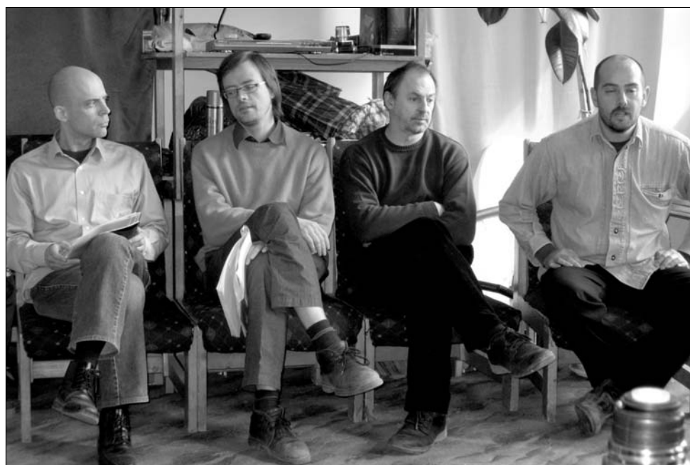
A gyergyószentmiklósiak előadása nemzetközi csapat együttműködésében jöhetett létre

Az előadás a világnapján tűzték műsorra.