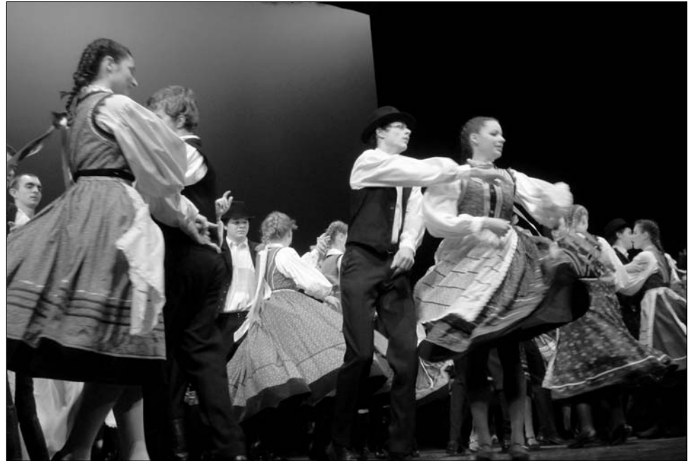
A „Kinek szíve merre vezet” című műsor ihlető motívuma a szenvedélyes keresés és egymásra találás volt

Az idei évnyitó gálaest a magyarság hagyományából építkezett. A Kinek szíve merre vezet című műsor ihlető motívuma a szenvedé-