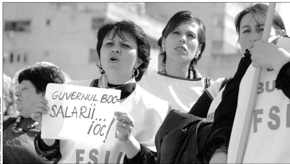
Elszabadultak az indulatok Buzăuban, csendőrök vezették el a türelmüket vesztett pedagógusokat

Az aradi pedagógusokat a Demokrata Tanügyi Szakszervezet szólította sztrájkba. „A megye minden oktatási intézményében leállt a tanítás két órára, a gyerekek