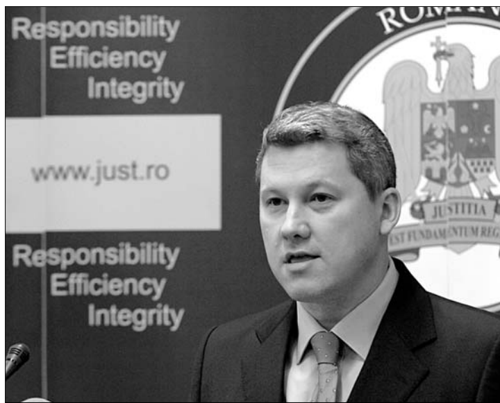
Cătălin Predoiu igazságügyi miniszter csak mentegetőzni tudott

mány, a parlament és a bírói testület mindent megtett ezen a téren, amit megtehetett. A tárca vezető úgy vélekedett, fontos, hogy a reformért felelős tényezők közös programot dolgozzanak ki. A miniszter hangsúlyozta azt is, hogy a jelentés pozitívan értékeli az Országos Korrupcióellenes Ügyosztály (DNA) és az Országos Feddhetlenségi Ügynökség (ANI) tevékenységét. A jelentés ugyanis pozitívumokat emel ki a Feddhetlenségi Ügynökség kapcsolatában, bár szóvá teszi, hogy az ANI ellenőrző szerve, az Országos Feddhetlenségi Tanács (CNI) hatékonyságát illetően még sok a tennivaló. ◀