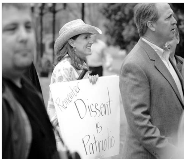
Nashville, 2009 – az első „teaparti” helyszíne

ba jutott bankok, valamint a General Motors és a Chrysler segítségére. Utóbbiakban a Barack Obama vezette demokrata adminisztráció állami részesedést szerzett, és elődjénél is nagyobb szabású kormányzati beavatkozást hajtott végre a pénzügyi szektorban. Noha a közzéadások többsége egyetért azzal, hogy amerikai kormányzati és jegybanki beavatkozás nélkül a recesszió nagy valószínűséggel gazdasági világválsággá súlyosbodott volna, a Tea Party követői azt tartják, hogy az alapító atyák nem gyámkodó államként képzeltek el Amerikát. Az utolsó csepp a pohárban Obama egészségügyi reformjának meghirdetése volt, amely a meggyőződéses konzervatívok szerint egyenesen „szocialista”. A vádat többször a mostani elnök fejéhez vágták a republikánus jelölt támogatói. Utóbbi, John McCain