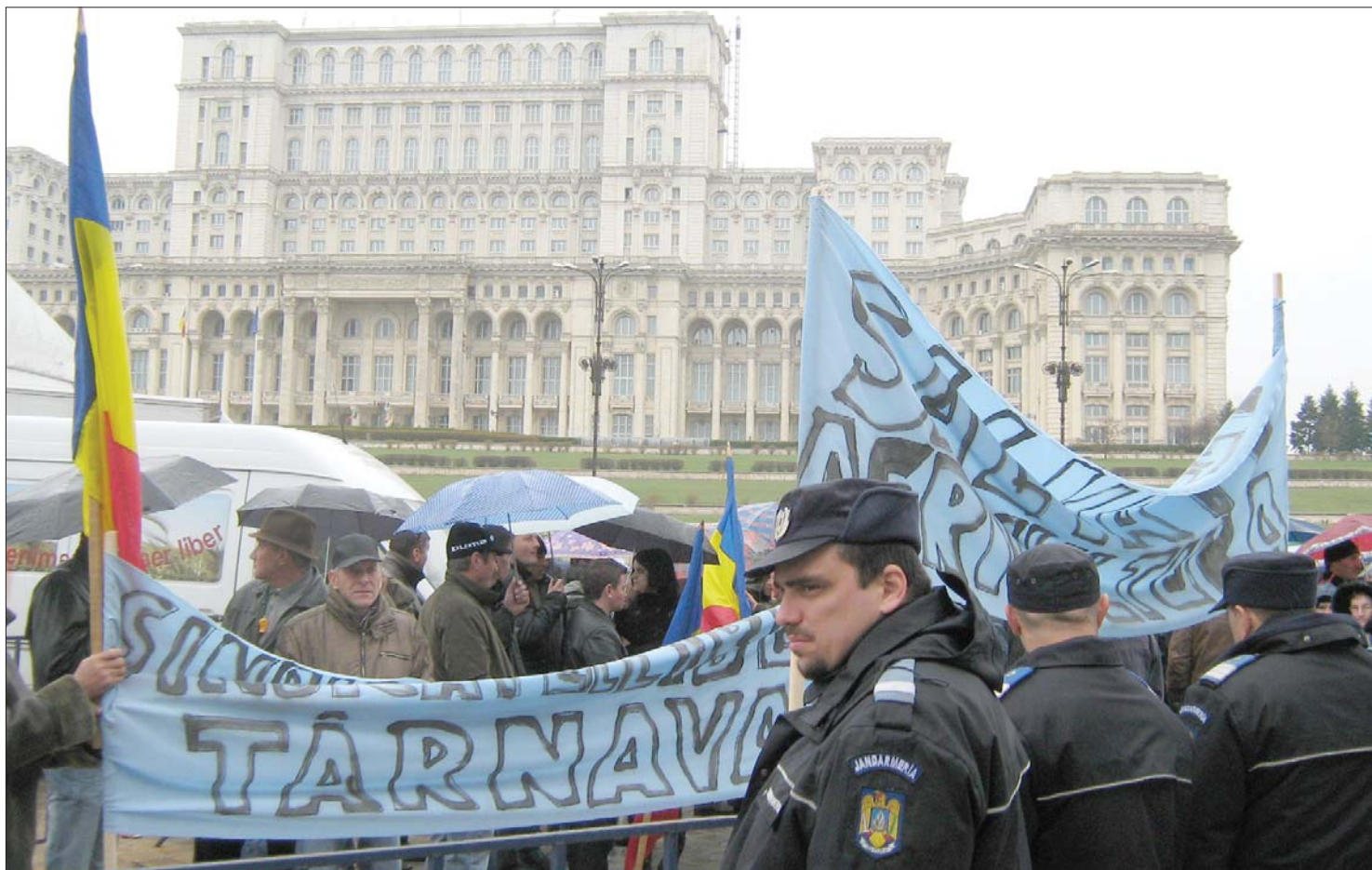
Tüntetés, esőben. Erdélyi megyékből, többek közt Fehér és Maros megyéből is sok gazda érkezett a fővárosba, a tegnapi tüntetésre.

A mezőgazdasági szubvenciók elmaradása ellen tüntettek Bukarestben a gazdák