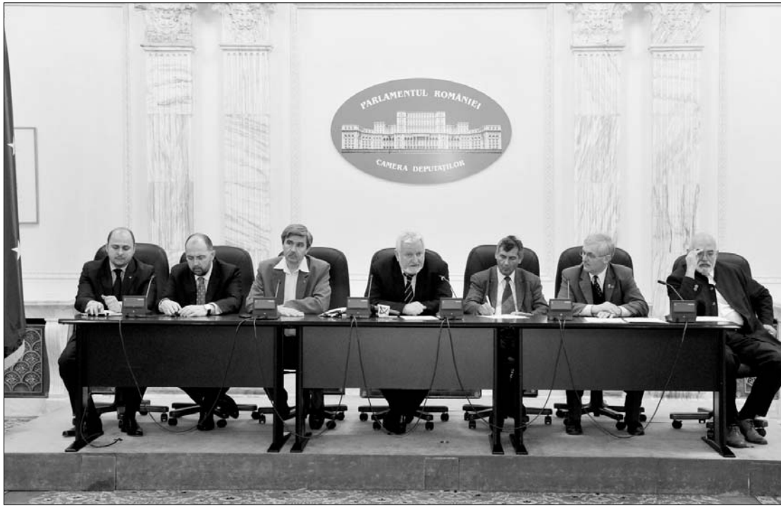
A Hargita, Kovászna és Maros megyei RMDSZ-es honatyák bocsánatkérést várnak Victor Ponta PSD-elnöktől.

Mint ismeretes, a maroshévi memorandumot fogadtak el, amely szerint a három megye román lakosságának naponta harcolnia kell „román identitásának megőrzéséért”. Szerintük a Székelyföldön állam alakult állam belül, saját zászlóval, himnusszal, címerrel és hivatalos nyelvvel. Felszólították a hatóságokat, hogy lépjenek fel a szeparatista és revizionista törekvések ellen, és utasítsák el a kisebbségi törvény elfogadását, emellett olyan jogszabály elfogadását sürgetik, amely a román nyelvnek „közigazgatásban használatos egyedüli nyelv státuszt biztosít”. ◀