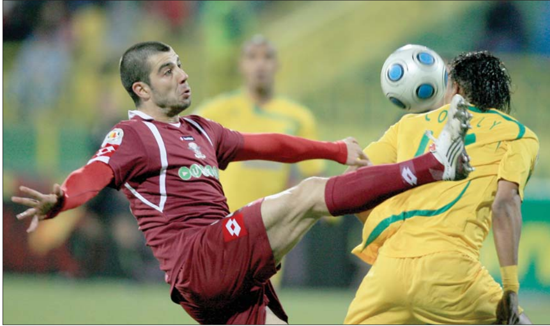
A Rapid labdaérintései eredménytelenek voltak Vasluion, a házigazdák otthon tartották a pontokat