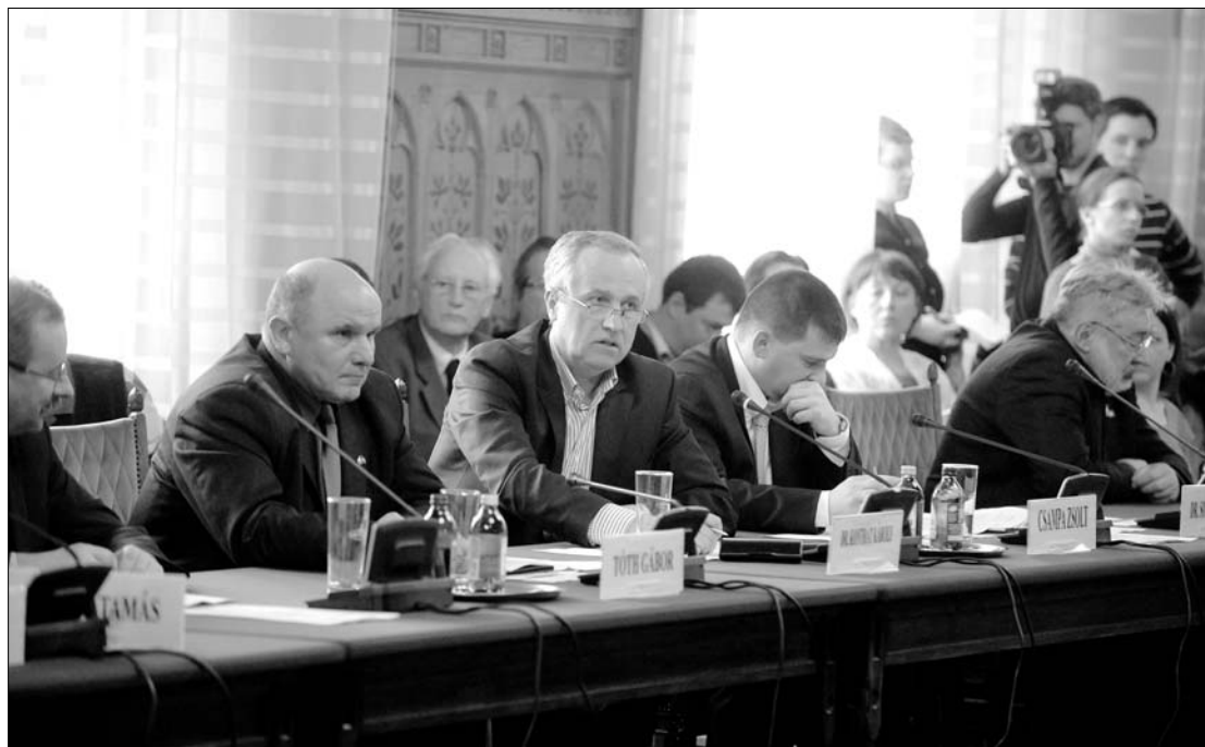
A honvédelmi miniszter a parlament honvédelmi és rendészeti bizottsága előtt adott számot a történetéről