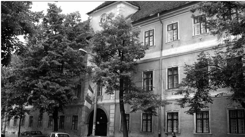
A kolozsvári Református Kollégium épülete. Kiemelt támogatást várnak a felekezeti iskolák