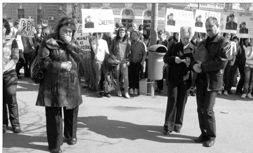
A másfél hónappal ezelőtt, alig 17 évesen elhunyt T. Norbertet siratták a demonstráción.

ban kaptak volna szakszerű orvosi ellátást” – panaszkolta lapunknak egy elkeseredett anya. Többen arra hívták fel a figyelmet, hogy a megyei kórházban pénteken leáll az élet, és akármilyen sürgős beavatkozásra van szükség az