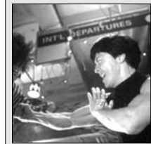
0.30 SWAT: Robbanófejű akció (amerikai akciófilm, 2005)

6.00 Híradó, Sport, időjárásjelentés 8.00 Jó reggelt Razvannal és Danival 10.00 Sajtószemle Mircea Badeaval 11.00 Benny Hill (sor.) 12.00 Különleges ügyosztály (amerikai krimisorozat) 13.00 Híradó, Sport, időjárásjelentés - Oana Frigescu 14.00 Egy rém rendes család (amerikai vígjáték-sorozat) 14.30 Mutassalak be a szüleimnek (ism.) 16.00 Híradó, Sport, időjárásjelentés 17.00 Közvetlen hozzáférés Madalin Ionescuval 19.00 Híradó, Sport, időjárásjelentés 20.30 Labdarúgás: Pandurii Tg Jiu - Steaua 22.30 Balhé Bronxban (hongkongi-kanadai akció-vígjáték, 1995)