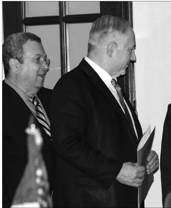
Benjamin Netanjahu izraeli kormányfő, Barack Obamától kijövet

Hillary Clinton külügyminiszter az AIPAC Izrael-barát amerikai lobbicsoport éves tanácskozásán bírálta Izraelt, amiért a közel-keleti békefolyamatot veszélyezteti a kelet-jeruzsálemi lakásépítés folytatásával. Kijelentette, hogy az Egyesült Államok Izrael iránti támogatása „szilárd, megingathatatlan, tartós és örök”, ugyanakkor megállapította: az újabb izraeli építkezés a vitatott hovatartozású területen aláaknázza Amerika azon képességét, hogy segíteni tudjon az arab–izraeli viszály befejezésében. ◀