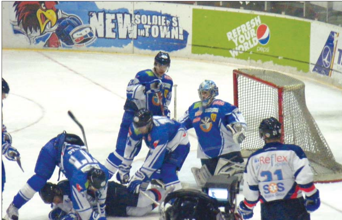
Szabályos volt a csíkiak igazolása, már csak a szövetségi büro módosíthat a Steaua elleni eredményen