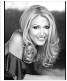
1.00 Visszaszámlálás (spanyol filmsorozat)