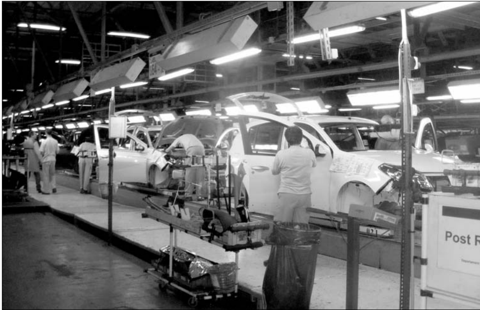
A Dacia megszászorozta eladásait. Naponta 1000-1400 autó hagyja el a gyárat

A Renault világautójának szülőhelyeként ismert Mioveni-Pitești-i Dacia-gyár nyugodtan nevezhető a környezetvédelmi minisztérium által elindított roncsprogram egyik legnagyobb nyertesének. Ezen kívül azonban a környezetvédelmi