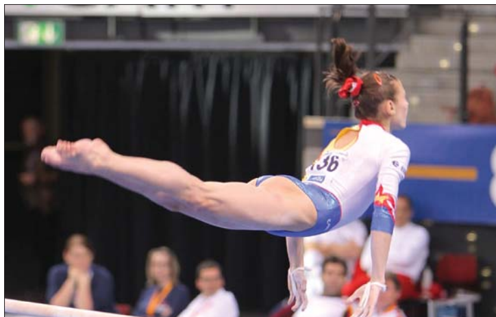
Most hétvégén Lille-ben, majd Bukarestben tornásznak a román lányok

komoly emberek legalább hat hónappal előtte elküldik a meghívókat, a színvonalas szövetségek pedig idejében elkészítik a versenynaptárat. Ennek ellenére Németországból, Magyarországról, Görögországból, Törökországból, Franciaországból valamint Quatarból jeleztek részvételi szándékot, és reméljük, hogy a britek is eljönnek majd” – mondta. Románia nemzetközi tornászviadala előtt azonban a hazai válogatottnak néhány tagja most hét végén felkészülési versenyre utazik. A nők a franciaországi Lilleben, míg a férfiak Hollandiában szerepelnek. A viadalok után összeállítják Románia keretét az idei Európa-bajnokságra: a férfiak április 21–25-én, míg a nők április 28. és május második között bizonyíthatnak Birminghamban. ◀