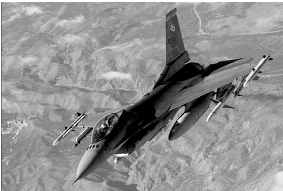
Az amerikai gyártású F-16-os vadászpilóta – a „helyzet magaslatán”

A hetvenes években gyártott F-16-os tavaly a leginkább használatos vadászpilóta volt. 2001 óta ezt a repülővetik be az iraki és afganisztáni háborúban is. Eredetileg a General Dynamics tervei alapján készült, majd a Lockheed Martin tökéletesítette az amerikai légierő számára. A licenc alapján Törökországban és Dél-Koreában is gyártásban vett típusból húsz ország vásárolt eddig. Súlya rakomány nélkül közel kilenc tonna, rakománnyal elérheti a húsz tonnát. Hossza csaknem tizenöt, fesztávolsága közel tíz, magassága majdnem öt méter. Óránkénti 2500 kilométeres sebességgel repül, ez kétszerese a hangsebességnek. ◀