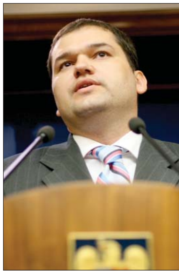
Cseke Attila egészségügyi miniszter

▶ Felháborodást keltett a lakosságban az Egészségügyi Minisztérium terve, amely szerint a jövőben azoknak is fizetniük kell az egészségügyi ellátásért, akiknek van érvényes biztosításuk. A szaktárca néhány napja bocsátotta közvitára az úgynevezett egészségügyi hozzájárulásról szóló törvénytervezetet, amely – ha a parlament is elfogadja – július elsejétől lépne érvénybe. „Sokszor tapasztaljuk, hogy még a biztosításunknak megfelelő ellátásban sem részesülünk, mert nincs elég támogatott gyógyszer, vagy műszer, vagy szakember. Ahelyett,