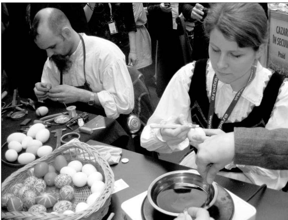
A tojás-himzés eszköztára a Székelyföld egyes településein folyamatosan gyarapodik

„Tagadhatatlan, hogy a hímes tojás dísz tárggyá kezd válni, és már az emberek többsége nem is érti a rajzokat, virágokat, színeket, ahogyan azt sem, hogy ez, az egykoron pogány szokás mit is jelentett a háromezer évvel ezelőtti hitvilágban,