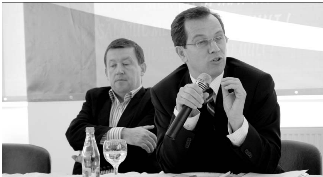
Sógor Csaba európai parlamenti képviselő üdvözölte a Lisszaboni szerződés hozta változásokat

ságnak volt döntésjoga az eddigiekben. Nehezményezte, hogy a változások ellenére az Európai Uniónak még nincs közép-, és hosszú távú mezőgazdasági stratégiája. Kérdésre válaszolva Sógor Csaba elmondta, hogy a kistermelők jövője se annyira sötét, mint amilyennek azt egyesek megpróbálják lefesteni, ugyanis 2007-ben több mint 13 millió efajta, 12 hektárnál kisebb területtel rendelkező magán- és családi vállalkozás volt az EU-ban. ◀