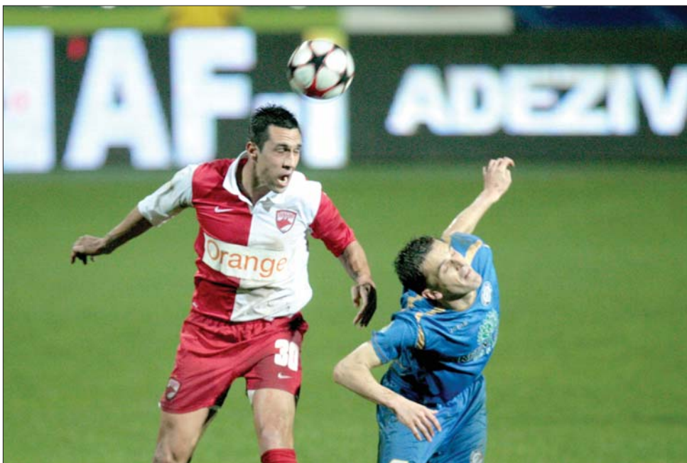
Urziceni–Dinamo fejszata: mindkét fél futballistái négy-négy gólt szereztek a rangadón.

Mérgelődtek Temesváron is, hiszen a csapat tegnap 1-0-ra kikapott a vendég Vasluitól, és így a moldvaiak két ponttal megelőzték őket a tabellán. A Brasó-Kolozsvári CFR-mérkőzést lapzártánk után rendezték. ◀