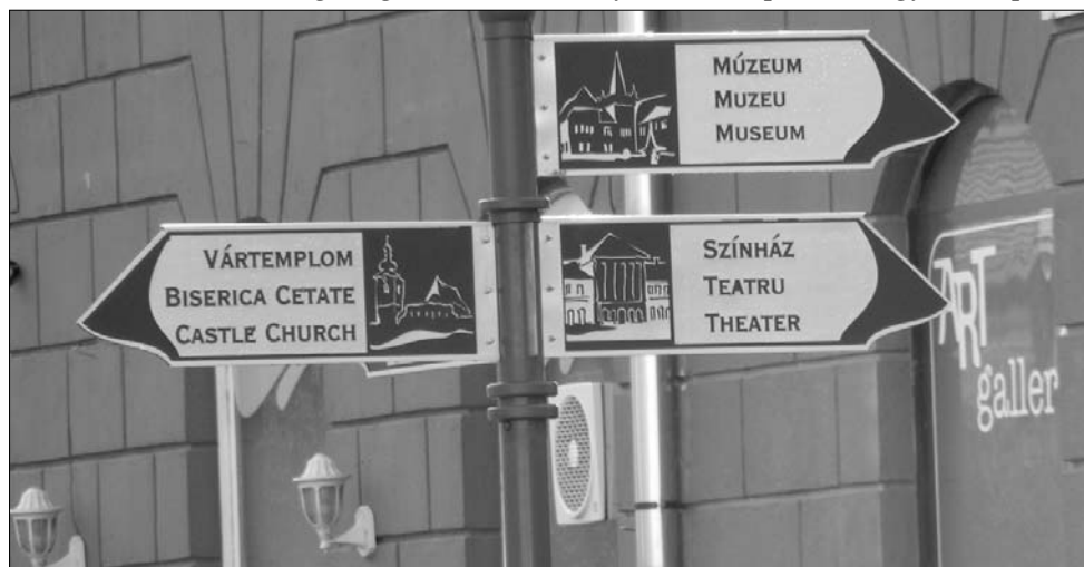
Az útjelzőtáblák nyelve szűrt szemet a megrögzött feljelentőknek Sepsiszentgyörgyön