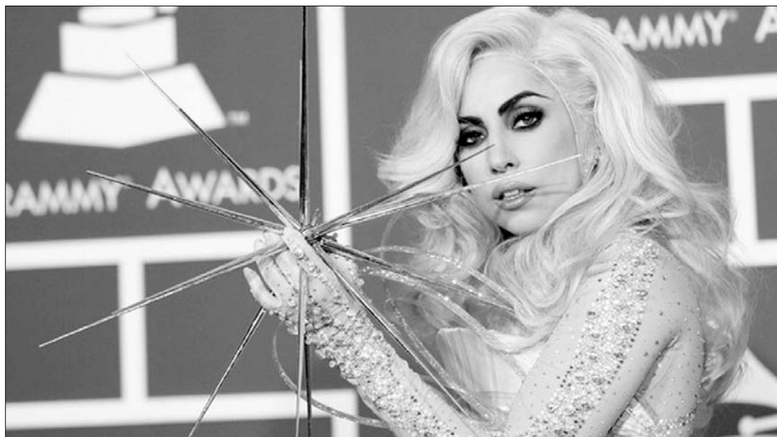
A Visible Measures szerint Lady Gaga három klippje egymilliárd nézőt vonzott

A Visible Measures szerint Lady Gaga videói immár túl vannak az egymilliárdos nézettségen az interneten. A videóelemzéssel foglalkozó cég több mint kétszáz videómegosztó oldal ( YouTube, DailyMotion, Vimeo stb.) nézettségi adatait összesíti, és adatai alapján rendszeresen összeállítja a 100 Million Views Club listát azokból a videókból, amelyek meghaladták az egymilliós nézettséget. Ugyan ezt Soulja Boy Crank Datje vezeti, de Lady Gaga egyedüli előadóként három videóval is fent van rajta: Poker Face (375 millió), Bad Romance (360 millió), Just Dance (273 millió). A 24 éves énekesnő ezzel poptörténelmet írt, ugyanis egy zenekar/előadó sem érte még el eddig ezt a számot. A nemrégiben debütált, hatalmas feltűnést keltő Telephone című videoklippje nem is szerepel az auditban, pedig már annak is 10 millió felett van a nézettsége.