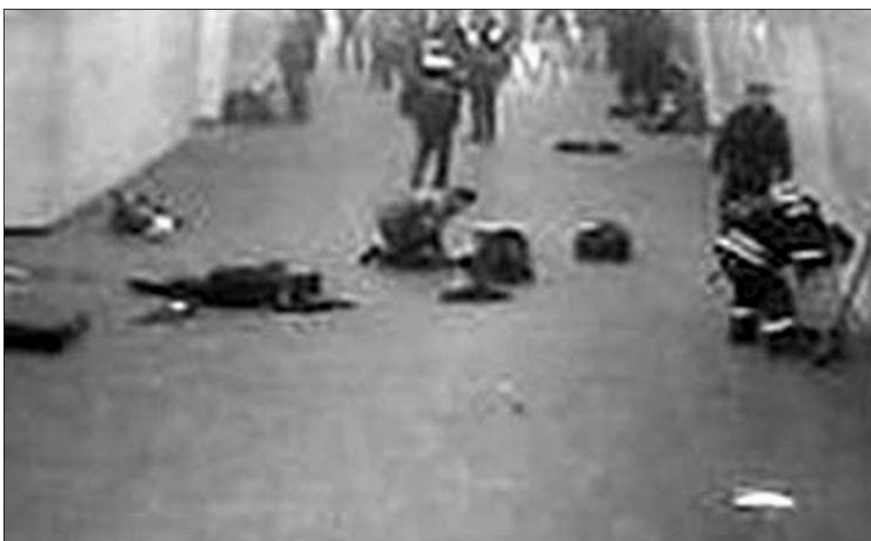
Moszkvai metróállomás – röviddel a kettős terrorista merénylet után

Emlékeztetőül elevenítsük fel az elmúlt tíz esztendő legvéresebb oroszországi merényleteit. (Moszkvában vol-