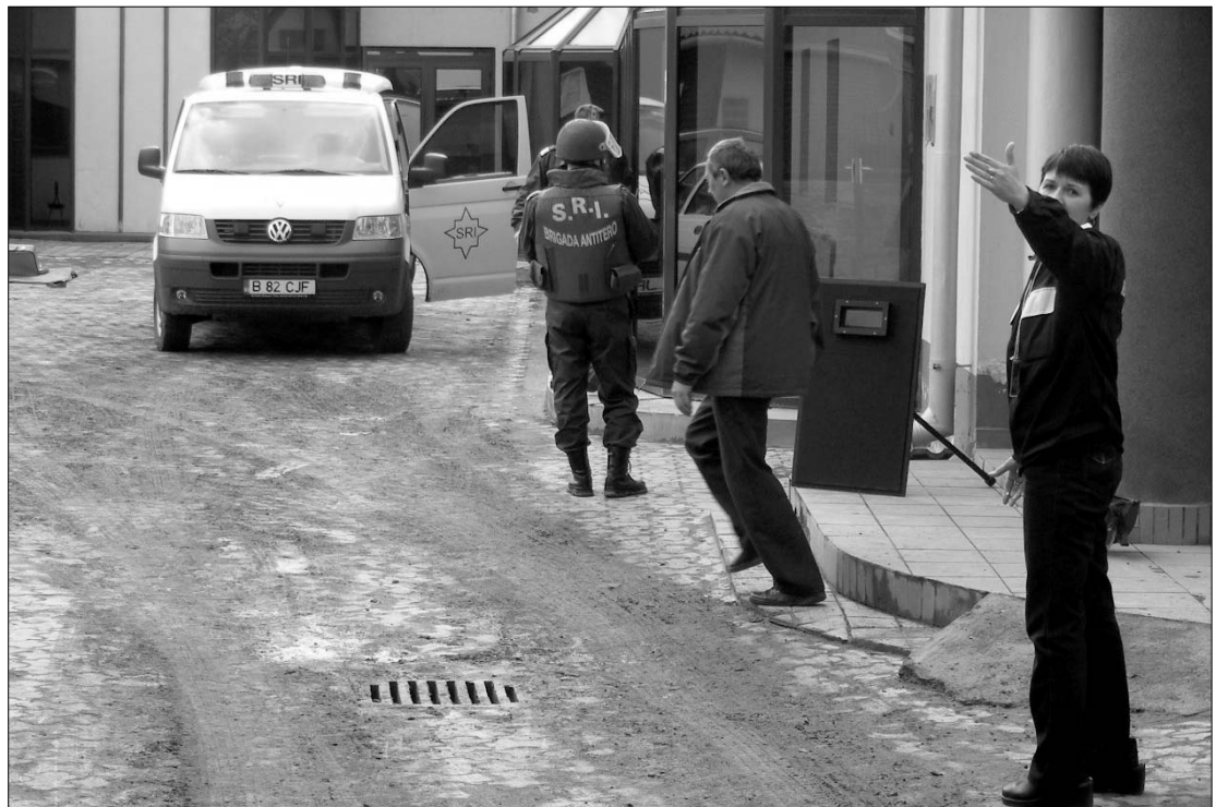
SRI-sek a sepsiszentgyörgyi Munkás utcában. Potyára riasztották a tűzserészeket