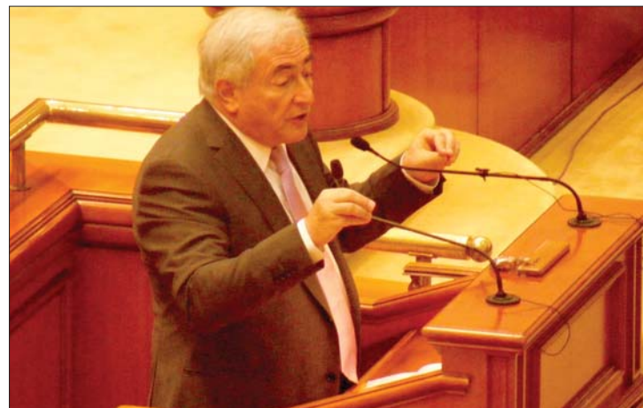
Dominique Strauss-Kahn, a Nemzetközi Valutaalap vezetője.

▶ „Románia nehéz pénzügyi helyzetben van, de a román kormány intézkedései remélhetően javulást idéznek elő. A monetáris politika terén viszont jobb a helyzet” – összegzett Dominique Strauss-Kahn, a Nemzetközi Valutaalap első embere tegnapi bukaresti látogatása végén. 6. oldal ▶