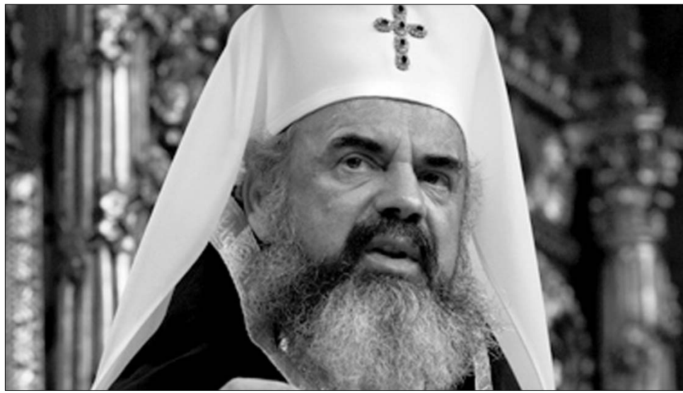
Daniel pátriárka bekeményít

Ortodox papok az utóbbi időben évi rendszerességgel imádkoznak eső idején a szárazságért, aszály idején az esőért, jó időben pedig bárokat szentelnek fel, mindezt pedig teljesen hivatalosan, egyháruk beleegyezésével tehetik. Az önmagát fő államvallásnak tartó ortodox egyház hírnevének az sem tesz túlságosan jót, hogy bátorítja a babonákat és – saját gyakorlatával – a sarlatánokat. ◀