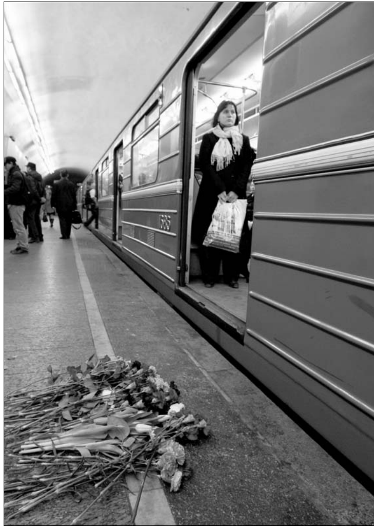
Virág az áldozatoknak. Moszkvában tegnap gyásznapot tartottak

Vlagyimir Putyin kormányfő tegnap a tömegközlekedés biztonságának javításáról tartott tanácskozást, s azt mondta, a rendvédelmi szervek számára becsületbeli ügy, hogy elfogják a hétfői merényletek szervezőit, s bizonyos benne, hogy meg is teszik. ◀