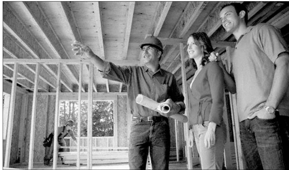
Az egyik Maros megyei település helyi tanácsosai szerint egy tömbház megépítése volna az ideális

Már a program lehetősége is felpozícionálta több vidéki település életét. A Maros megyei Erdőszentgyörgy is jelentkezett az új falurehabilitációs programra, az önkormányzat pedig bizakodó.