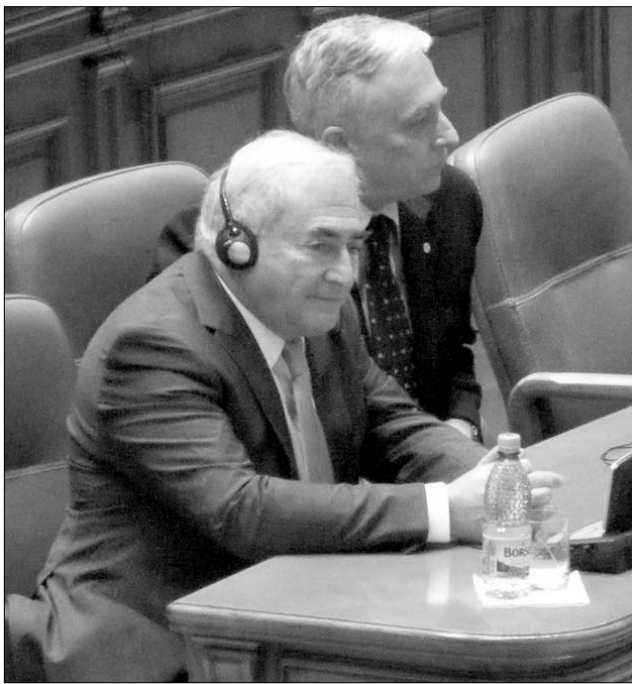
Strauss-Kahn elégedett a romániai monetáris politikával

„Románia nehéz pénzügyi helyzetben van, de a román kormány intézkedései remélhetően javulást idéznek elő. A monetáris politika terén viszont jobb a helyzet” – összegzett Strauss-Kahn látogatása végén. A nemzetközi pénzügyi vezetője ugyanakkor figyelmeztetett, hogy nem beszélhetünk a gazdasági válság végétől, amíg a munkanélküliség nem kerül csökkenő pályára – utalva a jelenlegi 8,3 százalékos rátára, mely szerint a következő hónapokban még növekedni fog.