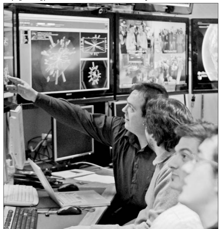
A tegnap reggelre tervezett kísérletet néhány órára el kellett halasztani