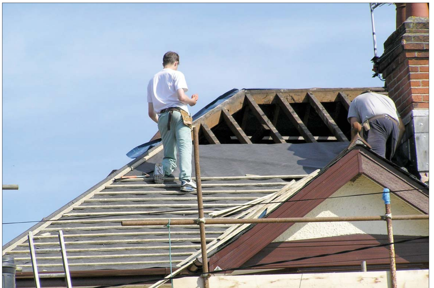
A helyi önkormányzatok telket és infrastruktúrát biztosítanak az otthonteremtéshez, a kormány pedig a beruházást finanszírozza.

Szolgálati lakásokkal csalogatná a vidéki településekre az értelmiségieket a kormány