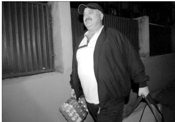
Cătălin Voicu „a legszükségesebbeket” vitte magával a börtönbe

Előzőleg a felsőház állandó bizottsága elutasította Voicu szenátor kérését, hogy a plénum előtt védhessen meg magát azokkal a korrupciós vádakkal szemben, amelyek miatt a szenátus már korábban felfüggesztette mentelmi jogát. A házbizottság azért nem adott helyt a kérésnek, mert úgy ítélte meg, hogy a korábbi eljárás során betartottak minden szabályt. Cătălin Voicu arra alapozta kérését, hogy mivel a szavazás napján kórházba került, sérült az a joga, hogy a mentelmi jogáról történő szavazáskor ő is kifejezhesse álláspontját. Ellenben a fel-