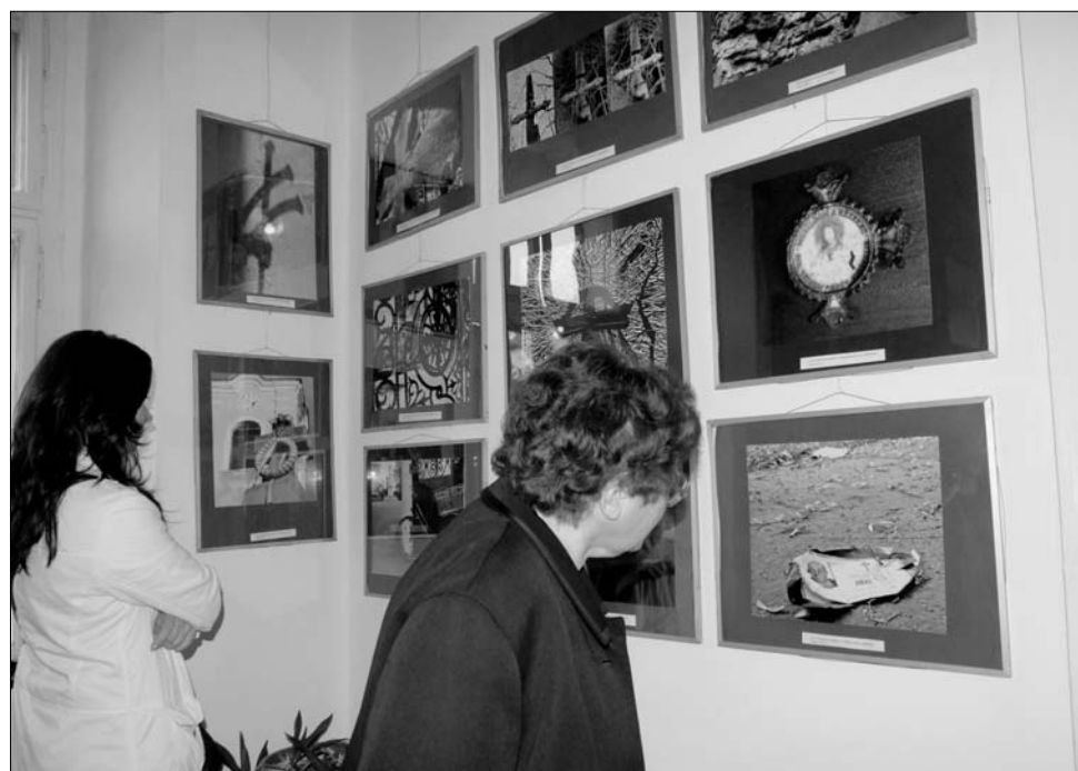
A fotós a keresztet többféle kontextusban látta, élet és halál szimbólumaként mutatja be.