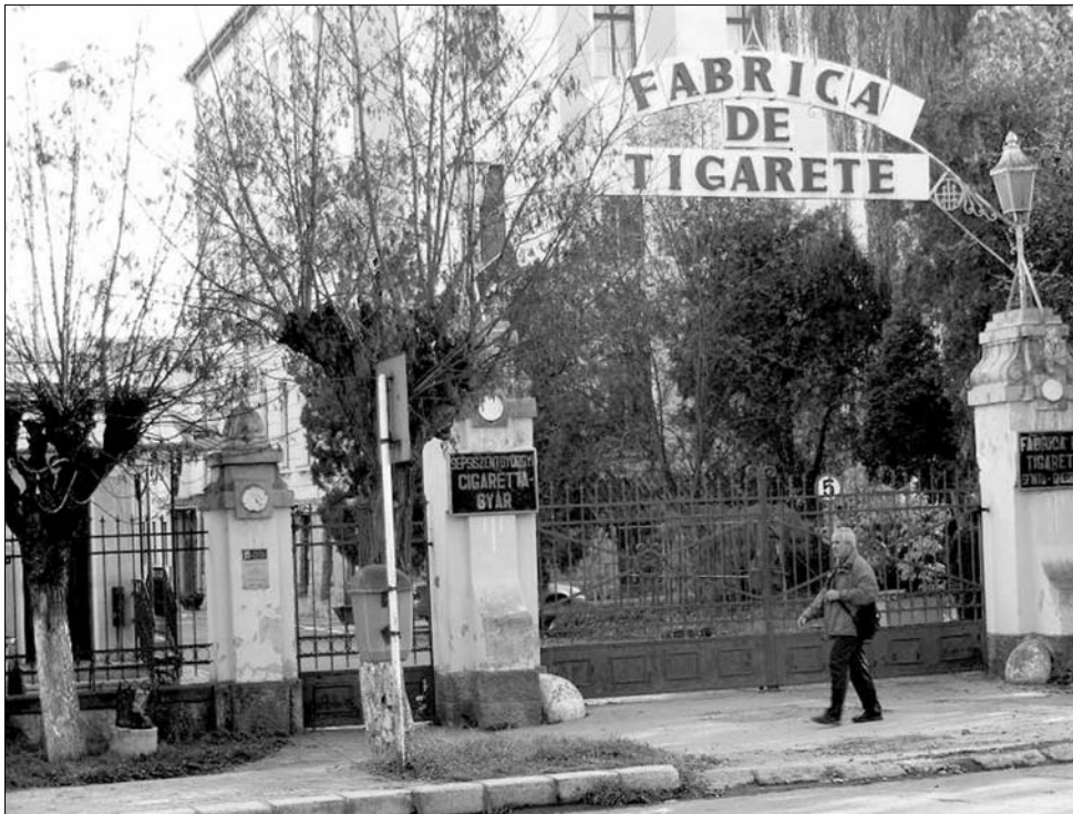
Hamarosan lekerülnek a pecsétet és a lakatok a sepsiszentgyörgyi cigarettagyár kapujáról

Közben tizenhat éves csúcsra emelkedett a magyar munkanélküliségi ráta is: 2009 decembere és 2010 márciusa között 11,4 százalékot mértek. Egyetlen hónap alatt 24 ezerrel nőtt az állástalanok száma. Szakértők egy csoportja úgy véli, hogy a kedvezőtlen statisztika mögött a nyugdíjba vonulás feltevélinek változása is állhat: január elsejétől ugyanis az 1952 után született korosztályok fokozatosan, 62 helyett 65 éves koruk után válnak jogosulttá az öregségi ellátásra. ◀