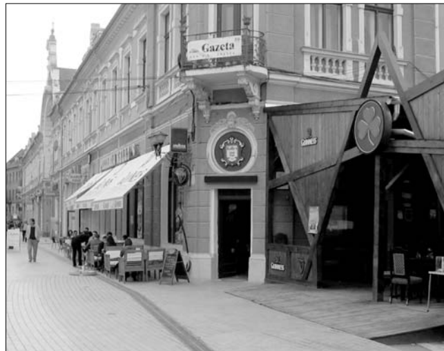
Ki ahol éri? Vendéglőterasz Nagyvárad belvárosában A szerző felvétele

Megtudtuk, a bárók nyitvatartási rendje is számos nézeteltérést okozott, ezért a továbbiakban a nagyváradi sétálóutcán található vendéglőteraszok hétvégén éjfélig, a történelmi városrészben levők 23 óráig tarthatnak nyitva. Ilie Bolojan polgármester a városrendezési tervvel kapcsolatban elmondta, az átszervezés jelentős befektetést is igényel. „A teraszok megfelelő elhelyezése, szabványnak megfelelő berendezése sok pénzbe kerül, ezért a fenntartónak mérlegelnie kell, tudja-e vállalni ezt az áldozatot vagy sem” – figyelmeztetett az előjáró. Ellentmondásosan nyilatkozott lapunknak az új rendelkezésről egy érintett klubtulajdonos. „Azzal mi is tisztában vagyunk, hogy nagyon sok zavart okoz a jelenlegi helyzet. Van, akit csak a gyors jövedelem érdekel, és ezért nem nyújt igényes szolgáltatást, az ilyen befektető valószínűleg visszariad egy nagyobb beruházástól. Sokan azonban úgy véljük, hogy ez a város és ez a városkép megéri a ráfordítást, hosszú távon nekünk is hasznos lehet az egységes, rendezett vendéglátás” – nyilatkozta lapunknak az üzletember. ◀