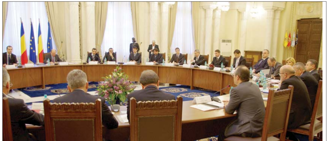
Bár sokan tartottak tőle, Traian Băsescu államfő nem verte az asztalt a tegnapi találkozón

kérést” – nyilatkozta lapunknak a Cotroceni-palotában tartott konzultáció után Kelemen Hunor művelődési miniszter. 3. oldal ▶