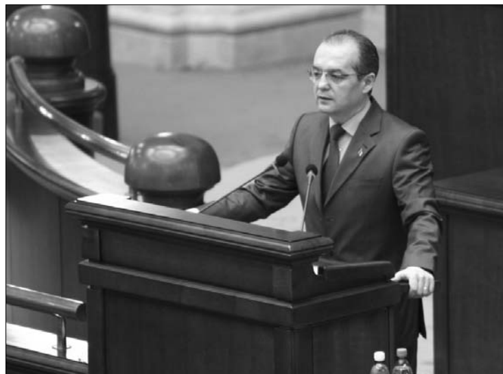
Emil Boc kormányfő megbecsüléséről biztosította a katonákat

► A nyugdíjtörvény kétszáz cikke közül csupán ötön tudta átrágni magát a szenátus plénuma de a jogszabály további vitáját jövő hétre halasztották, mert felmerült annak a veszélye, hogy több törvénytervezet hallgatólagosan elfogadásra kerül. A felsőházi vitán részt vett Emil Boc kormányfő is, aki a Nemzetközi Valutaalap (IMF) által szorgalmazott, a romániai nyugdíjrendszer átalakítását előíró új nyugdíjtörvény-tervezet elfogadását sürgette. A miniszterelnök arra figyelmeztette a honatyákat, hogy a nyugdíjreform nélkül összeomlik a rendszer, ugyanis az ország költségvetése nem teszi lehetővé a hiányzó összegek folytonos kipótlását. A kormány egységesíteni akarja a nyugdíjrendszert úgy, hogy megszüntetné az úgynevezett speciális járandóságokat. Ezt az intézkedést az IMF fogalmazta meg egyik feltételeként, a Románia által tavaly márciusban megkötött csaknem 20 milliárd euró értékű, többoldalú hitelmegállapodás keretében. Boc arról biztosította a szenátorokat, hogy a kiemelt nyugdíjak újraszámolása következtében csak a háromezer lej fő-