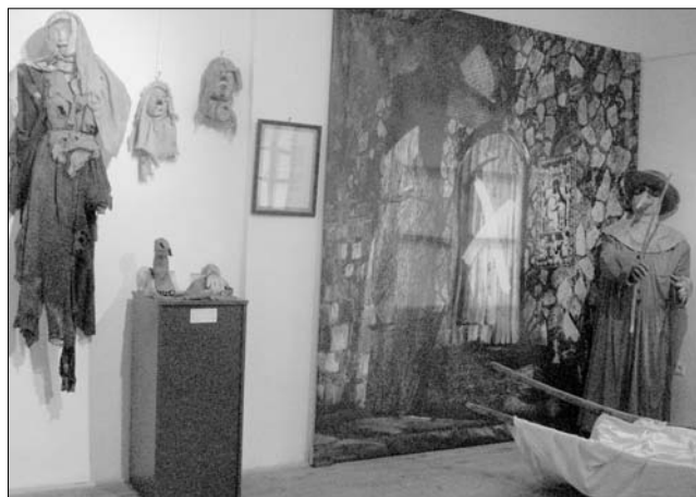
A vándorkiállítás utolsó állomása Marosvásárhely.

A várban, a Maros Megyei Múzeum kiállításoknak otthont adó épületben látható a Semmelweis Orvostörténelmi Múzeum, Könyvtár és Levéltár vándorkiállítása, amely a székesfehérvári múzeumok után Marosvásárhelyen is megtekinthető. A tárlat tíz perces filmmel indít, amelyből a látogató megtudja, mit is jelentett az évszázadokon keresztül pusztító járvány, amely senkit sem kímélve többször is átírta a történelmet, birodalmak sorsáról döntött, királyok bukását okozta, nemzetek életét pe-