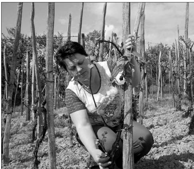
Újvárosban még divat a régi erdélyi karikás szőlőművelés