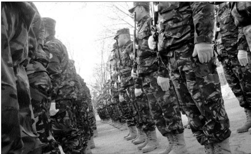
Az elavult felszerelésre panaszkodnak a külföldi bevetésre induló román katonák

Gabriel Oprea honvédelmi miniszter a „jóság követeként” bocsátotta újtukra a most indulókat, a tárcavezető szerint rendkívül fontos Románia nemzetközi megítélése szempontjából az ilyen jellegű küldetés. A lapunknak nyilatkozó katonák közül többen úgy vélik, a román különítmények nincsenek biztonságban. „Védelmi szempontból kiszolgáltatottak vagyunk, eszközeink elavultak, szegényesek. Szép dolog a hazaszeretet, de legtöbben a pénzért megyünk, és bizony nem vagyunk túlfizetve” – magyarázta a lapunknak nyilatkozó érintett. Mint mondja, szerencsés esetben kétezer eurós havi zsoldért teszi kockára az életét az, aki külföldön teljesít ilyen feladatot. A most útnak indulók fél évig tartózkodnak Bosznia-Hercegovinában, ők biztosítják majd a békefenntartó egységek zavartalan munkáját, felügyelik a szarajevói katonai támpontokat, ellenőrzik a civil lakosság biztonságát, és segítségére lesznek a hírszerzésnek is.