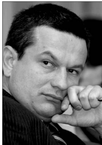
Asztalos Csaba

► Új mandátumot kapott Asztalos Csaba az Országos Diszkriminációellenes Tanácsban (CNCD), ugyanis a parlament két házának együttes plenáris ülése tegnap megszavazta a csonka testület „feltöltését”. A titkos voksoláson az RMDSZ által javasolt Asztalos mandátumát 243 igen és egy ellenszavazattal erősítették meg. Egyes sajtóinformációk szerint a pártok közötti tárgyalások eredményeként Asztalos lesz a testület elnöke. Mint ismeretes, a CNCD több tagjának tavaly ősszel járt le a mandátuma, és a politikai bizonytalanság miatt mostanáig elodázódott a helyek feltöltése. Asztalos mellett most mandátumot kapott még Anamaria Panfile (PD-L), Vasile Alexandru Vasile (nemzeti kisebbségek), Sonia Claudia Vlaș (PNL), Cristian Jurca és Ioana Liana