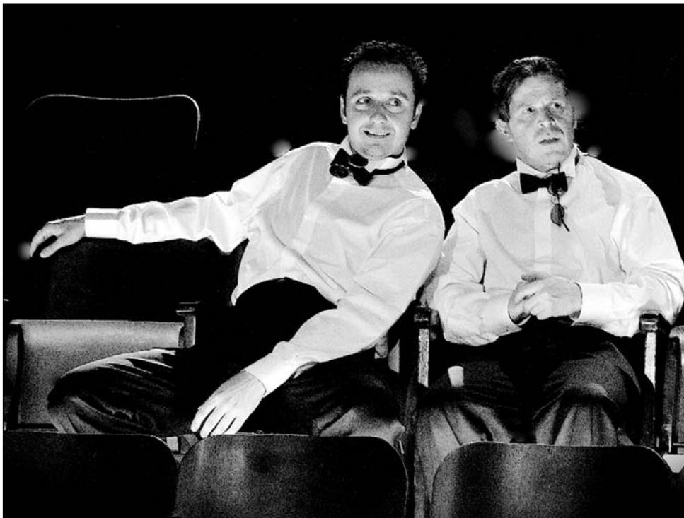
A címszereplő Rosencrantzot és Guildenstern alakító színészek a díjat hozó előadásban.

„Lehetetlenség felvenni a harcot egy kitörő vulkán és az Európa légerét megbénító hamufelhővel. Az izlandi vulkán kitörése lyukakat, hézagokat ejtett az idei gála tervezett műsorán, hiszen sokan nem tudtak eljönni” – vezette fel a 18. gálát a műsorvezető, Ion Caramitru. A legrangosabb hazai színházi elismerésnek számító UNITER-díjak gálájának történetét humorosan felelgetve arra a következtetésre jutottak a szervezők, hogy ha a kerek az eddigi tendenciát követve csökkenek, akkor hamarosan a szövetség elnökének irodájában fogják megtartani. „Ha még rosszabbra fordulna a helyzet, akkor sms-ben fogják értesíteni a jelölteket és díjazottakat” – jegyezte meg valaki.