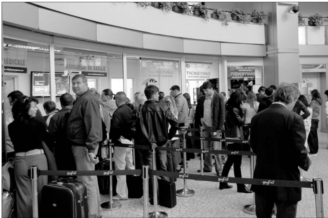
A bukaresti Băneasa repülőtéren tegnap tizenhárom járatot kellett törölni

Az Európai Unió tagországnak közlekedési miniszterei – az Eurocontrol és más szakértői fórumok véleményét meghallgatva – hétfőn állapodtak meg abban, hogy fokozatosan enyhíteni fogják a légtérhasználatra vonatkozó korlátozásokat, amelyeket az izlandi vulkánkitörés miatt kellett elrendelni. Megállapodásuk nyomán tegnap reggeltől folyamatosan növekszik a légi forgalom a