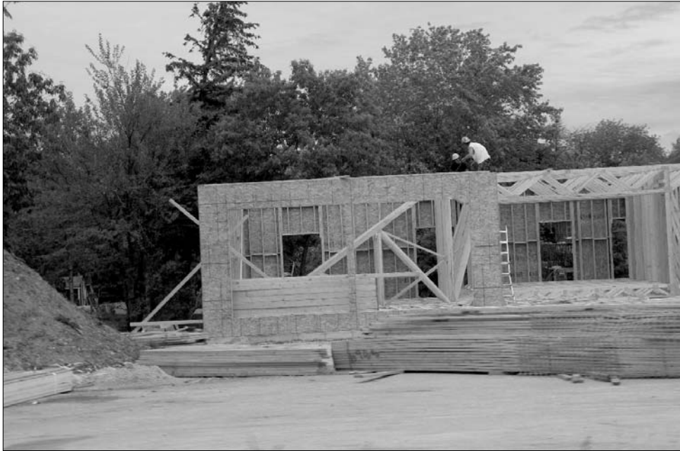
Bár nagyobb keretösszegekből gazdálkodhatnak, több kitétel is hátráltathatja a házépítőket

Tizenhét hónap alatt kell megépülniük azoknak a lakásoknak, amelyeket az Első ház kormányzati hitelgaranciának köszönhetően emelnének. Ezenkívül igazoltan ez épített tulajdonában kell lennie derült ki a Hivatalos Közlöny -ben frissen megjelent határozatból. (A késlekedő hiteltörlesztők legfennebb egyéves türelmi idővel számolhatnak.) A tulajdonosnak azt is be kell bizonyítania, hogy rendelkezik az építkezési költségek minimum öt százalékával, továbbá zárt bankszámlán elhelyezni háromhavi törlesztésnek megfelelő összeget. Bár ily módon erősen leszűkül az építetők mozgásterét, a törvény kedvező kitételekkel „kárpotolja” a leendő ingatlanulajdonosokat: