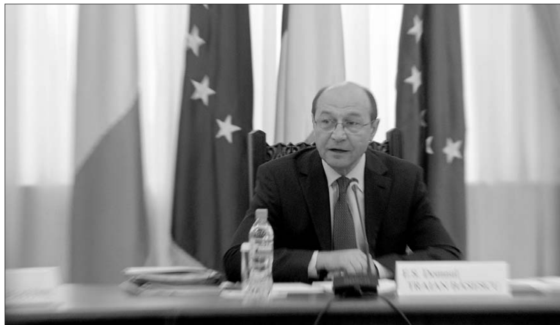
A résztvevők szerint az államfő nem a fenyegető, hanem a segítő szándékú tanár szerepét játszotta