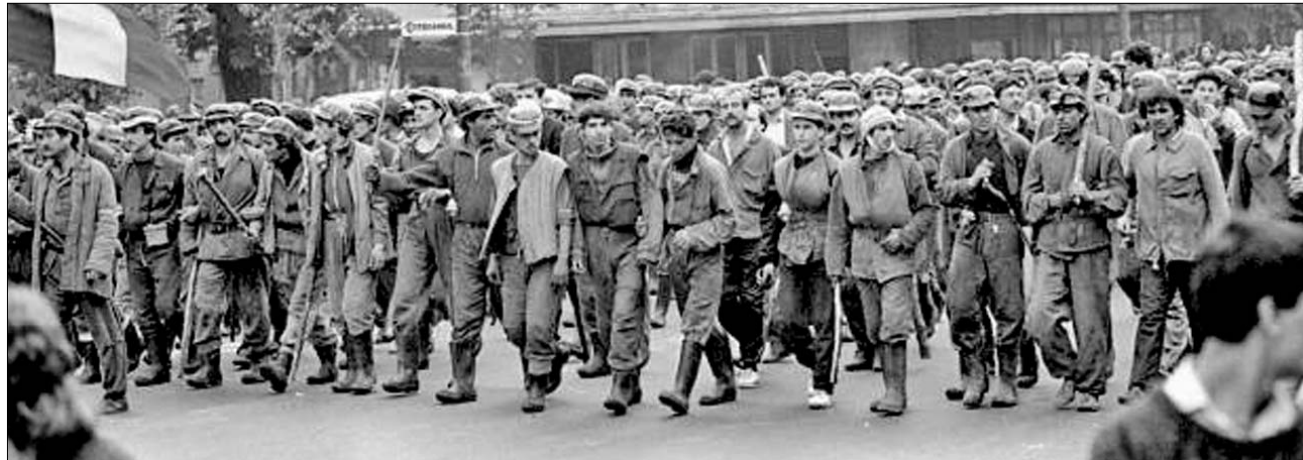
1990. június. Rohamra kész „bányászhadosztály” a bukaresti Magheru sugárúton

A bukaresti Egyetem térszelleme azonban azóta is él és ma is a szabadság, a demokrácia romániai szimbóluma maradt. ◀