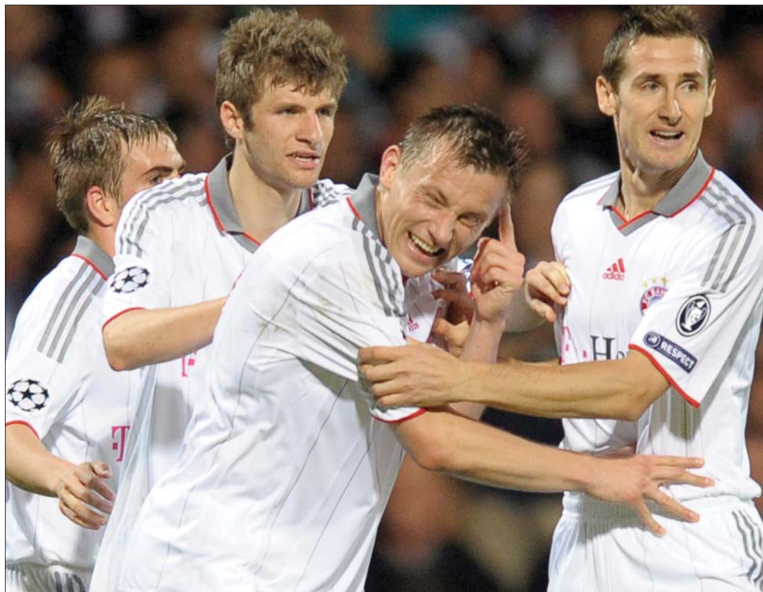
Ivica Olić mesterhármását dicsérték és a döntőbe jutást ünnepelték a Bayern München játékosai