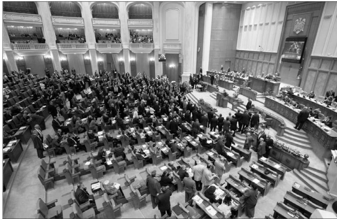
Csak kézzel sikerült. Felborzolta a kedélyeket az elektromos szavazórendszer meghibásodása

A képviselőház végül megszavazta az ANI-törvényt