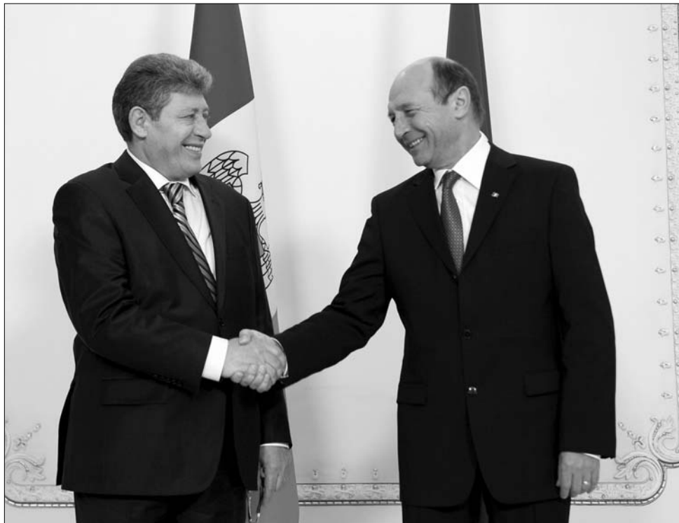
„Jégtörő” kézfogás? Mihai Ghimpu moldovai államfő és Traian Băsescu román elnök

Figyelemre méltó az is, hogy a vendég – és kedvéért nyilván a házigazda is – mindvégig nyomatékosan hangsúlyozta: a Moldovai Köztársaság megőrzi semlegességét. Ami egyébként nehezen is történhetne másé, miután azt az ország alaptörvénye szentesíti. Más kérdés az, hogy miként egyeztethető össze a semlegesség egy NATO-tagállammal aláírt stratégiai partnerséggel... ◀