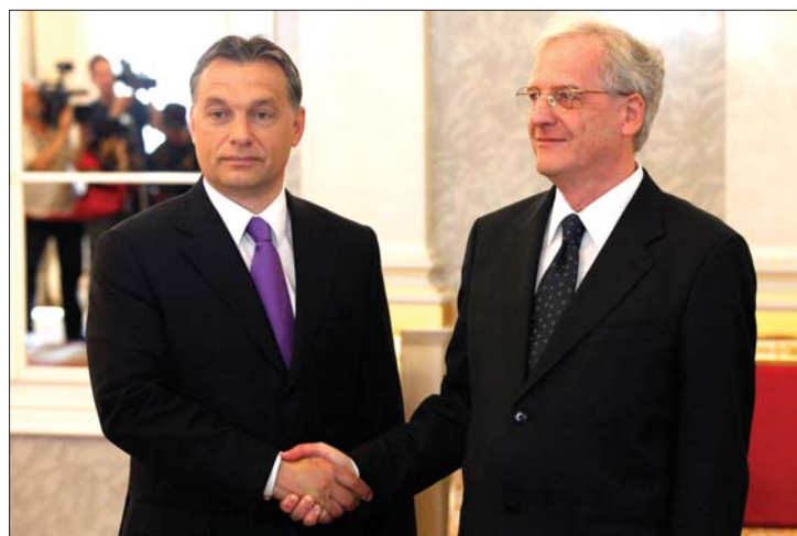
Orbán Viktor és Sólyom László a Sándor-palotában

▶ Orbán Viktort, a Fidesz-KDNP miniszterelnök-jelöltjét kéri fel kormányalakításra az Országgyűlés alakuló ülésén Sólyom László – közölte tegnap az államfő. A második Orbán-kabinetnek akár három erdélyi születésű tagja is lehet. 2. és 4. oldal ▶