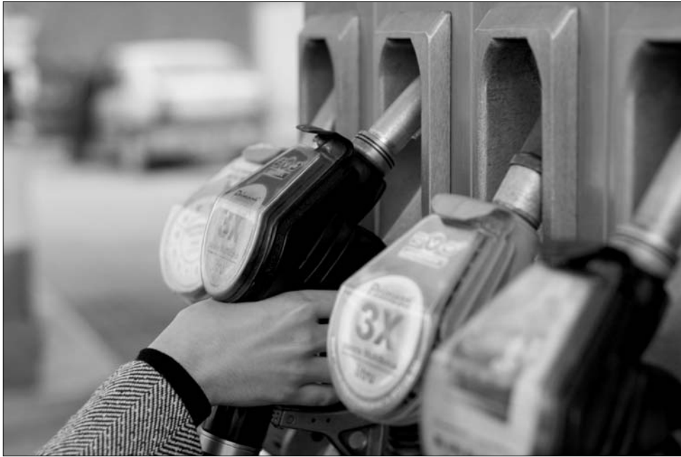
Szakemberek szerint három-öt év múlva tíz lejre drágulhat a benzin ára

Míg 1970 és 1979 között harmincnyolc százalékos növekedést ért el a globális üzemanyagkereslet (napi 47 millió hordóról 65 millióra), a nyolcvanas évek eleji olajválság alatt az igény visszaesett napi 59 millió hordóra. Bár drasztikusan csökkent az ár is, még mindig háromszáz százalékkal drágább volt az 1970-es szintnél. 1994-2008 között 24 százalékos növekedést ért el a globális kereslet, melynek következtében két évvel ezelőtti napi 86 millió hordóra volt szükség. Az „olajszomj” ezen szintjét a gazdasági válság is mindössze 7-8 százalékban tudta csökkenteni. ( khris.ro )