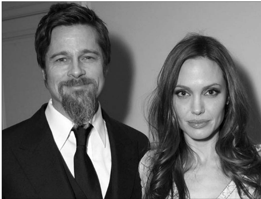
Házaspár lesz „brangelinákból”? Angelina Jolie és Brad Pitt a világ egyik leghíresebb sztárpárosa