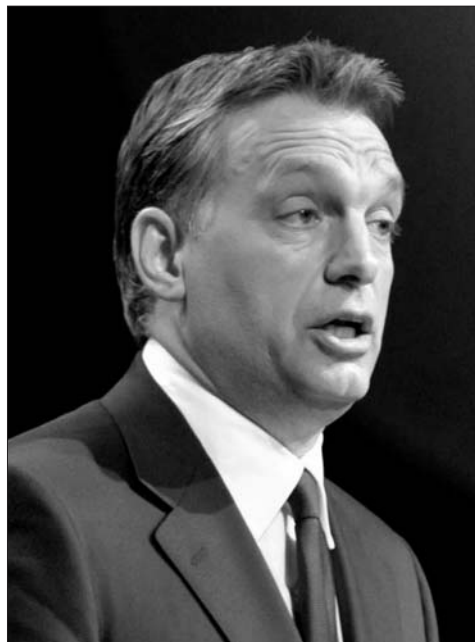
Orbán Viktor – új médiahivatal!