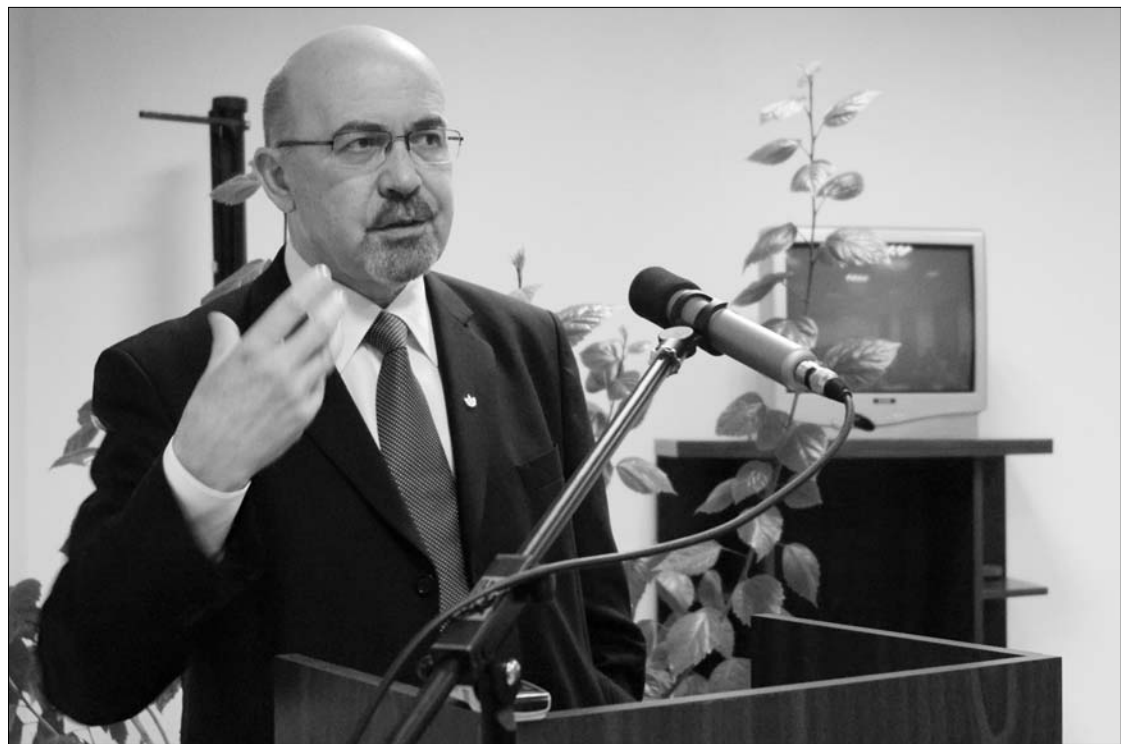
A tanügyi törvényről és az ezzel kapcsolatos koalíciós vitákról beszélt tegnap Sepsiszentgyörgyön Markó Béla.