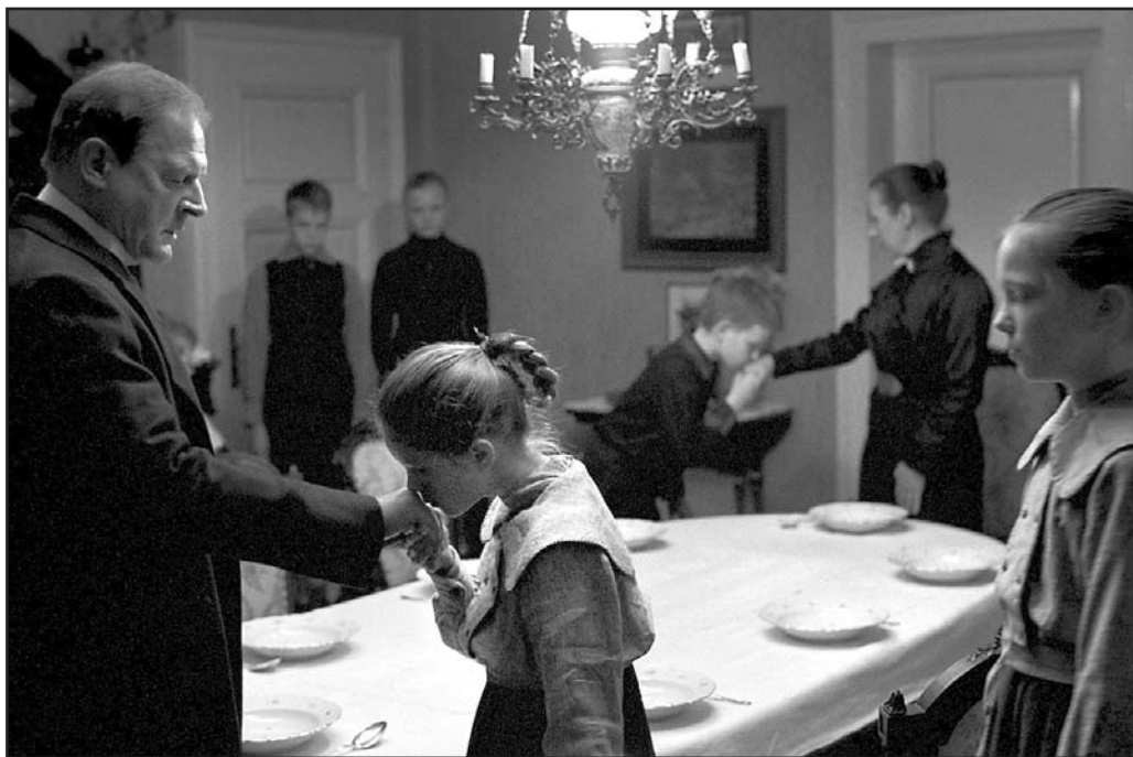
A neves osztrák filmes, Michael Haneke tavalyi alkotása a látszólag ok nélküli erőszak újabb „elemzése”