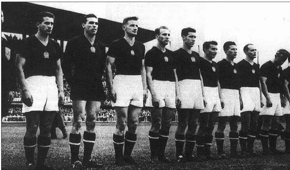
A halhatatlan Aranycsapat – amelynek már csak két tagja él

Amikor az Aranycsapat aranykönyvét írták, karonülőként semmiről nem tudtam. A kor szele azonban ko-