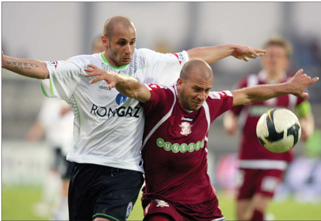
A Rapid csak egy gól nélküli döntetlenre volt képes Medgyesen, és így továbbra is csak hetedik

rom csapat verseng, közülük a 47 pontos Győr Kaposvárra látogat, a 46 pontos Zalaegerszeg a Budapest Honvédet fogadja, míg a 45 pontos Újpest az MTK vendége lesz. A sereghajtó Diósgyőr sorsa végleg megpecsételődhet szombaton, amennyiben vereséget szenved a 14., azaz éppen benmaradó helyen álló Paks otthonában.