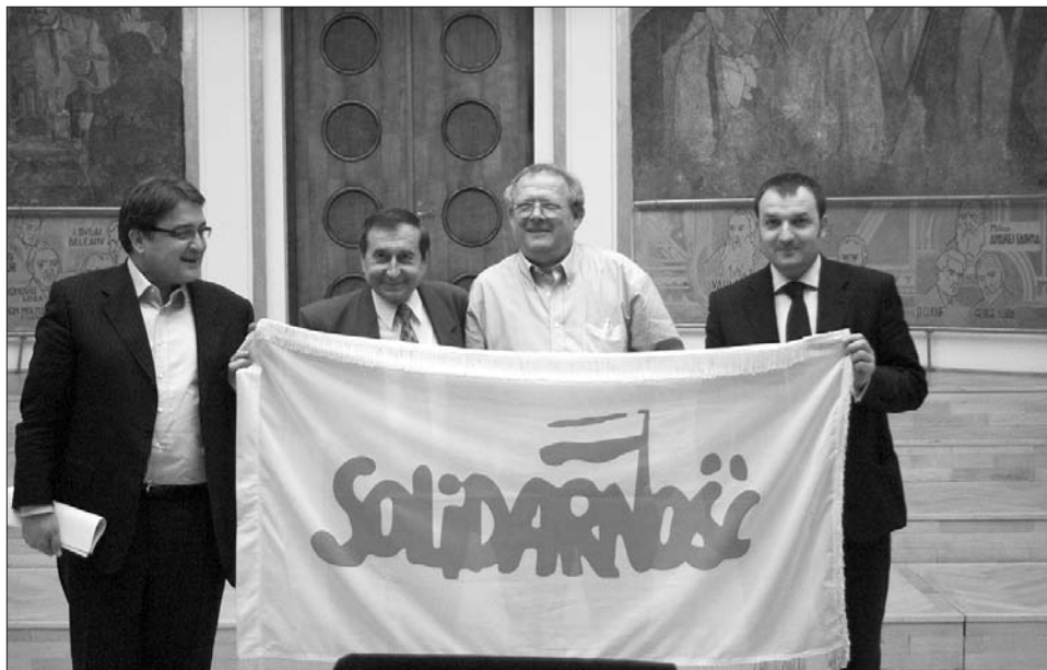
Volt egyszer egy Szolidaritás

lógus kifejtette, akit egyesek a náci rendszer elméleti megalapozójának tekintenek. A lakosságot meggyőzik arról, hogy az ország élte valójában az egyszerű ember számára átláthatatlan, hogy valahol a felszín alatt ott munkálkodnak állandóan a gonoszok erői. Másrészt viszont úgy tűntetik fel önmagukat, mint jó és életmentő hősöket, akik önfeláldozó harcot folytatnak a gonoszok ellen. Jelen pillanatban, több országban is a gonoszok erőt az oligarchák (mogulok) jelentik, az ellenük vívott harcuk pedig az