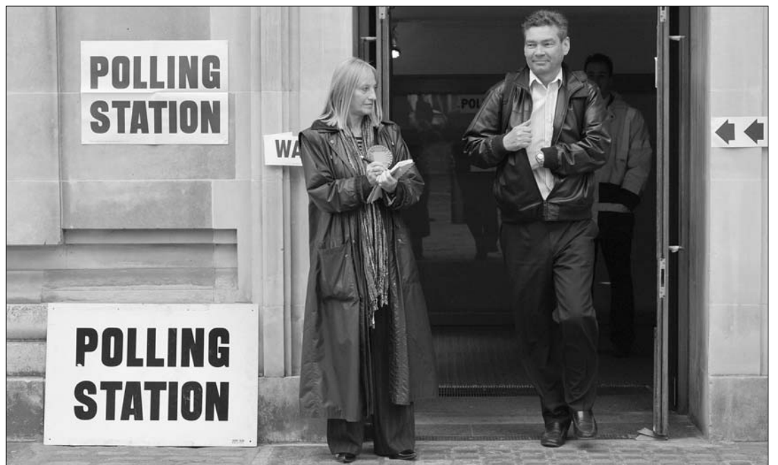
Nagy-Britanniában tegnap 45 millió bejegyzett választópolgárt vártak az urnákhoz