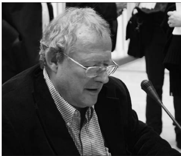
A mikrofonnál Adam Michnik

Kelet-Közép-Európában nincs semmiféle különbség a jobboldal és a baloldal között, mert mindkét politikai ideológia elveszítette eleven gyökereit, ha egyáltalán léteztek azok. Ebben a térségben igazán mérvadó különbség a nyílt, törvényeken alapuló államszervezet és a nemzeti, nacionalista, idegengyűlölő államszeret között, illetve a polgári társadalmon alapuló és a nacionalizmuson alapuló államszervezet között van. Lengyelországban a kommunizmus idején akadálymentesen tudott együttműködni a laikus Szolidaritás a katolikus egyházzal, a bársnyos forradalom után szakadék keletkezett, amely egyre nagyobb lett. A katolikus egyház is hatalmat akart, részt kért a politikai vezetésből. Így indult el a nacionalista hangvételű jobboldali mozgalom, amely később megszülte a Jog és Igazságosság Pártot, ez az alakulat pedig a gyanú és a félelem pártja. Arra a félelemre alapoz, hogy van egy ellenség, azt fel kell kutatni és meg kell harcolni vele, azt az elgondolást hangoztatja, hogy valaki tönkre akarja tenni az országot, meg akarja szerezni a vezetést; ennek az ellenségnek a kiléte még ismeretlen,