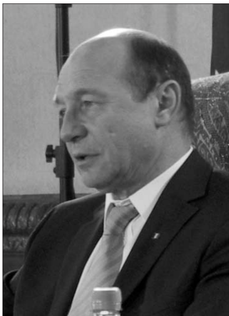
Traian Băsescu – új alkotmányt!