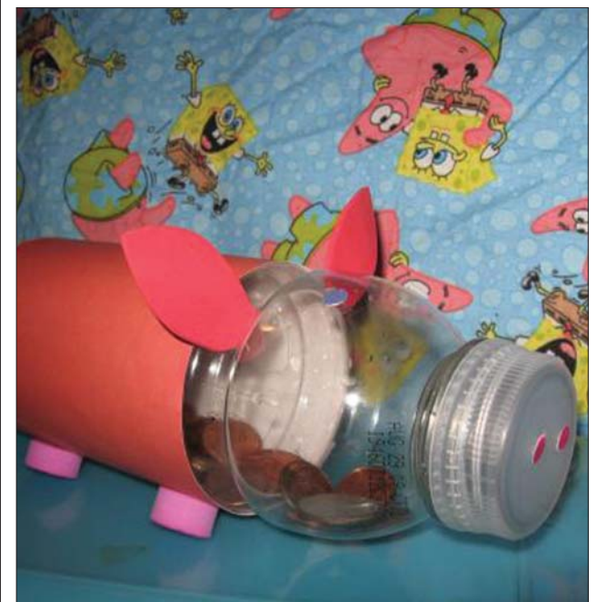
Hétfégi mellékletünk Életmód és Csodavár oldalait Orosz Anna szerkesztette

és ragaszd rá. Utána vágd ki a malacka fülét szintén rózsaszín kartonlapból, a flakonra kés vagy olló segítségével vágj két lyukat, a fül tövét nyomd bele a lyukakba és ragasztóval rögzítsed. Ragaszd fel lábnak a négy kisebb műanyagdugót. Végül a fülek tövébe ragaszd szemeket, és az orrnak két rózsaszín pöttyöt. A dugót le, fel csavarva ebben gyűjtögetheted az aprópénzt. Jó szórakozást.