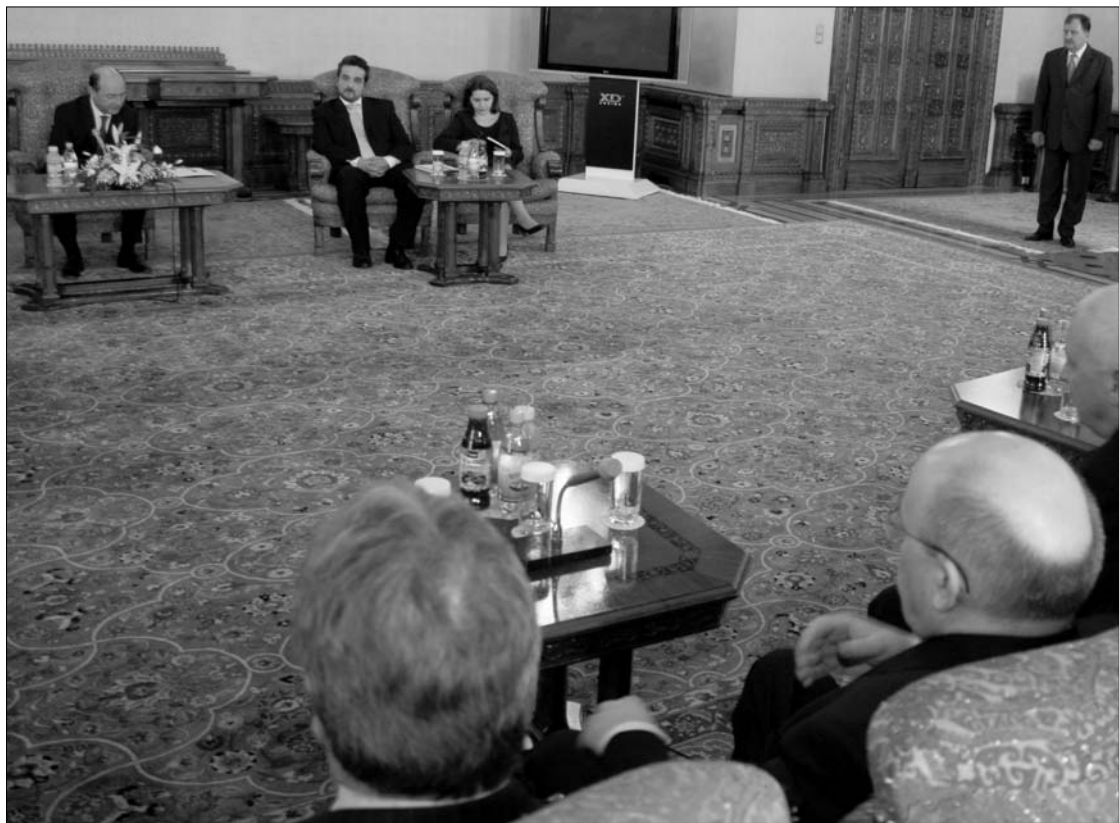
Az RMDSZ-es politikusok ma arról próbálják meggyőzni az államfőt, hogy ne bántsák a kisnyugdíjakat

Traian Băsescu államfő és felesége, Maria keresztelte meg Pál herceg és Lia hercegnő fiát, Károly Ferdinándot. A négy hónapos csecsemőt nemzeti viseletbe öltöztették az alkalomra, a keresztelő után pedig matróruhát adtak rá. (Adevărul) ► Csak igen kis mértékben biztonságos a Romániába telepítendő amerikai rakétaelfogó rendszer. A tesztelés során megbizonyosodott, hogy hatásköze alig 10-20 százalékos, azaz tíz rakéta közül mindössze egyet vagy kettőt semmisít meg. (Click) ► Az úgynevezett amerikai stílusú, fa- vagy acélstruktúrájú épületek egyre vonzóbbak lesznek a romániai házvásárlók körében. Jóllehet Romániában inkább a hagyományos épületstruktúrákat kedvelik, ezek a házak elsősorban viszonylag alacsony árai miatt népszerűek. (Gândul) ► Heves összecsapásra került sor Milánóban a rendfenntartók és román mintegy háromszáz tagú csoportja között. Utóbbiak Molotov-kövekkel támadtak a karhatalmiakra, több gépkocsit felgyújtottak. (România liberă)