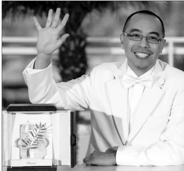
Az Arany Pálma a thaiföldi Apichatpong Weerasethakulé

A központ tervei között szerepel az is, hogy a neves néprajzgyűjtő hang-, fénykép- illetve videó-tárát is a nagyközönség és a kutatók rendelkezésére bocsássák, egy multimédiás teremben. Mint megtudtuk az alapítvány még idén elindítja a múzeum akkreditációs folyamatát. A kuratórium szeretné, ha a felavatott Népművészeti Központ egy kézműves házzal is kiegészülne. ◀