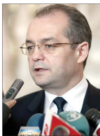
Emil Boc kormányfő

Megtörténhet, hogy a kormány már bejelentett megszorító intézkedései nem elegendők a gazdaság talpra állítására, és a közsféra megnyirbálása mellett jövőre adóemelésekre is szükség lesz. Ezt Emil Boc miniszterelnök ismerte el a hétvégén, amikor a munkaadói szövetségekkel tárgyalt a Nemzetközi Valutaalapról (IMF) szánt szándéklevélről. A dokumentumot holnapi ülésén készülni elfogadni a kormány. A szándéklevélben felsorolt megszorító intézkedéseket – köztük a 25 százalékos közalkalmazotti bércsökkenést és 15 százalékos nyugdíjlefaragást – tartalmazó