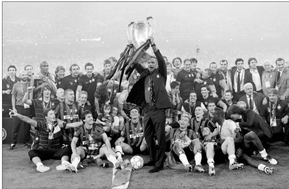
Mourinho a magasba emelte a Bajnokok Ligája-serlegét, de nem akar az Internél maradni

A korábbi BL-győztes Barcelona ugyan most lemaradt a fináléről, Lionel Messi mégis kiérdemelte az idei kirás gólkirály címét. A katalánok argentin aranylabdása nyolc találatlal végzett a lista élén. Mögötte a Real Madrid klasszisa, Cristiano Ronaldo végzett hét góllal, míg Milito hat találatlal a képzeletbeli dobogó harmadik fokán végzett. ◀