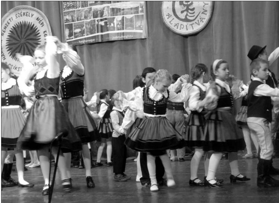
A kis táncosok seregszemlén több mint ötven nptáncsoport mutatta meg tudását

Hargita és Kovászna megye elnökei az együttműködés fontossága mellett azt hangsúlyozták, hogy a művészetre érdemes pénzt költeni. „Székelyföld sikere elsősorban a kultúráján múlik – jelentette ki Sógor Csaba európai parlamenti képviselő. A