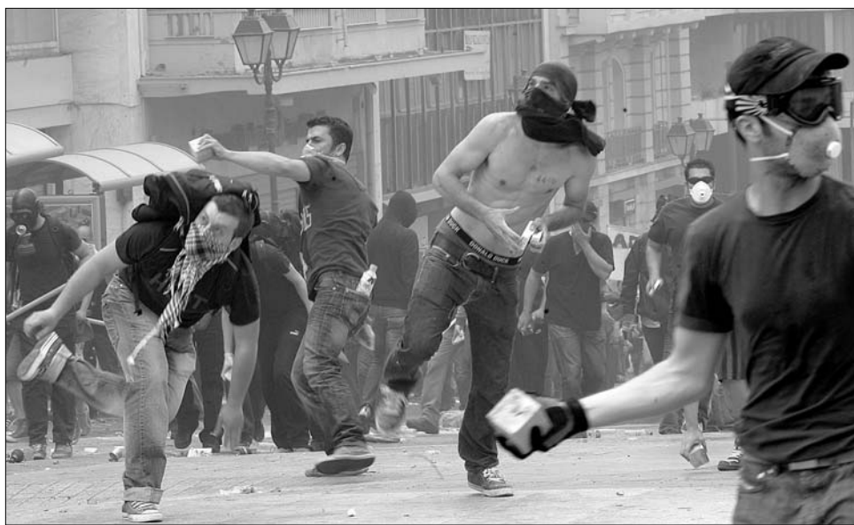
Szalás után lázadás. Athén mérlegadatokat hamisított meg, államháztartási hiányt tagadott le

A 2004-ben és azóta felvett tagállamok esetében nincs választási lehetőség: előbbutóbb a valutaközösség részeseivé kell válniuk (hacsak nem választják szándékosan a svéd utat). Ez amolyan presztízskérdés is, egyúttal jó értelemben vett versengést is kiválthat, mint ahogy térségünkben ki is váltott. Sőt: így tekintett annakidején az euró bevezetésére Görögország is, amelyről már 2002-ben tudni lehetett, hogy trükkök száza- it veti be a hőn áhitott cél eléréséhez. Mérlegadatokat hamisított meg, államháztartási hiányt tagadott le, egyfajta kreatív könyvelést vezetett, és még hosszan sorolhatnánk.