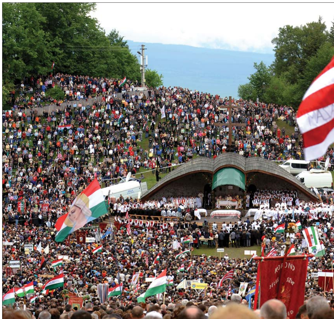
A csíksomlyói búcsú ideje alatt többször is eleredt az eső, de a hívek tízezrei ennek ellenére kitarítottak

a sorrendben immár 443. zarándoklaton. Az idei pünkösdi búcsú ideje alatt egyébként – mondhatni: a hagyományokhoz híven – többször is eleredt az eső. De – szintén hagyományhoz illően – a hívek tízezrei idén is kitarítottak Folytatása a 7. oldalon