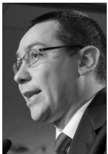
Ludovic Orban és Victor Ponta egyetértettek: nem szöveteznek

Pártja Vaslui megyei szervezetének értekezletén Ponta hangsúlyozta: nem PSD-PNL-, hanem PSD-PSD-szövetséget akar a következő választásokra. „Egyedül kell küzdenünk a szavazatokért,