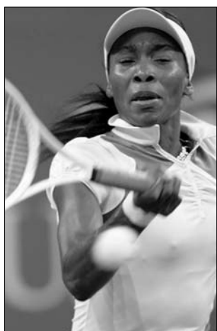
Venus Williams kiesett