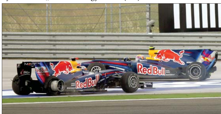
Ütközött a két Red Bull. A pilóták egymást hibáztatják

A negyedik helyen a Mercedes hétszeres világbajnok német klasszisa, Michael Schumacher végzett, a Ferrari viszont leszerepelt története nyolcszázadik Forma-1-es futamán: Felipe Massa a hetedik, Fernando Alonso pedig csak a nyolcadik lett. Az isztambuli pontszerzők: 1. Hamilton, 2. Button, 3. Webber, 4. Schumacher, 5. Nico Rosberg (Mercedes), 6. Robert Kubica (Reanult), 7. Massa, 8. Alonso, 9. Adrian Sutil (Force India), 10. Kobajasi (Sauber). Az egyéni összetettben továbbra is Webber (93 pont) áll az élen Button (88), Hamilton (84), Alonso (79) és Vettel (78) előtt. A konstruktóri világbajnokságban a McLaren (172 pont) áll az élen, a Red Bull (171) és a Ferrari (146) előtt. ◀