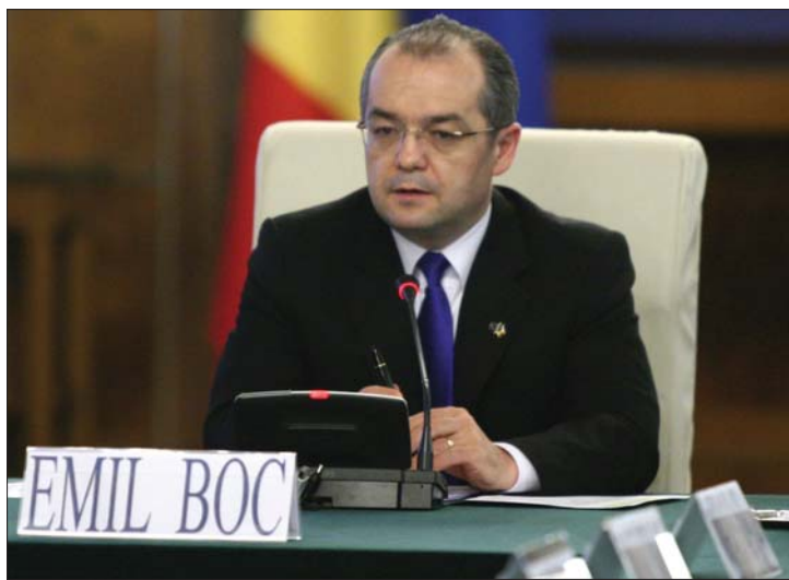
Boc tegnap arra kérte a tanárokat, tekintsenek el a sztrájkktól

▶ A rendszerváltás óta eltelt időszak egyik legnagyobb tiltakozóakció-sorozatával válaszolnak a hazai szakszervezetek arra az intézkedéscsomagra, amelyet tegnap esti ülésén öntött törvény formájába a kormány. A közalkalmazotti bérek 25, a nyugdíjak 15 százalékos lefaragása miatt ma országsszerte zárva tart számos közigazgatási és egészségügyi intézmény, holnap a közszállítási vállalatok sztrájkja a fővárost fogja részben megbénítani. Elálltak azonban időközben munkabeszüntetési szándékaiktól a vasutasok, s a tanügyi szakszervezetek mára beharangozott sztrájkja – a pedagógusok ko-