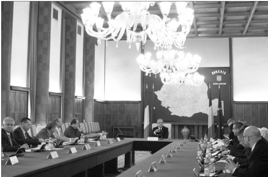
A kormány tegnap este tárgyalta a megszorító intézkedéseket törvényerőre emelő két jogszabályt

A kormányülést megelőző videokonferencián Emil Boc kormányfő alkotmányértelmezési kiselőadást is tartott a prefektusoknak arról, hogy az alaptörvény nemzetbiztonsági veszélyre vo-