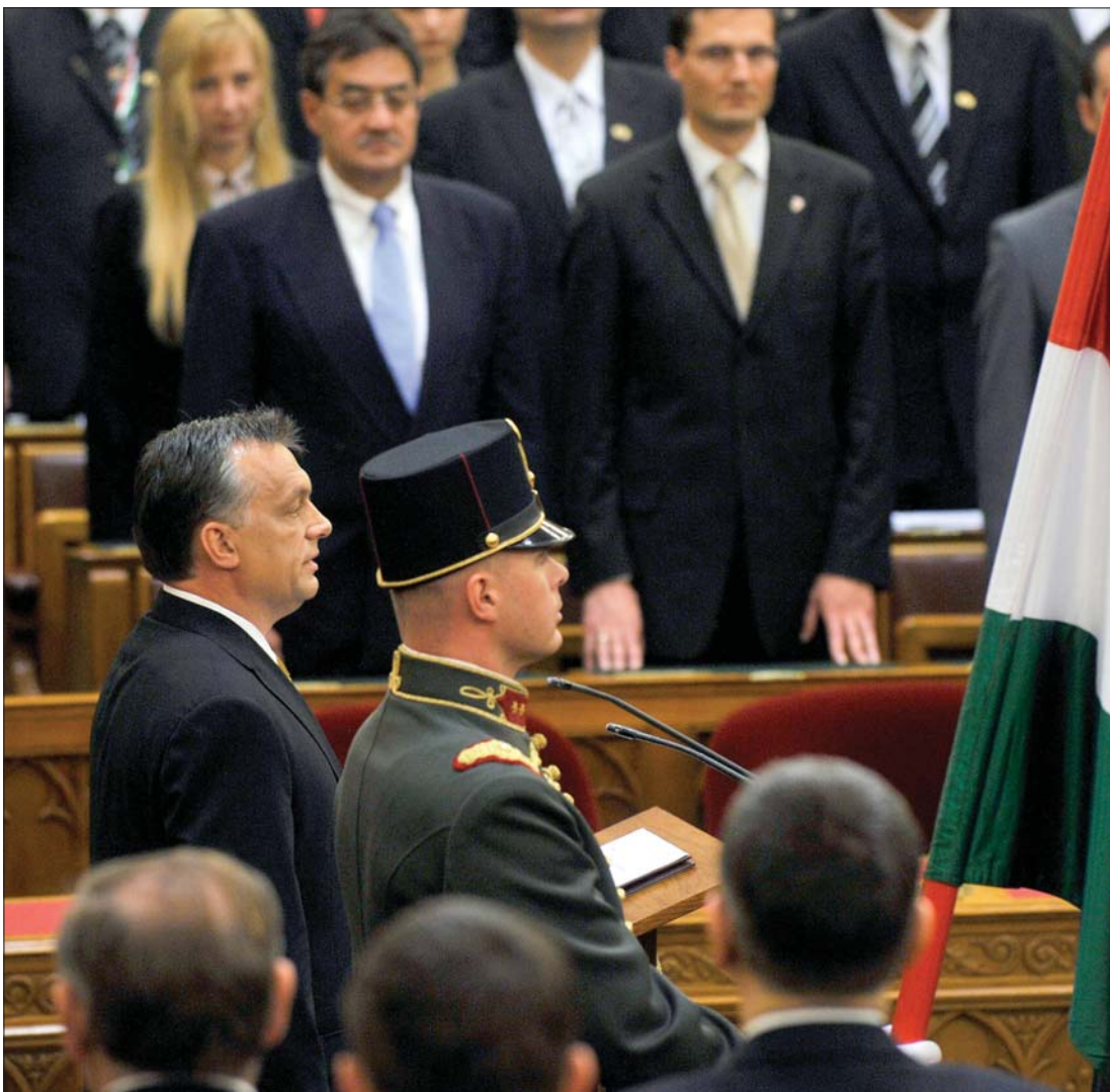
Orbán Viktor új magyar miniszterelnök a történelmi zászlók előtt tette le az esküjét a parlamentben

lampolgárság megadásának megteremtésével a magyar nemzet közjogi értelemben egyesült. A miniszterelnök-helyettes korábban bejelentette; az új kormány határozott szándéka, hogy még a nyáron összehívja a Magyar Állandó Értekezletet (MÁÉRT). 2. és 4. oldal ▶