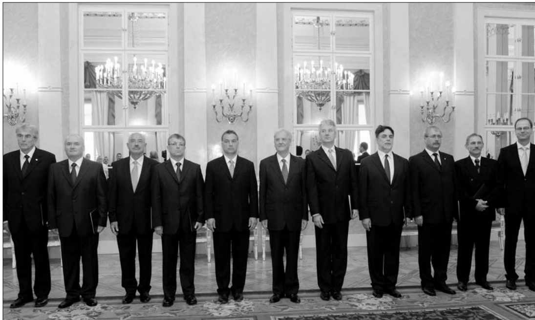
Családi fotó a Sándor-palotában: Sólyom László és Orbán Viktor az új magyar kormány tagjaival