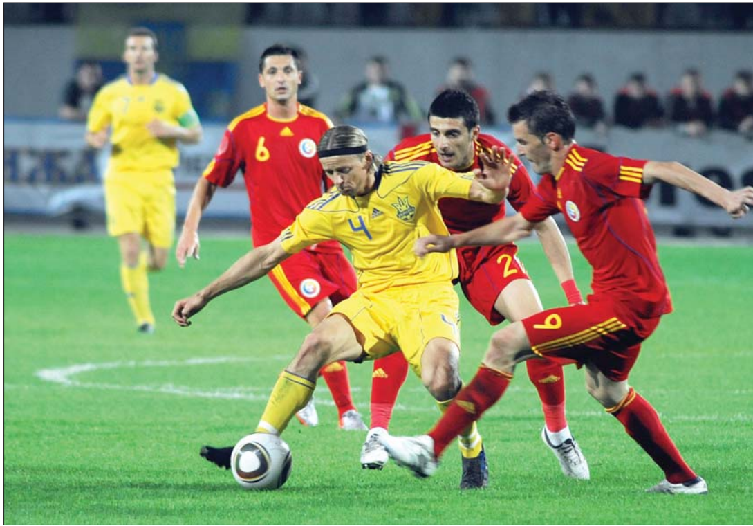
Az ukrán játékosok megállíthatatlanok voltak a románok elleni barátságos mérkőzés hajrájában

„Nem szoktam a játékvezetést kritizálni, de a mostani felháborító volt” – jelentette ki Răzvan Lucescu, Románia férfi labdarúgó-válogatottjának szövetségi kapitánya az ukránok ellen elvesztett idegenbeli barátságos mérkőzés után. Ez volt a trikolórok első kudarca az ukránok ellen, s noha az edző elismerte, hogy voltak hiányosságaik, szívesen bírók „csúfot üttek a fiúk munkájából”. A szombat esti találkozó Alijev góljával szereztek meg a vezetést a házigazdák, ám a tétlenség követően Gabriel Tamaș (56. perc), majd Daniel Niculae (65. p.) is eredményes volt. Az ukránok egyenlítő gólját Konoplianka (77. p.) jegyezte, míg a 3-2-es végeredményt Cristian Chivu (80. p.) öngólja állította be. „A második féldő má-