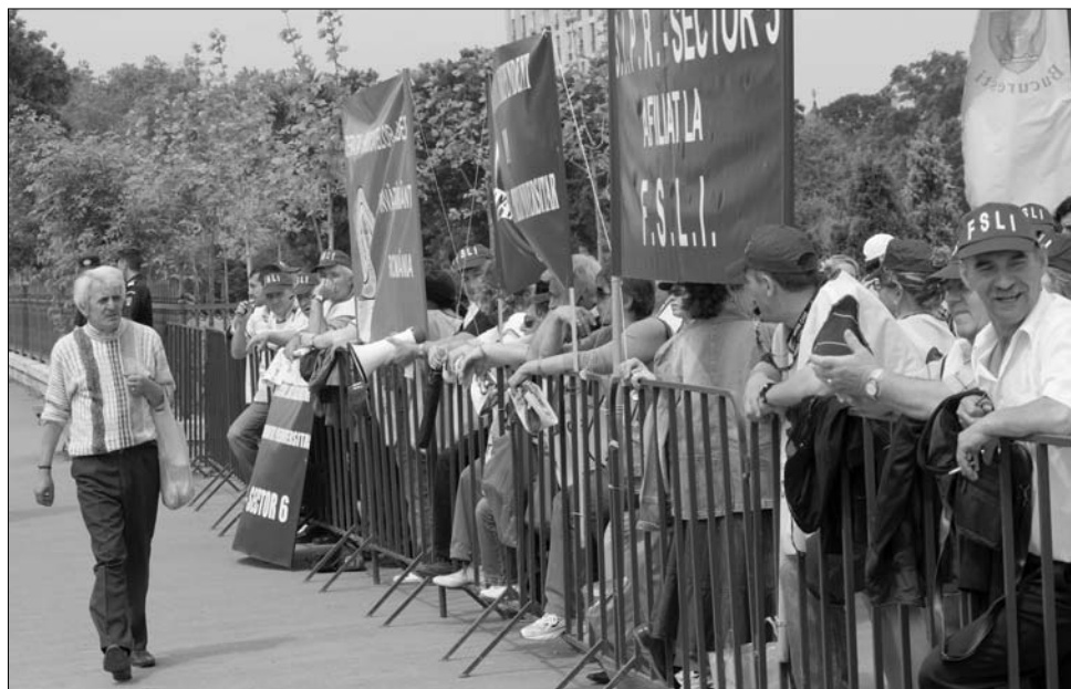
A munkabeszüntetéssel egy időben a szakszervezetek sztrájkorségeket is tartanak

A pedagógusok munkabeszüntetésével egy időben ma ötven szakszervezeti tömörülés kezdeményez sztrájkot, a kormány megszorító intézkedései elleni tiltakozásként. A sztrájkfelhívásnak megfelelően ma leállnak a helyi és önkormányzati hivatalok, az adóhivatalok, csak az alapvető feladatokat látják el a büntetés-végrehajtási, gyermekvédelmi, fogyasztóvédelmi, környezetvédelmi intézmé-