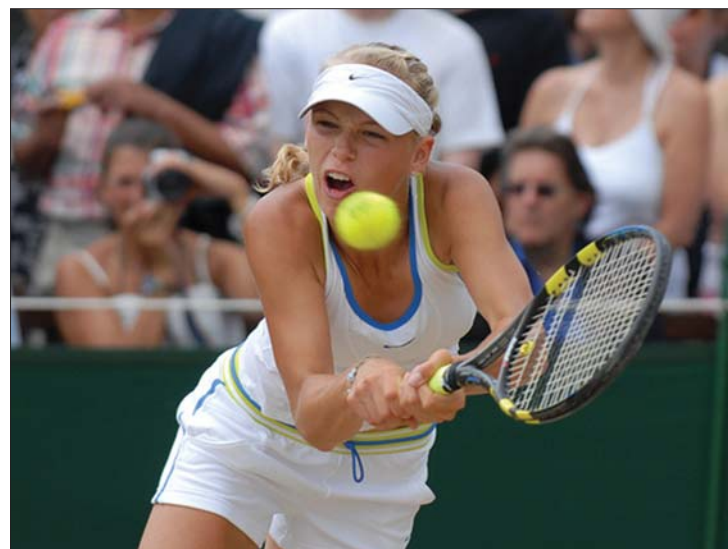
Caroline Wozniacki elbúcsúzott a Roland Garros negyedöntőjében

A férfi egyesek első negyedöntője, a svájci világlásó és egyben címvédő Roger Federer mérkőzése a svéd Robin Söderling ellen a nagy esőzés miatt tegnap késő délután félbeszakadt. Akkor már két játszmát befejeztek, s 6-3, 3-6, 5-5 volt az állás. Ugyancsak az esőzés miatt állították le a Tomas Berdych és a Mihail Juzsnij közötti összecsapást is. Itt az első játszmát a cseh nyerte 6-3-ra, a másodikban 1-1 volt az állás, amikor a találkozó félbeszakították.