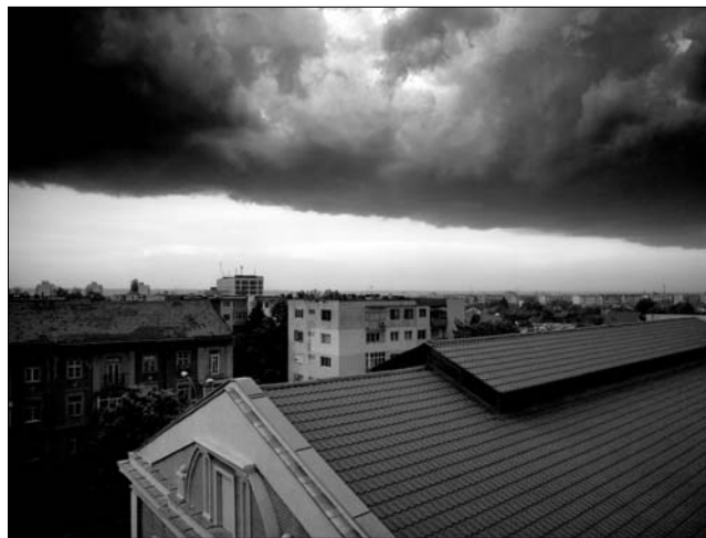
Az erdélyi városok fölött ismét elsötétül az ég

► A héten már másodszor bocsát ki sárga veszjelzést az Országos Meteorológiai Intézet, több megyében is megnövekedett csapadékmennyiségre kell ma is számítani. Várhatóan heves viharok alakulnak ki, a nyugati és a déli régiókban árvízriasztás lépett életbe. A májusi rendkívüli időjárás és rekordmennyiségű csapadék után június elején is nehézségeket okoz az eső. Különösen veszélyeztetett a Kraszna, a Fekete- és a Fehér-Körös, a Bega, a Temes, a Borzsova vízgyűjtő medencéje, valamint az Olt középső szakasza. Az Országos Vízügyi Hivatal munkatársai folyamatosan figyelik a vízhozamot, és koordinálják az árvíz elleni