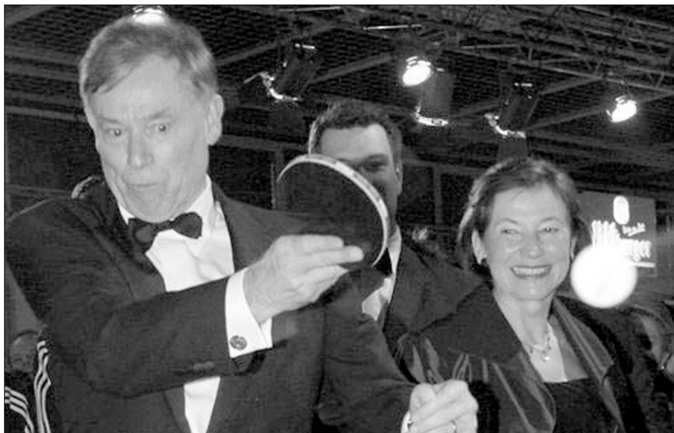
Horst Köhler – még aktív (igaz, asztalitenisz-) játékosként

A német államfő szerepe többnyire protokolláris, személye a nemzet egységét szimbolizálja, s bár pártjelöltként választja meg, rendkívül bonyolult eljárási szabályok alapján a képviselőház tagjaiból és a tartományok képviselőiből álló szövetségi gyűlés, szolgálatát pártok felettiként kell ellátnia, a napi politikába nincs beleszólása. Köhler azonban most akarva-akaratlanul „elkottyantotta” magát, olyasmiről formált véleményt, ami amúgy is igencsak foglalkoztatja, mi több, irritálja a közvéleményt. Ezért hát, hogy – miként egyes német lapok fogalmazzak – az ál-