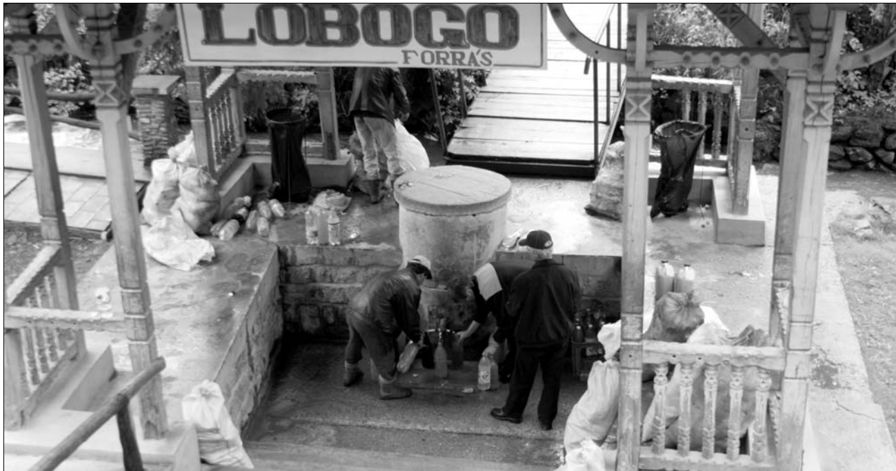
Felfrissülés az ásványvízforrásnál. Szébb környezet fogadná a turistákat a Borvizek útja program fejlesztéseinek köszönhetően

A munkálatokat szeptember közepéig kellene befejezni az európai uniós pályázat értelmében. A sajtóban megjelent információk szerint abban az esetben van lehetőség a kivitelezési határidő meghosszabbítására, ha a megadott időpontra legalább kétharmadát sikerül befejezni a projektnek. „Lehetnek olyan objektív tényezők, amelyek alapján az uniós szabályozás szerint is elfogadható a határidő-módosítás” – szögezte le Borboly, aki szerint két hónapon belül fognak tisztában látni a témában. ◀