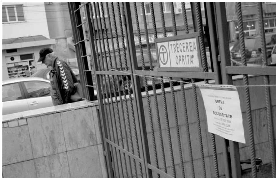
A fővárosban tegnap reggel vasrácsok várták a metróbejáratnál a munkába igyekvőket

A hét elején visszafogott volt a sztrájk Nagyváradon, tegnap viszont már ott is látványosan folytatódott a demonstráció. A prefektúra előtt nagy tömegben jelentek meg a közalkalmazottak, a hangszórók folyamatos panaszáradatait zúdítottak az ablakok mögött várakozó előjárókra. A tömegben ismert arcok is feltűntek: megjelent a Nagyvárad Állami Színház, valamint az Arcadia Gyermek- és Ifjúsági Színház román és magyar társulata,