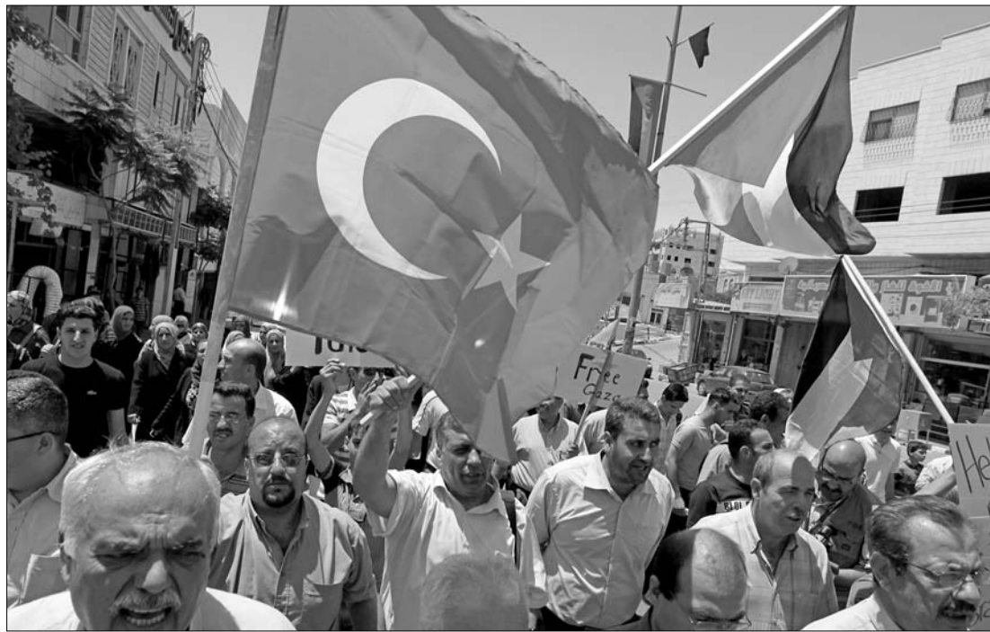
Ciszjordániában és az arab országokban tegnap folytatódott az Izrael-ellenes tüntetések

Izrael megbüntetését követelte tegnap a Gázába tartó török segélyszállító hajó elleni támadás miatt Recep Tayyip Erdogan török miniszterelnök,