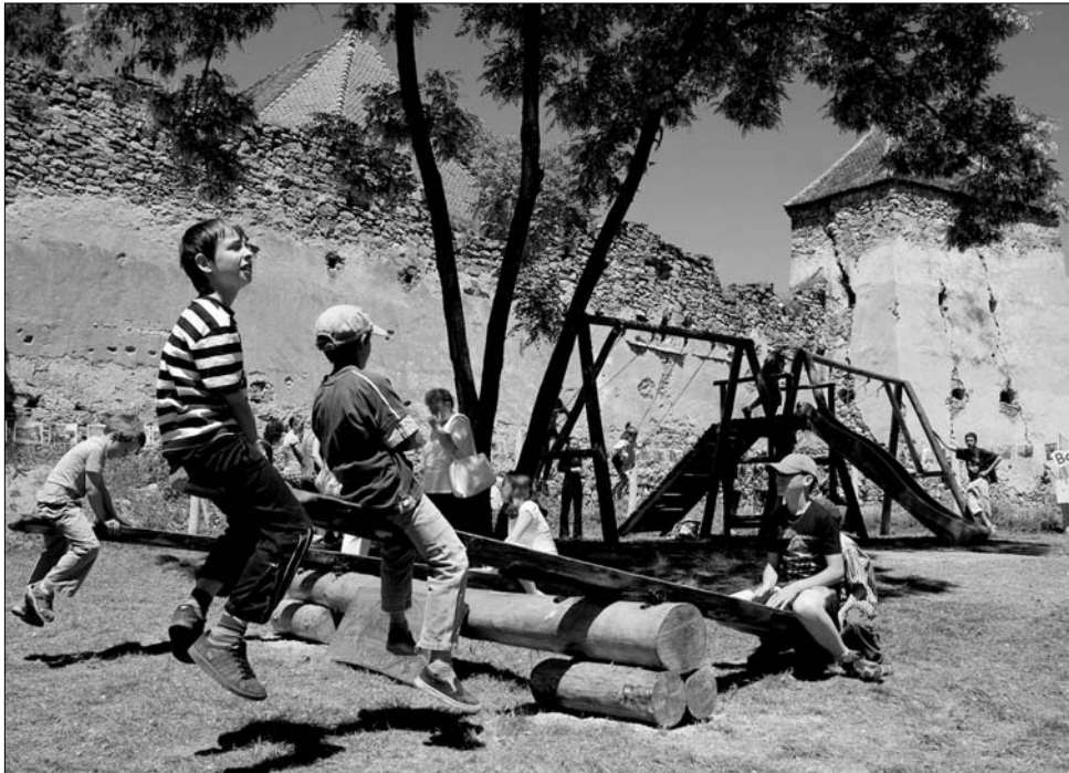
Civil összefogásból született gyerekparadicsom a Kovászna megyei Árkoson