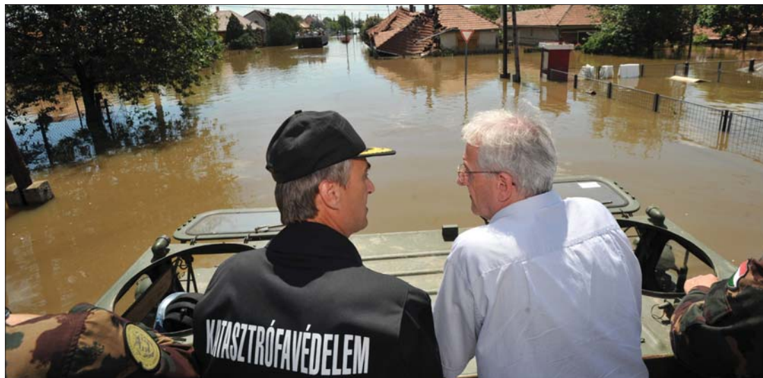
Sólyom László köztársasági elnök a magyar honvédség egyik kételtű járművén tartott terepszemlét