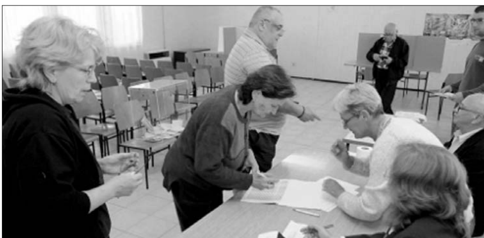
Vajdasági magyarként Európába – erre szavazott a szerbiai tartomány lakosságának zöme