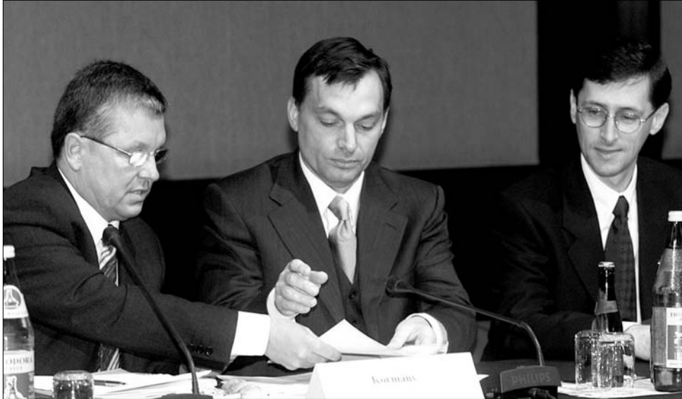
Matolcsy, Orbán és Varga 2001-ben. Elvállik, hogy a stabil csapat stabil gazdaságot is jelent-e

„A cél maradt: tartani a költségvetési hiányszintet. Elődje politikáját azonban nem követi a nemrég hivatalba lépett magyarországi kormány, hiszen olyan javaslatok hangzanak el, amelyeket korábban nem hallottunk” – nyilatkozta az ÜMSZ megkeresésére, a K&H Bank elemzési igazgatója. Magyarországon még idén áttérhet az egykulcsos személyi jövedelemadó-rendszerre és családi adózást vezetne be, e két lépés szerepel a Fidesz-kormány adóterveiben. Állítóg egy bankadó kirovása és elbocsátási hullám a közzsférában is szóba jöhet. A kulcskérdés, hogy elfogadják-e a Valutaalapot és az EU, hogy a magánnyugdíj-pénztári szektort az államháztartás részébe sorolják. Ez idén sok százmilliárd de akár ezermilliárd