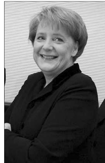
Angela Merkel kancellár

tásba. Mivel a takarékoság első sorban a szociális területeket érinti, a Németországra évek óta jellemző társadalmi béke felbomlása fenyeget. Az ellenzéki pártok és a szakszervezetek máris bejelentették, hogy országos tiltakozó megmozdulásokat szerveznek. Angela Merkel a koalíciós partnerrel együtt utalt arra, hogy Németország az elmúlt években lehetőségei felett élt. Az elhatározott takarékosági programnak – mint hangsúlyozta – Németország számára nincs alternatívája. ◀