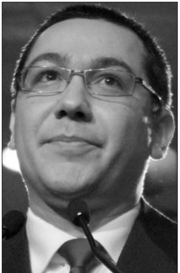
Victor Ponta, a PSD elnöke

A szenátusnak is múlt héten kellett volna szavaznia az egyik megüresedett alkotmánybírói poszt betöltéséről, ám a kérdést a demokrata-liberálisok javaslatára kivették az ülés napirendjéről, és erre a hétre halasztották. Ellenzéki források szerint a nagyobbik kormánypárt azért járt el így, mert fennállt a veszély, hogy a felsőházban is az ellenzék jelöltje (a liberális Teodor Meleşcanu) kapja a több szavazatot. ◀