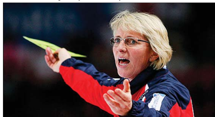
Marit Breiviket szeretné Romániába csábítani az Oltchim