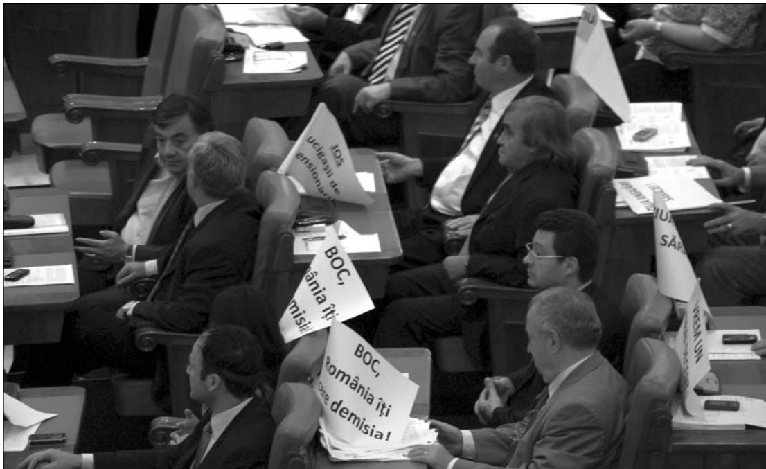
A szociáldemokrata honatyák „felkészülten” érkeztek a kormányzati felelősségvállalásról szóló ülésre.

„Kár volt vásárra vinnünk a bőrünk '89-ben azért, hogy most éhhalálra ítéljenek bennünket. Annyit értünk el, hogy a politikusok meggazdagodtak” – hangzottak a parlament bejáratainál felszerelt kis pódiumokon a tiltakozók, akik a nagy kánikula ellenére közel három órán keresztül pfujoltak, sípoltak a ki-be