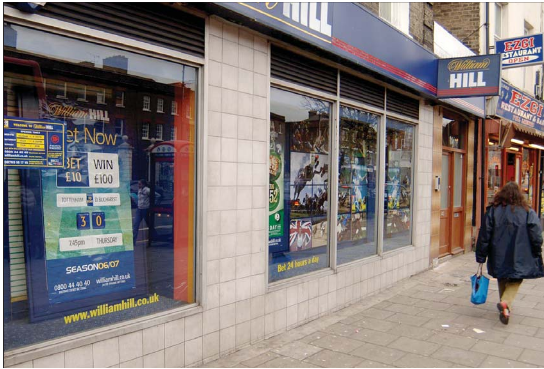
Nem nyitnak ma ki a romániai sportfogadó irodák, így tiltakoznak a kormány rendelete ellen