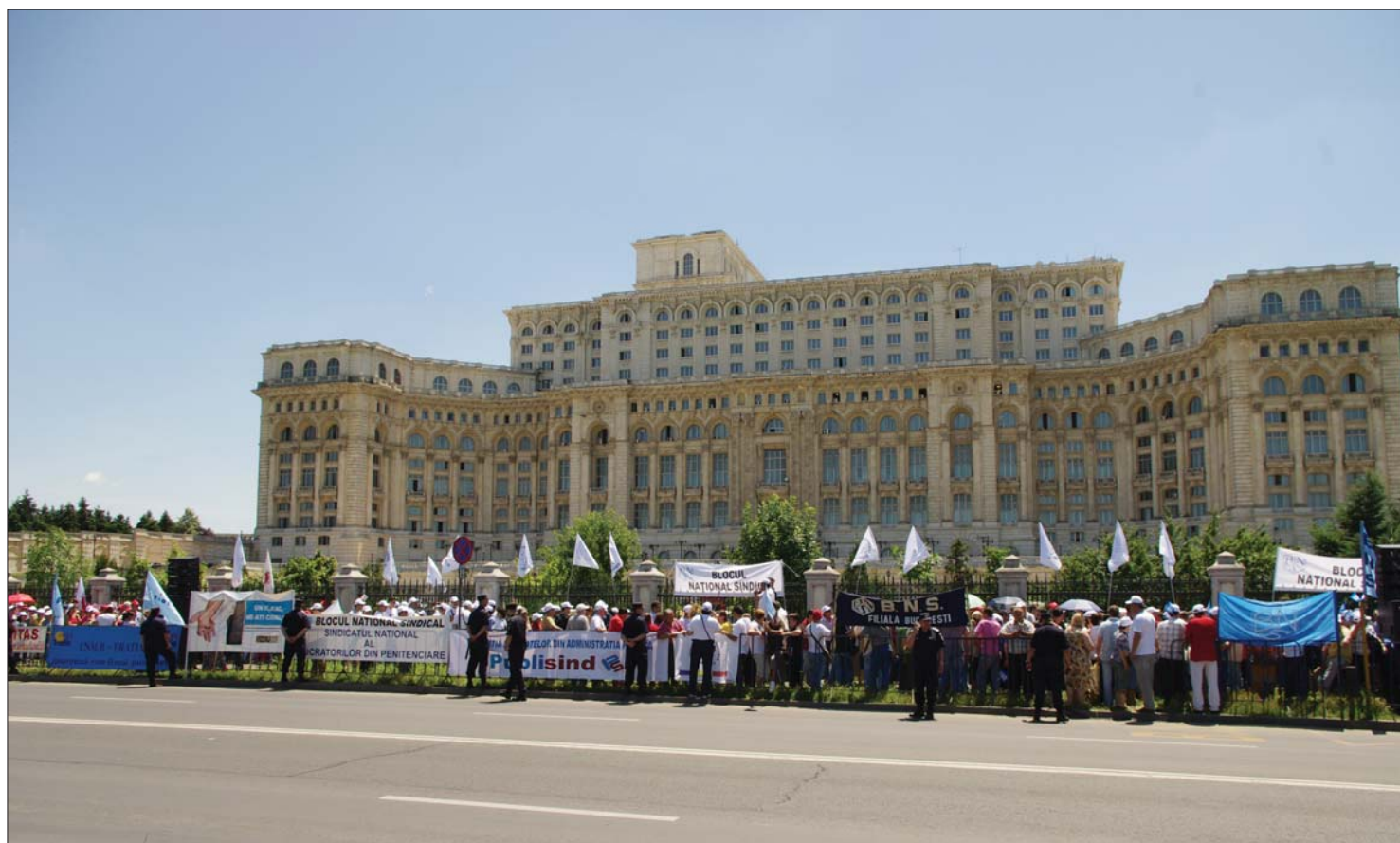
A parlament előtt tegnap összegyűlt tüntetőknek nem sikerült megakadályozniuk Emil Boc miniszterelnököt az épületbe való bejutásban

Két tűz – felelősségvállalás és bizalmatlanság – között a Boc-kormány