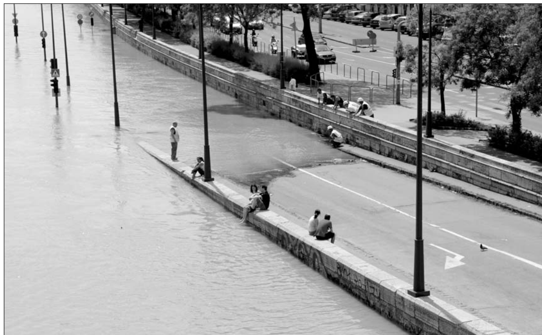
Budapesten tegnap estére várták a Duna tetőzését, a víz a rakpartok egy részét már elöntötte

A magyarországi folyókon 3088 kilométer hosszon van védelmi készültség, 1235 kilométeren harmadfokú, 581 kilométer hosszán másodfokú a készültség. Rendkívüli készenlét 229 kilométeren van érvényben.