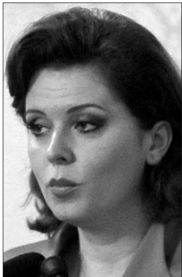
Roberta Anastase képviselőházi elnök