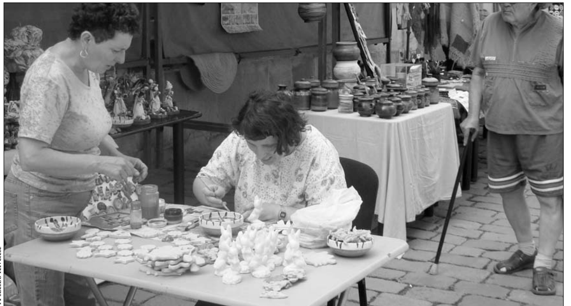
A rendezvényen főleg azok a fogyatékosok vannak jelen, akik rendszeresen üznek valamilyen népi mesterséget

„A szellemileg, testileg sérült felnőtteknek, gyerekeknek is vannak jó képességeik. Kéz-