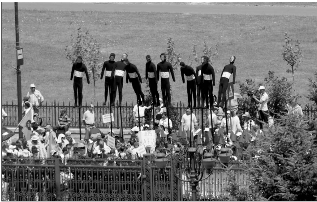
A szakszervezetek a parlament előtt karóba húzott bábuakat mutattak fel, amelyeket elégettek

Kifejezetten nagy felfordulás színhelye volt a parlament hatalmas épülete előtti tér. Közalkalmazottak ezrei érkeztek már reg-