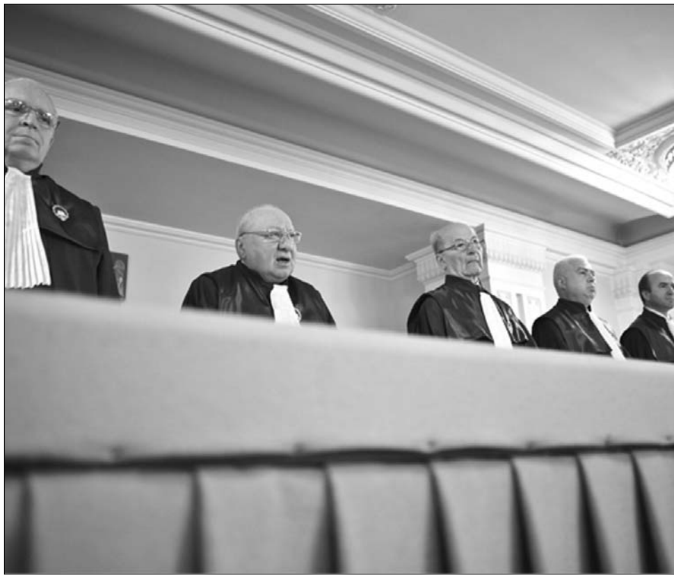
A taláros testület tagjai. Nem mindig a helyzet magaslatán...

Az alaptörvénynek megfelelően a taláros testület 9