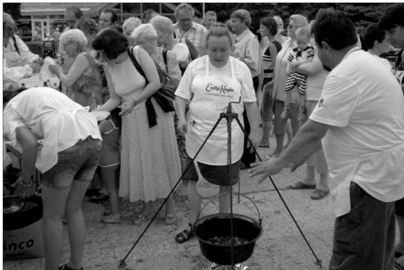
Dévan is hódított a gulyás-kultúra: románok és magyarok tolongtak a zamatokért. Jövőre nagyobb kondérral jönnek – ígérték a szervezők

Jelentős károkat okozott az elmúlt napokban ország-szerte tomboló vihar. Máramaros megyében 15 településen több, mint 24 órán át szünetelt az áramszolgáltatás annak ellenére, hogy a katasztrófa-elhárítás folyamatosan dolgozik a viharok helyreállításán. Több helyen nem csak a villanyvezetékeket szakították el a szokatlanul erős szél, de a villanyoszlopokat is ki döntötte.