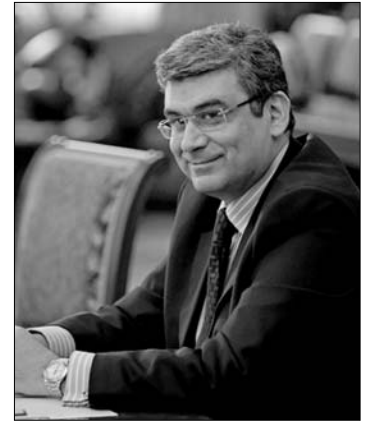
Teodor Baconschi külügyminiszter

► Bukarest realizmussal és higgadtan tekint a kettős állampolgárságról szóló magyarországi döntésre, hiszen a román-ma-