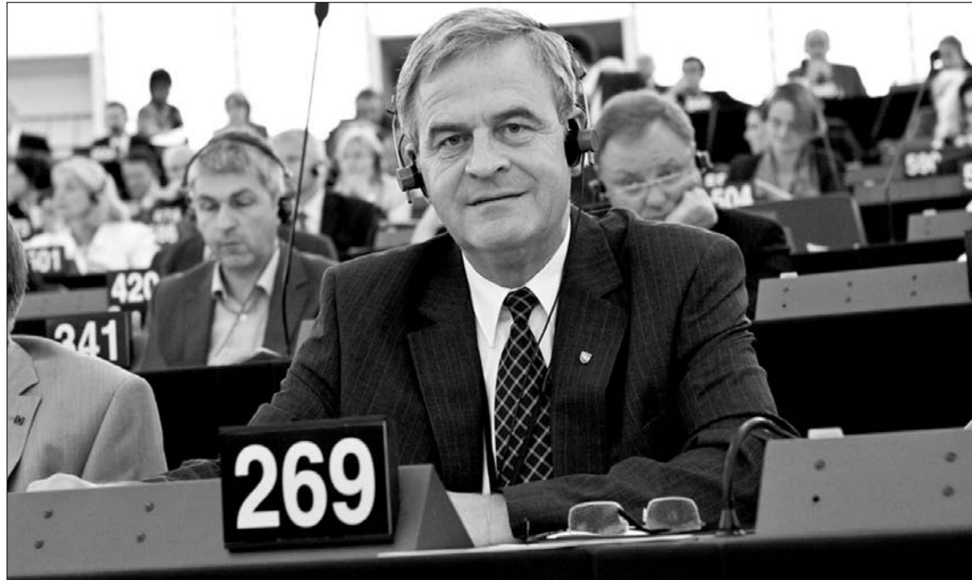
Tőkés László EP-képviselő: elkötelezett híve vagyok annak, hogy továbbvigyük az európai integrációt

Az Erdélyi Magyar Nemzeti Tanács (EMNT) elnökségének tegnap kiadott állásfoglalása szerint a romániai ellenzéki pártok felemás megnyilatkozásai ismételtén rávilágítanak a román politikum kétszínűségére és következetlenségére. Az EMNT ez ügyben nemcsak a Szociáldemokrata Pártot (PSD) bírálja, hanem „az ez ideig leginkább európainak hitt” Nemzeti Liberális Pártot is „nagy-románias” megnyilvánulásai miatt. A közlemény arra utal, hogy a két ellenzéki alakulat nem támogatta Tőkés megválasztását. ◀