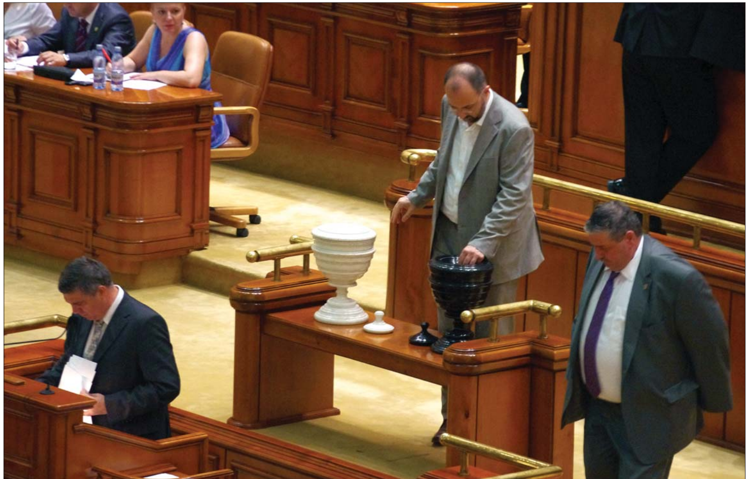
Kelemen Hunor művelődési miniszter szavaz. A nagyobbik kormánypárttal szemben az RMDSZ-ben nem voltak „árulók”

Csak az Alkotmánybíróság akadályozhatja meg a megszorító intézkedéseket