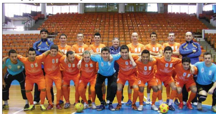
Zsinórbán harmadik Román Kupáját nyerte meg a bajnok City'us