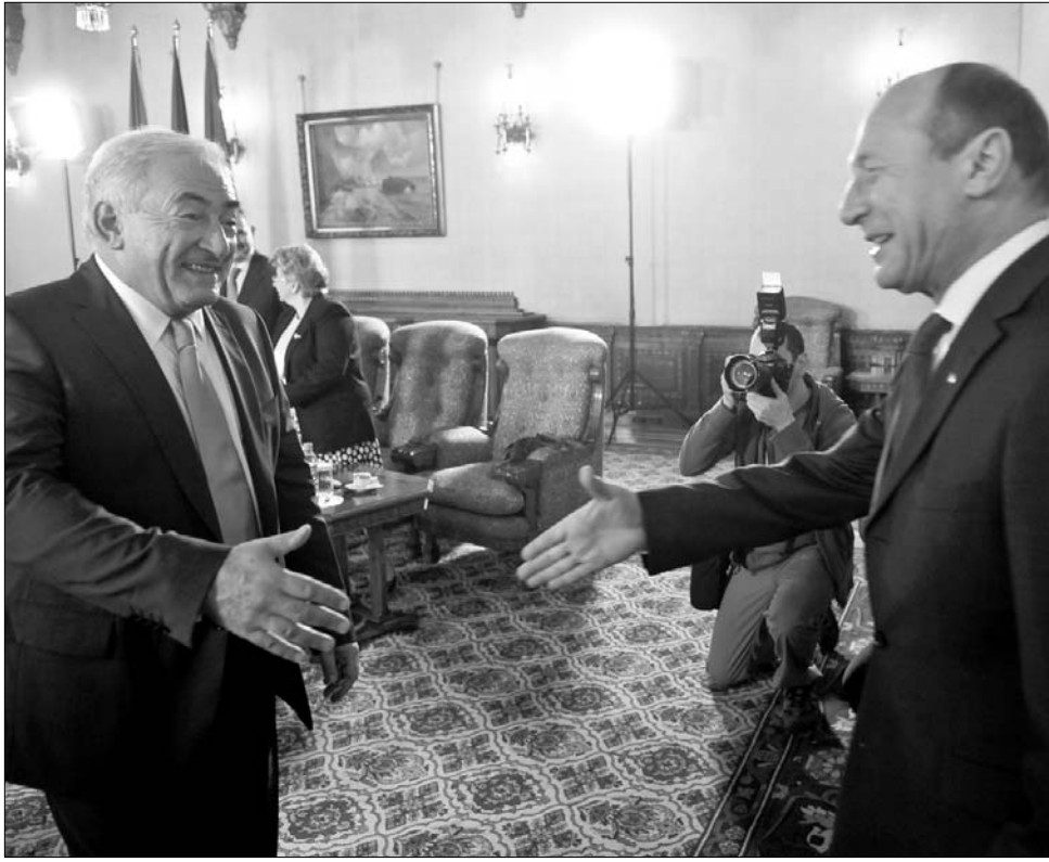
Dominique Strauss-Kahn IMF-vezér és Traian Băsescu államfő – még találkoznak?

A miniszteri kijelentések szintjén egyelőre ellentmondás tapasztalható, a vállalkozók azonban biztosra veszik, hogy küszöbön áll a második IMF-hitel. „Az országnak közel tízmilliárd eurós tartozása van, melyhez még nyolcmilliárdos költségvetési hiány társul. Nem szabad elfelejtenünk, hogy ennek törlesztése jövő évben kezdődik, az államnak eközben még a közalkalmazottak bérét és a nyugdíjakat is biztosítani kell. Mivel más lehetőség lassan nem marad, a pénzalapok előteremtéséhez elkerülhetetlen lesz egy újabb IMF-kölcsön” – fogalmazta meg Matei Agathon, a Román Munkaadók Szövetségének szóvivője a Curierul Național hasábjain. Mint korábban beszámoltunk róla, a belföldi bankpiacról való hitelfelvétel lassan kimerül, miután a pénzügyi intézetek elérték az állammal szembeni kitétségek előírt húszszázalékos maximumát. A fizetésképtelenségi kockázat megnövekedése miatt pedig az európai bankok nem hajlandók kölcsönözni.