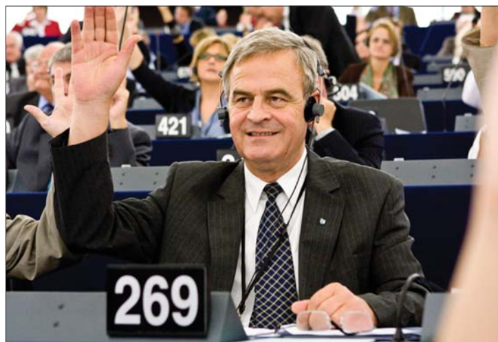
Tőkés László elsősorban a néppárti frakció bizalmát élvezte

▶ Az Európai Parlament egyik alelnökévé választották tegnap Tőkés Lászlót, a néppárti frakció jelöltjét. A volt református püspököt 334 szavazattal, 287 ellenszavazat és tartózkodás mellett választották meg a tiszt-ségbe, a romániai ellenzéki pártok képviselői ellene voksoltak. 2. oldal ▶