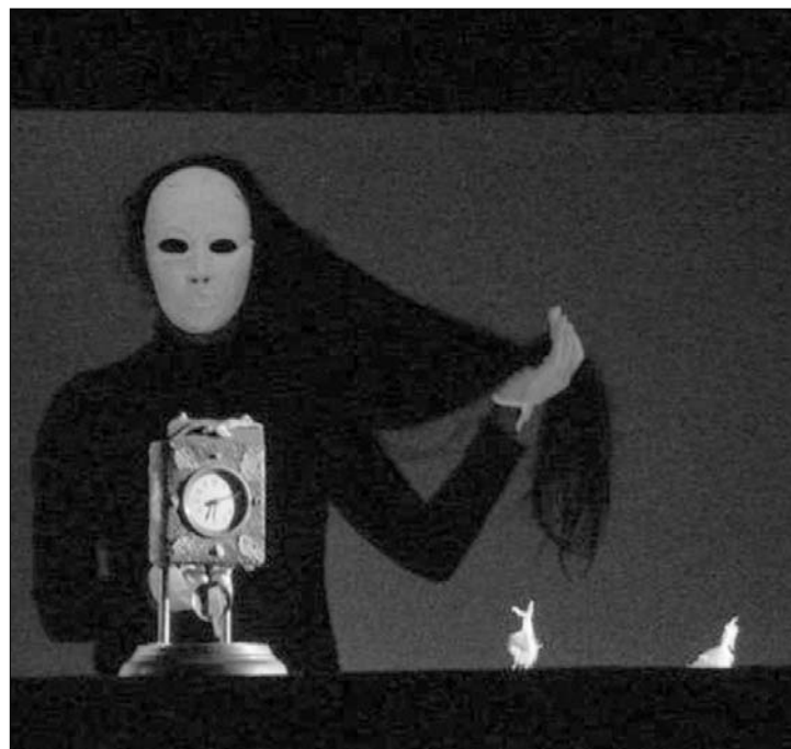
A Lézés című nagy sikerű produkcióval kezdődött a Miniévad

ház közös produkciója, a Zabawa volt látható. A keddi és szerdai Underground-estek a mesterfokozatú rendező- és drámaírószakos hallgatók vizsgamunkáit vonulták fel. Ma délelőtt A játékbolt című magyar nyelvű gyerekelőadás, az Ariel színház és a művészeti egyetem közös produkciója indítja a napot. Délután bemutatják Radu Țuculescu drámakötetét, majd az Ameli sóhaja román nyelvű felnőttelőadás várja az érdeklődőket. A miniévad zárónapján ismét a gyermekeknek kedveskednek, Aladdin című meséjével, a román tagozat előadásában. ◀