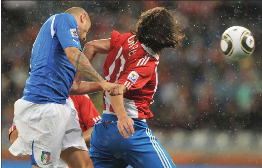
Nem bírt egymással az olasz és a paraguayi válogatott az F csoport nyitómérkőzésén

„Amit sajnállok, az az eredmény” – bosszankodott Marcello Lippi, a címvédő olasz labdarúgó-válogatott szövetségi kapitánya a Paraguay elleni 1-1-es döntetlen miatt. Merthogy az azzurik nem bírtak dél-amerikai ellenfelükkel a Dél-afrikai Köztársaságban zajló világbajnokság F csoportjának első fordulójában; hiába kezdtek jó játékkal a szakadó esőben rendezett találkozót, a híres védelmükbe többször hiba csúszott. Ezt kihasználva Alcaraz védtelenül fejelte be a labdát Buffon kapujába. A szünet után aztán egy baloldali szöglettel De Rossi úgy három méterről egyenlített ki az állást, ezután bár végig fölényben futballoztak az olaszok, a paraguayi defenzívát nem bírták megtörni. „Az ilyen mérkőzéseket meg kellene nyernünk, noha a bekapott gólról megfelelően reagáltunk. A jövőben ennél jobban kell teljesítenünk. Ellenfelünk nem csinált semmi rendkívülit, végig a védekezésre összpontosított” – jelentette ki Lippi, aki Buffon szünetbéli cseréjével kapcsolatban elmagyarázta, hogy a kapus már a bemelegítésnél hátfájásra panaszkodott, s nem tudta folytatni a játékot. A 32 éves hálóőr azonban