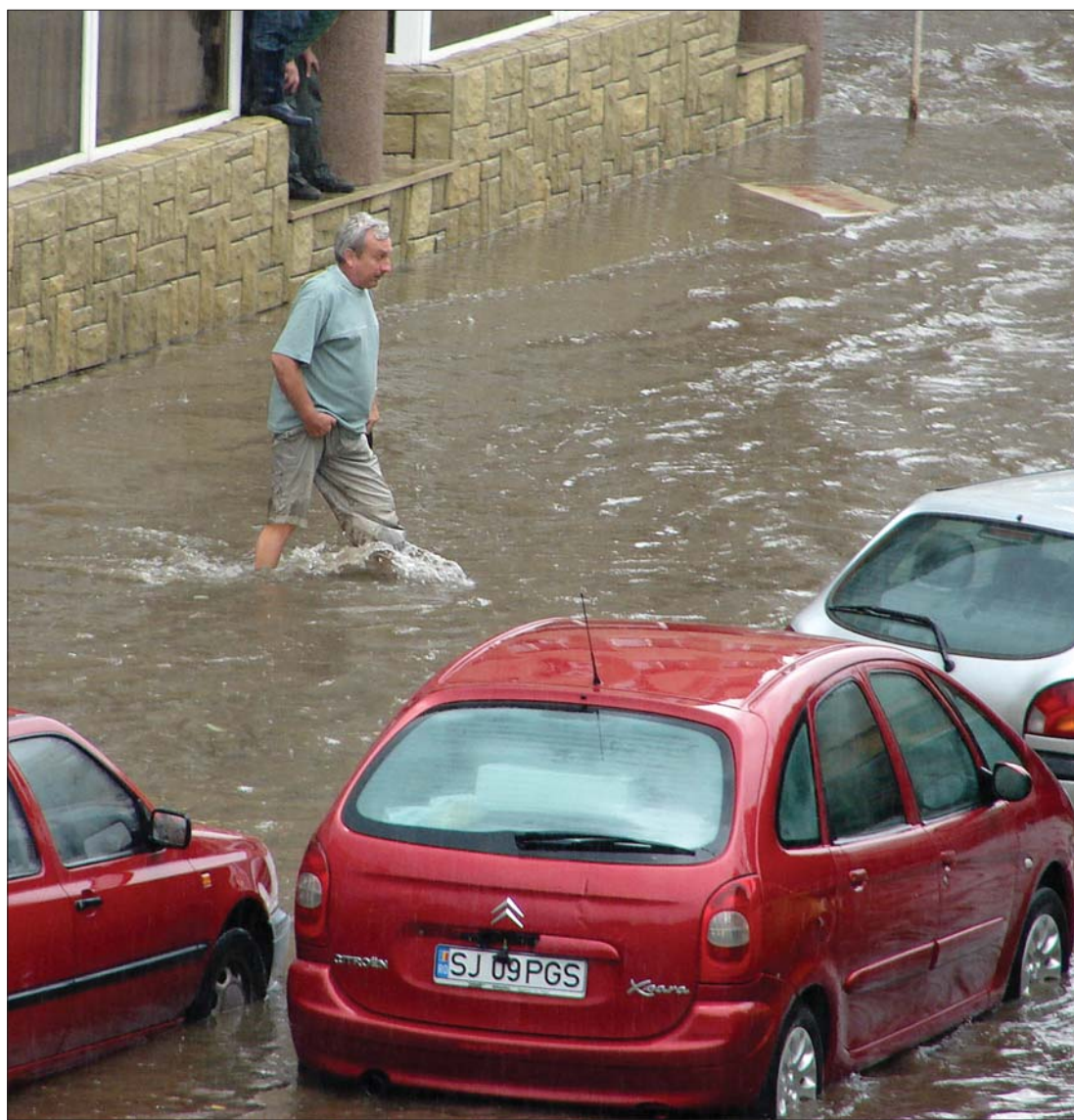
Szilágy és Szatmár megyében a Kraszna fenyeget áradással, Bihar megyében a Sebes-Körös