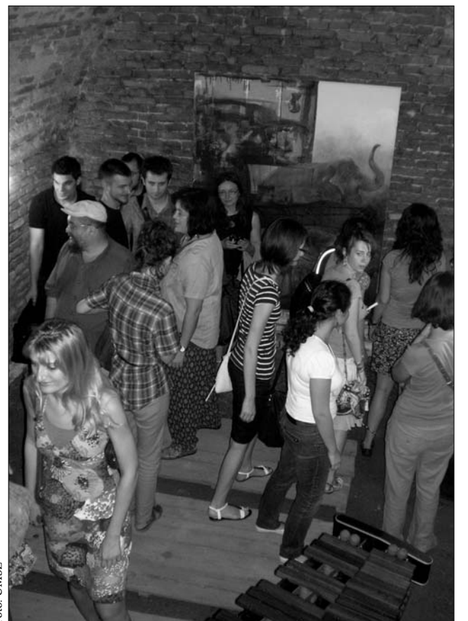
Székely Sevan első egyéni kiállítása volt Bukarestben.

találtam a kiállításra” – magyarázta az alkotó, aki külön örül annak, hogy ebben a térben állíthatta ki festményeit. ◀