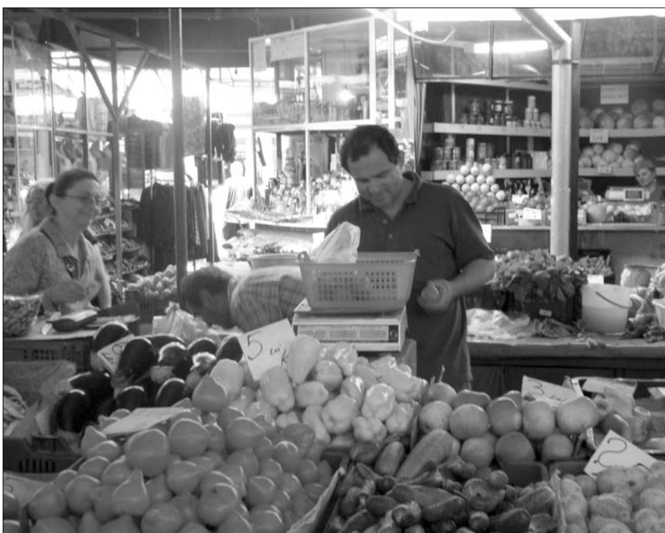
Piacolás Kolozsváron. A rossz idő miatt drága és rossz minőségű az idej zöldség

„Képzeld csak el, hogy az ipari termelésben olyan valódi paradicsomfák hozzák a termést, amelyeken akár húsz-harminc kiló zöldség is megterem, ezeket na-