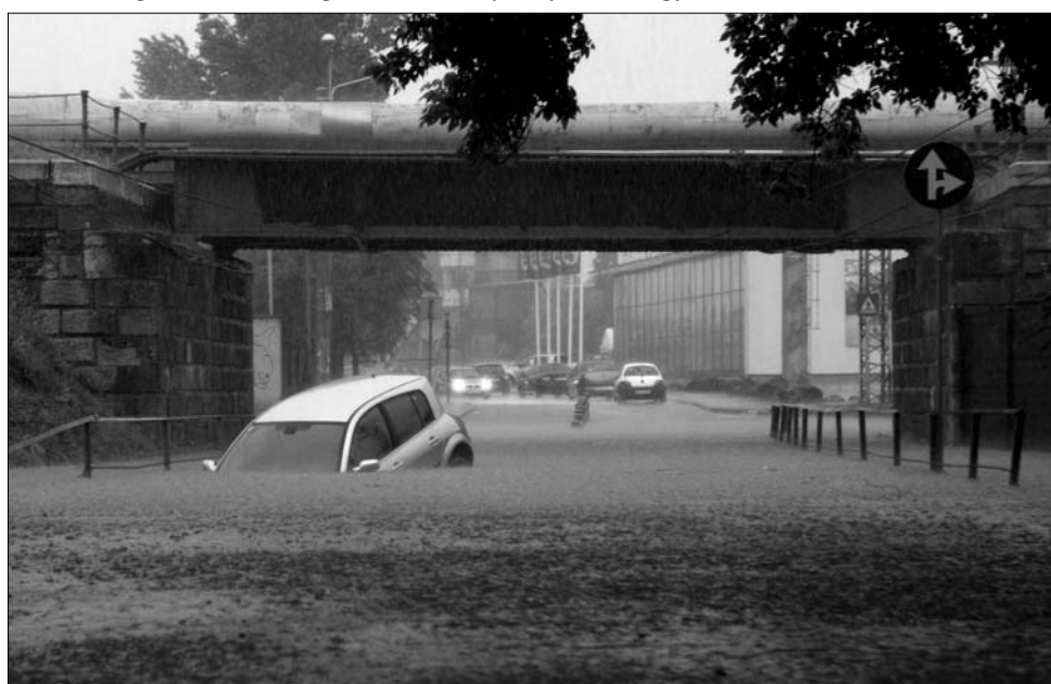
Kritikus a helyzet a Begán és a Temesen: egy hete folyamatos az árvízveszély

Az Országos Vízügyi Hivatal fokozott árvízveszélyt jelzett a Kis-Szamoson a Kolozs megyei Apahida körzetében, Szilágy és Szatmár megyében pedig a Kraszna fenyeget áradással, Bihar megyében a Sebes-Körös folyása mentén állnak készenlétben az árvízvédelem szakemberei. Továbbra is kritikus a helyzet a Begán, a Temesen: Temes megyében egy hete folyamatos az árvízveszély. Ma délutánig a viharjelzés érvényben marad többek között Bákó, Kovászna, Krassó-Szörény, Hunyad, Máramaros, Beszterce-Naszód, Maros, Harghita, Brassó, Szeben, Fehér, Kolozs, Bihar és Temes megyékben. ◀