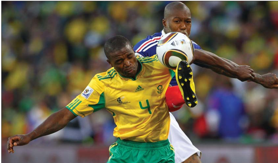
A dél-afrikai házigazdák elgáncsolták a franciákat a világbajnokság csoportkörének zárófordulójában.

Uruguay és a Mexikó egy döntetlennel is biztos továbbjutó lehetett volna, csak hogy egyikük