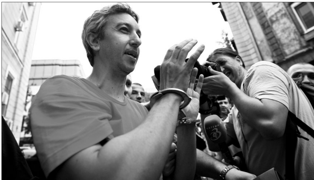
Teodor Meleşcanu: nem kizárt, hogy politikai okok miatt került bilincs Dan Diaconescu csuklójára

Adriana Bahmuţeanu tévésztár, aki többször szerepelt az OTV-ben (Dan Diaconescu műsorának meghívottjaként), szintén támogatását fejezte ki. „Meglepett Dan letartóztatása, és nagyon szomorú vagyok a történetek miatt. Ha börtönbe kerül mindenképp meg fogom látogatni, narancsot és fasírtot viszek neki” – nyilatkozta a Realitatea.net hírportálnak a tévésztár. ◀