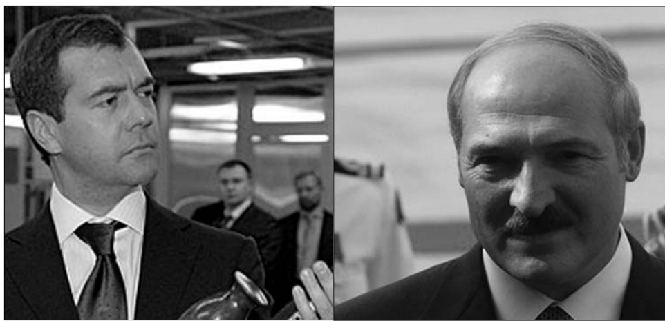
Dmitrij Medvegyev és Alekszandr Lukasenko: az orosz-fehérorosz gázpárbaj hősei

Mint tudjuk, a legjobb barátainak is ellensége a