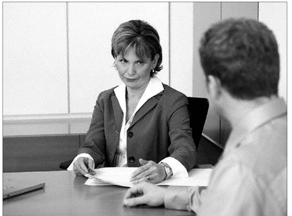
A banki pótdadó kezelési költségé alakul, amelynek árát végül az ügyfél fizeti meg

Ha a szóban forgó részvényeket tőzsdén kívánják értékesíteni, az eljárás tíz-tizenkét hónapot is igénybe vehet – tudtuk meg Borbély Károlytól. Az intézkedéseket ugyanakkor nem szabad elhamarkodni csak azért, mert gyorsan kell a pénz az államkasszába – az eljárás