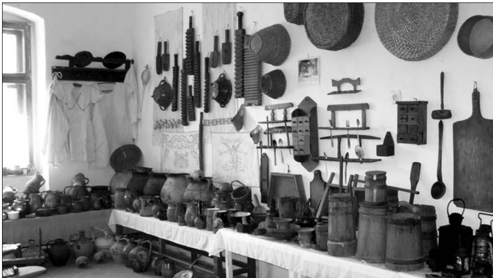
A lakosokat a közösségi cél szolgálása bírta adakozásra Kőkényesden