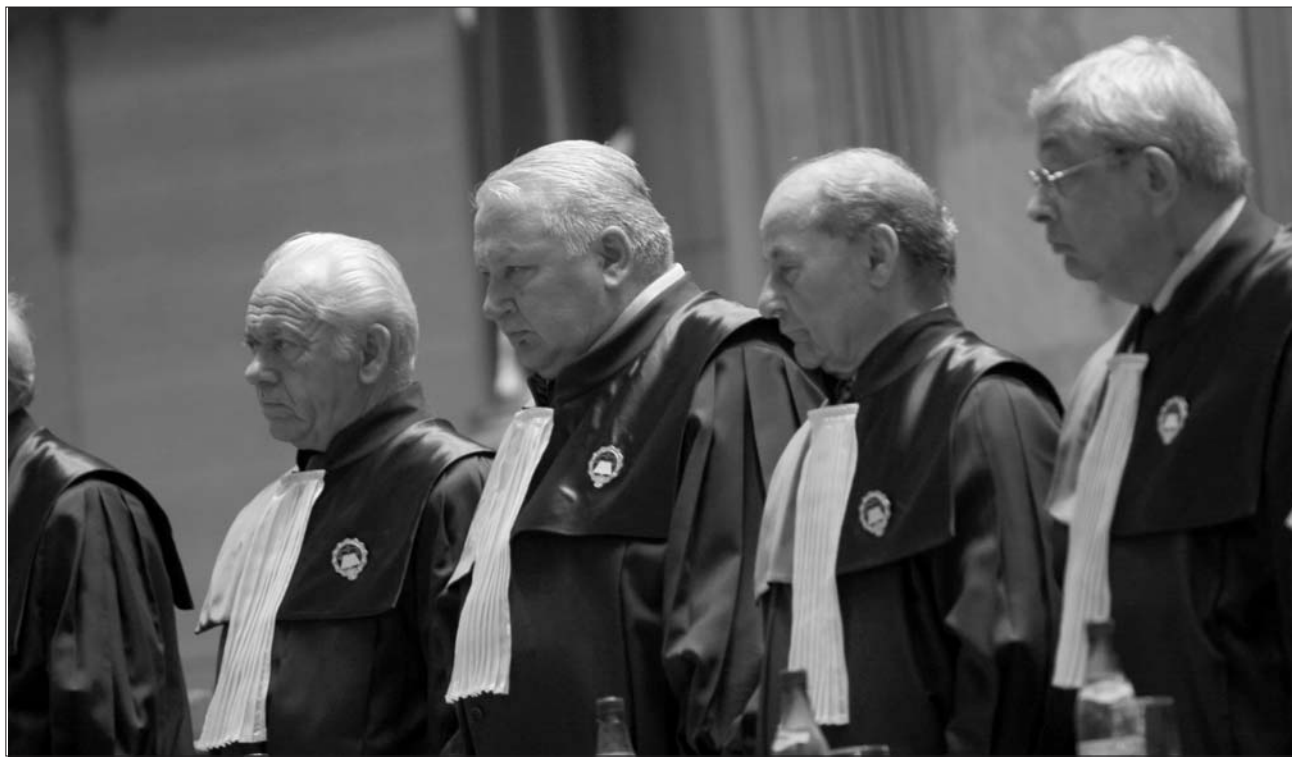
Az elmúlt hét főszereplői az alkotmánybírák voltak

az elnök gyakorlaba is ültette volna azt, még mielőtt ő és a PDL húsz százalékot vesztett a közvélemény-kutatásokon. De nem volt egyetlen terve sem, ma pedig a legfelvilágosultabb elme sem kerülheti többé el a szembe- súlást az összeomlással. A magyarazat arra, hogy több mint egy hónapja Traian Băsescu megszűnt üzenete- ket intézni a nemzethez, sokkal egyszerűbb: nincs már mit mondania. Hogy nem talált más megoldásokat a túléléshez? Ez nem érdeklő a nemzetet. Hogy mindenkinél áldozatot kell hoznia ily nehéz időkben? Nem érti meg. Hogy a jövő évtől minden jobbra fordul? Nem hiszi el. Hogy az elnök bán-