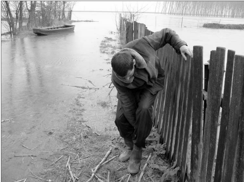
A jelenség gyakorisága szempontjából 2005-öt tartják az árvizek esztendejének

Egy évvel később 800 települést érintett az árvíz, a halottak száma 17 volt, az anyagi veszteségeket kétféleképpen becsülték. A következő esztendőben mind az emberi, mind az anyagi veszteség kisebb volt, ami csak további tétlenkedésre bátorította az illetékeseket, akik így