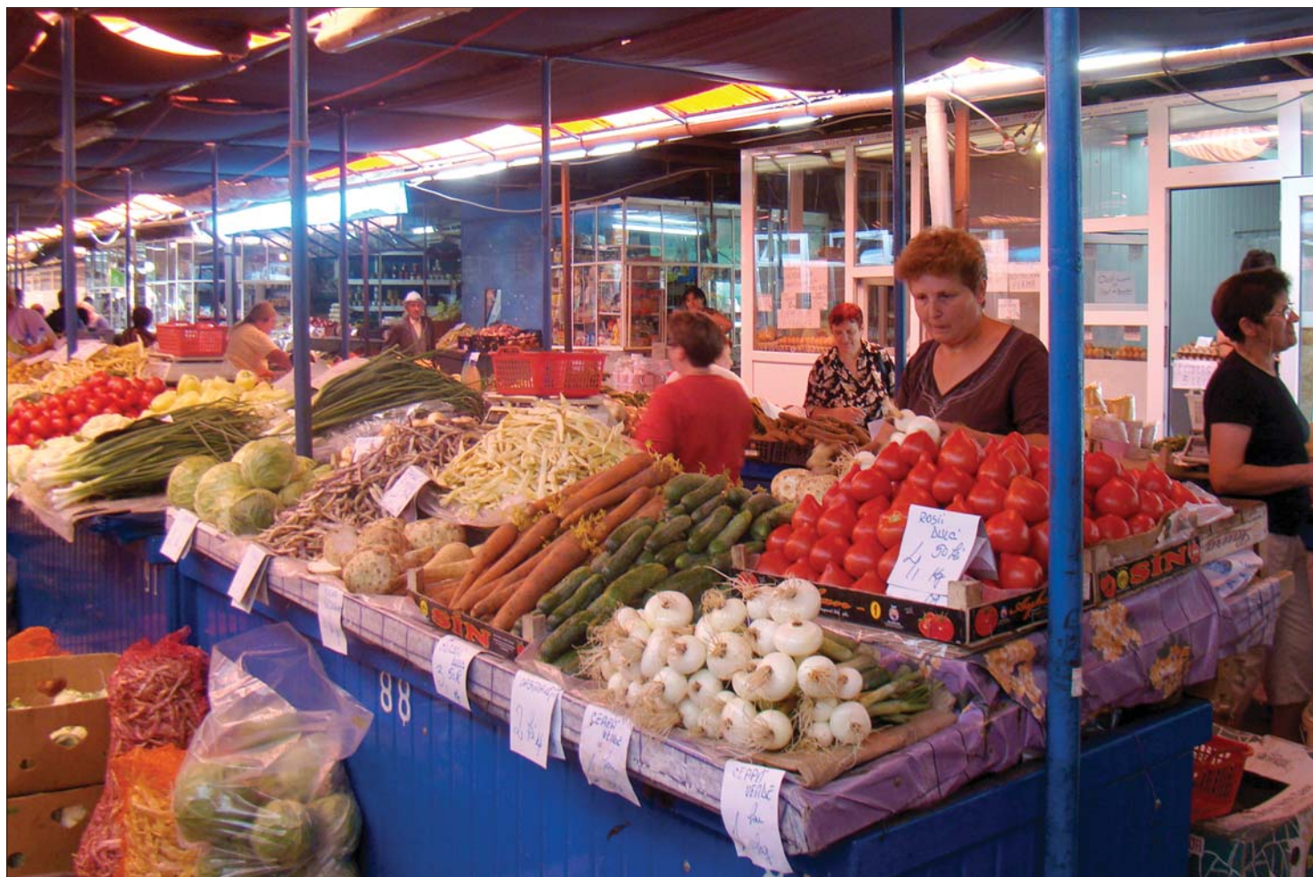
Az áfaemelés ellenére tegnap az erdélyi piacokon a friss zöldséget és gyümölcsöt a régi áron árulták a kereskedők

A hozzáadottérték-adó emelését meghaladó arányban növeltek árat a kereskedők