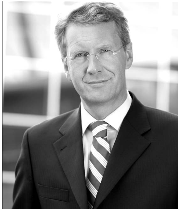
Christian Wulff pártpolitikus, a kereszténydemokrata CDU alelnöke

déstől mentes, szabad választásra szólított fel. A szerdai választás ezek után nemcsak a legdrámább, de a leghosszabb volt a háború utáni államfő-választások történetében. A szavazás háromfordulós volt, és csaknem 9 órán keresztül tartott, és az első két fordulón sem Wulff, sem az esélyesebb ellenjelölt, Gauck nem kapta meg a megválasztáshoz szükséges abszolút többséget. ◀