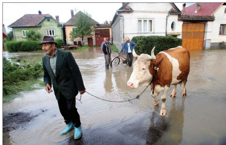
Az Olt elárasztotta a felcsíki településeket

ket. Több száz ház, közutak sérültek meg, akadózik a közlekedés is. Ma Borbély László környezetvédelmi miniszter terepszemlét tart a térségben. 7. oldal ▶