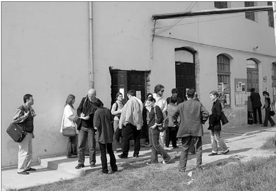
Benépesedik a Tranzit Ház udvara és megtelnek termei a hétfői ünnepségekre

A Tranzit Ház olyan állandóan változó tartalmaikat teremt és ismerteti, amelyek átjárhatóságot nyújtanak a különböző szakmai, társadalmi és etnikai csoportok között.