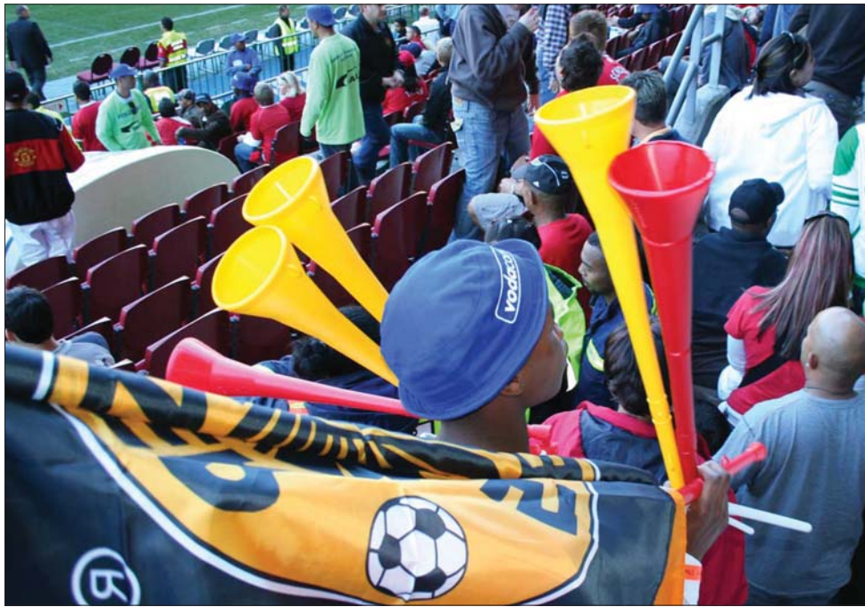
Parázs meccsek következnek: hétvégén ismét felharsannak a vuvuzelák Dél-Afrika stadionjaiban

Az eddig kerekén tíz pontot gyűjtő és veretlen Brazília a hatodik világbajnoki cím megszerzésére esélyesként néz farkasszemet az utóbbi évek tán legerősebb narancsmezés gárdával. A „cariocas”-gárda 2-1-re nyert Dél-Korea, 3-1-re Elefántcsontpart és a nyolcadöntőben 3-0-ra Chile ellen, s csak utolsó csoportmérkőzésén veszített pontokat Portugáliával (0-0). Dunga csak az eltiltott Ramiresre nem számíthat, s várhatóan a Julio Cesar – Maicon, Lucio, Juan, Michel Bastos – Dani Alves, S. Gilberto, Josue – Kaká – Luis Fabiano, Robinho kezdőtizenegyet küldi majd pályára.