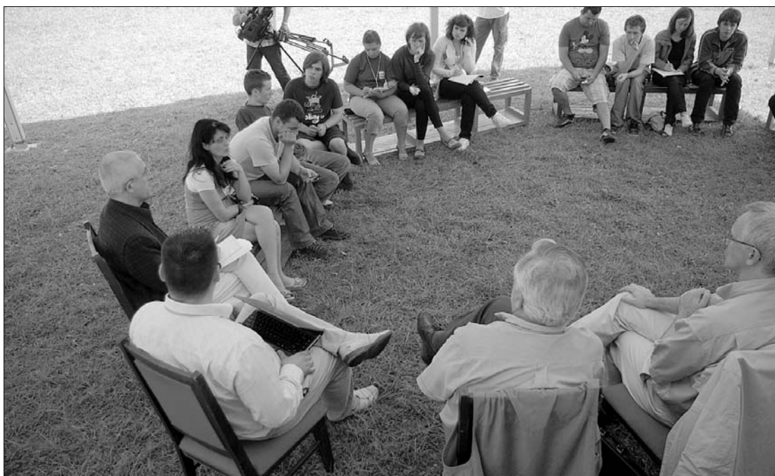
A marosfői EU-tábor fiatal résztvevői az itthon maradás vagy külföldi szerencsepróbálás dilemmáján tündödhettek