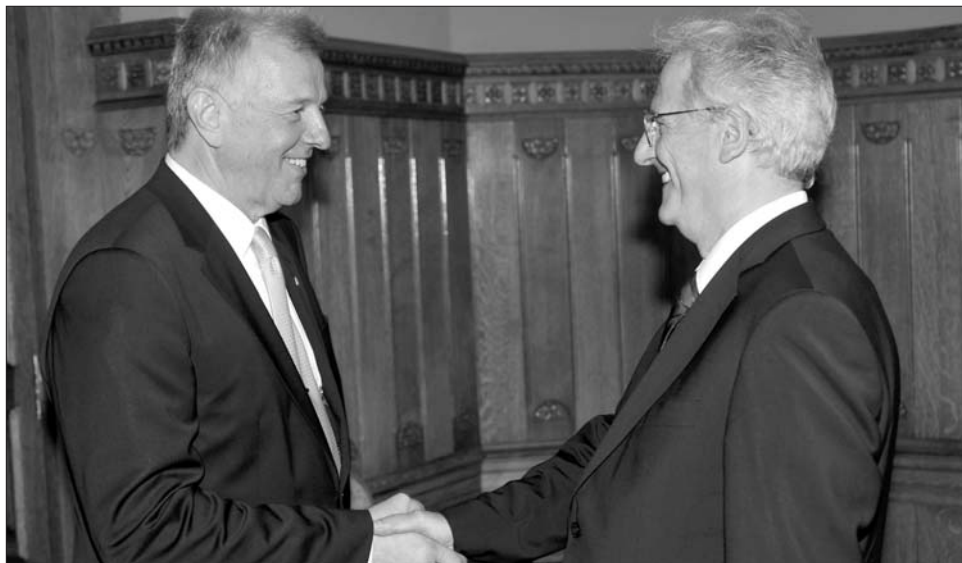
Schmitt Pál – ha jönni kell, jönni kell; Sólyom László – lojalitás és labilitás