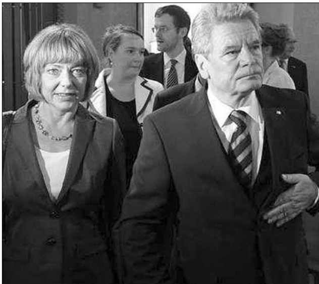
Joachim Gaucknak nem kell elvennie élettársát

Apropó közvélemény: a németek többsége ugyan ennek a választásnak is örül, mégis szívesebben fogadta volna a szociáldemokraták és a Zöldek ellenjelöltjét, a 70, életévét betöltő Joachim Gauckot, akinek nevét az újraegyesülés után a Stasi-akták (a Szekuritátának megfelelő szervezet iratai) őrzésére és kezelésére létrehozott hivatal nyomán ismerte meg a világ. A keletnémet születésű Gauck, az evangélikus lelkész egyik választási ígérete egyébként úgy hangzott: győzelme esetén elveszi feleségül élettársát, a nála 20 esztendővel fiatalabb Daniela Schadt nürnbergi újságírót, hogy vele költözhessen a Belvedere-be – most tehát mégsem kényszerül bele az ugyancsak második házasságba.