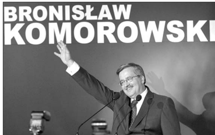
Bronislaw Komorowski már vasárnap éjjel ünnepelhetett

► Az izraeli kormány tegnap enyhített a Gázai övezet kereskedelmi zárlatán, jelentősen csökkentve a továbbra is tilalmas, főként hadi célra is alkalmazható áruk körét. A tiltott áruk listáját későbbi időpontban hozzák nyilvánosságra, de nekik elhallgatását kérő források már elmondták, hogy bizonyos feltételekkel a jövőben engedélyezik stratégiai jelentőségű építőanyagok bevitelét. Így a jövőben vasat, acélt, cementet, betontömböt, vegyi anyagot, műtrágyát és terepjárókat is engedélyeznének, amelyek felhasználását Izrael ellenőrizné szoros együttműködésben a – Gázát ellenőrző Hamásszal rivális – Palesztin Hatósággal, az ENSZ-szel vagy más, nemzetközi szervezettel, amelyek felügyelik a különféle, köztük építkezési projekteket. Ezzel jelentősen enyhül a Gázai övezet másfél milliós lakosságát három esztendeje sújtó kereskedelmi blokádnak. A zárlat ellen tiltakozott egy segélyflottilla, amelyet Izrael feltartóztatott a nemzetközi vizeken. A május 31-i akcióban életét vesztette kilenc török származású palesztinbarát aktivista és az incidens hatalmas nemzetközi tiltakozást váltott ki, amely végső soron hozzájárult a blokádnak mostani enyhítéséhez. Az új rendelkezés egy nappal előzi meg Benjámin Netanjahu kormányfő washingtoni tárgyalásait Barack Obama amerikai elnökkel, aki maga is a zárlat enyhítését követelte. Egyelőre nem világos, hogy milyen mennyiségben engedélyezi Izrael az építőanyagok bevitelét. ◀