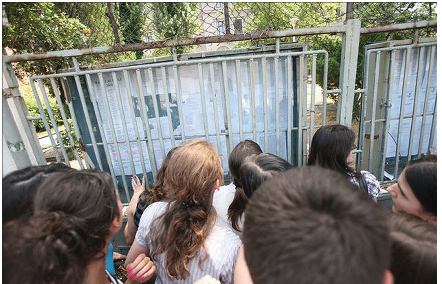
A fellebbezések előtti, nem végleges adatok szerint országosan a végzős diákok nem kevesebb mint 32,6 százaléka bukott meg a vizsgákon

A tizenkettedikesek egyharmada sikertelenül vizsgázott a hétvégi megmérettetésen