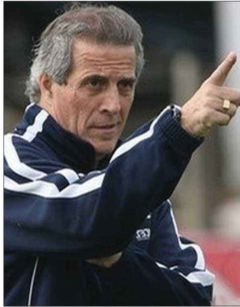
Oscar Tabarez, Uruguay edzője

A kezdő tizenegy tehát a következő lehet: Fernando Muslera – Maximiliano Pereira, Diego Lugano, Diego Godin, Mauricio Victorino – Diego Perez, Egidio Arevalo, Edinson