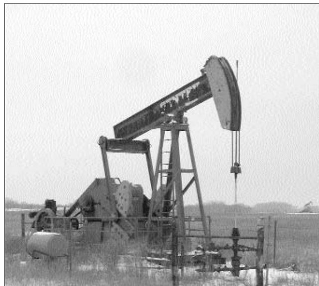
Az ország nyugati részén kezd kitermelésbe a MOL

Az elmúlt három hónap tőzsdei korrekciója, az emelkedő hitelkamat és a problémás bankközi hitelezés mind aggályokat vet fel a növekedést illetően globális szinten – nyilatkozta Roubini a Reuters -nek. Véleménye szerint az amerikai gazdaság növekedése is lassulni fog az év második felében 3 százalékról 1,5 százalékra. ◀