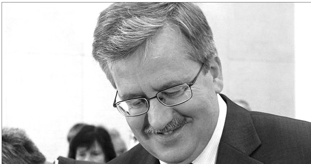
Bronislaw Komorowski. A kemény munka meghozza eredményét

Ha csak szűk többséggel is, a liberális-konzervatívként jellemzett, kormányzó Polgári Platform (PO) jelöltjének sikerült megelőznie az első választási fordulótól eltelte két hétben egyre szorosabban felzárkózó Jaroslaw Kaczynskit, az elhunyt elnök ikertestvérét, a Jog és Igazságosság (PiS) párt elnökét, aki egyszer már részese volt a hatalomnak. Lech és Jaroslaw a lengyelek kedvenc testvérpárja volt már az 1960-as években is, amikor eljátszották a