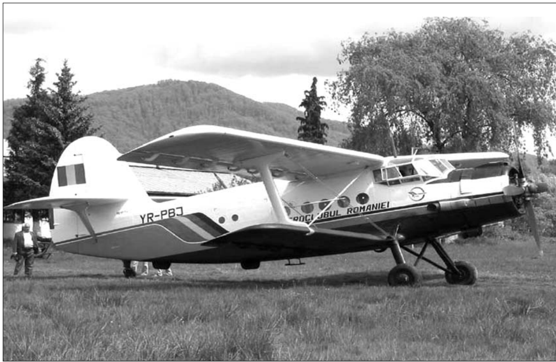
Az ötvenes években gyártott típusú AN-2 típusú repülőt a szakértők rendkívül biztonságosnak tartják

A tuzlai szerencsétlenség az elmúlt öt év legnagyobb légi katasztrófája Romániában. Legutóbb, 2006 novemberében két MIG 21 típusú katonai repülőgép ütközött össze hadgyakorlat közben a levegőben, Maros megyében, Marosvásárhely közelében. A pilótáknak sikerült katalpáltaniuk. ◀