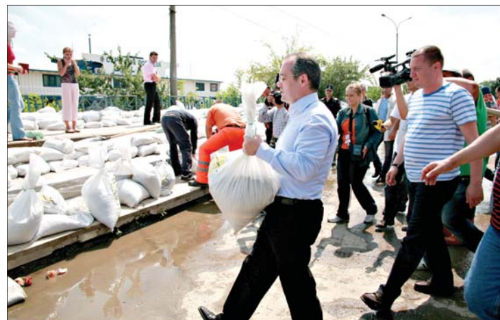
Kormányfő a gáton. Emil Boc miniszterelnök homokzsákokat cipel

▶ Emil Boc kormányfő Galaccon igyekszik bizonyítani, hogy legény a sürgős ütemben emelt védgáton, a Duna menti városban több mint nyolcezer embert fenyeget a sosem látott mértékű áradás, tizenkétezer ember munkahelyét veszélyezteti a megáradt folyam. 7. oldal ▶