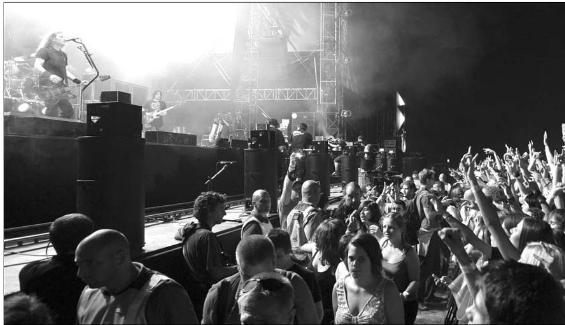
Az idei esemény egyik legjobban várt fellépője minden bizonnyal a Tankcsapda lesz

a Kalapács, a Superbutt, a Nevergreen, a Dalriada, az Agregator, az AB-CD vagy a finn Korpiklaani is. Közel negyven csapatot várnak a szejkefűrdői színpadra, ahol a régi motorosok, nagygűk mellett, fiatal tehetségek is lehetőséget kapnak a bemutatkozásra.