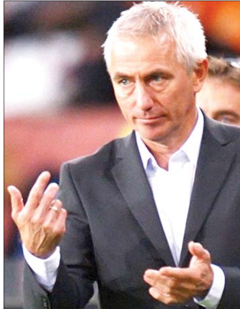
Bert Van Marwijk, a hollandok trénera

Az első (1930) és negyedik (1950) világbajnokságon győztes dél-amerikai gárda már rég nem számít futballnagyhatalomnak, hiszen 1970 óta nem jutott a legjobb négy közé a vb-ken.