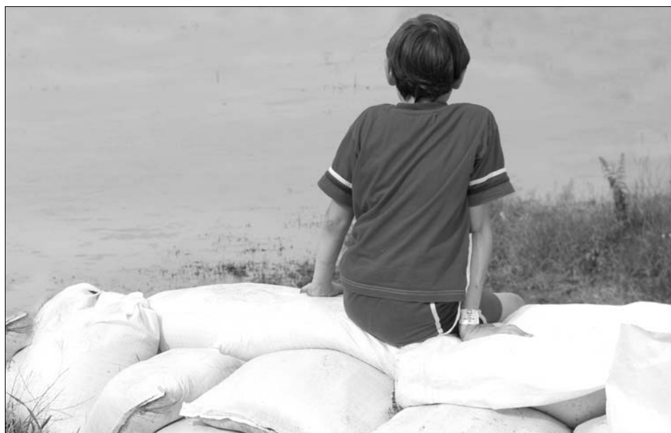
Nehéz időszak vár a következő napokban is az árvíz sújtotta településekre

„Két héten belül segítséget kér a kormány az Európai Unió Szolidaritási Alapjától az árvízkarok utáni rehabilitációhoz. Az ehhez szükséges kárfelmérés most folyik, amint elkészül a részletes dokumentáció elindítja a megfelelő eljárást a Borkabinet” – jelentette be tegnapi sajtótájékoztatóján a kormányfő. Emil Boc szerint az idő sürget: az első áradások, vagyis június 23-a után legkésőbb tíz héttel be kell nyújtani a segítséghez szükséges folyamodványt, a lehívható legmagasabb összeg 75 millió euró. Ilyen jellegű segítséget már kért és kapott Románia, öt évvel ezelőtt: akkor 71,2 millió euró érkezett a Szolidaritási Alaptól. Az árvízkarok rendezését pedig – fogalmazott egyértelműen a kabinetvezető – következetesen véghez kell vinni, mert a károsultak jelentős része türelmetlen és „ingerült”. Az Országos Meteorológiai Intézet jelentése szerint a több mint két hete tomboló katasztrófa ezen a héten sem enyhül, szerdáig