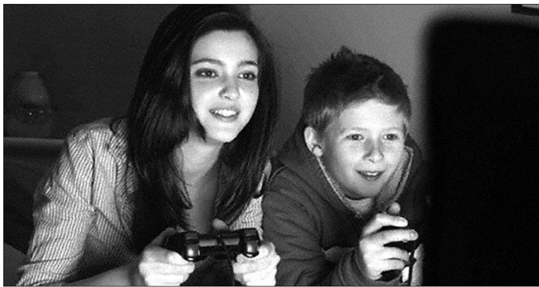
A román média- és szórakoztatóipar piaca 2014-ig 3,5 milliárd dolláros bevétellel számolhat

A PwC szerint az elkövetkező négy évben médiafogyasztók magatartásában is változások következnek be: nő mobiltechnológia befolyása, és az internet szerepe a médiafogyasztásban, illetve egyre többen fognak fizetni az online tartalmakért. ◀