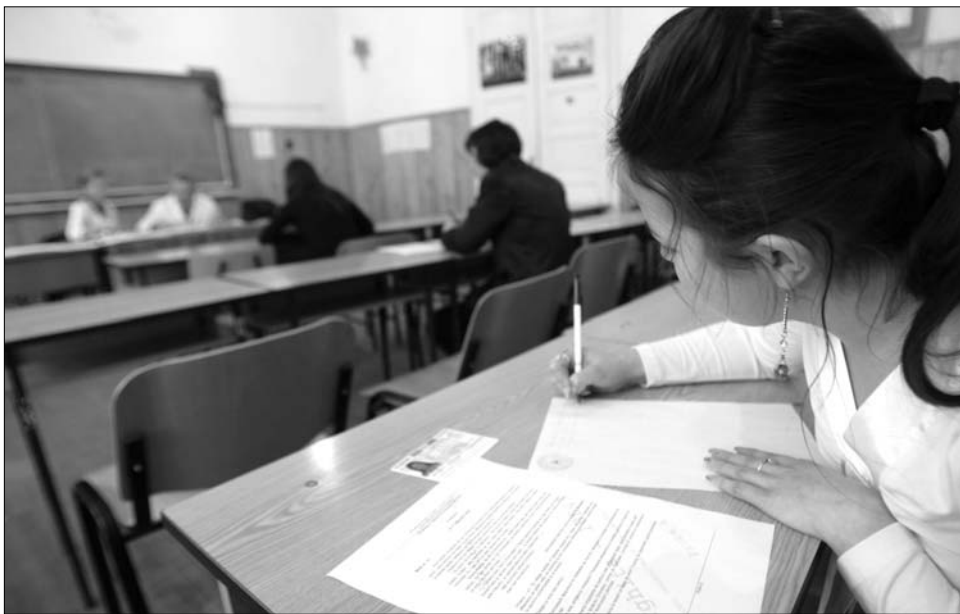
A magyar diákok továbbra is románból érték el a leggyengébb eredményeket

Hargita megye Kovásznát is alulmúlta: itt 71 százalékos a sikeres érettségizők aránya: összesen 998-an