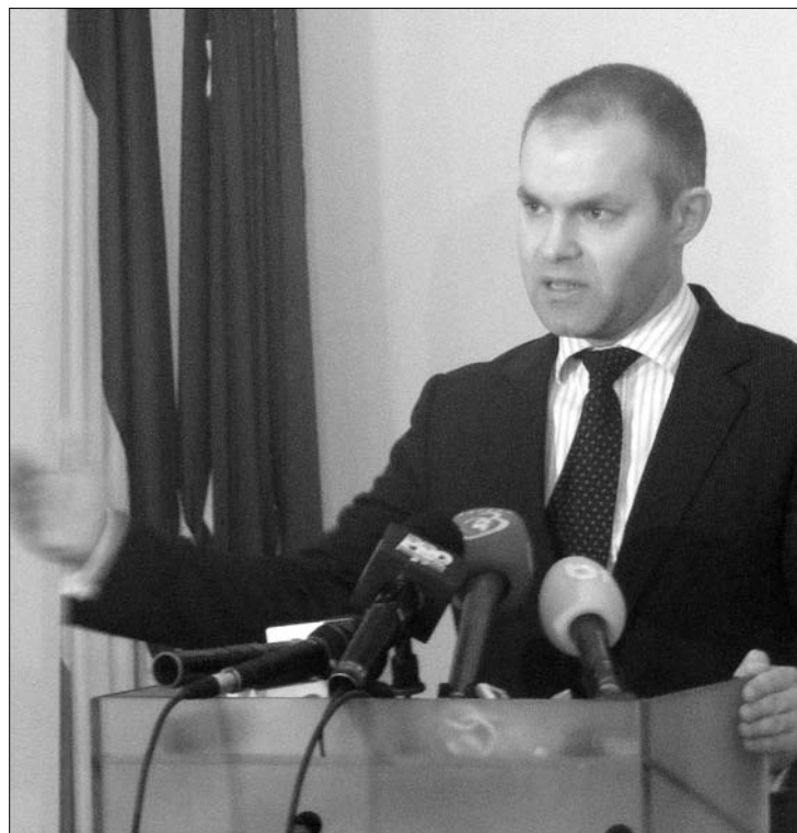
Daniel Funeriu oktatási miniszter