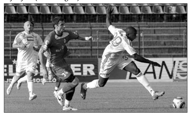
Tallinnban 1-1-re mérkőzött a DVSC „az odavágón”

Besiktas / Vikingur, Valletta / Ruch Chorzow – Austria / Siroki Brijeg, Inter Turku (finn) – Genk (belga), Crvena Zvezda (szerb) – Slovan Pozsony (szlovák), Nordsjælland (dán) – Sporting CP (portugál), IF Elfsborg / FC Iskra – FK Ventspils / FK Teteks, Shamrock Rovers / Bnei Jehuda – Juventus (olasz), KR Reykjavik / Karpatij Lvov – FC Zesztafoni / Dukla, CSZKA Szófia (bolgár) – Cliftonville / Cibalia, Beroe Sztara Zagora (bolgár) – Süduva Rapid Bécs, Maritimo / Sporting Fingal – Honka Espoo / Bangor City, Liverpool (angol) – Rabotnicki / Mika, Stabaek (dán) – Dnyepyr Mogiljev – WIT Georgia / Banik Ostrava, OB Odense (dán) – Zrinjski Mostar / Tre Penne (San Marínói).