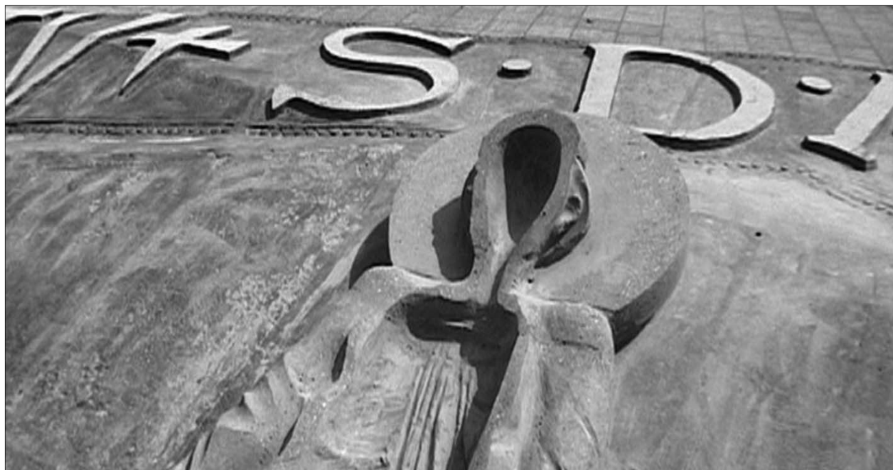
Mikor kapja vissza az arcát az államalapító? A köztéri dombormű eredetijének engedélyeztetésén dolgozik a nagybányai városháza

▶ Tűz ütött ki a Házsongárdi sírkertben lévő piramis alakú, Béli-kriptában penterken, tudósított a szabad-sag.ro . Az 1800-as évek közepén épült impozáns homlokzatú sírbolt tetőszerkezete teljesen leégett, szerencsére a belső részébe nem hatolt be a tűz, a helyszínre érkezett két tűzoltókocsinak időben sikerült eloltani a több méter magasra csapó lángokat, írja internetes oldalán a kolozsvári napilap. A temetőben dolgozók kizárják, hogy szándékos gyújtogatásról lenne szó, arra hivatkoznak, hogy igen ritkák az ilyen esetek. A találgatások elkezdődtek, és a rendőrség nyomozást indított, hogy remélhetőleg minél hamarabb kiderítse a tűz okát. A kriptának leginkább a tetőszerkezete égett le, valamint a jobb oldali hátsó fala, ami arra is utalhat, hogy a tűz onnan terjedt a tető felé. A temető személyzetétől a Szabadság megtudta: a kripta ajtaja zárva volt, feszítési, betörési próbálkozásokra nem utalnak jelek, a zárt a tűzoltók feszítették fel. ◀