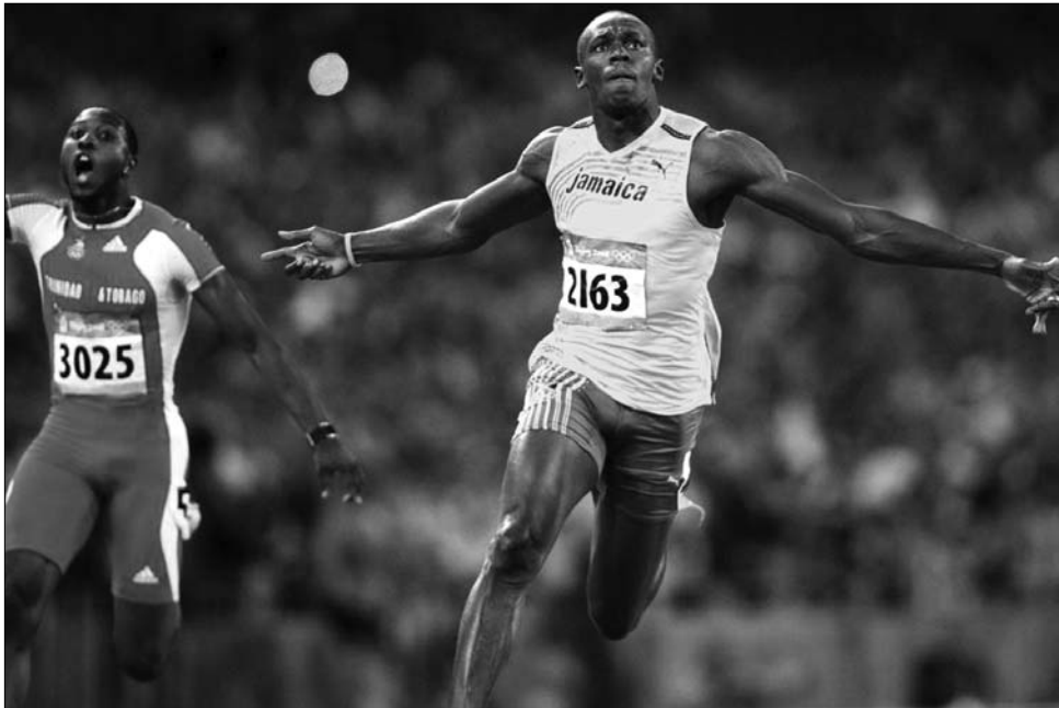
► Powell loholt Bolt nyomában. A jamaicai világcsúcstartó 9.84 mp alatt teljesítette a 100 méteres távot

A sportok királynője világból származó hír szerint visszakapják a 2000-es sydney-i olimpián szerzett aranyérmeiket az amerikai 4x400-as női váltó tagjai, akiket korábban azért fosztottak meg medáljaiktól, mert csapattársuk, Marion Jones doppingolt az ötkarikás játékok