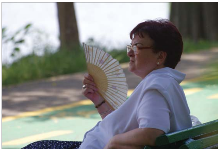
Hétfvégen 37 fokot is mutatott a hőmérők higanyszála

▶ Jelentéktelen méretű patak okozott katasztrófát a hétfvégen Kovászna megyében: váratlanul vitte el a víz Bölönt. Az ország szerte tomboló kánikula nem volt váratlan, de az előrejelzések ellenére sem tudtak felkészülni az emberek az időjárás újabb megpróbáltatásaira. 7. oldal ▶