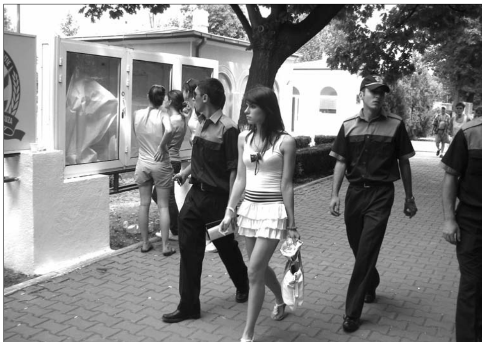
Angyalbörben. Ha sikerül a felvételi vizsgája, az ifjú hölgy is kadétruhat öltöhet magára

Az intézményvezető szerint a másik nagy előnye az akadémiának a biztos munkahely. „Mondjanak nekem még egy olyan felsőoktatási intézményt, amely államvizsga után, első perctől állást garantál végzőseinek. Az ország tele van diplomájukat lobogtató végzősökkel, akik hiába kilincselnek, nem kapnak munkát sehol. A rendőrségi munkahelyek pedig biztos megélhetést garantálnak” – ecseteli az előnyöket a rektorhelyettes. ◀