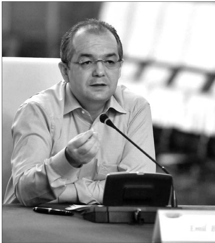
Emil Boc kormányfő tegnap is távértekezletre hívta a prefektusokat

Az érintettek régóta követelik az adó eltörlését. A kis- és középvállalkozások országos tanácsa szerint a költségvetés idején máju-