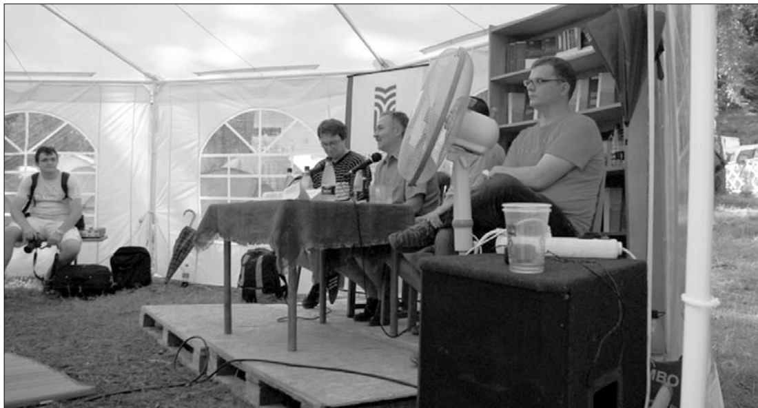
Gondban az internetes média is. Az erdélyi magyar online sajtó képviselői a pénzügyi panaszokdakt