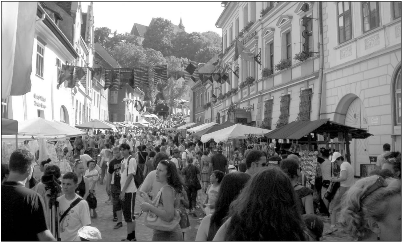
Fesztiválos kavalkád Segesváron. A középkori hangulatra vágó tömeg a Várhegyre vezető lépcsősor felé vette útját

Már a vonaton hallható volt magyar, román, német, angol, francia és szerb beszéd is, ami azt mutatta, hogy az időutazás, amit a segesvári kis utcák, mesebeli mézeskalács-házak hangulata tud biztosítani, nemcsak az ország területén, de messze földön is híres. Hogy elsősorban mi vonzhatta a sok külföldi turistát, azt nem nehéz kitalálni, már csak a jó üzleti érzékel megáldott bővítiárusok kínálatából is kiderült, hogy leginkább a Drakula-mítosz a kelendő: roskadoztak a polcok a vámpír-maszkok, Drakula-kávé és Vlad Ţepeş képmására dizájnolt sörös kancsókat. Szerencsére a szervező Segesvári Idegenforgalmi Egyesület, Európa egyik legjelentősebb középkori fesztiválját az idén ebből a giccsparádéból magasabb szintre emelte, és a vár területéről – ahová elég borsos áron jutott be minden halandó – kiszorítva a huszonegyedik század műanyag remekeit, izelítőt nyújtottak középkori harcokból, fegyver bemutatókból, a lovagi tornák, színjátékok, utcai zenészek és zsonglőrök, vala-