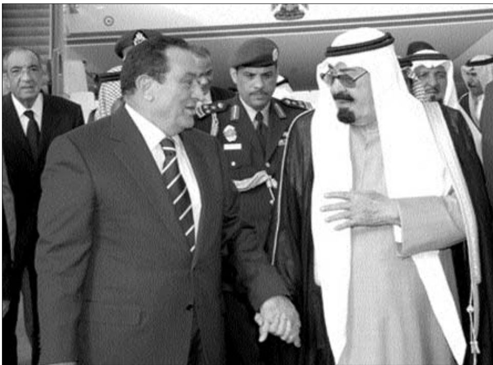
A két beteg és öreg vezető: Hosni Mubarak és Abdalláh király

Egyre valószínűtlenebb, hogy Mubarak, az egykori