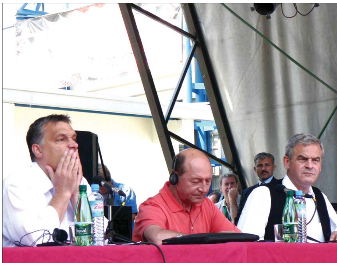
„Viki-koncert”, kísérettel. Orbán Viktor kormányfő, Traian Băsescu elnök és Tőkés László EP-alelnök