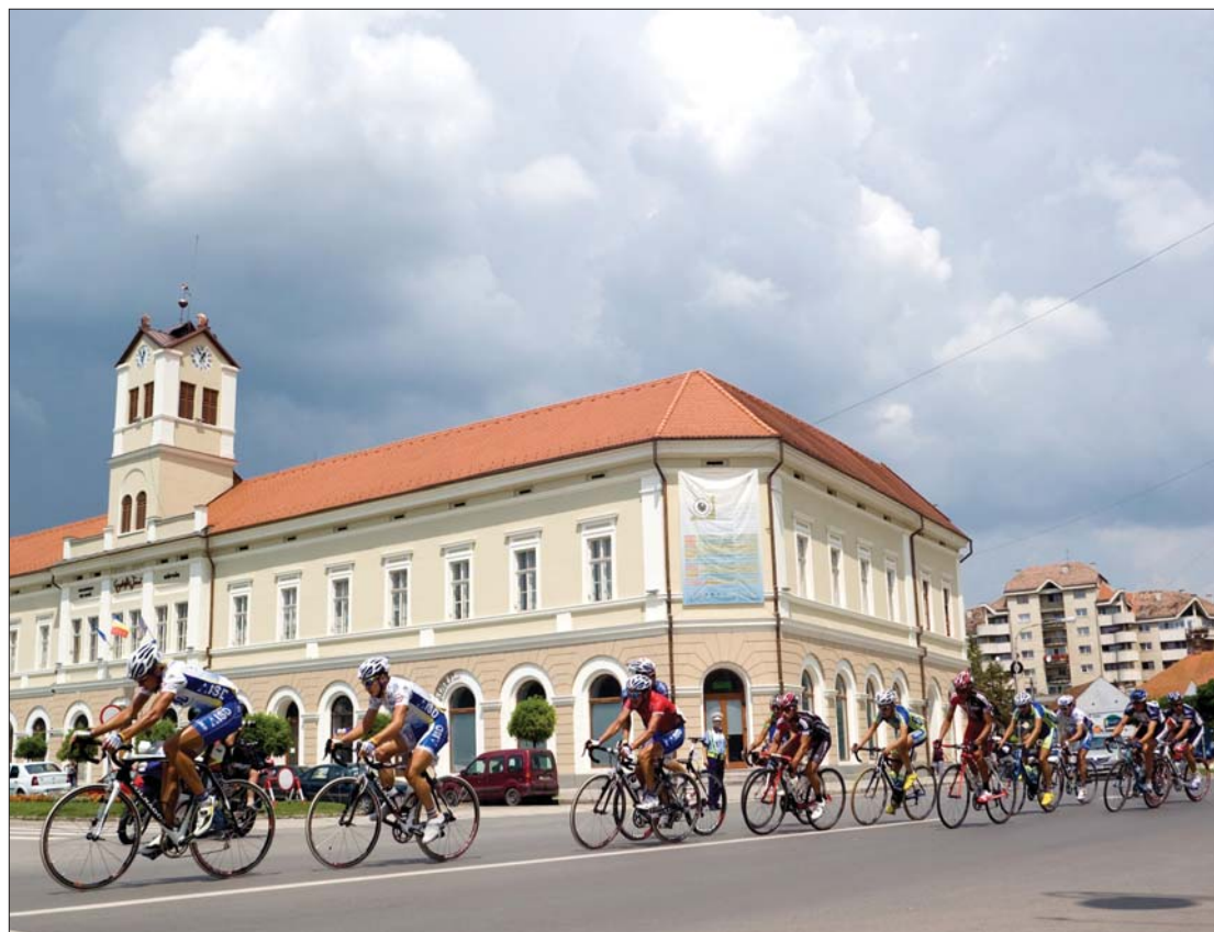
Biciklikonvoj a városközpontban. A kerékpározókat megcsodálhatta egész Csíkszereda