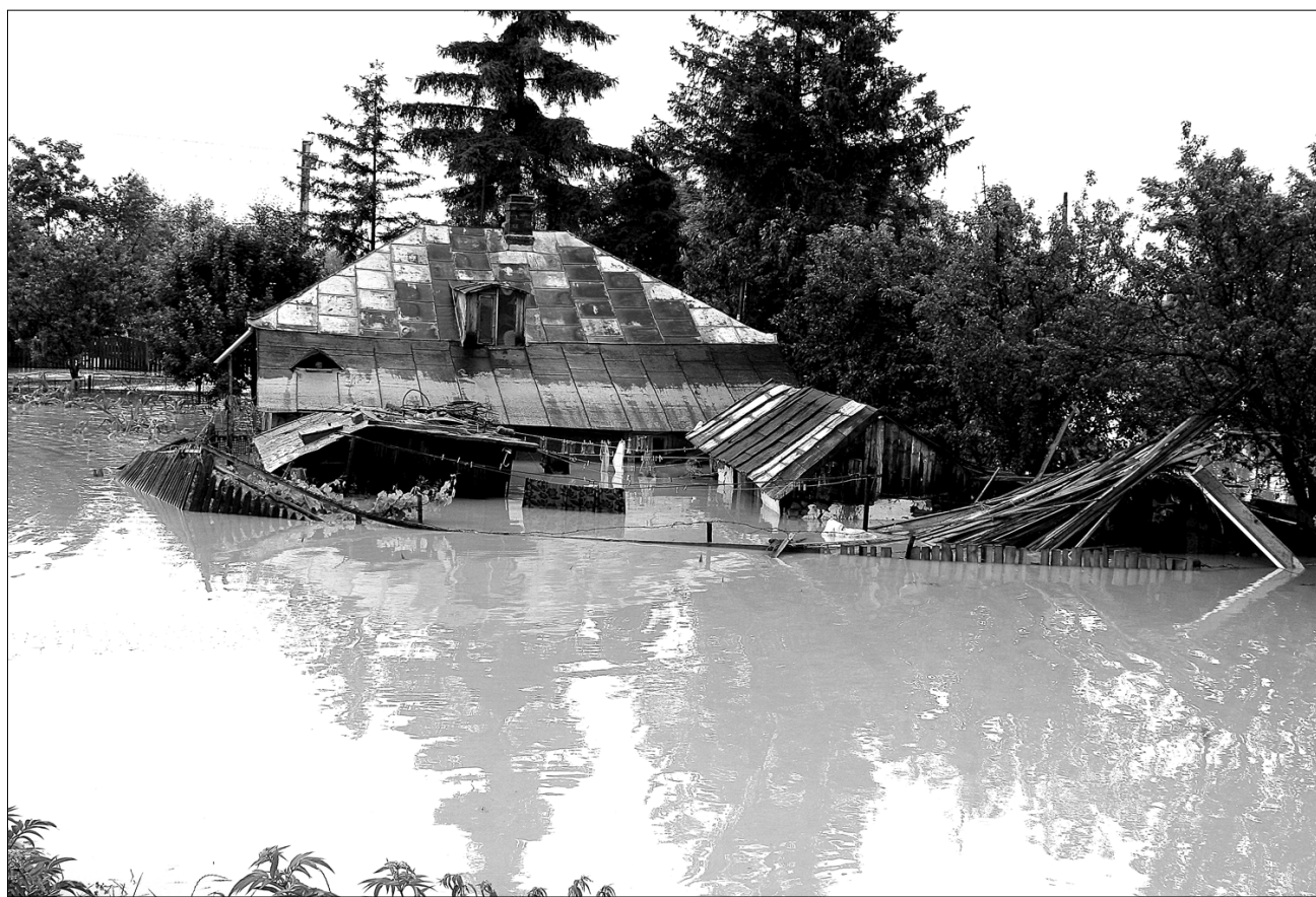
Idén még kaphatnak kormányzati segítséget az árvízkarosultak, jövőtől azonban a kötelező biztosításnak kell fednie a károkat

„A kötelező biztosítás nagyon keveset fed, értéke attól függ, hogy úgynevezett A vagy B típusú ingatlanról van-e szó. A típusú a kőből, betonból, fémából és fából készült ház, B típusú a vályogház. Évi tíz vagy húsz