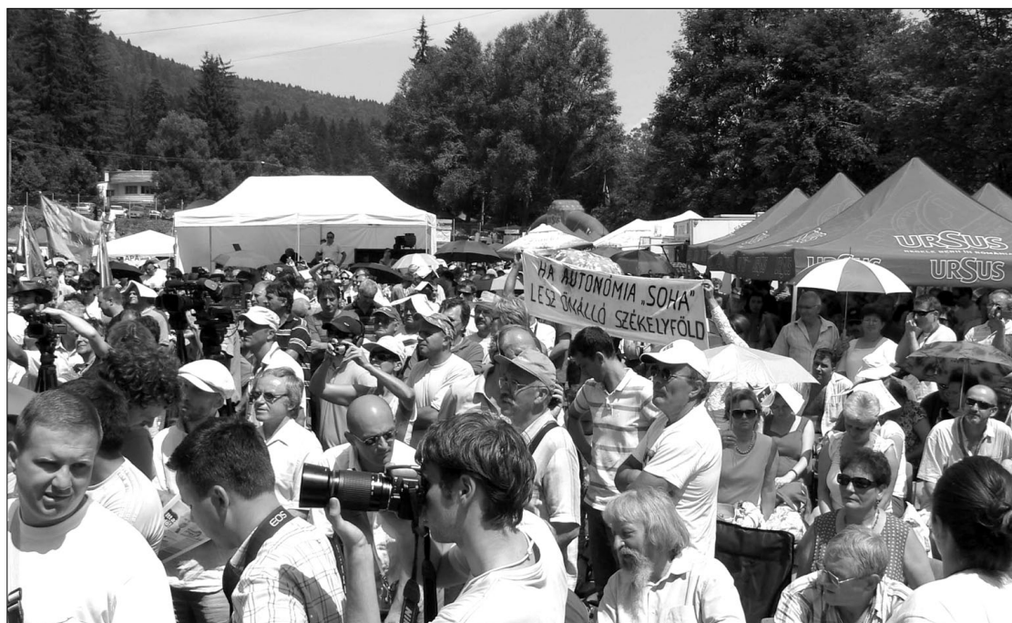
A tusványosozókat nem tántorították el az infrastruktúra-problémák sem, például a mobiltérerő hiánya

Az államháztartás témakörében az elnök kifejtette, képtelen helyzet az, amelyben egy ország azért veri adósságokba magát, hogy kifizethesse a nyugdíjakat és a fizetéseket. „Ha fejlesztések helyett továbbra is e célból veri magát adósságokba a kormány, teljes leszakadásra kárthatja az országot – mondta az államfő. – Nem költhetünk többet, mint amennyit termelünk.” Szerinte a válság előtti kapitalizmus megszűnt létezni, helyébe újat kell építeni. A gondolatmenetet folytatva elmondta: a megemelt fizetések, szociális juttatások és nyugdíjak mögött tulajdonképpen hatalomra törekvő politikai alakulatok szavaztatásáról állt. „Ebből csak a termelői munka, nem a spekulatív gazdaság húzhatja ki az országot” – tette hozzá. Emlékeztetett, hogy két éve, amikor a nyugdíjak gyakorlatilag megduplázódtak, ő már figyelmeztetett arra, hogy kiürül az államkassza. ◀