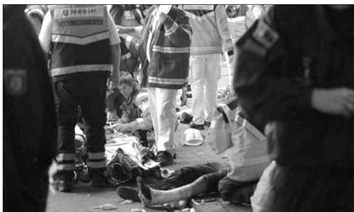
Gázol Németország. Letaposták egymást az alagútban rekedt fesztiválozók

A katasztrófa akkor történt, amikor egy alagútban összetorlódott a tömeg, és a fiatalok kétségbeesve keresték a menekülés módját. Szinte felfoghatatlan: a rendezőknek megtiltották, hogy több menekülő útvonalat is megnyissanak. A tragédia ugyanis kevéssel a rendezvény vége előtt kö-