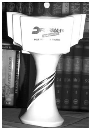
Az 539. számú példány

Az autós cirkuszért rajongó maroknyi magyar lobbizás azonban serény tevékenységbe kezdett. Mocorgott a Magyar Autóklub, a „túrt” kategóriába tartozó autósport megannyi képviselője, és bár szigorú kontroll alatt, a párt-