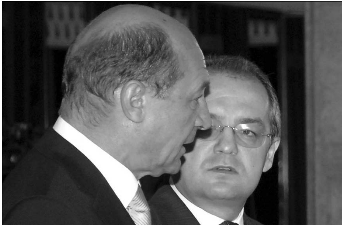
Az ország legutáltabb emberei? Traian Băsescu államfő és Emil Boc kormányfő felérték politikai tőkéjüket.