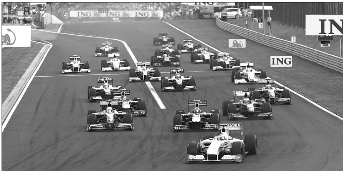
Ez volt tavaly Mogyoródon. Tömörül a mezőny a 2009. évi futam rajtja után

A miniszterelnök-helyettes szigorú takarékosági intézkedéseiről volt (egyebek mellett) nevezetes, például a vállalati reprezentációban betöltötte a kávé és a konyakot, helyette csak teát, ásványvizet vagy narancslevet volt szabad felszolgálni. (A pártközponban például azért csapta rá vendéglátójára egy palesztin küldöttség az ajtót, mert Jaffával kínálták – ez volt a műnarancslé fantázianeve.) A Formula-1, mint amolyan úri huncutság, kapitalista csökevény, sokba kerülne (egyébként kerül ma is, csak épp a turisztikai ágazat jövedelme és az országimázs ezt bőven ellentételezi), a várható bevétel pedig csak hosszabb távon érte volna meg. Akkor még nem létezett áfa, az idegenforgalmi dollárnak mesterségesen ala-