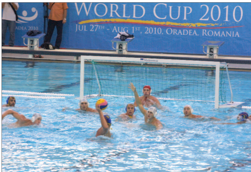
Az utolsó csoportkörben a román válogatott 14-8-ra kikapott Spanyolországtól.

lyezettjével, azaz az Egyesült Államokkal mérkőznek meg. Az amerikaiak az utolsó körben 9-7 arányban alulmaradtak a horvátokkal szemben, így ebben a kvartettben Horvátország, Szerbia, Egyesült Államok, Kína lett a végső sorrend. Az A csoport zárómérkőzése, az Ausztrália–Irán-összeesapás lapzártánk után fejeződött be. A mai negyedöntők után holnap az elődöntőket rendezik, vasárnap a bronzmeccs és a finálé szerepel a programban. ◀