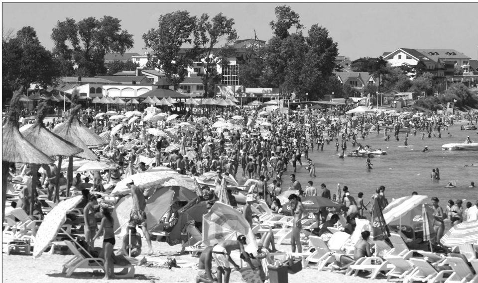
Aki az előző években Egyiptomot választotta, most egy bulgáriai célponttal is megelégszik

Az idei árakból átlagosan 20-30 százalékot engedtek a tavalyiakhoz képest az irodák, tavaly pedig már sor került egy alapos árcsökkentésre. „Hiába engedünk az árakból, ha nincs pénz, az emberek kénytelenek otthon tölteni a szabadságukat” – ismereti a piaci patthelyzetet a lapunknak nyilatkozó Kacsó. A kitarító utazók a 25 és 45 év közöttiek, ők azok, akik külföldi utazások megoldásának révén még tudnak félretenni nyaralásra. „Minden évben vannak új kliensek, de inkább a gyakorlott utazók ragaszkodnak idén is a szervezett utakhoz. A tapasztalat azt mutatja, hogy többnyire az all inclusiv ajánlatokat részesítik előnyben, hisz így, ha