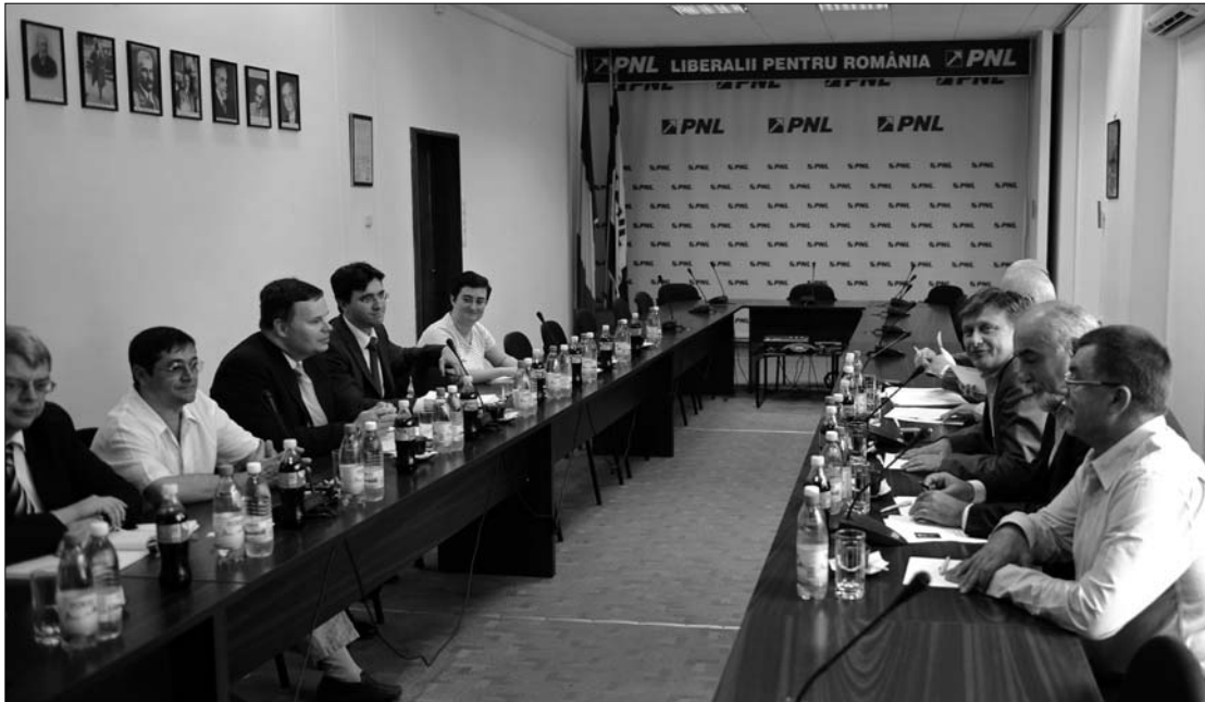
Az IMF-küldöttség protokoll-látogatását a PNL a kormány hibáinak kihangsúlyozására használta