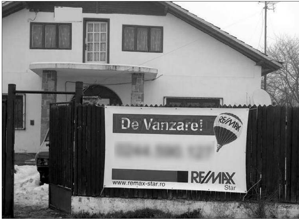
Az ingatlanok még mindig Bukarestben a legdrágábbak, míg legolcsóbbak Temesváron

Bár az olcsulás egyaránt érintette a régi és új lakásokat, Bukarestben például az