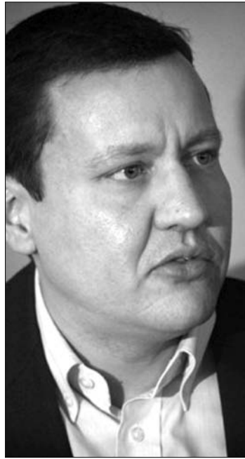
Daniel Lipšic belügyminiszter

„Magyarország szokatlan, nem európai törvényt fogadott el, amely alapján az is kaphat állampolgárságot, aki soha nem élt Magyarországon, akinek semmi köze az országhoz” – állította Daniel Lipšic szlovák belügyminiszter abban az interjúban, amelyet az Új Szó című szlovákiai magyar napilap közölt. „Ilyesmit tett korábban Oroszország Dél-Oszétiával kapcsolatban vagy Románia Moldáviával összefüggésben. Viszont Közép-Európában ez felettebb szokatlan. Klasszikus politikai taktika, hogy nacionalizmussal kell elterelni a polgárok figyelmét más, komoly problémákról” – tette hozzá Lipšic. Megjegyezte: van elképzelése a probléma megoldásáról, de „javaslataim nem a sajtóban fogom elmondani, előbb a koalíciós partnerekkel kell egyeztetni”.