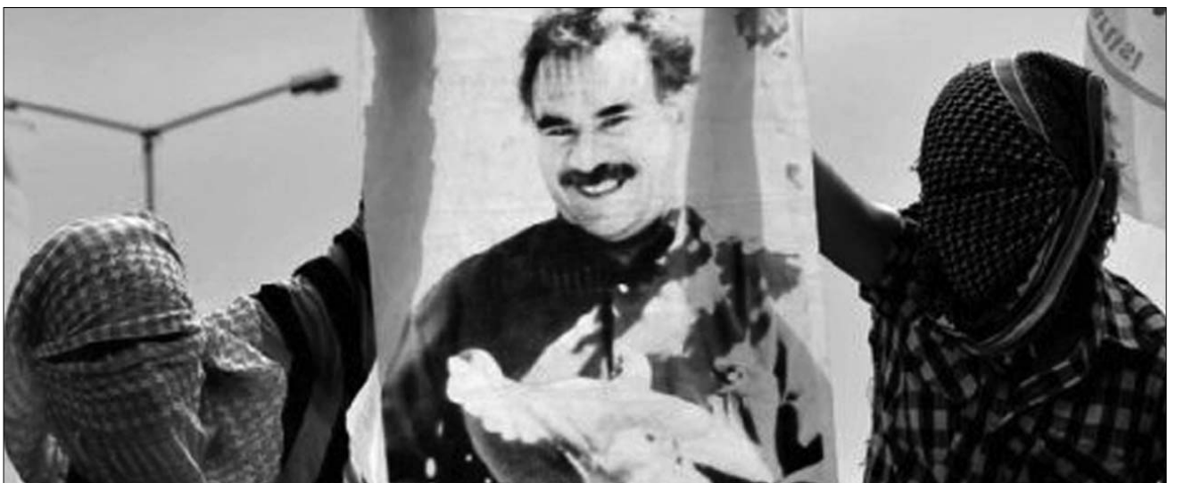
Kurd tüntetők életfogytiglani büntetését töltő vezérük, Abdullah Öcalan fényképével

Mindez közrejátszhatott abban, hogy az elmúlt hetekben Ankara és a kurdok között a konfliktus újra kiéleződött. A PKK szélsőséges szárnyának egységei szinte naponta borítják lángba a szíriai-iraki-iráni határ