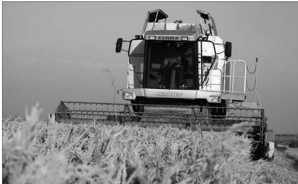
Csak az aratás befejezése után derül ki, hogy Romániának szüksége lesz-e búzaimportra

Ennek ellenére nincsenek irigylésre méltó helyzetben a magyar gazdák: az egyre kiszámíthatatlanabb időjárás, a jégesők és a viharok hatalmas károkat okoztak a mezőgazdaságban, melynek elsősorban a biztosítótársaságok fizetik meg az árát. A Magyar Biztosítók Szövetségének júliusi adatai alapján közel hétezer mezőgazdasági káresetet jelentettek be a biztosítótársaságoknál – számolt be róla a Napi Gazdaság – a bejelentett károk értékét a szakemberek hatmilliárd forint fölé becsülik, ugyanakkor arra is figyelmeztetnek, hogy az immár „szokásos” augusztusi vihar szezon még csak most kezdődik. ◀