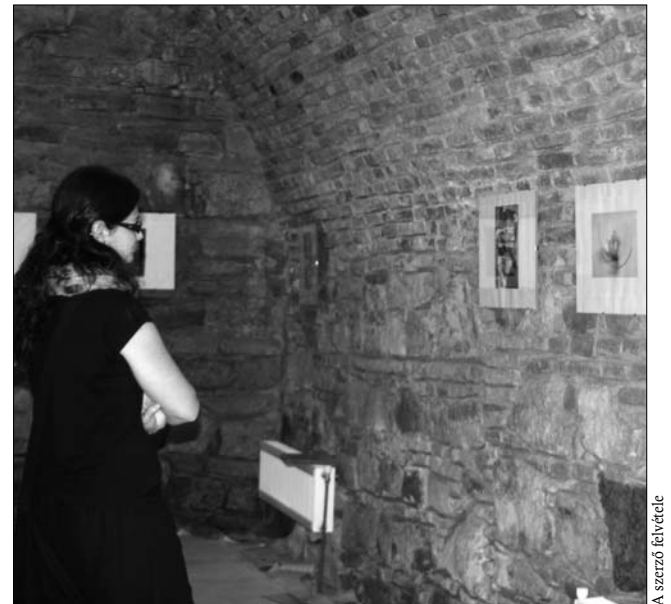
A kiállítás az emlékezet és a képzelgés világát próbálja feltárni

lisan is kötődik a művésznek korábbi kiállításához, melyről lapunkban tudósítottunk, ez most látható képeken is feltűnik a CD és a digitális adattárolás motívuma, a 0101 végtelen számsora. A fenti motívum mellett az alkotásokon végigvonul a szemüveglencse, csiga formájú kövecske, átlátszó műanyagtasak és különböző üvegcsék. A képek világa kizárólag ezekből a kis formátumú tárgyakból épül fel, és amint a cím is sugallja a látható realitáson túli dimenziókba vezet, az emlékezet és a képzelgés világát próbálja feltárni. ◀