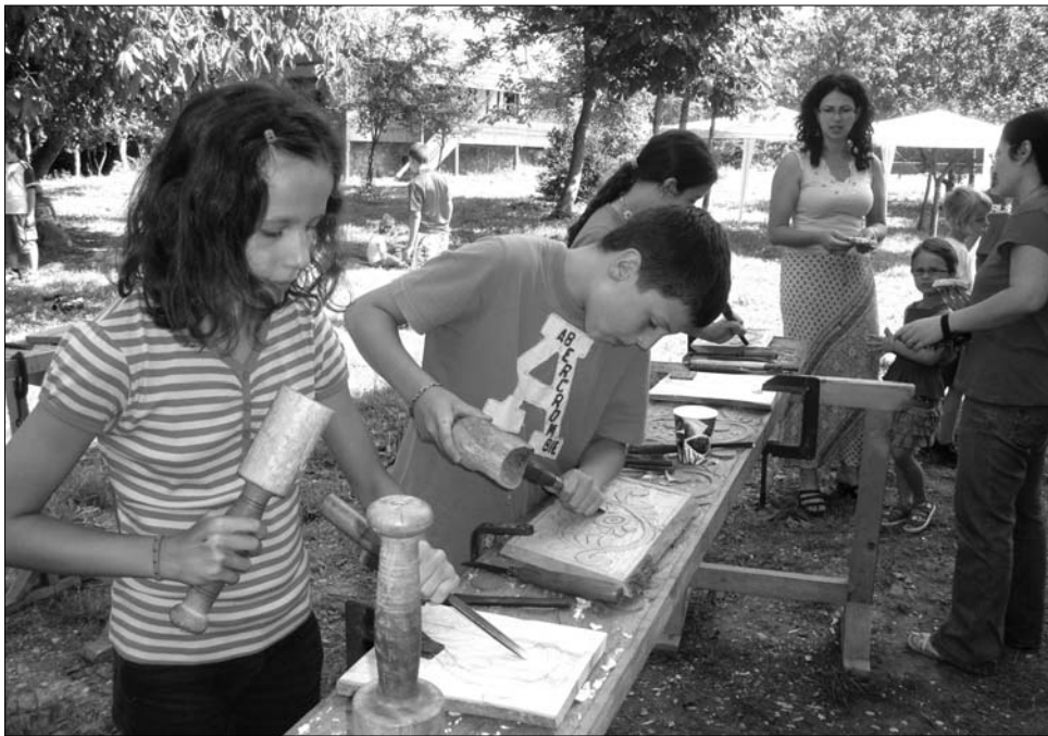
Az alkotótábor résztvevőit a munkaszeretetre és precizításra is rávelelik Méréfalván