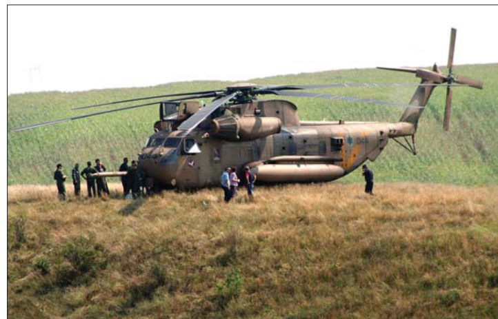
Az izraeli gépeknek nem kedvez a román légtér

▶ Kényszerleszállást hajtott végre tegnap reggel két izraeli helikopter Argeş megyében. Az incidens egy héttel az után történt, hogy Brassó megyében lezuhant egy szintén izraeli szállítóhelikopter, a fedélzetén tartózkodó hét személy közül senki nem élte túl a balesetet. 3. oldal ▶