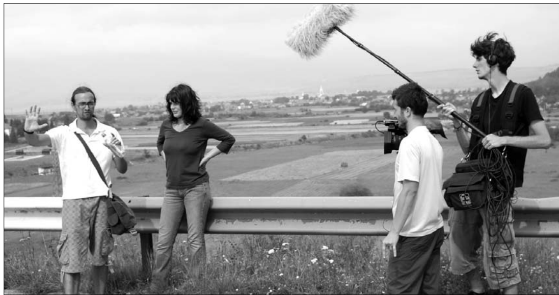
A fiatal filmesek legkevesebb öt kisjátékfilmet és hét animációs filmet készítenek a tiznapos táborban