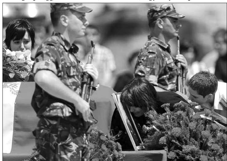
Tegnap temették el a múlt heti szerencsétlenség román áldozatát

A szervezett bűnözés délkelet-európai terjedésének veszélyére figyelmeztet az Európa, miután kiderült, hogy a hírhedt Hells Angels motorosbanda székelyeket telepít a régióba. (Románia liberá) ▶ Ötvenmillió eurós uniós támogatásra tett szert a kolozsvári BBTE, mely jelenleg mintegy ötven uniós projektben vesz részt. (Románia liberá) ▶ Az AIDS és különböző hepatitis-megbetegedések robbanásszerű elterjedésétől tartanak a szakértők, mivel lassan támogatást nélkül maradnak azok a nemzetközi segélyprogramok, melyek a kábítószerfüggők és prostitúáltak számára ingyen juttattak injekciós tűket és övszereket. (Evenimentul Zilei)