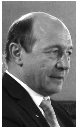
Traian Basescu – megválasztották, de hogyan

Chivu Stoica és elvarátaik könnyen ellenőrizhetőnek tekintették. Hogy ők voltak az elsők, akik ennek ellenkezőjét tapasztalták, ez más lapra tartozik. Ezt követően Ceausescut folyton újraválasztották a XIV. kongresszusig. Basescu úr viszont, még ha lehetnek is fenntartásaink a választási kampányok korrektsége tekintetében – különösen a tavalyit illetően –, mindkétszer szabad és viszonylag korrekt választások nyomán jutott az elnöki székbe. Ha történelmi szempontból a Románia első és utolsó elnöke közötti hasonlóság nem áll fenn, strukturális-típológiai szempontból mégis helytálló. Mindkét elnök ugyanolyan fokozott hevülettel törekszik a személyes hatalomra, mindketten erősen önkényeskedésre hajlamos alakok. Ceausescunak sikerült diktátorrá válnia, mert egyszerűen kezére játszott a konjunktúra. Basescu úr, ha akarna sem tud azzá válni, bár a kellő tulajdonságok nála valószínűleg erőteljesebben jelen vannak, mint a másik esetben, mert nem segíti