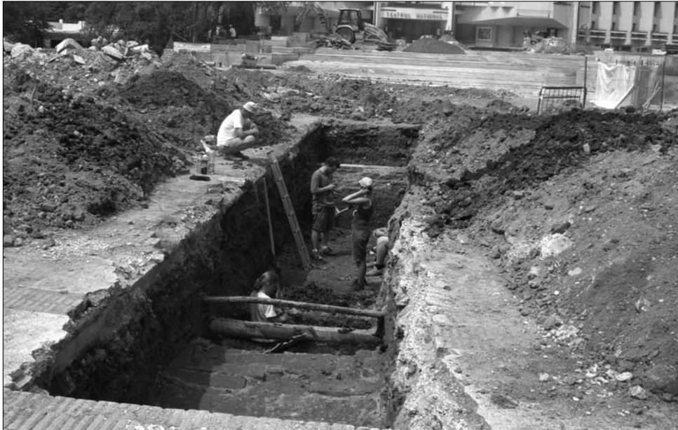
Az egykori ferences kolostor és templom helyén ásának két-három méterrel a felszín alá

▶ A marosvásárhelyi Színház-tér felújítása nem történhet meg a kötelező leletmentő ásatás nélkül, amit a Maros Megyei Múzeum szakemberei diákokkal és frissen végzett régészekkel közösen végeznek. A feltárást során a tér több pontján is végeznek úgynevezett szondázást, hogy megtudják, mi van a mélyben, hogy majd az építkezés során ne sérüljenek az esetleges történelmi leletek.