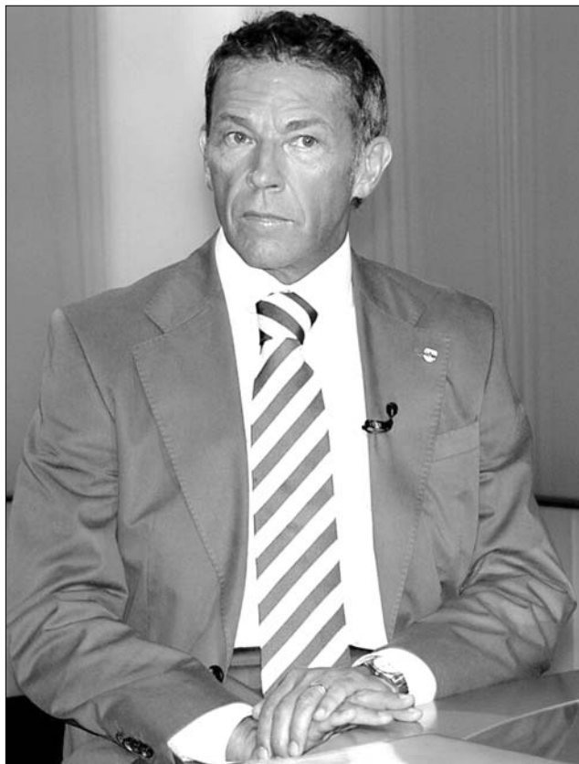
Jörg Haider – még ténykorában