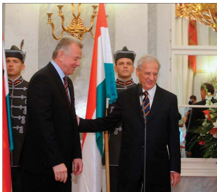
Schmitt Pál ma veszi át Sólyom László helyét a Sándor-palotában