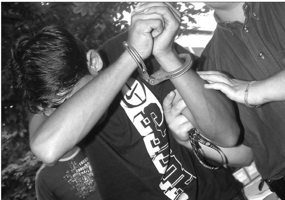
Az alkalom, de legalábbis a károsultak óvatlansága ösztönzi idén a tolvajokat