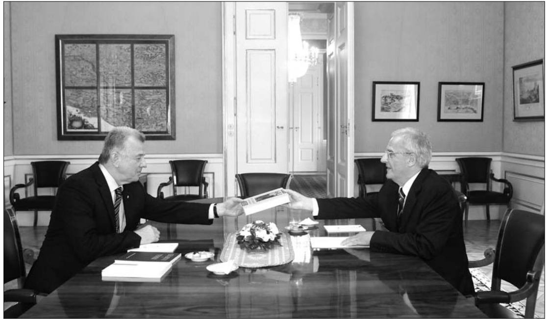
Örségváltás a Sándor-palotában. Sólyom László (jobbra) átadta irodáját Schmitt Pálnak

Schmitt Pál fennkölt pillanatként nevezte, hogy átveheti a nemzet képviselőjét és a demokrácia őrzését. Hangsúlyozta: mindent el fog követni, hogy elődje nyomdokába léphessen, aki, mint fogalmazott, magasra tette a mércét. Schmitt Pál azt mondta, hogy igyekszik Sólyom László útmutatásai szerint dolgozni, és „jöttányit” sem fog engedni az alkotmány által ráruházott felelősségből. Beszél arról is, hogy köztársasági elnökként neki is lesznek külön vállalásai, mint ahogyan Sólyom László szíven viselte a környezet védelmét és a nem-