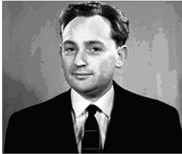
Ránki György – meghatározó tudós volt

kedik. Ahol a szakmai értékek a politikai-ideológiai szempontok fölé emelkednek. A magyar tudományosság – talán a matematikusok kivételével – soha nem volt olyan erős a világ tudományos szervezetében, mint 1970–2000 között a történészeké. Alapjai e pozíciónak: az 1949-ben félreállított ún. polgári tudósok visszaemlése az itthoni műhelyekbe (mindenekelőtt a Történettudományi Intézetbe: Mályusz, Makkai, Wellmann, Kosárystb.), valamint az új generációból a világ versenyképesek kiemelése és ezzel egy időben a kilépés a nemzetközi történet közélet mind tágabb mezejére. Ránki – és az általa szervezett szűkebb „csapat” – a motorja ennek az akciónak. 1960 óta minden világkongresszuson részt vesz. 1970-ben – a