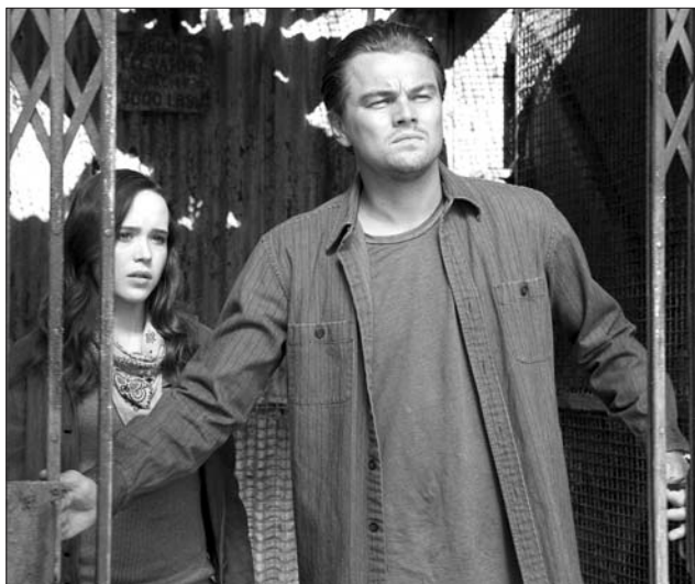
Az Inception visszhangos sikere nyomán Leonardo DiCaprio előtt újabb kapuk nyílnak meg színészi pályáján

De térjünk vissza DiCaprióra. A filmvilág újabbán attól a hírtől hangos, hogy harmadik hete legyőzhetően (azaz a legtöbbet, pontosan 200 millió dollárt kaszált) Amerikában az Inception (Eredet), Christopher Nolan új sci-fije, amelyben DiCaprio alakítja a főszereplő álomtolvajt. Igen, tudjuk, hogy az amerikai nézők ízlése nem a legjobb mérce, de jelen esetben tényleg, a nyári uborkaszegzonhoz képest egy több mint nézhető alkotással van dolgunk. Persze, a sikerhez a kitűnő rendezés és a színészi játék mellett nagyban hozzájárult a profi módon megtervezett marketing-kampány is. Nagyságrendekkel elmarad ugyan az Avatar reklámfelvezetőjétől, de saját műfajában – a pszichotriller akciófilmek között – talán az Eredet részesült a