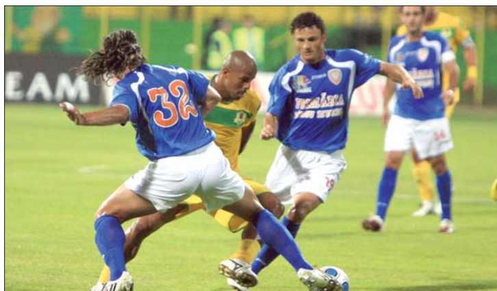
A marosvásárhelyiek szombaton az Urziceni-t fogadják

A Craiova a buzăui Gloria-stadionban játszik az újonc Victoria Brănești-vel, a GSP Tv