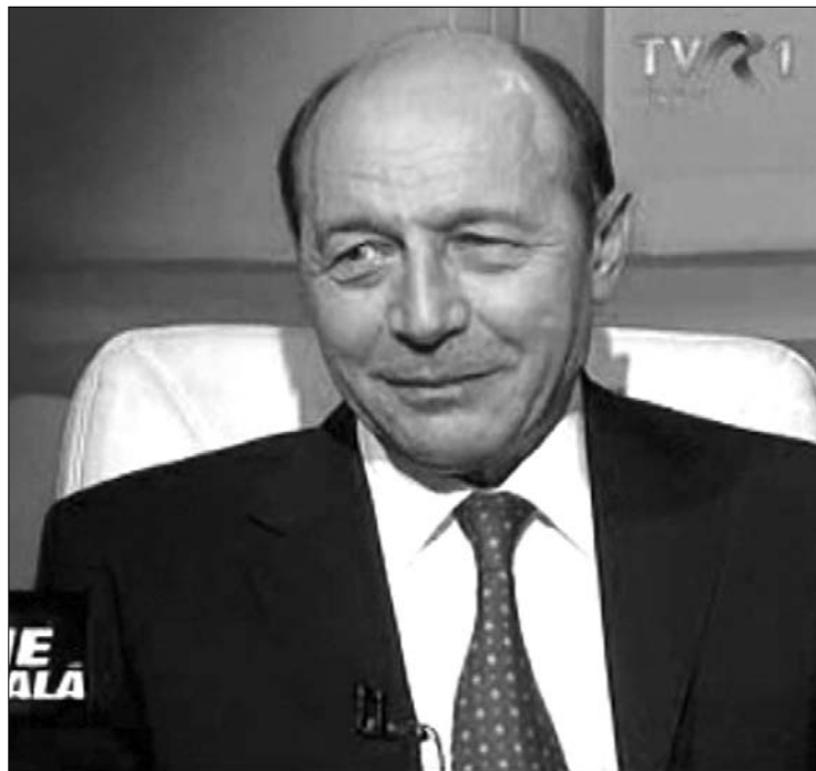
Traian Băsescu: a kormányt folytatnia kell az elbocsátásokat

Az államfő az Emil Boc vezette kormányt is bírálta amiatt, hogy a kabinet tagjai már akkor béremelést ígértek a jövő évre a közalkalmazottaknak, amikor még nem is ért véget a Nemzetközi Valutaalap (IMF) szervezésében Románia által tavaly megkötött többoldalú nemzetközi hitelegyezmény felülvizsgálata. A béremelésről korábban a kormányfő és Sebastian Vlădescu pénzügyminiszter is nyilatkozott. Elmondták, a közalkalmazottak bérei átlagban 10 százalékkal nőhetnek, ha jövő évben sem kapnak tizenharmadik fizetést a közalkalmazottak, és folytatódnak az elbocsátások. Júliusban a kormány 25 százalékkal csökkentette a köz-