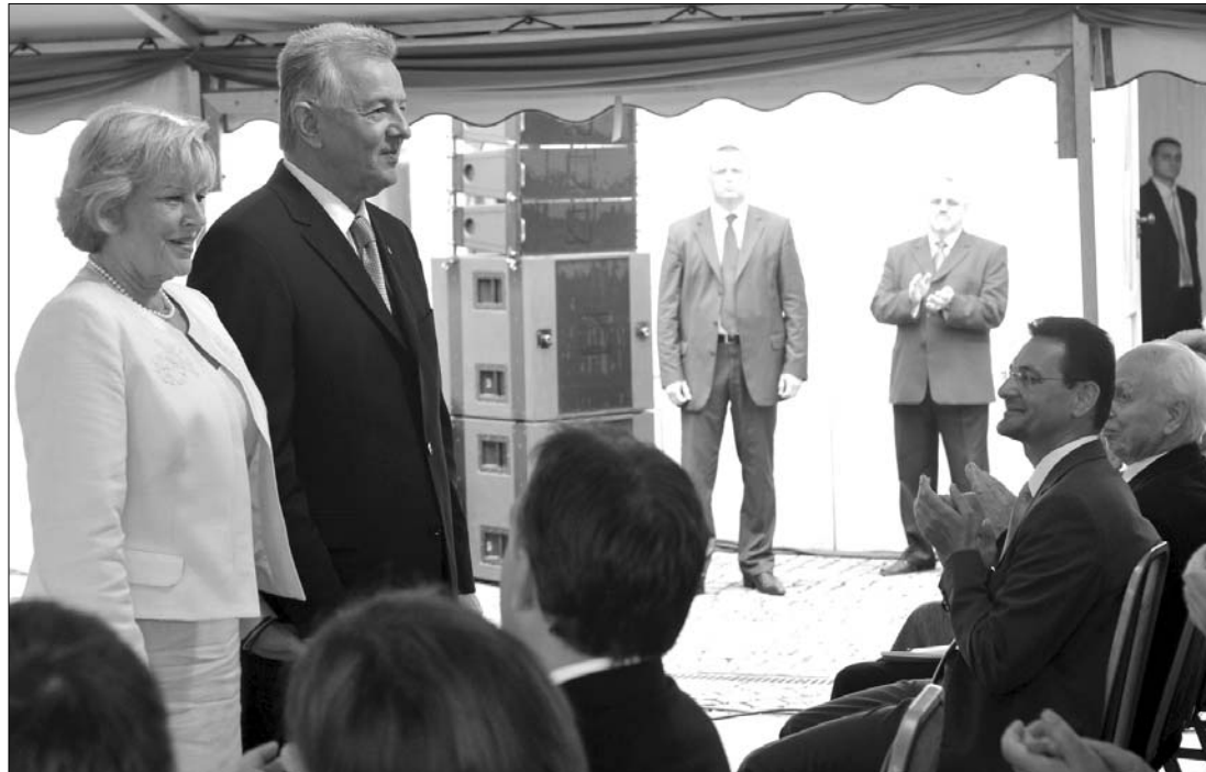
Az új magyar államfő a Sándor-palota udvarán rendezett ünnepségen mondott székfoglaló beszédet