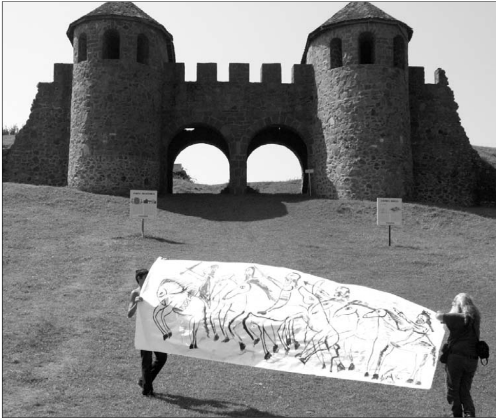
A Szilágy megyei római kori lelőhely, a Porolissum romjai között tartottak performanszt

A művészek a történelmi múltat és a jelent vetették össze munkáikban, humorral, könnyedséggel és sok helyen iróniával. A monumentális múlt romjait úgy játékosan közelítették meg, mint a jelen eseményeihez, a dicső múlt és a kétes jelen egyaránt idézőjelbe került. „Az itt látható munkák egy négynapos workshopnak az eredményei, alapja az archeológusokkal való együttműködés volt. Maga az ötlet is úgy született meg, hogy több alkalommal találkoztunk a zilahi régészekkel, beszélgettünk, és egyszer csak eljutottunk oda, hogy ezekben a romokban, leletekben óriási vizuális lehetőségek vannak, és felismertük azt, hogy ezeket a hatalmas kincseket szinte csak a szűkön vett szakma ismeri” – mesélt az