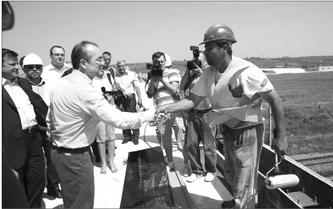
Emil Boc kormányfő a iasi-i körgyűrűn. Miniszterelnöki munkalátogatás, nyilatkozattal.

Idén 88 067 közalkalmazotti állás szűnt meg a strukturális átszervezések, elbocsátások következtében – jelentette ki a miniszterelnök. Hozzátette: ezek közül 14 462 tisztség nem volt betöltve, 73