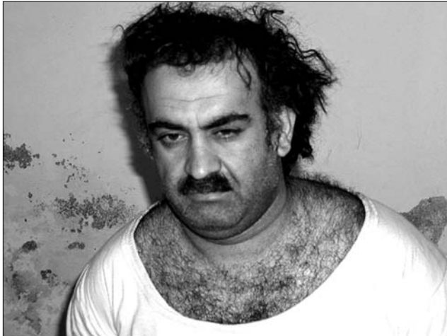
Kalid Sheikh Mohammed

A washingtoni illetékesek az utolsó pillanatban szállították el a foglyokat Guantanamoóból: ha csak három hónapig késlekednek, az amerikai igazságszolgáltatás biztosítja számukra mindezeket a jogokat. Az amerikai hatóságok 2004 márciusában szállították el a terroristagyánús személyeket Guantanamoóból, az amerikai legfelsőbb bíróság pedig júniusban hozta meg ítéletét, miszerint jo-