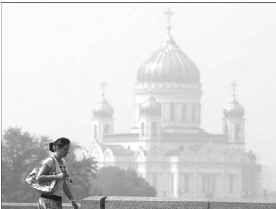
Oroszországot a szárazság következtében lángra lobbant hatalmas területek füstje borítja be

A legtöbb ország külügyminisztériuma óvatosságra inti polgárait: halasszák el oroszországi utazásaikat,