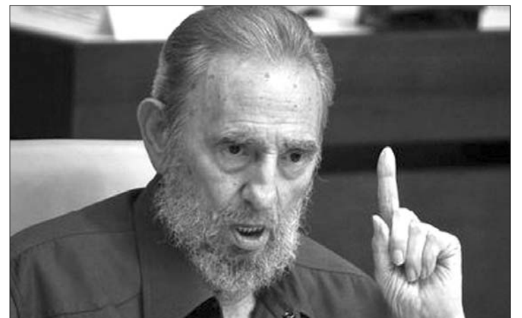
Fidel Castro volt kubai államfő újra megjelent a kubai parlamentben

diumon állva egy előre elkészített, 12 perces beszédet intézett a kubai képviselőkhez. Azt mondta, hogy atomháború törhet ki, ha Barack Obama amerikai elnök elrendeli Irán megtámadását, amennyiben Teherán ellenáll az amerikai és izraeli követeléseknek, hogy hagyjon fel atomprogramjával. A Kubai KP első titkára határozott, tiszta, bár akadozó hangon beszélt. A 84. születésnapját augusztus 13-án ünneplő Fidel Castro betegsége miatt még 2008-ban átadta az államfői posztot öccsének, a 79 éves Raúl Castrónak. A kubai nemzetgyűlés szombati ülésére is öccse kíséretében érkezett a politikus. ◀