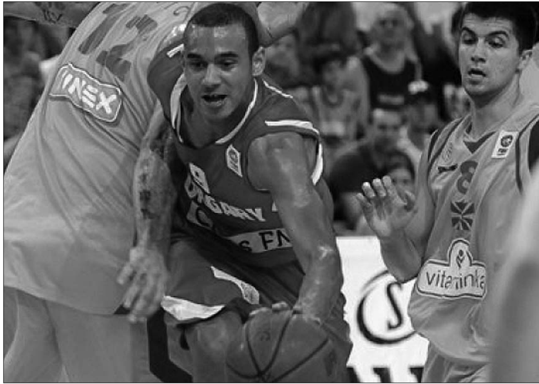
A magyar fiúk (sötét mez) egy percig sem tudták tartani a lépést a házigazdával Szkopjében