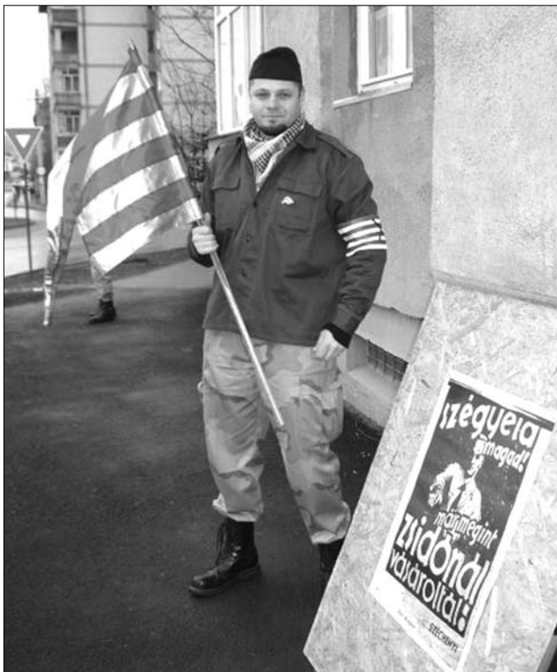
Székely „gárdista” a csíkszeredai Kaufland hipermarkettel szemben