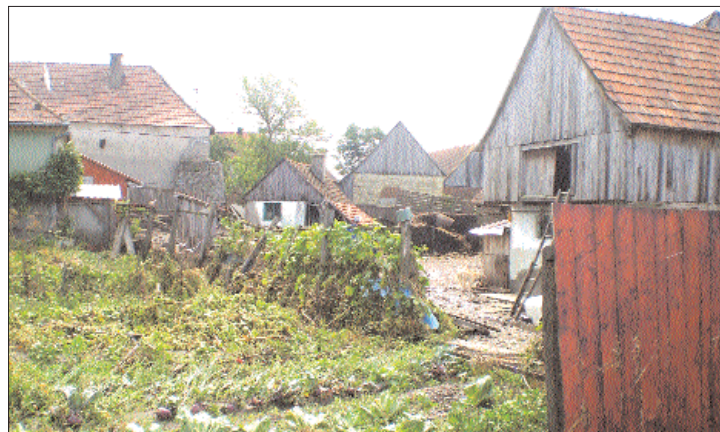
Udvarhelyszéki települések látták a kárát az újabb pusztító árvíznek

sem bírta a terhelést, víz alá kerültek Telekfalva, Patakfalva, Árvátfalva és a Homoródszentmárton községekhez tartozó települések. 7. oldal ▶