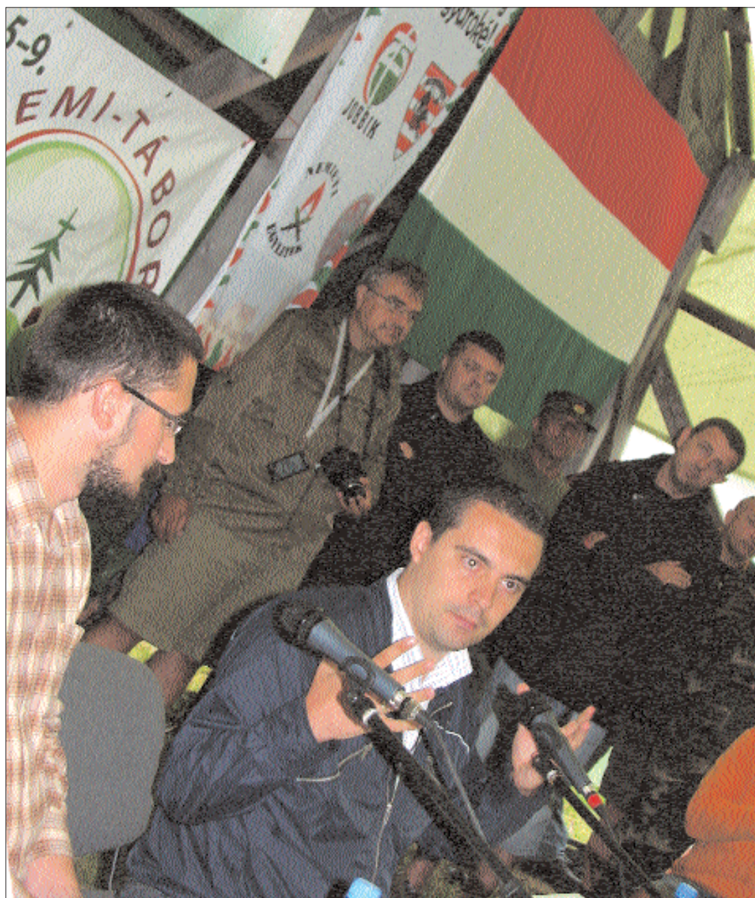
Tavalyi gyergyószentmiklósi fellépése után Vona Gábor Jobbik-vezér idén is „díszvendég” lesz

Miután a tavaly még „megelégedett” azzal, hogy költségvetési finanszírozással járuljon hozzá a magyarországi szélsőjobb oldal ismert képviselőit felvonultató EMI-tábor sikeréhez, idén a Hargita Megyei Tanács társszervezővé lépett elő a gyergyói rendezvényen. A szélsőjobb oldali politika egyébként egyre hangsúlyosabban van jelen az erdélyi városokban: Csíkban a Székely Gárda szervez antiszemita akciókat, Vásárhelyen Jobbik Baráti Kör alakult, Gyergyóban pedig Vona Gábor, a Magyarországon betiltott Magyar Gárda félkatonai szervezet alapítója a „díszvendég”. 7. oldal ▶