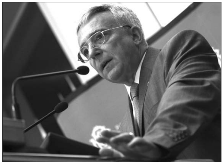
Mugur Isărescu, a Román Nemzeti Bank (BNR) elnöke

Három gyerekből egy alultáplált Romániában. Az utóbbi évtizedben nagyon megugrott azoknak a gyerekeknek a száma, akik protein- és kalóriaszegény ételleket fogyasztanak. Olyan alapvető élelmiszereket nélkülöznek, mint a hal, a tojás, a sajt. (România liberă) ▶ A galaci börtön két börtönőre, a szolgálatos rendőrtiszt „engedélyével” halálra vert egy elítéltet. (EVZ) ▶ Az adóhatóság vizsgálatai szerint George Becali 14 millió lejt (áfát és büntetést) kell hogy befizessen a költségvetésbe 2004 és 2008 közötti ingatlan-ügyletei után. A vizsgálat 2009 decemberében kezdődött, akkor Becali azt nyilatkozta, tiszta lelkiismerettel áll az adóellenőrök elé. (Libertatea)