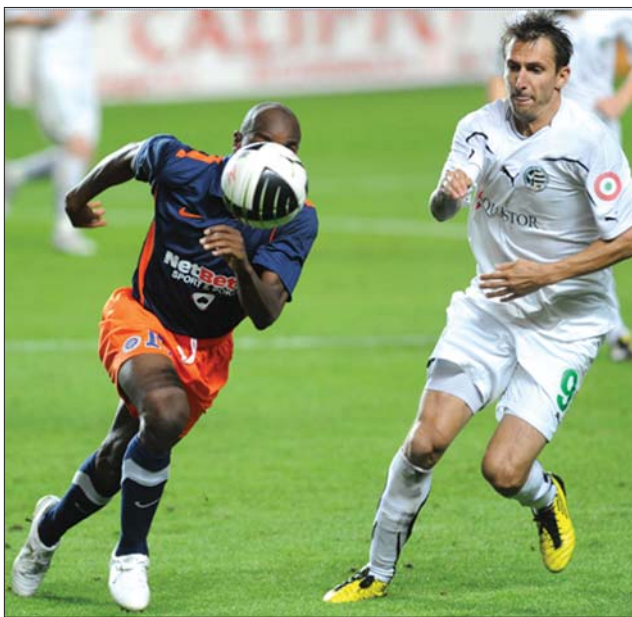
A franciákat búcsúztató Győr (fehér mez) Zágrábban folytatja