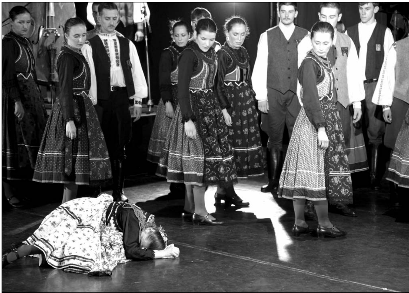
Részlet a Háromszék Táncegyüttes Böjttől böjtig című előadásából. A táncosok az adatgyűjtést is fontosnak tartják