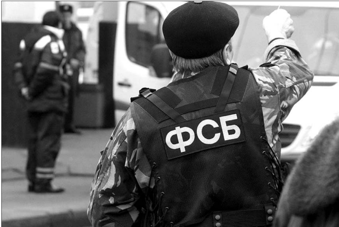
A diplomatának álcázott román kémre a Szövetségi Biztonsági Szolgálat emberei csaptak le Moszkvában.