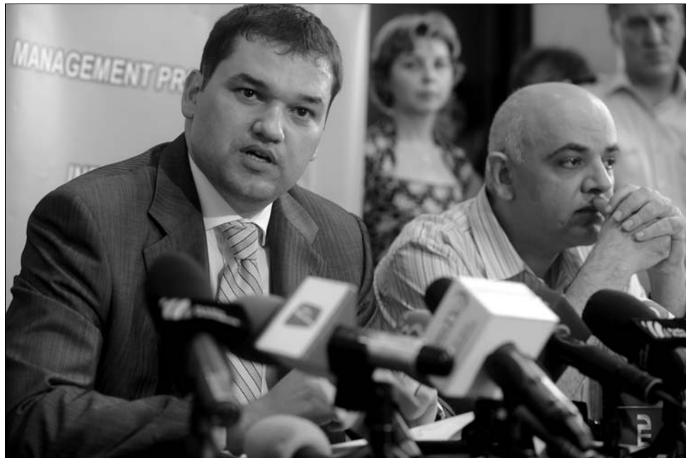
Cseke Attila miniszter és Raed Arafat államtitkár-helyettes a giulesti-i tragédiáról beszélt.

Ellátásukra a fővárosi kórházakból speciális mentőcsapat állt össze: égési sérülésekre szakosodott orvosok, sebészek, koraszülött gondozásban jártas gyermekorvosok küzdenek a megmentésükért. A súlyos tragédia helyszínét, a giulesti-i kórházat lezárták, és tűzrendészeti szakértők, az egészségügyi minisztérium munkatársai, az elektromos- és gázszolgáltató vállalat kiküldött szakértői, a