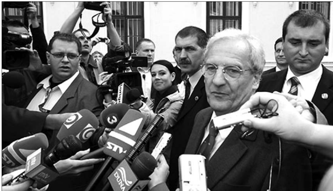
Visszajövök” – üzentte egy éve Sólyom László, amikor Robert Fico utasítására nem engedték be Szlovákiába.

„Visszajövök” – üzentte egy éve Sólyom László, amikor Robert Fico akkori szlovák kormányfő utasítására nem engedték be Szlovákiába, mivel Fico szerint Sólyom nem tartotta tiszteletben Szlovákia területi integritását. Az ügyből Szlovákia és Magyarország viszonyának legnagyobb diplomáciai botránya lett. ◀