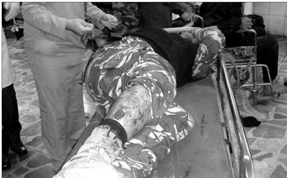
A tegnapi öngyilkos merénylet színhelye: hatvan halálos áldozat

„Ígéretünkhöz híven” az amerikai harci küldetés Irakban 2010 augusztusának végéig befejeződik, közölte a hónap elején Barack Obama. Az amerikai elnök szerint akkortól kezdve az Egyesült Államok stratégiáját a diplomataknak kell az országban képviselniük. Csakhogy Irak politikai és gazdasági helyzete – amint a tegnapi merénylet is mutatja – minden, csak nem szilárd. Megfigyelők attól tartanak, hogy a szélsőségesek éppen ezt a hatalmi vákuumot tudják kihasználni. Az iraki parlamenti választások óta öt hónapnál is több idő telt el, és még mindig nem alakult meg az új kormány. Az Ijad Allávi volt miniszterelnök Irakija-szövetsége és a jelenleg hivatalban