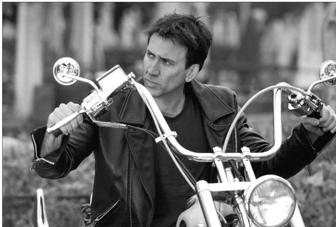
Nicolas Cage újra a „szellemmotorra” pattan, ezúttal Romániában, hogy eljátssza a Ghost rider főszerepét