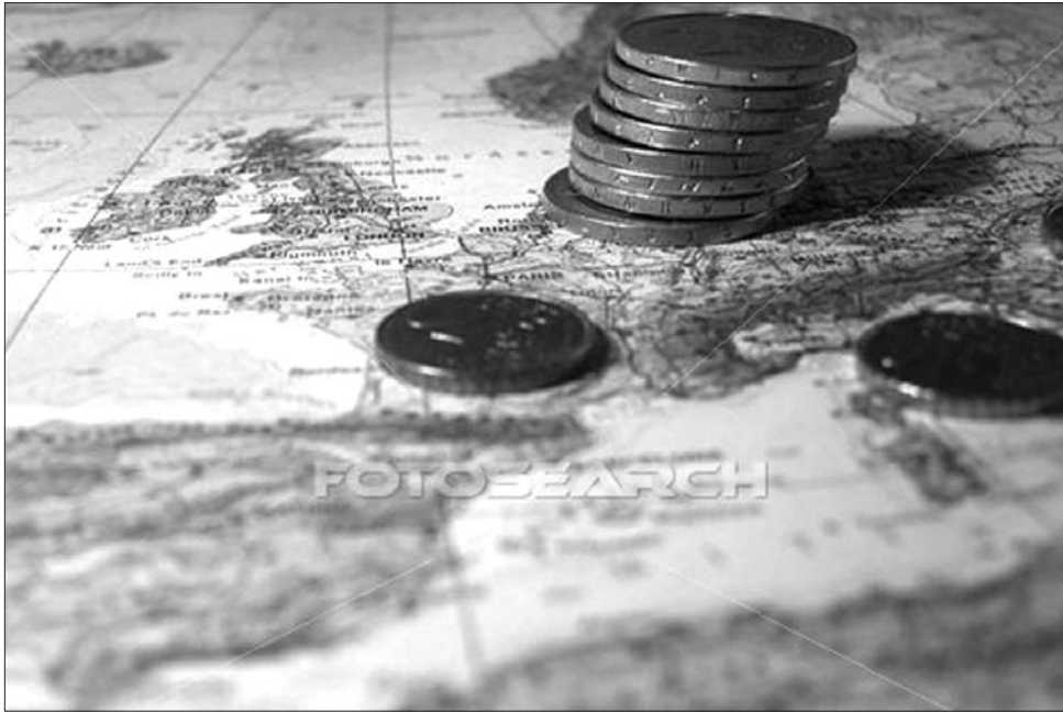
Az „öreg kontinensen” nem mindenkit érint előnyösen az EU magánnyugdíj-rendszere

A kezdeményezést Magyar- és Lengyelország indítványozta, a dokumentumot rajtuk kívül még hét ország pénzügyminisztere látta el kézjegyével: Románia, Csehország, Szlovákia, Bulgária, Litvánia Lettország, és Svédország. Az aláírók úgy látják, hogy a jelenlegi számítási mód hátrányos helyzetbe hozza azokat az országokat, amelyek az elmúlt években vezették be a magánnyugdíjpénztárakat.