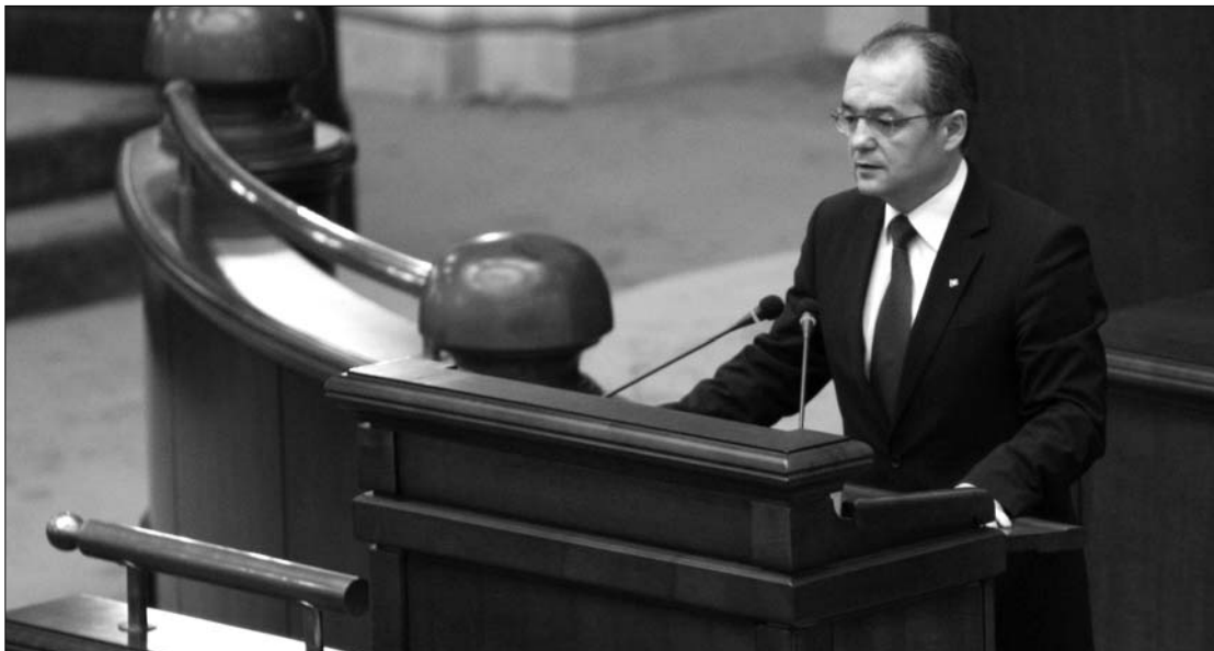
Emil Boc kormányfő tegnap személyes részvételével gondoskodott az ANI-törvény megszavazásáról

Frunda György távolmaradását kommentálva a frakcióvezető kijelentette: a jogász-szenátorok „szuverén joga volt” így tiltakozni az ANI-törvény jelenlegi formája ellen. „Az RMDSZ-frakció sok mindenben osztja Frunda György álláspontját a jogszabállyal kapcsolatban. Nekem is meggyőződés-