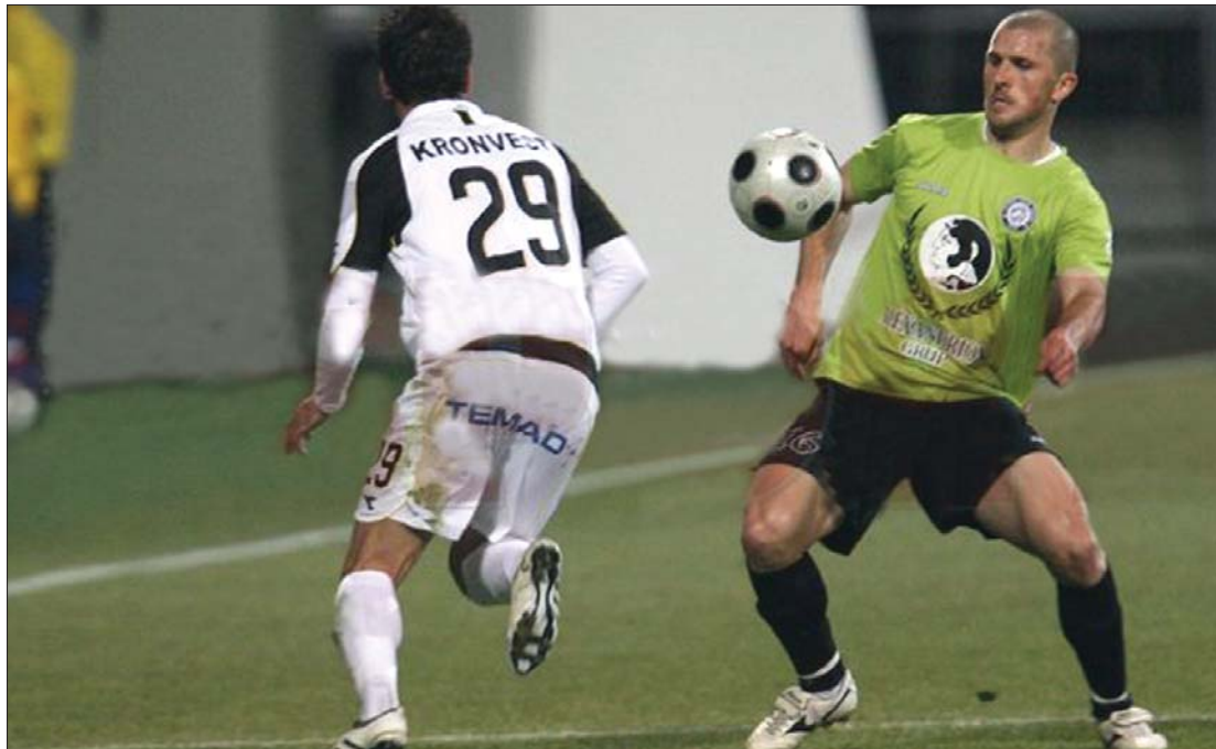
A hétfői esti, brassói döntetlen után az urziceni-iek (fehér mezben) továbbra is győzelem nélkül, kieső helyen állnak