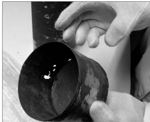
A megrögződött kapszula miatt veszélyben a dokumentumok