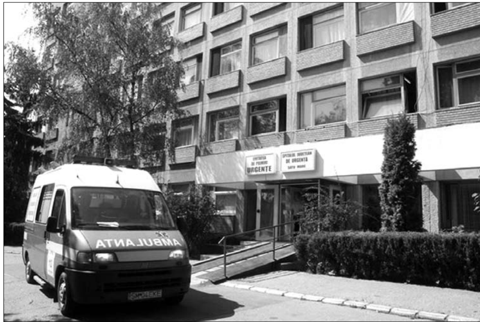
A Szatmár Megyei Sürgősségi Kórház. A kórházi ellátás minőségét gyakorta vitatják a helyiek.

► A hat bukaresti kisbaba halála után újabb kórházi botrány borzolja a kedélyeket, ezúttal Szatmár megyében: hétfőn egy 23 éves nő halt meg a helyi szülészeti és nőgyógyászati osztályon. A fiatalasszony terhességének 33. hetében, a nyolcadik hónap elején jelentkezett a kórházban, rosszulre panaszkodott, amelyet valószínűleg rendkívül magas vérnyomása okozott. Kezelőorvosa, aki a terhesség korábbi hónapjaiban követte az érintett egészségi állapotát, épp ügyeletes volt: a magzat és a szülőne egészségének védelme érdekében úgy döntött, hogy császármetszéssel világra segíti a veszélyeztetett csecsemőt. Az 1,9 kilogrammos újszülött a helyi koraszülött intenzív osztályra került, állapotát kezelőorvosai kielégítőnek minősítették. A 23 éves anya viszont a császármetszést követően rosszul lett, és szintén az intenzív osztályon folytatták a kezelését. Nem sokkal a nőgyógyászati műtét után újra kellett éleszteni, ám a beavatkozás sikertelen volt. A kórház boncolás előtti jelentése szerint hirtelen fellépő tüdőembólia okozta a fiatal nő halálát.