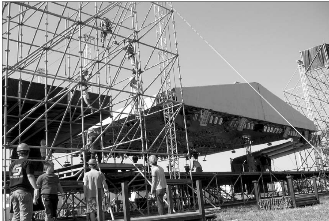
Lázás színpadépítés a marosvásárhelyi Vikendtelepen. Készülöben a Fél-sziget Nagyszínpada

A Fél-sziget hivatalosan csak augusztus 26-án kezdődik, az első vendégek már ma este 18 órakor beléphetnek a fesztivál területre – ekkor nyitnak a bejáratnál található kasszákat is. Azt, hogy az 1,2 millió eurós költségvetéssel rendelkező fesztivál pozitív mérleggel zár-e idén, a szervezők szerint korai megjósolni, hisz még nem összesítet-