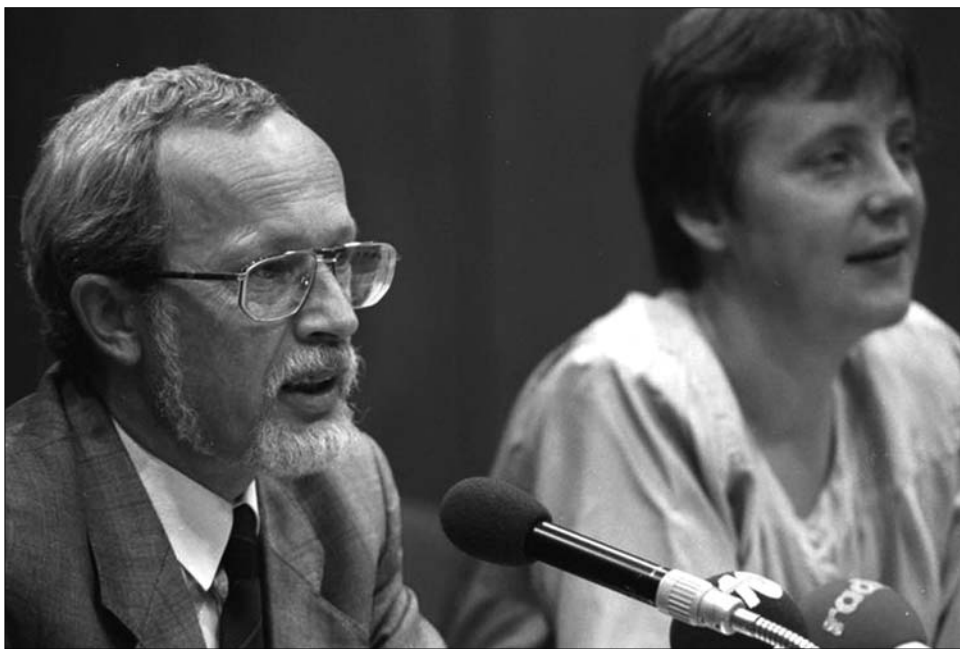
Lothar de Maizière és helyettes szövegírója, Angela Merkel, jelenlegi német kancellár, 1990. augusztus 23-án

Lothar de Maizière azt követően vonult vissza az aktív