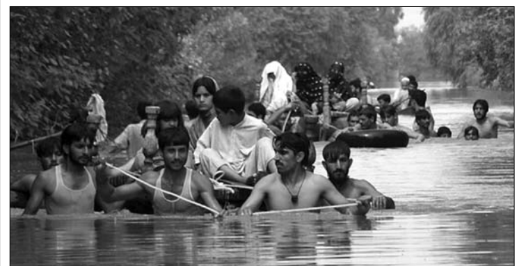
Pakisztánban 17 millió embert érintettek az áradások

többsége az első hónapokban-hetekben vesztette életét, de számuk még most is növekvőben van, a katasztrófa délen súlyosbodik. Három év a legkevesebb – mondta Zardari. Az áradással együtt egészségügyi és társadalmi válság, éhséglázadás is kitörhet. A járványok 3,5 millió gyereket fenyegetnek. Az ország egészségügyi rendszere túlterhelt, mintegy 200 intézmény károkat szenvedett, és százezer női alkalmazott egyharmada maga is menekültt vált. ◀