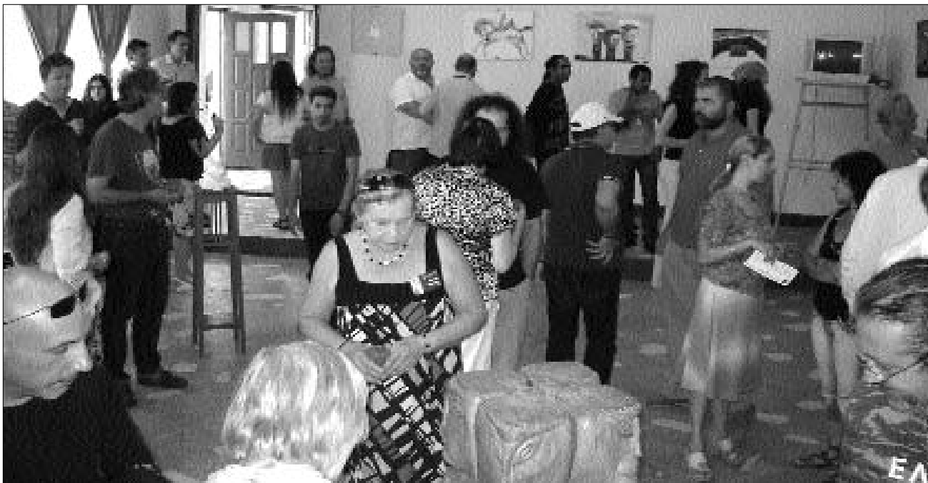
A nagyenyedi alkotótábor zárása több mozzanatra oszlott: a fegyház is műteremmé változott erre az alkalomra

A továbbiakban, a XV. tábor záró kiállításán, az