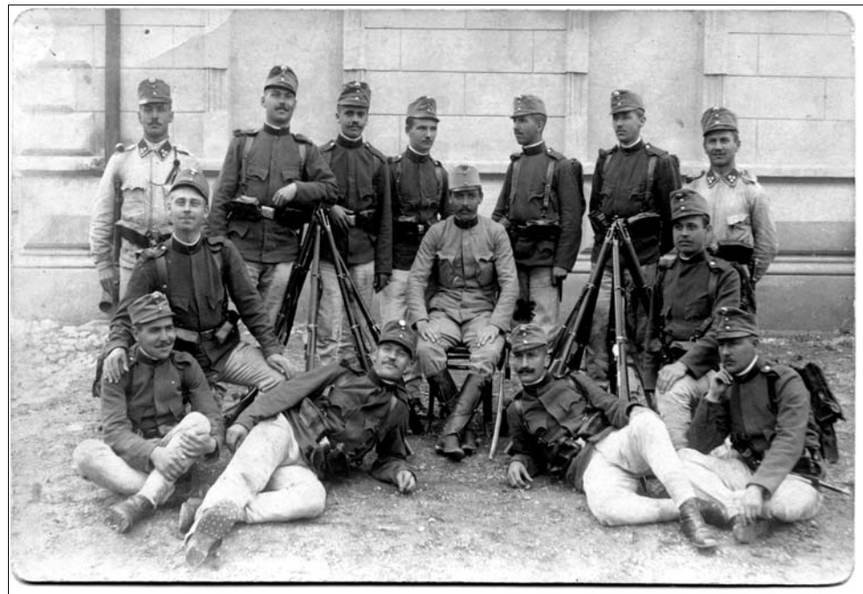
A nemzedékről nemzedékre őrzött régi fotográfiák kincset érnek a múzeumnak