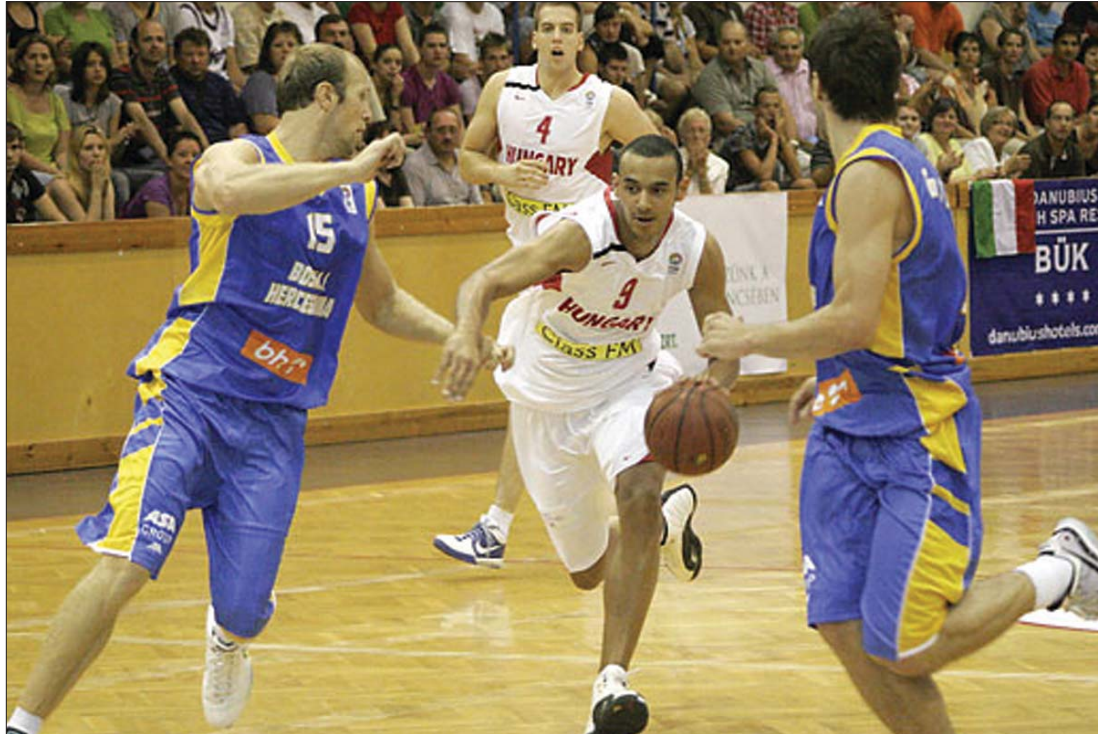
A magyar férfi válogatott újabb vereséget szenvedett: 73-64-re kapott ki Boszniától (kék mezben)

A kvartett másik mérkőzésén Szerbia megfosztotta veretlenségétől Izraelt (70-68), s több mint valószínű, hogy mindkét gárda ott