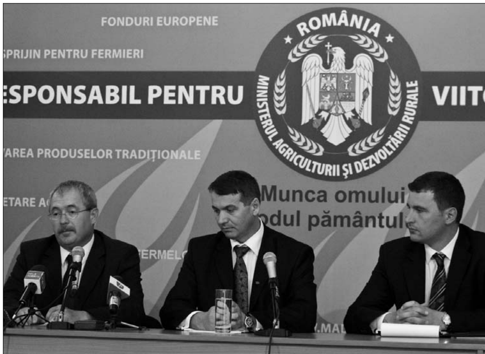
Fazekas Sándor magyar és Mihail Dumitru román agrárminiszter, valamint Tanczos Barna államtitkár

Újabb kérvényleadási periódust tervez kiírni a román Mezőgazdasági és Vidékfejlesztési Minisztérium a hátrányos helyzetű övezetekben gazdálkodó tejtermelők támogatási kéréseinek leadására, szeptember 15-e és október 31-e között. Az erről szóló kormányhatározat-tervezetet a szaktárca már ma a kormány elé terjeszti. „A meghosszabbítást elsősorban azért látjuk szükségesnek, mert, mint több más uniós, illetve hazai költségvetésű forrásból fizetett támogatás esetében, a kedvezőtlen térségekre