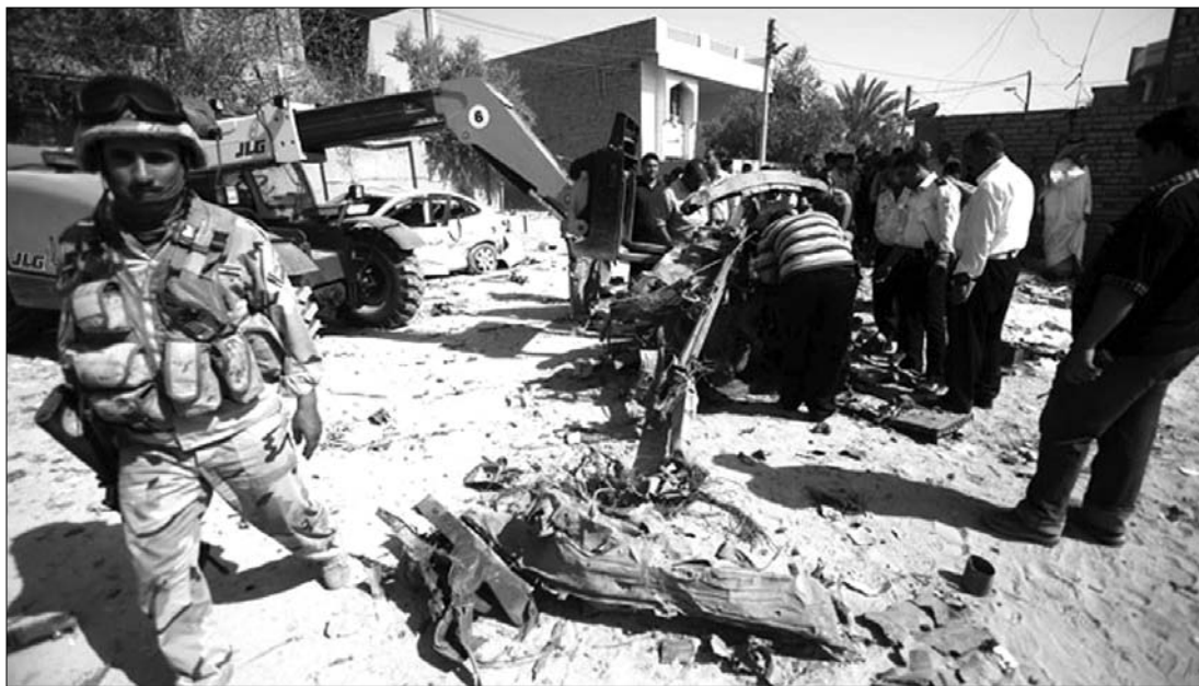
Az iszlám böjt, a ramadán ellenére Irakban szinte mindennaposak a terrorakciók