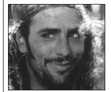
cos herceg 5.

6.00 Happy Hour - szórakoztató műsor (ism.) 7.00 ProTV hírek, sport 9.55 Könyvbemutató 10.00 Fantaghiro, a harcos herceg 5. (olasz fantasztikus kalandfilm, 1996) 12.00 Fialat és nyugtalan (amerikai sorozat) 13.00 ProTV hírek, sport 13.45 Tarzan, a majomember (am. kalandf., 1981) 16.00 Fialat és nyugtalan (amerikai sor.) 17.00 ProTV hírek, sport, időjárásjelentés 17.45 Rettegésben (am. thriller, 2001) 19.00 ProTV hírek, sport, időjárásjelentés 20.30 Tessék parancsolni! - szórakoztató műsor 22.30 Ünneprontók ünnepe (amerikai romantikus vígjáték, 2005) 1.00 Tarzan, a majomember (am. kalandf., 1981) (ism.) 2.30 Ünneprontók ünnepe (amerikai romantikus vígjáték, 2005) (ism.)