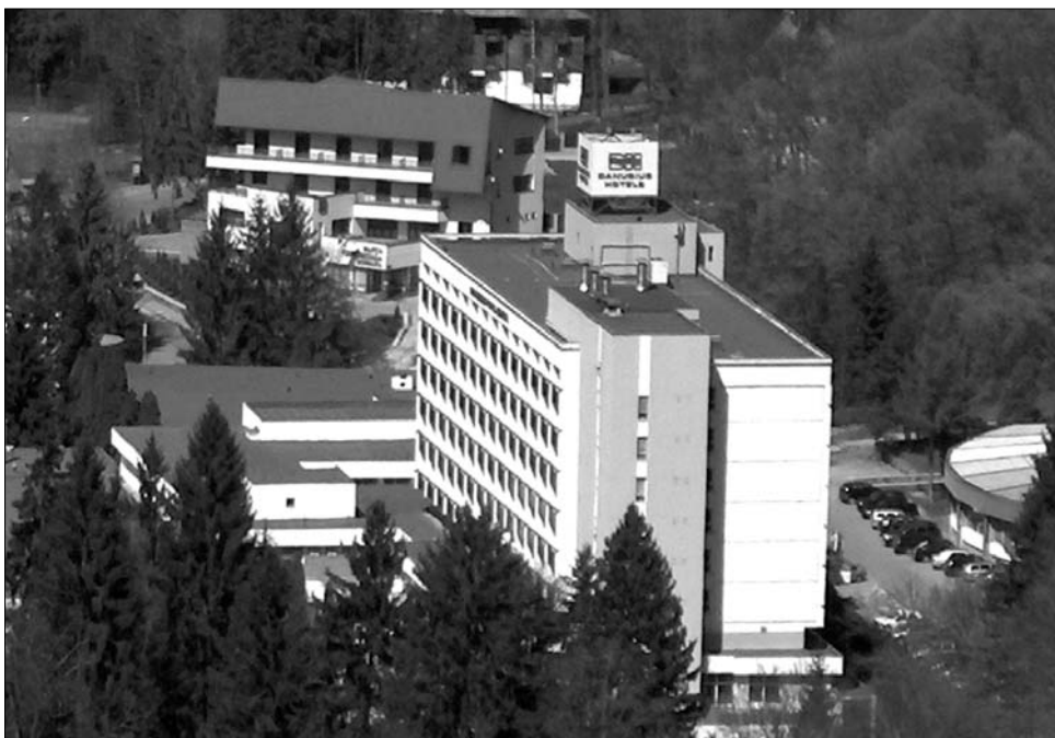
A Danubius szovátai hoteljeiben a szállodaágyak foglaltsága augusztusban eddig maximális volt

A Szováta szállodában júliusban elkezdtek egy 5 millió lejes beruházást, 1000 négy-