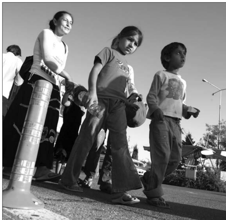
Minden roma gyerek után 100 eurót fizettek a francia hatóságok

Megértőnek mutatkozott a bolgár romák Franciaországból való kiutasításával kapcsolatban tegnap a bolgár külügyminiszter. A Nova televízióknak adott interjújában Nikolaj Mladenov úgy vélekedett, hogy „eltúlozzák a romák kiutasításának problémáját”, az úgy „inkább francia belpolitikai csatározás”. A külügyminiszter hozzátette, hogy eddig „egy bolgár állampolgárt sem kellett erővel kilakoltatni”. Franciaország felhívta 300, gyermekenként 100 eurót juttat a hazatelepülőknél. Mladenov kedden egy telefonos megbeszélésen a bolgár kormány „megértéséről” biztosította Pierre Lellouche-t, Franciaország Európa-ügyi államtitkárát. A külügyminiszter kiemelte, hogy „minden bolgár állampolgár köteles tiszteletben tartani a fogadó ország törvényeit és az európai követelményeket”. ◀