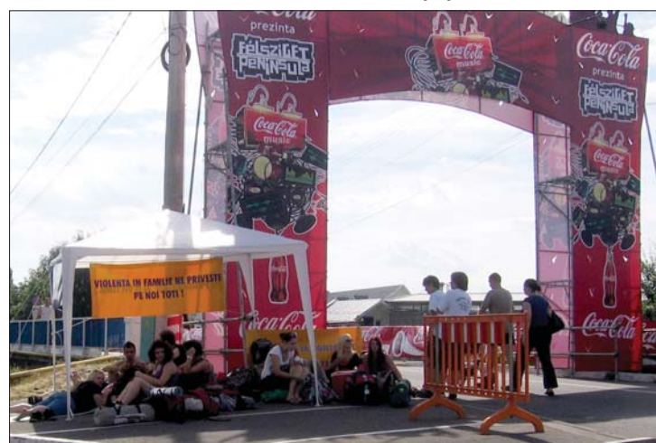
A déli órákban már megérkeztek az első fél-szigetlakók

marosvásárhelyi Fél-sziget sajtófelelőse. A kaput tegnap este nyitották, a valódi bulirajtot azonban a PASO ma délutáni koncertje jelenti. 9. oldal ▶