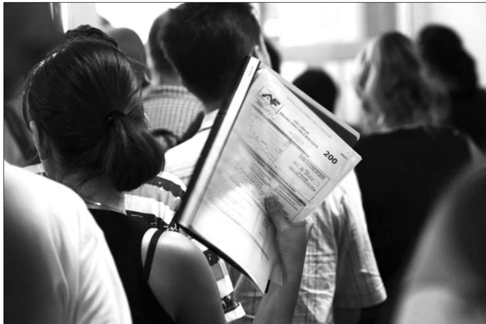
Ingerült tisztségviselők, intézményes tanácsstalanság fogadta tegnap az adófizetőket.

Sepsiszentgyörgyön egy épületben működik a munkaerő-ügynökség és a nyugdíjpénztár, amelynek előterében tegnap egy tüt se lehetett volna elejteni. Többszöri nekifutásra is nehéz volt eligazodni, hogy melyik sorba miért kell beállni, hiszen külön-külön ügyfélfogadó ablaknál kellett intézni a munkanélküliségi alap és a nyugdíjalaphoz járó nyilatkozatok leadását, máshol kellett kifizetni a járulékokat, illetve hosszú sor volt az adófizetők eligazítását szolgáló asztalok körül is. Aki valamilyen módon eligazodott az ügyintézés módjáról, annak több óras sort kellett kiállnia, míg átadhatta a kitöltött nyilatkozatát. Ezután kiállították számára egy kézzel írott számlát, amellyel beállt a kassa előtti sorba, majd miután fizetett, újra beállt az előbbi sorba, hogy a nyugtát