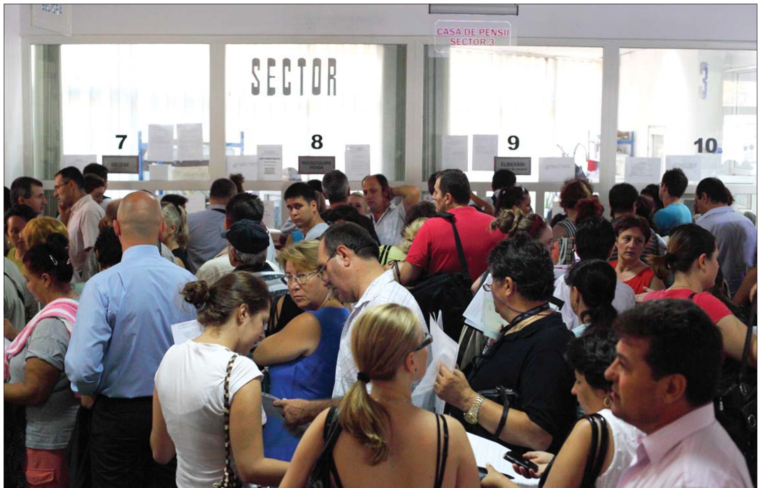
Sorokra váró újságírók, művészek, taxisok és ügyvédek. A törvény a szabadfoglalkozásukat is tébójárulék kifizetésére kötelezi

Tájékozatlan hivatalnokok, hatalmas sorok várták az új tébójárulékok befizetőit