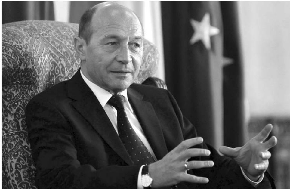
Traian Băsescu: így fojtánám meg a sajtót!

Elena Băsescu ilyen vonatkozásban is „apja lányának” bizonyult: tavaly a Barbie-babának nevezett Băsescu-lánynak az európai parlamenti tagsága jogosultságát megkérdőjelező AP hírügynökséggel támadt konfliktusa, miután úgy értékelte, hogy a megjegyzés „igaztalanul rossz fényt vet Romániára is.” ◀