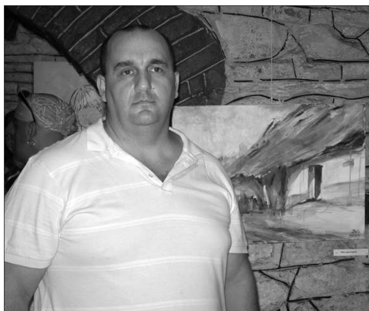
A szerző fényképe

– Ami igazából vonz, és ami a legfajsúlyosabb abban, amit én csinállok, az idős emberek arca. Azok az emberek, akik már átmentek az élet rostáján, az életüket szinte leélték, sorsukat betöl-