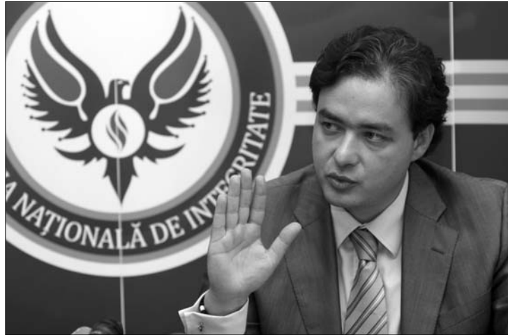
Cătălin Macovei, az Országos Feddhetetlenségi Ügynökség vezetője

Cătălin Macovei mindazonáltal üdvözölte azt, hogy az intézmény működését ismét érvényes törvény szabályozza. Értékelése szerint az új jogszabály olyan eszközök biztosít az ANI számára, amelyek lehetővé teszik a köztisztviselők vagyonynyilatkozatainak hatékony ellenőrzését. Macovei az interjúban arról panaszkodott: közel fél évet vesztett az ügynökség amiatt, hogy a működését szabályozó törvényt korábban alkotmányellenesnek nyilvánították. „Szinte teljesen