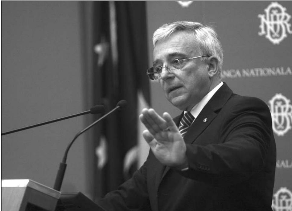
Mugur Isărescu jegybanki elnök mindeddig egyáltalán nem reagált a kormány szándékaira.

A Boc-kabinet fondorlata éppen a brüsszeli tiltást próbálta megkerülni. Hétfői ülésén a kormány sürgősségi rendelet formájában úgy módosította a 118-as törvényt, hogy a BNR alkal-