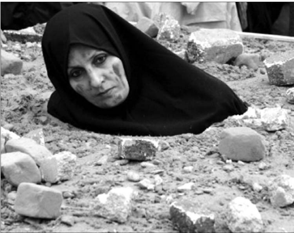
Házasságtörő asszony megkövezése Szomáliában