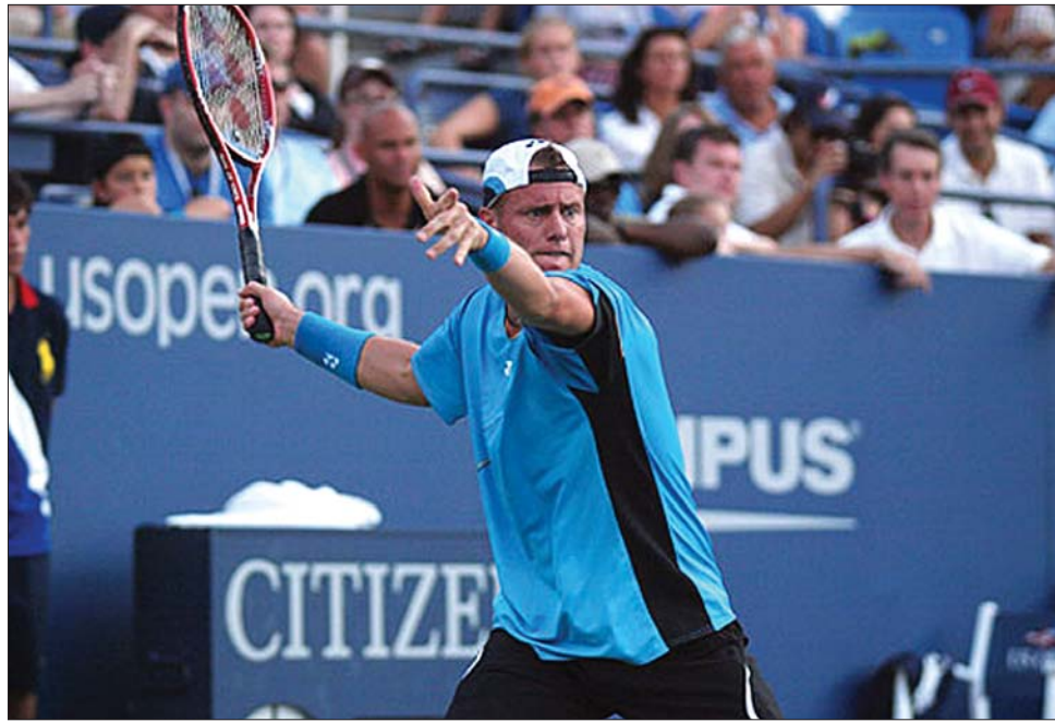
Az ausztrál Lleyton Hewitt ötszettes tenisz-krimiben hajtott fejet a francia Paul-Henri Mathieu előtt