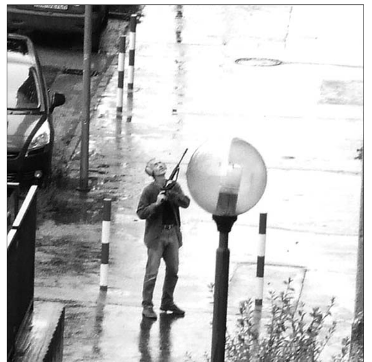
A pozsonyi ámokfutónak fegyverviselési engedélye volt

A szlovák kormány tegnap rendkívüli ülésén úgy döntött, hogy nemzeti gyásznap lesz csütörtökön Szlovákiában a mézárás áldozatainak emlékére. A gyásznapon reggel nyolc és este hat óra között félárbcra eresztik az állami zászlókat, s tilosak lesznek a szerencsejátékok. Szlovákia majdnem két évtizedes fennállása alatt eddig öt alkalommal rendeltek el nemzeti gyásznapot. A kormány döntése értelmében az ál-