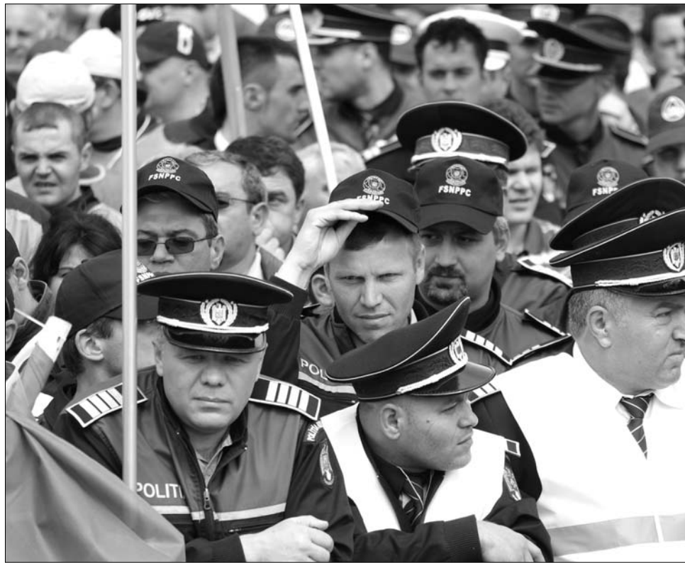
Tüntetésekkel fenyeget a belügyminisztériumi alkalmazottakat képviselő szakszervezet