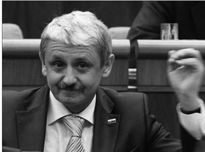
Mikulás Dzurinda: megvan a megoldás! – de nem mondom meg...

„Nem normális, ha tömegesen adják meg a kettős állampolgárságot, ha anélkül ítélik oda, hogy tartós kapcsolat lenne az egyén és az állam között, amelynek állam-