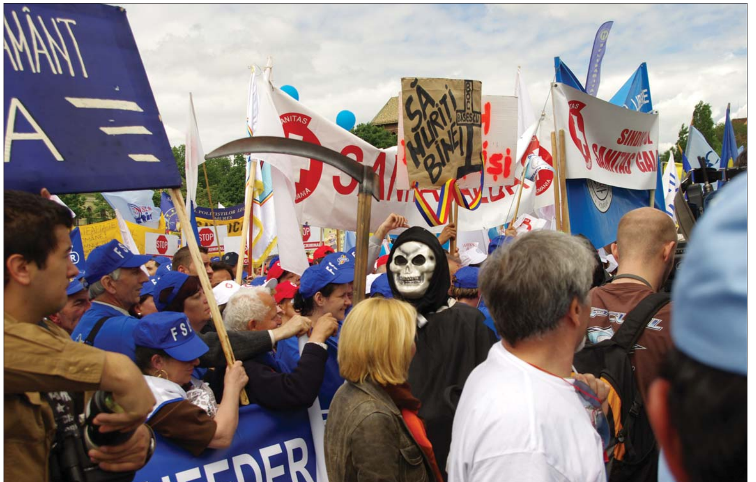
Tüntetésekkel helyezett kilátásba tegnap a belügyminisztérium ötven ezer alkalmazottját képviselő szakszervezeti tömörülés vezetője

A szeptemberben kezdődő tiltakozáshullám nyomán tetőzhet a szociális elégedetlenség