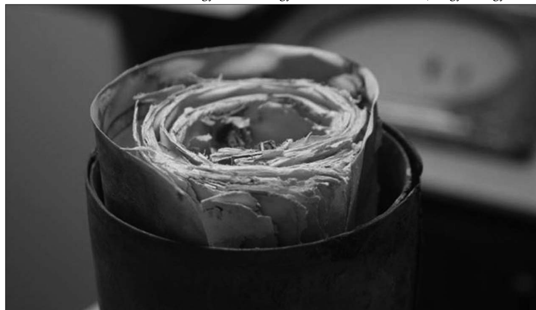
Gyors ütemben indult a megrongálódott nagyvárdi időkapszula tartalmának restaurálása Budapesten

A lelet öt, külön címmel ellátott ívet tartalmaz: a színházépítésre felügyelő bizottság, Nagyvárd város színházi bizottsága, Nagyvárd város törvényhatósági bizottsági tagjainak névsora az 1900 évre, Nagyvárd város tanácsa az 1900 év október havában, című dokumentumokat, valamint egy jegyzőkönyvet. (326/12379). Mind a pergamen-oklevelet, mind pedig az iratokat a hengerbe bejutó nedvesség, baktériumok és penészgombák károsították, melyek hatására a lapok meggyengültek, szélük hiányossá, szakadozottá vált. ◀