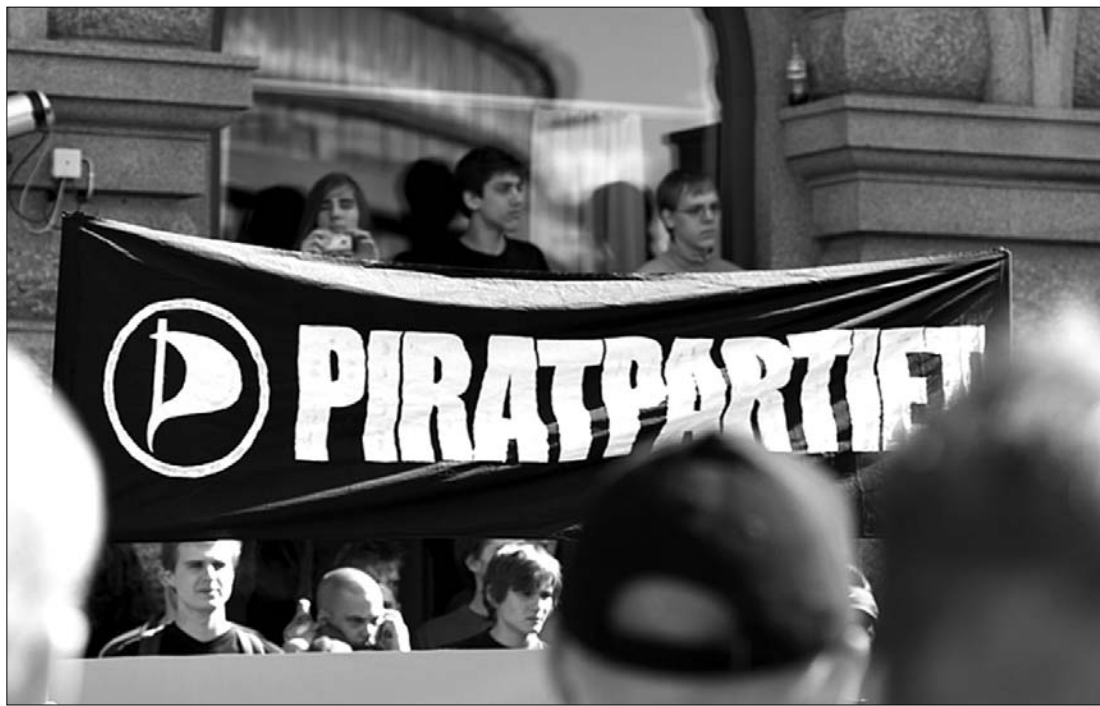
A kalózpártoknak minden országban számos szimpatizánsuk van, így szinte biztos a romániai siker