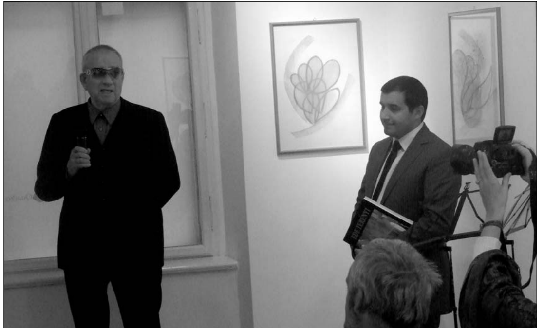
A leginkább zeneszerzőként ismert Terényi Ede grafikusként mutatkozott be a kolozsvári Quadro Galériában

„Miután megszületett ennek az ünnepi kiállításnak az ötlete, elkezdtünk reprodukciók után