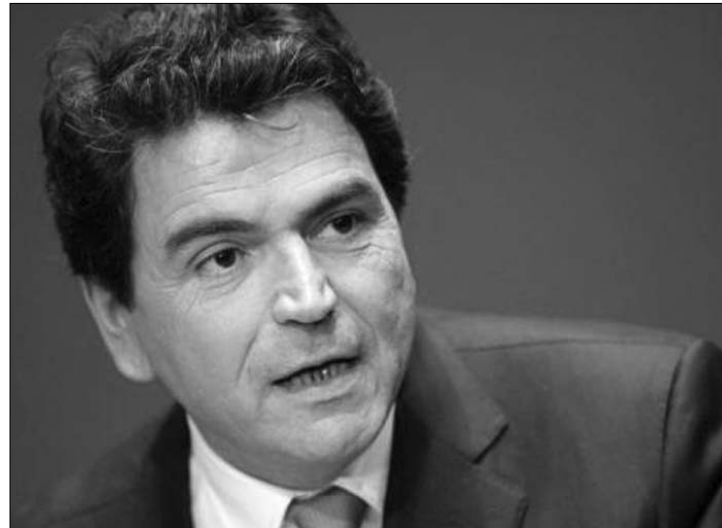
Pierre Lellouche francia államtitkár igazságtalannak nevezte a vádakat

Pierre Lellouche, a francia külügyminisztérium európai ügyekkel foglalkozó államtitkára „túlzsáknak és igazságtalannak” nevezte az EP-képviselők részéről megfogalmazott bírálatokat. A politikus arra hivatkozott, hogy az uniós jogszabályok értelmében a románok, a bolgárok, az írek, a belgák vagy bármelyik tagállam polgárai legfeljebb három hónapig tartózkodhatnak valamely uniós országban, és ez számos feltételhez, szigorú kerethez kötött. A francia államtitkár csütörtökön és pénteken Eric Besson