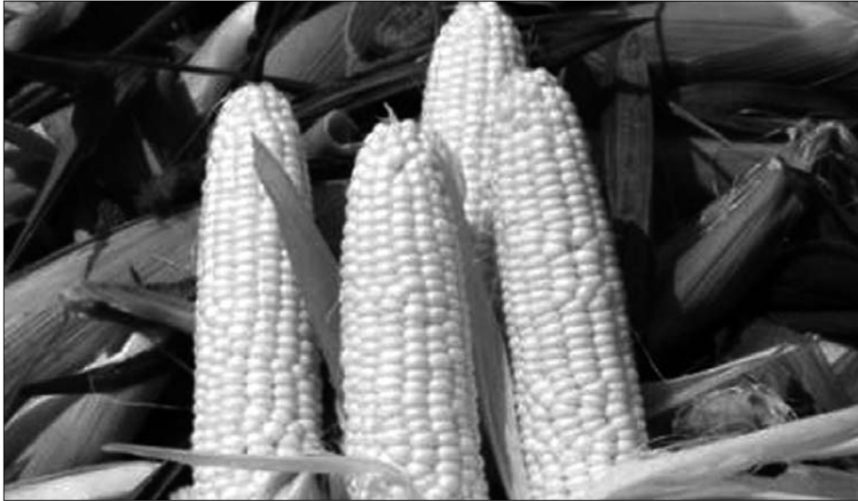
A sokat vitatott génmanipulált kukorica „alááshatja” az új agrárminiszter tevékenységét

„Aggályaink teljesen jogosak, hiszen a miniszter úrnak jelen pillanatban is szerződése van a Monsanto céggel, ami köztudottan a