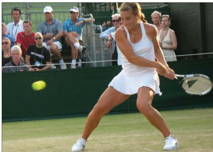
Babos Tímea következő ellenfele várhatóan Cristina Dinu lesz

A párosoknál a Horia Tecău – Robert Lindstedt román-svéd duó 6-7 (7), 6-3, 3-6 arányban alulmaradt az Eduardo Schwank Horacio Zeballos argentin kettőssel szemben, s a nyolcaddöntőben búcsúzott a Monica Niculescu, Shahar Peer román-izraeli duó is: 7-6 (9), 1-6, 2-6 az első helyen kiemelt Gisela Dulko-Flavia Pennetta argentin-olasz párossal szemben. Mindkét vesztes páros 25 ezer dolláron osztozik. ◀