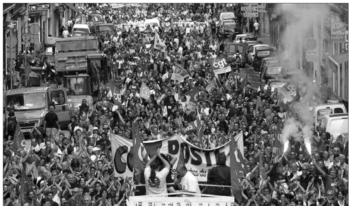
Délután Párizsban szórítottak sok százezer embert utcára a szakszervezetek

hogy a sztrájkok miatt a kormány nem változtat szándékán. A kabinet több tagja is jelezte, hogy kisebb módosítások lehetségesek (például a fizikailag nagyon megterhelő munkát végző vagy a munkát fiatal korukban kezdők esetében), de a nyugdíjreform alapelvei megmaradnak. Szakértők szerint bármilyen sokan vonultak is utcára, nem valószínű, hogy a szakszervezetek képesek lennének egy olyan sztrájk megszervezésére, amely visszazokozna kényszerítene a kormányt.