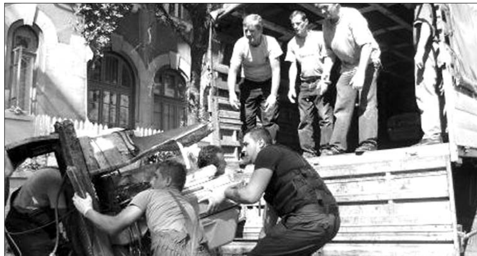
A tűzvész után több tucat csecsemőt menekítettek ki a fővárosi szülészetről

szabadlábban védekezhetnek. A letartóztatott asszisztensnő mellett nyílt levélben foglaltak állást kollégái, akik arra hívták fel a figyelmet: az érintett több mint egy évtizede sikerrel, lelkiismeretesen végezte a munkáját, a baleset idején pedig szabályellenesen, egyedül teljesített szolgálatot. A levélírók szerint az intenzív osztályon kezelt csecsemőket a gyanúsított nem azért hagyta magára, mert elhanyagolta munkaköri kötelességeit, hanem azért, mert túlterhelt volt. ◀