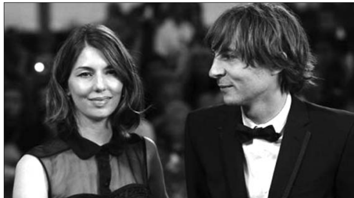
Sofia Coppola apjai nyomdokaiba lépett Velencében

játszik a párbeszédnek nélküli filmben. A színésznők között Ariane Labed, az Attenberg címet viselő görög film főszereplője kapta a Coppa Volpi (Volpi Kupát) a zsűri ítélete szerint. A zsűri különdíjjal jutalmazta Jerzy Skolimowski Essential Killing című munkáját. Sofia Coppola győztes filmjéről Quentin Tarantino elmondta, hogy az már a kezdetektől fogva lenyűgözte a zsűri tagjait. A díjnyertes rendező filmje az élete ürességével küzdő színész történetét mutatja be. Coppola úgy jellemezte alkotását, mint „napjaink Los Angelesének portréját”. A film főszerepét Stephen Dorff játssza. ◀