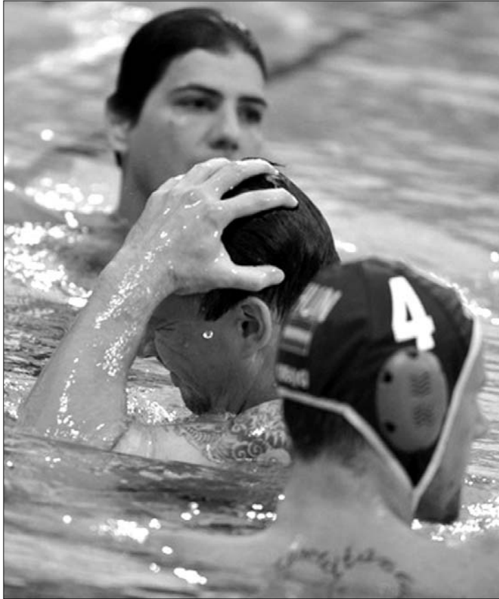
Biros foga a fejét. Másodszor már nem ment a szerbekkel

A bronzmeccsen a szerbek visszavágtak a csoportküzdelmek során elszenvedett vereségért (6-9) és 10-8-ra nyertek. Kis, Varga