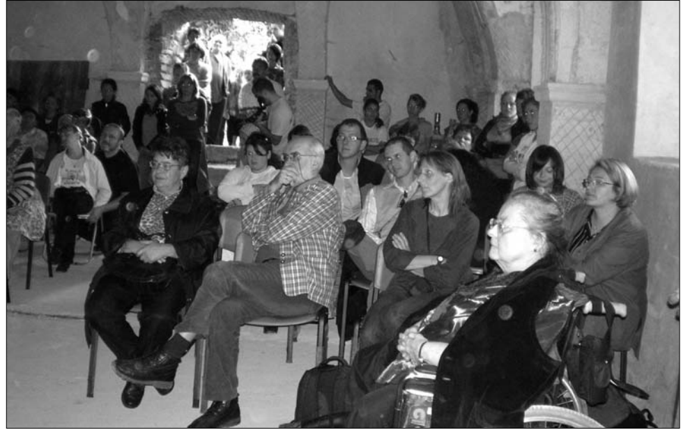
Kellemes meglepetés volt a szervezők számára a nagyszámú érdeklődő