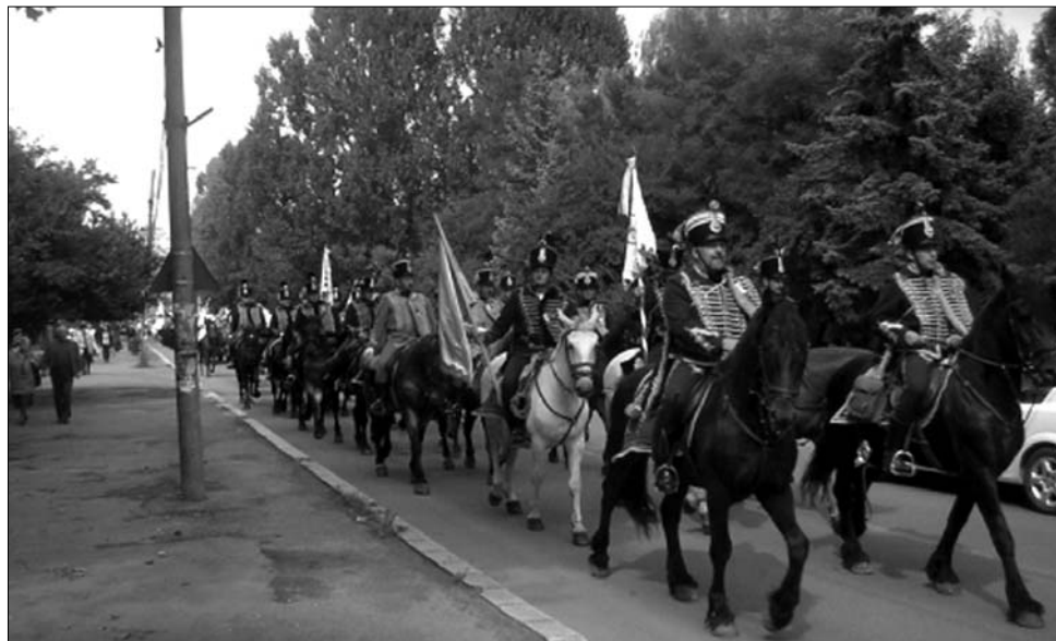
A lovas felvonulás a vasútállomástól indult és végighaladt a Kossuth Lajos utcán