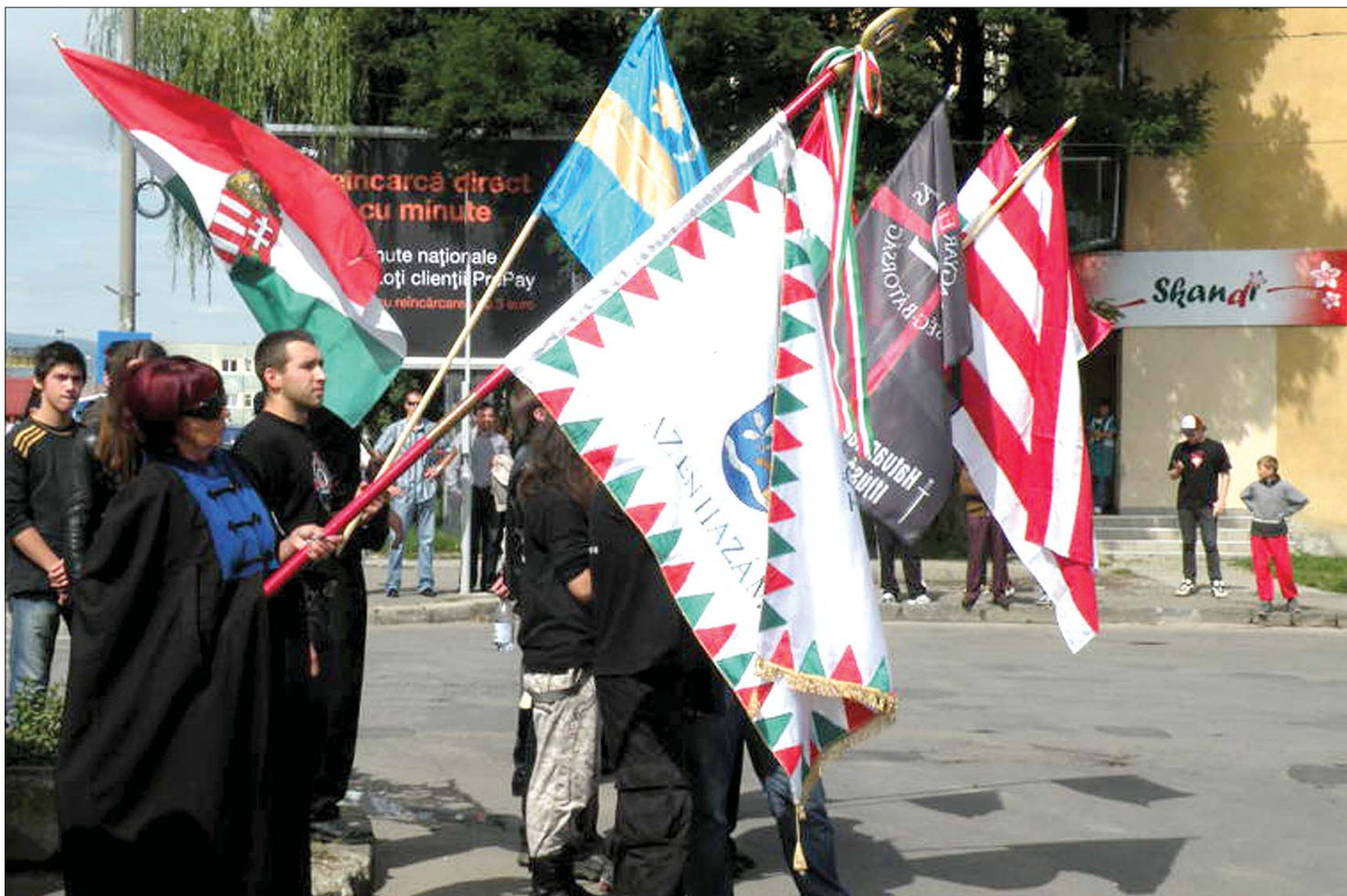
A Hatvannégy Vármegye Mozgalom a csíkszeredai polgármester engedélyével és részvételével tartotta meg a megemlékezést

Észak-Erdély visszacsatolására emlékeztek a városvezetés részvételével