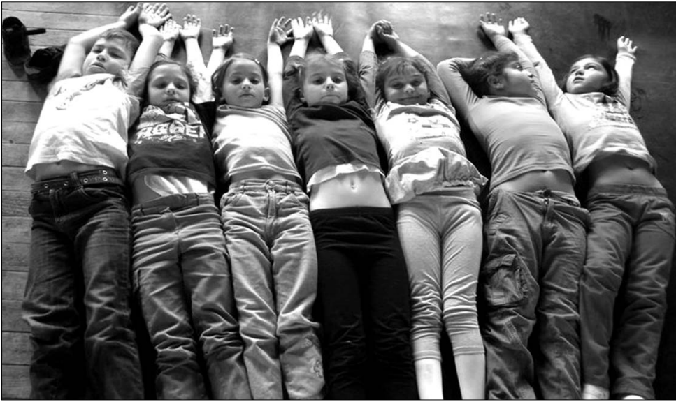
Az együttélést is tanulták a különböző etnikumú gyerekek