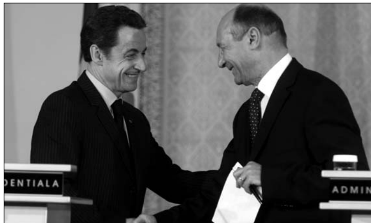
Sarkozy és Băsescu legközelebb Párizsban találkoznak

lásügyi miniszter abban állapodott meg vendéglátóival: készek együttműködni a romák helyzetének rendezése érdekében. Franciaország „sürgősségi nemzeti terv” kidolgozását kéri Romániától, amely viszont nagyobb fokú európai támogatást vár szociális programjaihoz, elutasítva a diszkrimináció elvét a „kollektív” kitoloncolásokat illetően. A kitoloncolásokat a hétfőn bírálta az Amnesty International is. A nemzetközi jogvédő szervezet arra szólította fel a francia kormányt, hogy tegyen eleget az Európai Parlament követelésének, és veszen véget a romákkal szembeni diszkriminációnak.