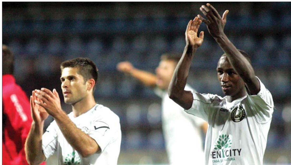
Amire senki sem számított: megdöbbenésük saját teljesítményükét az Urziceni játékosai

Lapzárta után Astra Ploiești–Temesvári FC- és Brassói FC–Dinamo-találkozókat rendeztek, ma pedig két mérkőzéssel zárul a forduló. Szakszövetségi közbenjárás nyomán a Pandurii Târgu Jiu–Universitatea Craiova mérkőzésre végül is sor kerül, miután megoldást találtak a Dinamo iránti, félmillió eurós adósság törlesztésére. Szintén ma, az FC Vaslui–Oțelul Galați-mérkőzésről a GSP TV számol be élőben, 18 órai kezdettel. ◀