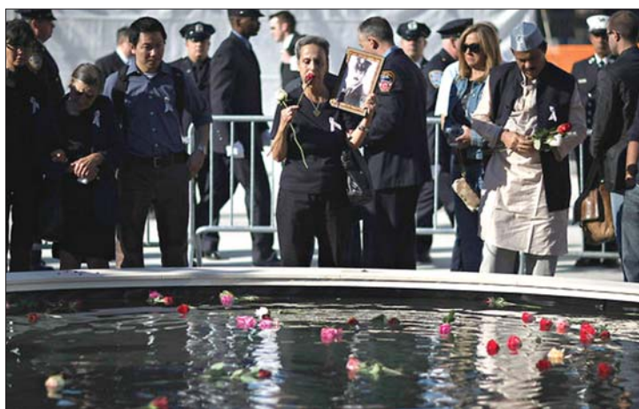
Virágok az áldozatok emlékére a Ground Zerónál

▶ Amerikát nem egy vallás támadta meg kilenc évvel ezelőtt – jelentette ki Barack Obama amerikai elnök a 2001. szeptember 11-i terrortámadás évfordulóján tartott megemlékezésen. Eközben több százan tüntettek a Ground Zero közelében felépítendő iszlám közösségi központ mellett és ellen. 2. oldal ▶