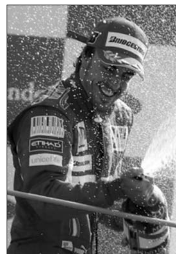
Fernando Alonso ünnepel

A kerékcserék csak a 36. körben kezdődtek meg, Button az élről a 37.-ben járt a boxutcában és ezzel Alonso került az első pozícióba. A spanyol csak egy körrel később cserélt kereket és a remekbe sikeredett boxkiállással, valamint hajmeresztő előzésnek kö-