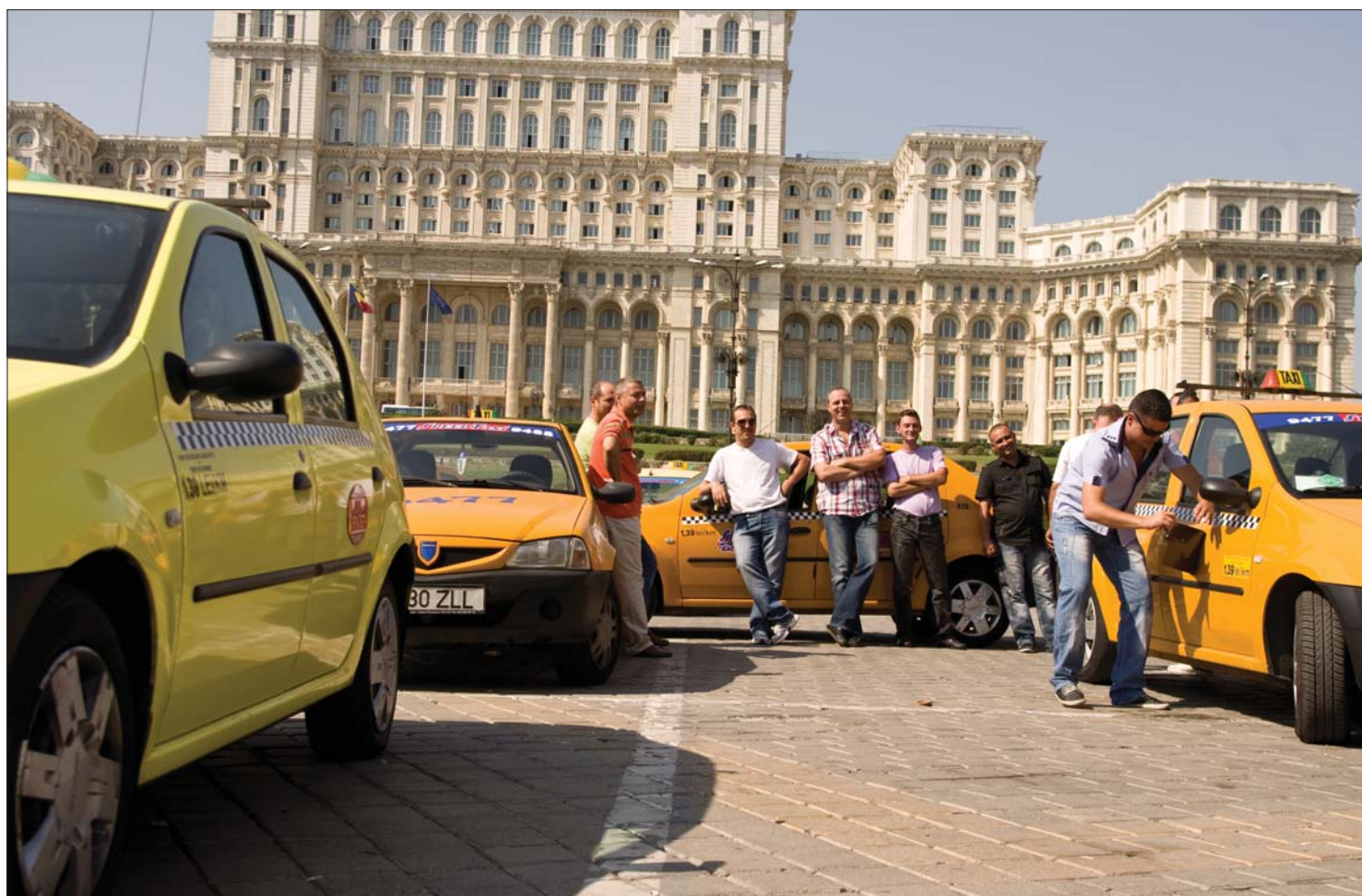
Tegnap ottjártunkkor a parlament bukaresti épülete előtt néhány száz hivatásos gépkocsivezető tüntetett, a beharangozott ezrek helyett

A béradók növelése és visszamenőleges behajtása ellen tiltakoznak a hazai taxisok