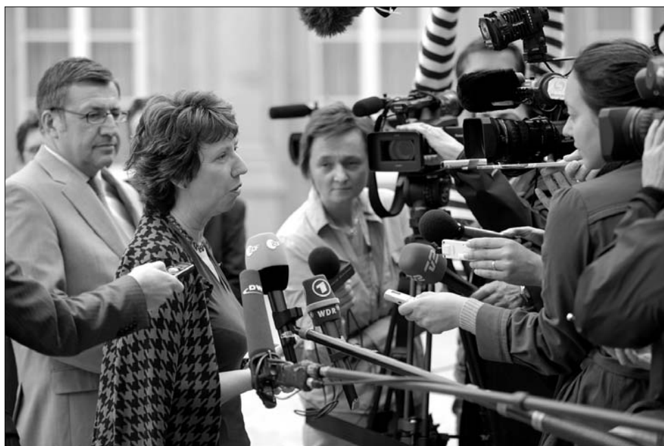
Lady Ashton, az EU külügyminisztere a külügyi tárcavezetők mai uniós csúcsot előkészítő értekezletén

A mai csúcserkeztetel perze egyé szempontból is érdekes lehet a mi térségünkben, jelesül azért, mert január 1-jén Magyarország veszi át fél esztendőre a soros elnökséget. Érdemes a belgák belpolitikai helyzetét azért is górcső alá vennünk, mert a korábbi magyar külügyminiszter, jelenleg szocialista euroképviselő, Göncz Kinga nemcsak a kormánypárti, hanem a baloldali elveket valló magyar sajtó tálalásában is érdekes kijelentést tett az elmúlt hét végén. Szerinte „informális beszélgetéseken Brüsszelben már felmerült, hogy Orbán Viktor és Magyarország ezzel a kormányfővel alkalmas-e az Európai Unió soros elnöki tisztének