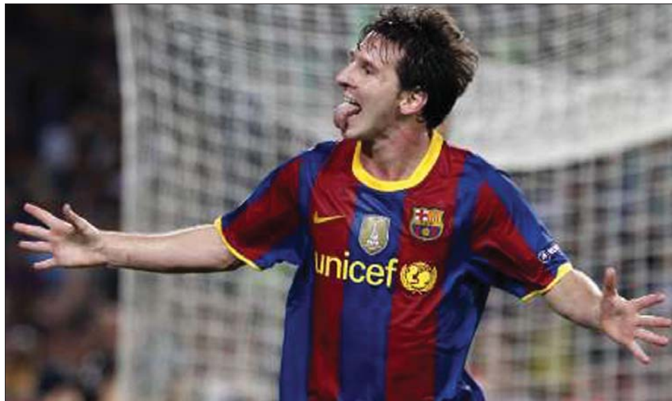
Messi-gólorom. Nyelvet öltött a görög Panathinaikoszra a Barcelona argentin kiválósága

A kvartett másik mérkőzésén három perc választotta el a vendégeket a pontszerzéstől, de a dán FC København végül 1-0-ra legyőzte az orosz Rubin Kazanyt. A Koppenhágában rendezett találkozó egyetlen gólját N'Doye szerezte a 87. percben. ◀