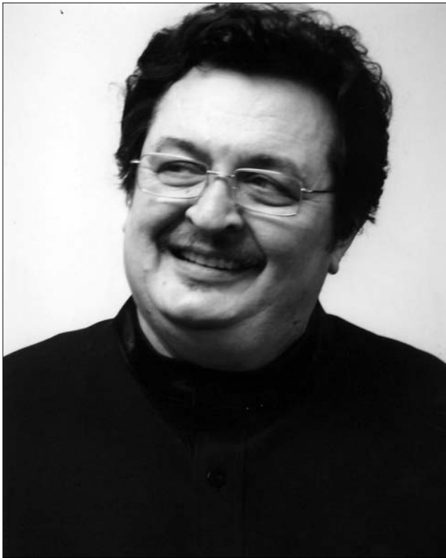
Fátyol Rudolf hegedűművész, a szatmári filharmonia igazgatója

Nagyszerű nyugati koncertkörútról tért haza a napokban a Szatmárnémeti Filharmonia, többek között Párizsban, Brüsszelben és Düsseldorfban adtak hangversenyt. Volt olyan fellépésük is, amelyen húszeszes közönségnek zenéltek. Fátyol Rudolfot, az Európa-szerzte ismert hegedűművészt, az intézet főigazgatóját kellemes hír várta itthon: további öt évre meghosszabbították főmenedzseri megbízatását a Szatmárnémeti Dinu Lipatti Filharmonia-ával! „Ám sem ezt, sem pedig a nyugati koncerteken kapott tapsokat nincs idő ünnepelni, mert máris kezdődik az új szatmári zenei