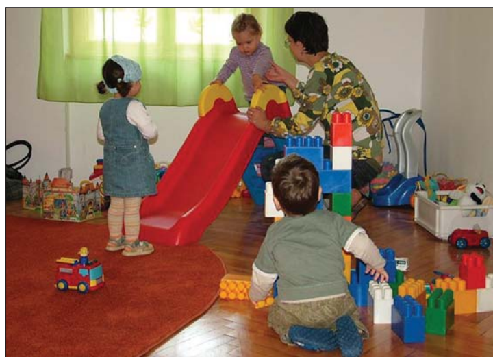
Kolozsvári premier. Az első magyar bölcsőde nyílt meg a kincses városban

▶ Az unitárius egyház támogatásával és közreműködésével nyitotta meg kapuit az első kolozsvári magyar bölcsőde. Az intézményalapítás hiánypótló: a helyi szülők évek óta küzdenek az alapellátásért. Egyelőre harminc gyerek helye biztosított. 7. oldal ▶