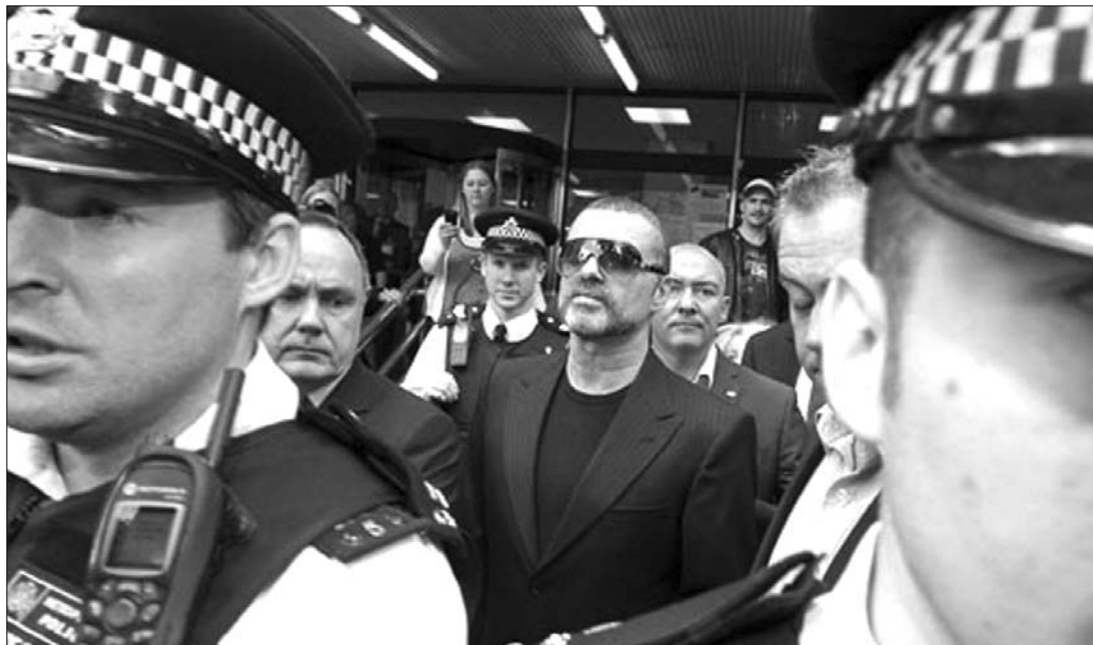
George Michael popzene-énekes nyolchetes börtönbüntetést kapott legújabb törvénytelen tettéért

A görög származású 47 éves énekes világsztár – akinek eredeti neve Georgios-Kyriacos Panayiotou – július 4-én Range Rover terepjárójával hajtott be az előkelő észak-londoni Hampstead kerület egyik fotószaküzletébe. A kitérő rendőrök kiütött állapotban találták a Wham! popduó egykori tagját, zsebében cannabiszal fűszerezett cigarettákkal. A művész azonnal elismerte, hogy marihuánát szívott és nyugtató hatású szerek is bevett, mielőtt a volán mögé ült. Az énekesnek korántsem ez az első hasonló jellegű találkozója a törvénnyel. Három éve száz órányi közmunkára ítélték és két évre eltiltották a járművezetéstől, miután szintén erősen befolyásolt állapotban húzták ki Mercedeséből London egyik forgalmas főútvon-