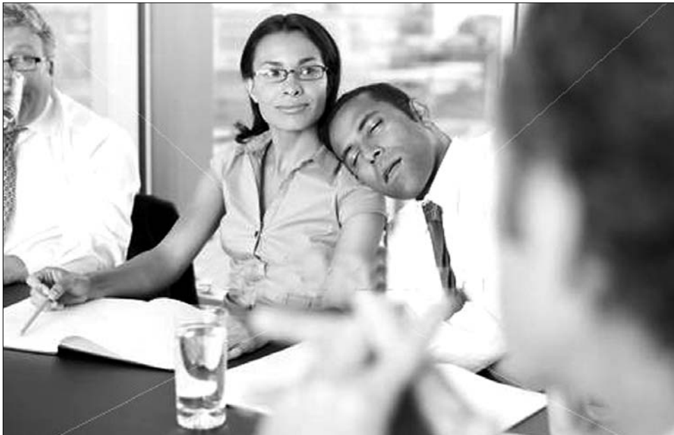
A munkaadók szerint az alkalmazottak számára túl kedvező törvények a versenyképességet is rontják

Az érdekvédelem három változtatást javasol a munkapiac törvényes kereteinek javítására, melyből az első az, hogy egyszerűsítsenek a munkaadók bejelentési kötelezettségein és az előírt számlázási gyakorlaton (ennek értelmében a jelenlegi kilencről egyre csökkenteni a havonta kitöltendő nyilatkozatok számát.) Reformot sürgetnek ugyanakkor a szociális hozzájárulások rendszerén belül is, kér-