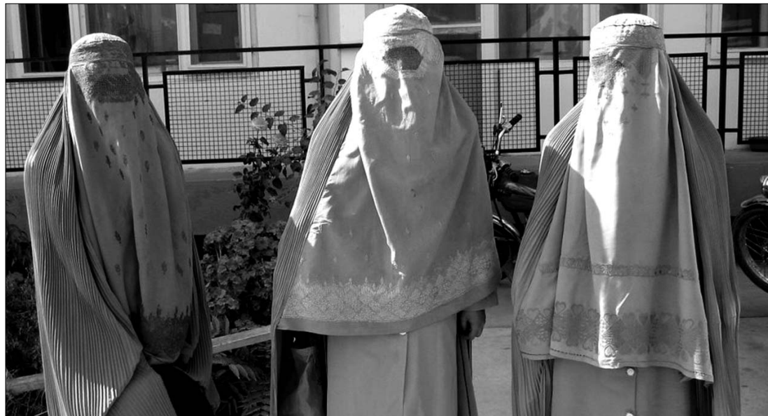
Az új franciaországi törvény megtiltja az arcot teljesen elfedő kendő, a nikáb és a burka viseletét