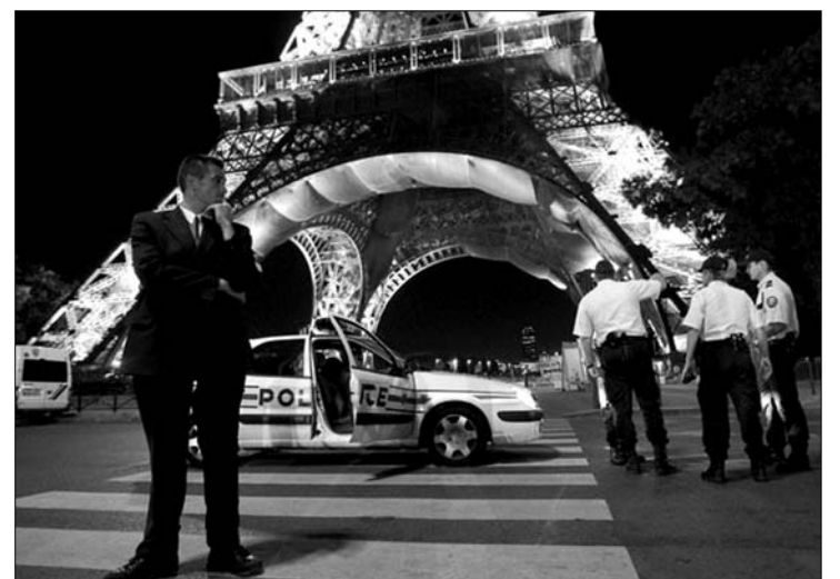
Mintegy 25 ezer látogató volt a párizsi nevezetességnél a bombariadó idején

környéken. A biztonsági övezet kijelölése után a turisták egy részét, mintegy ezer embert a Szajna rakpartjaira terelték, a többieket megpróbálták hátrébb szorítani a Mars-mezőn, megakadályozandó a kíváncsiskodók visszazárlingozását. A riadó után az Eiffel-torony közvetlen környéke továbbra is zárlat alatt állt, a szerkezet köre kordont vontak, és kutyás rendőrök vizsgálták át tüzetesen a területet, de bejelentésük szerint három órányi kutatás után sem találtak robbanószerkezetet az Eiffel-toronyban és a környékén sem. ◀