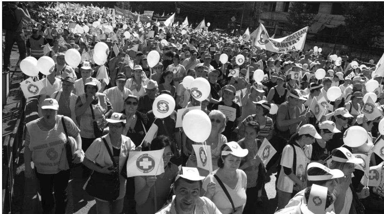
Itt még lufikkal dobálózta tojások helyett. A tiltakozószorozat a Sanitas egészségügyi szakszervezet kezdte a fővárosban

Az akció után több szakszervezeti tiltakozó arról beszélt: több társuk „a kormány passzivitása miatti dühében”