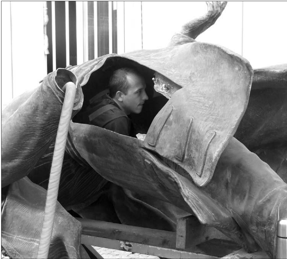
„Belső információkat” szereztek a restaurátorok a Mátyás-szoborcsoport helyzetéről

Ezen a tárgyaláson módosították a szerződés feltételeit is, a korábbi szerződés értelmében ha a Concefa nem fejezi be a megszabott határidőre a munkálatokat – ez a határidő 2010. július 22-e volt – , büntetést köteles fizetni minden késett nap után. Az alpolgármester elmondta: nem érdekük további anyagi gondokat ag-