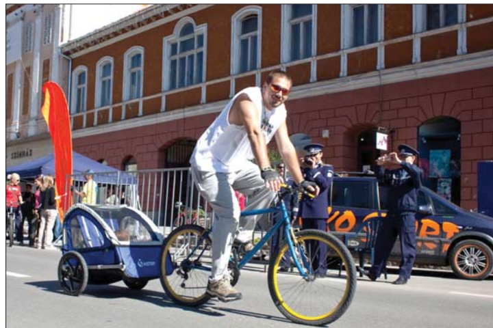
„Bringával autó helyett” – hirdették Sepsiszentgyörgyön

▶ Több ezren pattantak tegnap kerékpárra Erdély-szerte az európai autómentes napon. Sepsiszentgyörgy központjában néhány órára a gépkocsik helyét biciklisek, gyalogosok, görkorcsolyások és gördeszkások vették át, így üzentek hadat a kipufogókból áradó füstnek. 7. oldal ▶