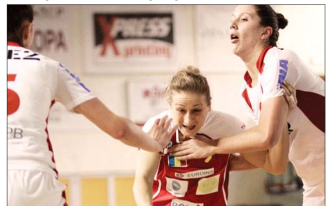
A román kézilabdás lányok „kitörték” az orosz harapófogóból

Ma Románia-Svédország (15 órától), Franciaország-Magyarország (17 ó), Oroszország-Norvégia (19 ó), Dánia-Németország (21 ó) menetrend szerint bonyolítják le az utolsó csoportfordulót, pénteken pihennek a csapatok, s szombaton csak a legjobb négy folytathatja. A kvartettek első két helyezettei keresztkézen játszanak a döntőbe jutásért, vasárnap kis- és nagydöntőt. Tavaly Románia nyerte a Világkupát, miután legyőzte Norvégiát. ◀