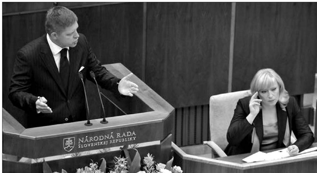
„Mi bajod a törvényemmel?” – Robert Fico és Iveta Radicová a pozsonyi parlamentben

A Robert Fico által keresztülvitt jogszabály-módosítás válasz volt a határon túli magyarok magyar állampolgárságát megkönynyító budapesti lépésre. ◀