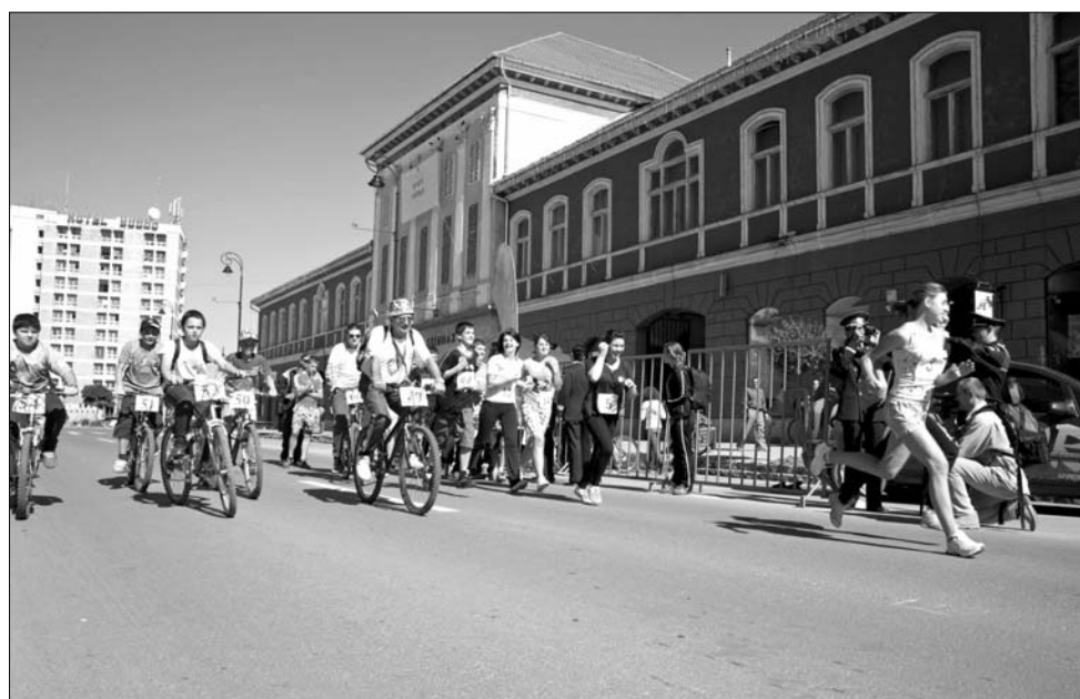
Ki két lábon, ki két keréken vett részt Sepsiszentgyörgyön a figyelemfelkeltő akcióban