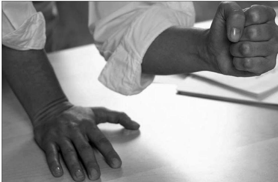
Bár megegyezésben reménykednek, az elégedetlen kliensek pénzt és energiát sem sajnálva küzdenek

Mint megtudtuk, az elégedetlenek csoportjai nemcsak pénzügyi intézeteként, hanem panasz-típusonként is vál-