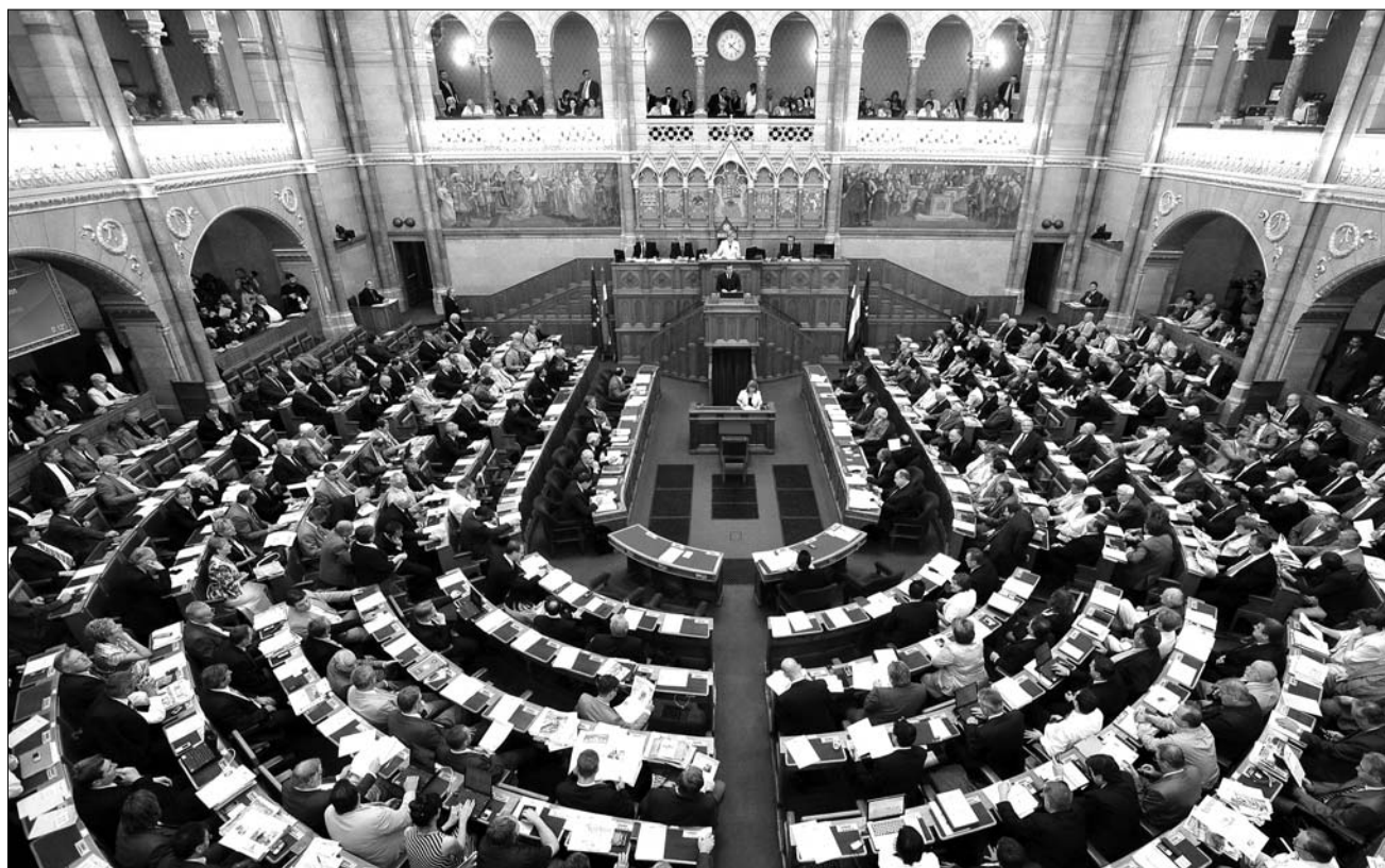
A magyar Országgyűlés – a kettős állampolgárság „laboratóriuma”