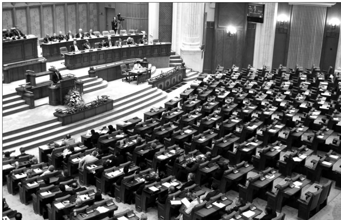
Traian Bănescu államfő izelítőt kapott abból, hogy milyen amikor az ellenzék nincs a tereben

közötti titkos tárgyalások rutinszerűek a parlamentben, és általában arra vonatkoznak, hogy az ellenzék ne éljen vissza a parlamenti procedúrák adta lehetőségeivel a törvényhozási munka hátráltatása céljából. „Láttam valaha olyan tolvajt, aki azonnal elismeri tettét? A PSD tagadja, de nekünk megtámadhatatlan bizonyítékaink vannak azzal kapcsolatban, hogy 127 milliárd lejt kértek azért, hogy kivonuljanak a plénumból” – fogalmazott Oltean. Hozzátette: a tárgyalások általában a frakcióvezetők között zajlanak, de a pártelnökök beleegyezésével, ezért nem hiszi el Victor Pontának, hogy nem tudott az alkuról. ◀